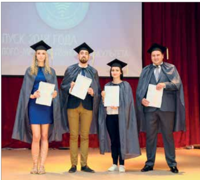
Аспиранты-выпускники эколого-мелиоративного факультета