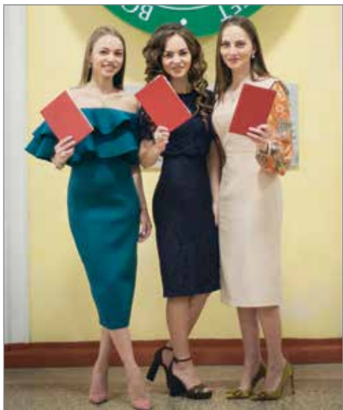
Мы это сделали!

В Волгоградском государственном аграрном университете торжественные вручения дипломов прошли на всех факультетах. Чем запомнится Выпуск-2018 – в нашем обзорном материале.