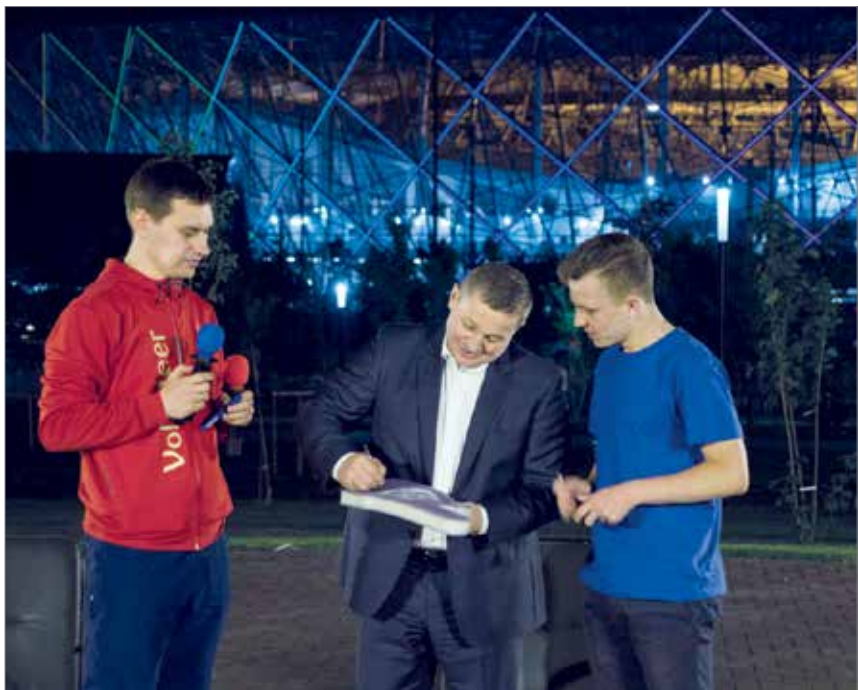
Автограф на память

Губернатор Андрей Бочаров провел встречу с волонтерами региона. Ее темами стали участие молодежи в развитии области, проведение матчей мирового футбольного первенства, создание новой современной инфраструктуры, которой будут пользоваться многие поколения волгоградцев. В разговоре приняли участие и добровольцы Волгоградского государственного аграрного университета – на Чемпионате мира по футболу FIFA 2018™ они выполняют функции городских волонтеров.