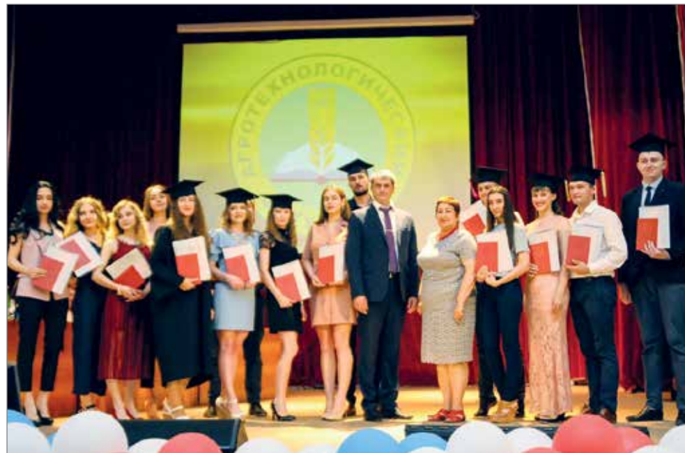
Отличники агротехнологического факультета

– Хочу от всего коллектива поздравить вас с сегодняшним праздником, – сказала