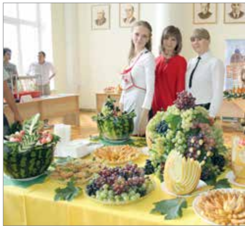
Красота руками студентов ВолГАУ

Авторский коллектив Волгоградского ГАУ награжден золотой медалью Всероссийского смотра-конкурса лучших пищевых продуктов, продовольственного сырья и инновационных разработок России за уникальную разработку «Халва нутовая». Экспертное жюри высоко оценило ценные свойства лакомства, родившегося в лабораториях факультета «Перерабатывающие технологии и товароведение». Нутовая халва богата питательными веществами, не содержит глютен и намного полезнее привычных сладостей, в которых натуральных ингредиентов еще поискать.