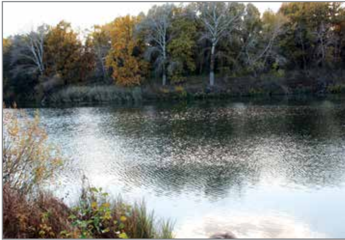
Нет ближе родной земли

О хлебе сложено много стихов и песен, сказок и легенд, хлебу посвящали гимны, открывали в честь него музеи, устраивали праздники. И свое сочинение я хочу посвятить людям, которые выращивают хлеб. Имя им – ХЛЕБОРОБЫ!