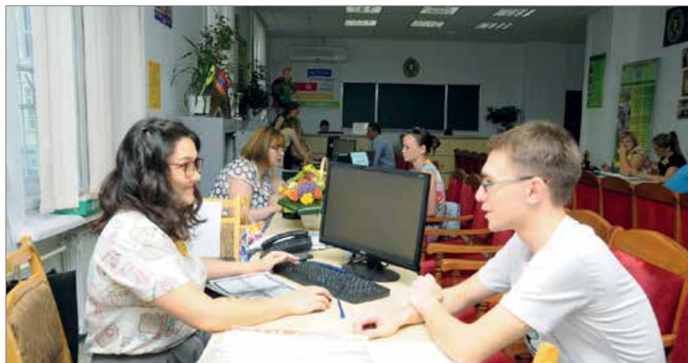
ВолГАУ – один из крупнейших образовательных центров России

В первый день приемной кампании количество поступивших оригиналов оказалось в два раза больше копий. В лидерах ветеринария, зоотехния, землеустройство и кадастры, агроинженерия. Хорошую активность проявили желающие поступить в магистратуру. Среди будущих магистрантов больше всего документов на агрономии, садоводстве, агрохимии и агропочвоведении, природообустройстве и водопользовании. Не отстают и абитуриенты Института непрерывного образования ВолГАУ. По информации приемной комиссии, 20 июня были поданы документы практически на все специальности ИНО. Всего в 2018 году в Волгоградском ГАУ запланировано более тысячи бюджетных мест для абитуриентов по программам