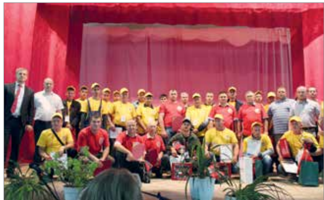
Участники, победители, судьи