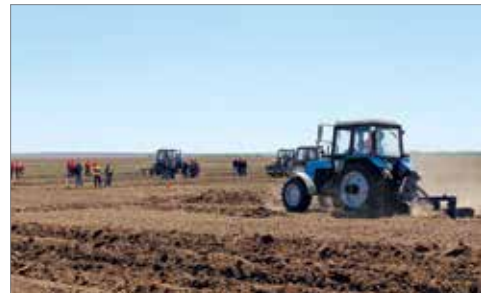
Самый важный труд