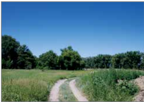
Дороги, которые мы выбираем

Почему-то в нашей огромной и прекрасной стране перестали заботиться о деревнях, полях,