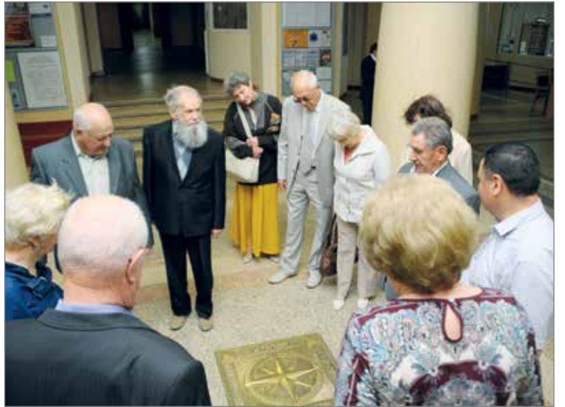
Ты помнишь, как все начиналось?

Считаю, что задел для такой насыщенной жизни дал институт. У нас была очень серьезная подготовка, нам давали хорошую базу, готовили инженеров высочайшего уровня. И я до сих пор работаю и являюсь востребованным специалистом.