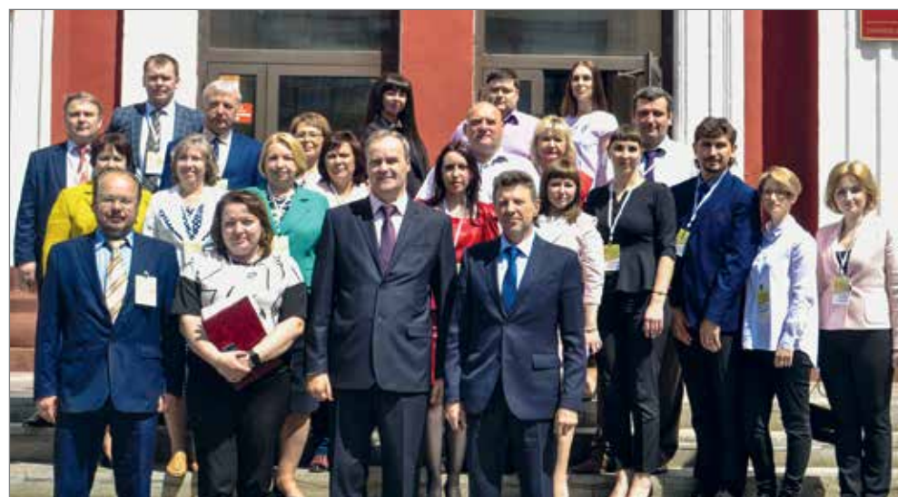
Участники семинара-совещания проректоров по воспитательной работе аграрных вузов России

В своем выступлении я предложила провести обучение координаторов волонтерского движения в рамках IV Всероссийского слета на базе Волгоградского ГАУ. Мы гото-