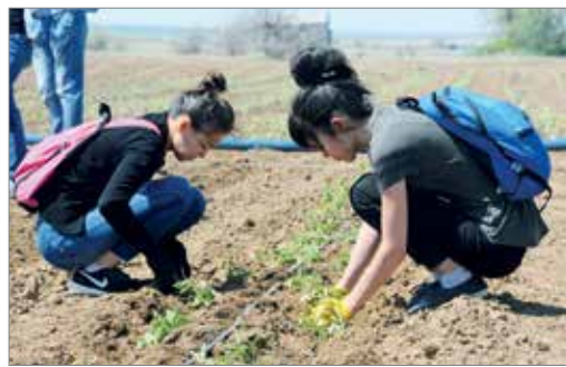
Бесна. Высадка томатов