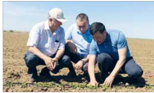
На хлопковом поле

дем передавать заинтересовавшимся фермерам. А наш хлопок уже сажают не только волгоградские аграрии, но и некоторые сельхозпроизводители из соседних регионов. По остальным культурам есть неплохой задел, будем продолжать работать.