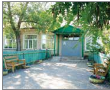
Школа и ее ученики