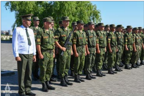
Клятву на верность Родине дали 137 курсантов