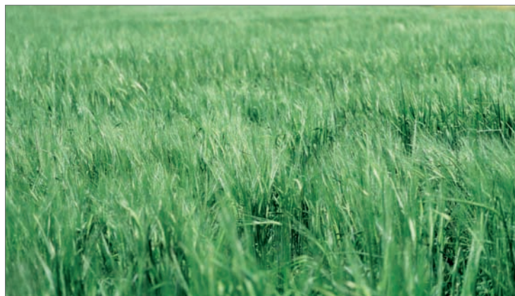
Участок зерновых в УНПЦ «Горная поляна» в 2020 году

Новое направление для ВолГАУ – лекарственные травы. Данная работа ведется совместно с Волгоградским медицинским университетом и с Иранским аграрным университетом г. Сари в рамках межгосударственной программы, утвержденной правительствами России и Ирана. Сегодня на экологическом испытании находится 26 лекарственных трав: оценивается, насколько они могут быть адаптивны к условиям Нижнего Поволжья.