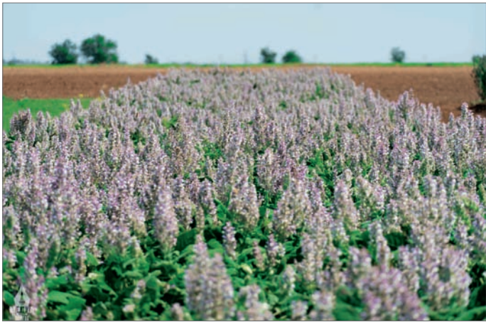
В этом году на экологическом испытании находится 26 лекарственных трав

В 2019 году начались экологическое испытание плодовых и ягодных культур, включая различные сорта яблони, абрикосов, черешни, вишни, малины, земляники.