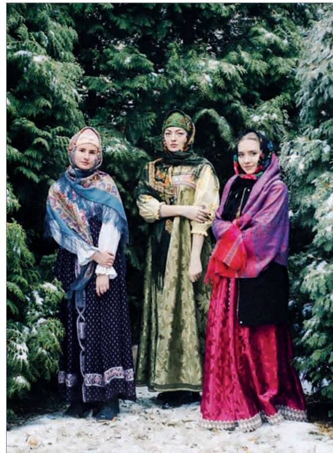
Фотосессия студенток ВолГАУ по тематике «Русская краса»

Постоянно смотрю исторические фильмы и различные ролики по развитию интеллекта. Каждое утро делаю зарядку – а до карантина я не успевал. Это очень полезно для здоровья и дает хороший заряд бодрости на весь день.