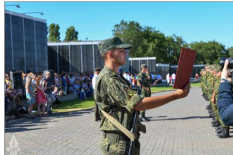
Принятие присяги – самый важный момент в жизни каждого солдата