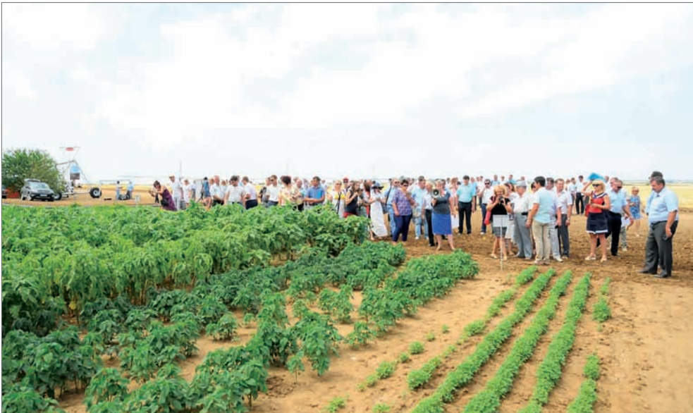
На день поля «Волжская нива» съезжаются аграрии со всего региона