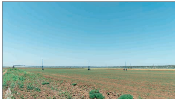
В инновационной деревне создан мелиоративный полигон по испытанию дождевальной техники

Здесь представлены зерновые и зернобобовые культуры. Отечественные, в том числе и волгоградские, селекционеры создали сорта сои, нута, ячменя, озимой пшеницы,