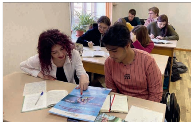
Иностранные студенты на занятиях в ВолГАУ

Проект «Видение России: в поисках роли в меняющемся мире» был реализован при поддержке Комитета экономической политики и развития администрации Волгоградской области, Волгоградского областного отделения Русского географического общества, Волгоградской академии МВД РФ, Волгоградского государственного аграрного университета, Волгоградского государственного социально-педагогического университета, Волгоградского государственного технического университета, Волгоградского государственного медицинского университета.