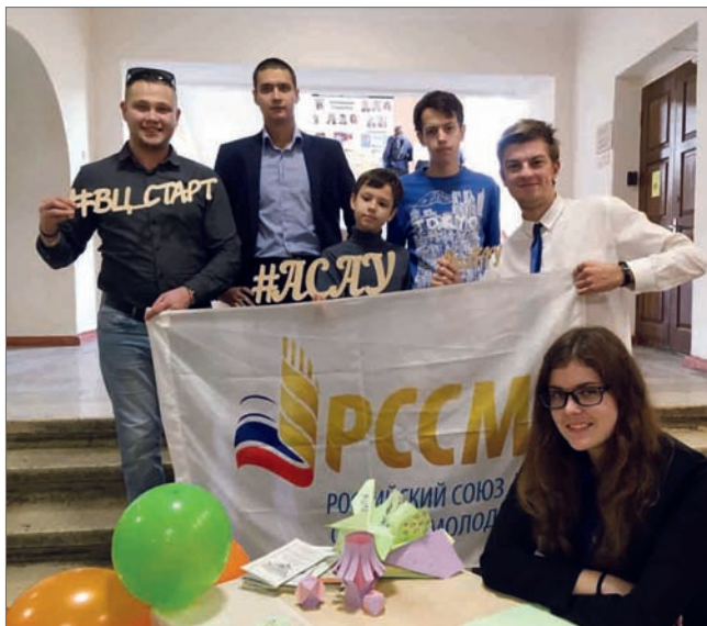
Студенты ВолГАУ скучают по своей веселой жизни в стенах университета

В свободное время читаю книги. Также пишу свою по серии игр «S.T.A.L.K.E.R.». Занимаюсь саморазвитием. Спортом не занимаюсь, потому что здесь достаточно физических нагрузок. Сама работа – своего рода спорт. Тут и ходьба, и бег – в общем всё, чтобы держать себя в форме. Всем советую.