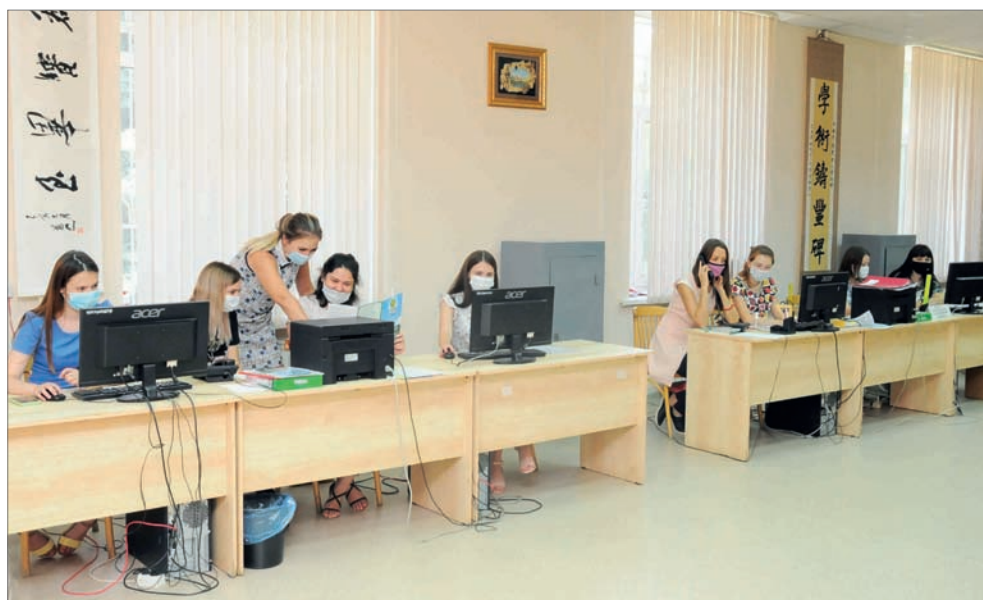
ПРИЕМНАЯ КАМПАНИЯ – 2020 В ВОЛГАУ СТАРТОВАЛА 19 ИЮНЯ

Во-первых, для подачи документов в Волгоградский государственный аграрный университет нет необходимости приходить в вуз. Более того, не следует это делать, так