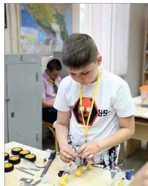
Региональный этап «АгроНТИ-2019» на базе Волгоградского ГАУ

Отметим, организатором мероприятия «АгроНТИ-2020» стал Фонд содействия инновациям совместно с некоммерческой организацией «Ассоциация образовательных учреждений АПК и рыболовства» при финансовой и информационной поддержке Департамента научно-технологической политики и образования и Департамента цифрового развития и управления государственными информационными ресурсами АПК Министерства сельского хозяйства Российской Федерации. Конкурс проходит в три этапа: заочный, региональный этап и финал.