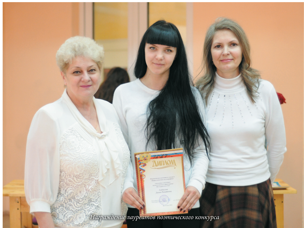
Награждение лауреатов поэтического конкурса

Лирика всегда становилась выразителем времени, откликом на его события и перемены, давала эмоциональные и вместе с тем содержательные оценки происходящему. Поэтому в стихах молодых поэтов университета воплотились черты духовного облика современного молодого человека, его восприятие жизни, нравственные и творческие поиски. Это хорошо видно на примерах поэтического самовыражения наших студентов.