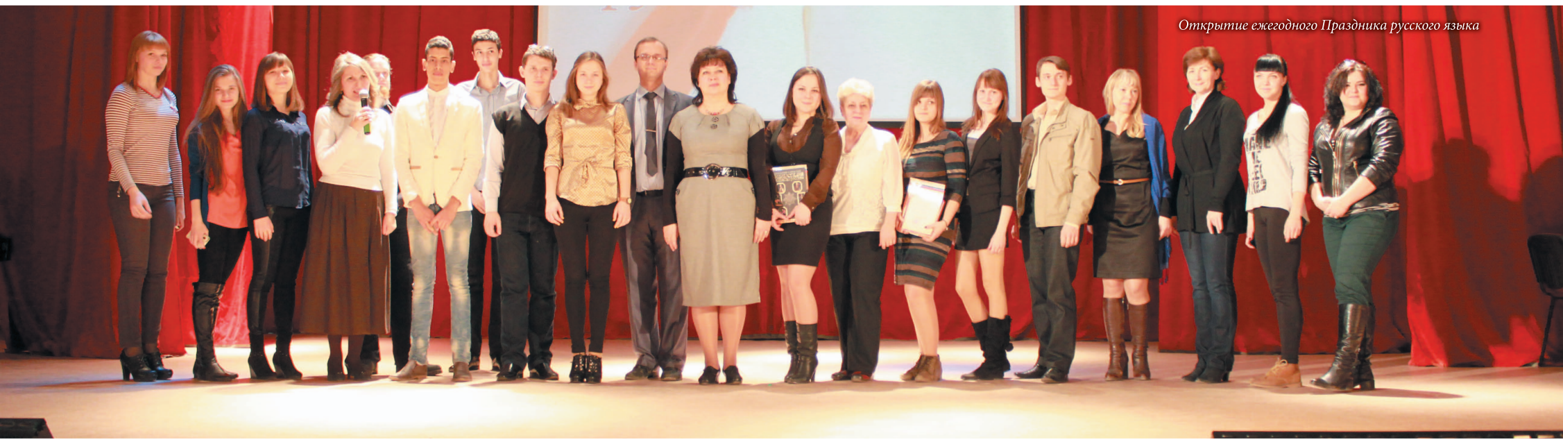
Открытие ежегодного Праздника русского языка

В заключение хочется отметить, что в Празднике русского языка приняли участие и ребята из Марокко, Египта и Германии, изучающие в нашем университете русский язык. Их прочувствованное чтение Пролога из поэмы А. С. Пушкина «Руслан и Людмила», вобравшего в себя множество сказочных сюжетов и персонажей, удивило и тронуло слушателей. И чудеса, и связанные с ними сказочные персонажи русского фольклора вдруг оказались для наших иностранных друзей понятными и любимыми.