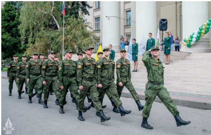
Военно-учебный центр ВолГАУ – единственный в регионе

Студенты факультета перерабатывающих технологий и товароведения – будущие технологи в области производства пищевых продуктов. Полученные знания и навыки позволяют успешно работать на предприятиях общественного питания, пищевой промышленности и в центрах по контролю качества продуктов. В перспективе: востребованность на рынке труда, высокий уровень зарплаты, авторитетные должности.