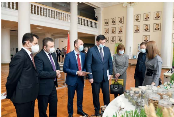
Научно-методическая конференция с международным участием «Инструменты развития кадрового потенциала АПК», май 2022 года

От всей души желаем вам счастья, крепкого здоровья, профессиональных успехов. Пусть удача будет верным спутником во всех начинаниях!