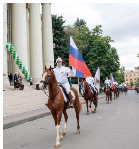
Учебно-консультационный конноспортивный центр «Добрыня» – гордость вуза

Ярким окончанием торжества стало исполнение молодежного гимна ВолГАУ, танцевальный флешмоб, фейерверк и запуск воздушных шаров в небо.