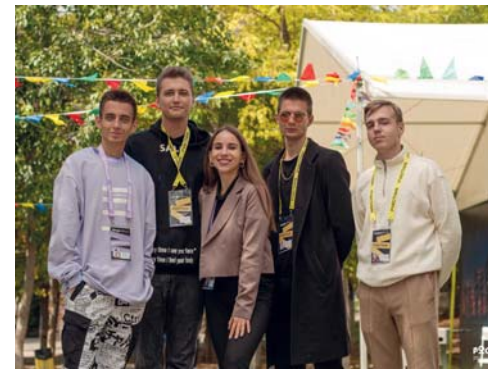
Команда ВолГАУ на форуме ЮФО «Ростов»

– Совсем скоро мы будем отмечать знаменательную дату – 80-летие Сталинградской битвы. Поэтому особое место отводится увековечению памяти сограждан, отдавших свои жизни, защищая Родину от фашистского нашествия, а также погибшим