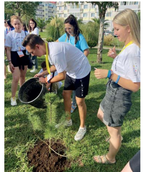
Участники форума заложили «Аллею юных лидеров Професионалитета»

В 2022 году программа «Професионалитет» объединила 150 тысяч студентов. 1 сентября в 42 регионах России первые 70 кластеров приступили к подготовке специалистов для железнодорожной, фармацевтической, химической отраслей, атомной и легкой промышленности, ме-