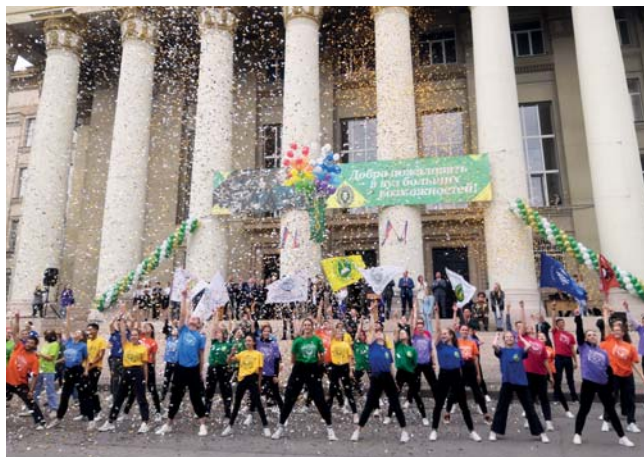
Танцевальный флешмоб – яркое окончание «Посвящения в студенты»

Одним из старейших учебных и научных центров Волгоградской области и Нижнего Поволжья является экономический факультет. Здесь обучают специалистов в области экономики, производственного менеджмента, бухгалтерского учета и экономической безопасности. Все они обладают высоким спросом на рынке труда и хорошими перспективами карьерного роста.