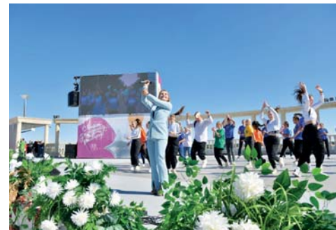
Студенты рассказали историю вуза

Отметим, амфитеатр, где проходил фестиваль «На фоне Волги», – уникальный объект, не имеющий аналогов во всем Поволжье, ближайший расположен в полутора тысячах километров – в крымском Херсонесе. Волгоградский «колизей», введенный на два тысячелетия позднее, имеет невероятный размах. Но главное, что он фактически вывел город к Волге.