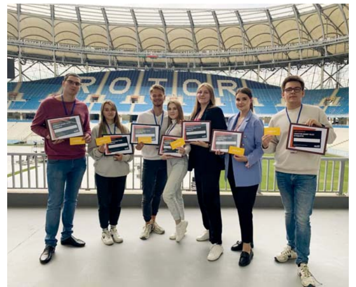
Победители интеллектуальной бизнес-игры

Завершилось мероприятие церемонией награждения победителей в тимбилдинге: