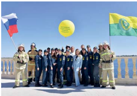
Участники фестиваля «На фоне Волги»

Главными героями 433-летия Волгограда стали его молодые жители: основная масса праздничных мероприятий на Центральной набережной была подготовлена для них. В новом амфитеатре с участием представителей одиннадцати учебных учреждений города-героя состоялся фестиваль «На фоне Волги». Блеснули талантами и студенты Волгоградского государственного аграрного университета.