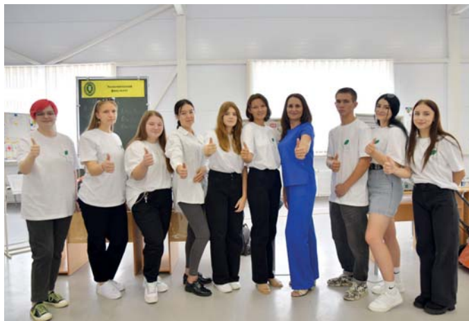
Первокурсники ФП «Профессионалитет»

Отметим, ВолГАУ – единственное высшее учебное заведение в Волгоградской области, ставшее победителем конкурсного отбора Минпросвещения России на открытие образовательно-производственного кластера для развития отрасли «Сельское хозяйство».