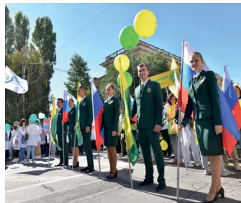
Активисты аграрного вуза во главе колонны

Активисты оказывают поддержку в реализации важных региональных проектов, в том числе проявляют гражданскую позицию, помогая беженцам и работая в пунктах гуманитарной помощи.