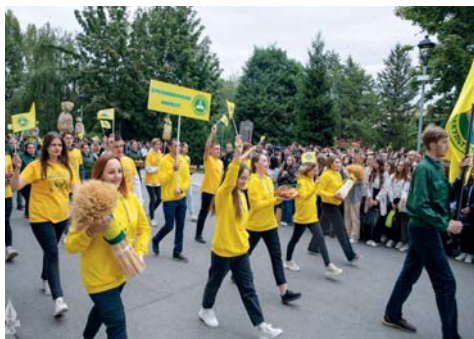
В колонне – студенты АГРОТЕХНОЛОГИЧЕСКОГО ФАКУЛЬТЕТА

В 2022 году первокурсниками одного из лучших аграрных вузов России – Волгоградского государственного аграрного университета – стали порядка трёх тысяч человек. Поздравить будущих аграриев с Днём знаний пришли руководители образовательного учреждения, региона, города-героя, предприятий-партнеров. Традиционно торжественное Посвящение в студенты украсил Парад факультетов Волгоградского ГАУ.