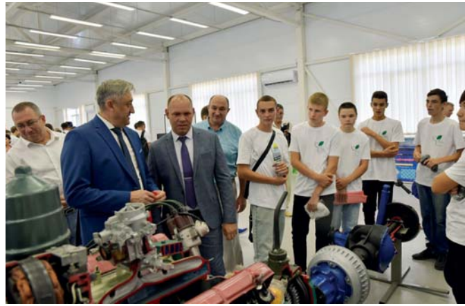
Гости вуза и студенты ознакомились с возможностями агрокластера