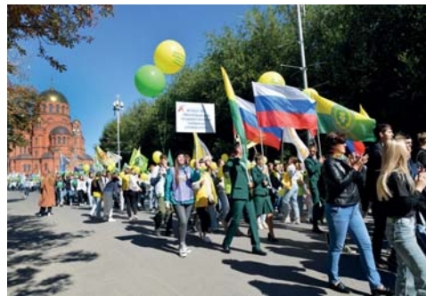
Студенты ВолГАУ – участники Парада первокурсников

Участниками праздничного парада стали более 8 тысяч первокурсников всех профессиональных образовательных организаций, расположенных в городе Волгограде – колледжей, техникумов и вузов. Шествие началось на площади Павших Борцов с возложения цветов к Вечному огню и завершилось на Центральной набережной.