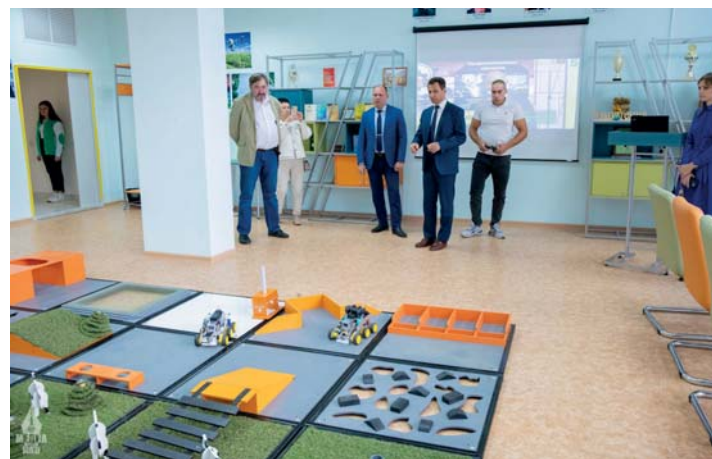
Гостям продемонстрировали «АгроМир будущего»