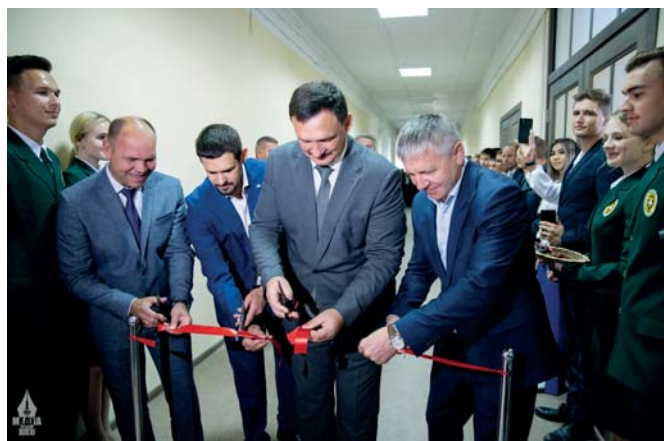
Торжественный момент открытия аудитории

Состоялась торжественная церемония открытия брендированной аудитории Петербургского тракторного завода и «ВолгоградАгроСнаб» – символический ключ партнеры вуза вручили в рамках реализации федерального проекта «Профессионалитет». Это стало новым этапом плодотворного сотрудничества между университетом и ведущими предприятиями агропромышленного комплекса России.