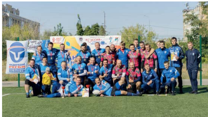
Открытый кубок по регби – 7 прошел на стадионе ВолГАУ

Обновленный состав команды, в которой наши первокурсники прошли боевое крещение первыми соревнованиями, показал характер и целеустремленность, что является хорошим заделом будущих успехов.