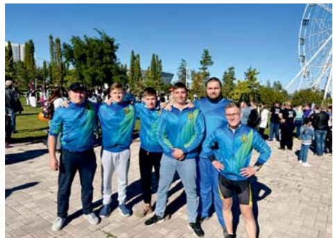
Спортсмены ВолГАУ – участники проекта «Россия в движении»