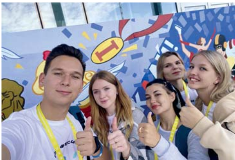
Представители ВолГАУ в федеральной команде

В рамках XVI Международного конгресса-выставки «Молодые профессионалы. Готовим кадры для экономического роста» проходил молодежный форум, в котором принимали участие команды «Амбассадоров Професионалитета» – 180 студентов и кураторов из 27 регионов России. Вместе со всеми постигали азы новой образовательной программы и студенты – амбассадоры Волгоградского ГАУ.