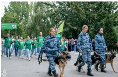
Кинологи возглавили шествие факультета биотехнологий и ветеринарной медицины

Стройными рядами перед участниками торжества прошли обучающиеся инженерно-технологического факультета – кузницы инженерных кадров для АПК. Замыкали колонну представители студотряда «Механик», которые проходят практику на полях нашей бескрайней Родины.