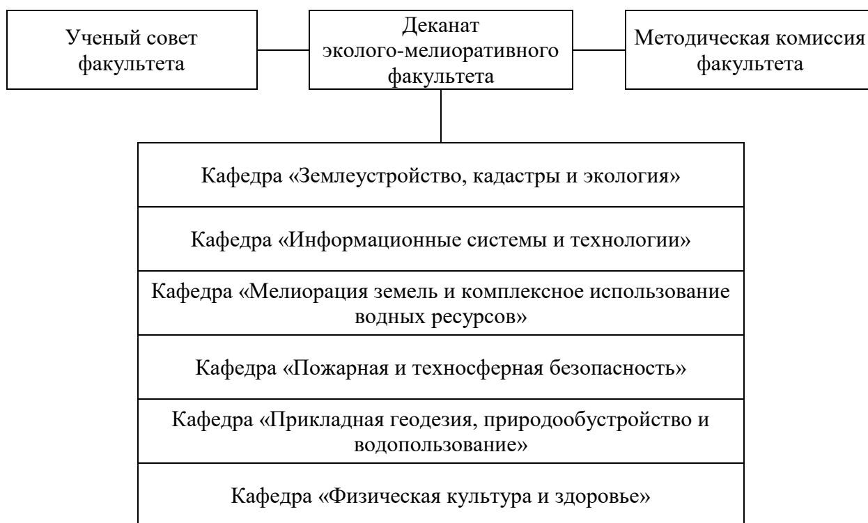
Рисунок 1 – Структура эколого-мелиоративного факультета ФГБОУ ВО Волгоградский ГАУ

Реализация образовательной программы высшего образования по направлению подготовки 05.04.06 Экология и природопользование направленность (профиль) «Экологическое сопровождение деятельности предприятий (экоконсалтинг)» (далее – образовательная программа) в ФГБОУ ВО Волгоградский ГАУ осуществляется с 2023 года. Подготовка ведется на эколого-мелиоративном факультете ( https://volgau.ru/obrazovanie/fakultety-i-kafedry/ekologo-meliorativnyu-fakultet/ ) (рисунок 1).