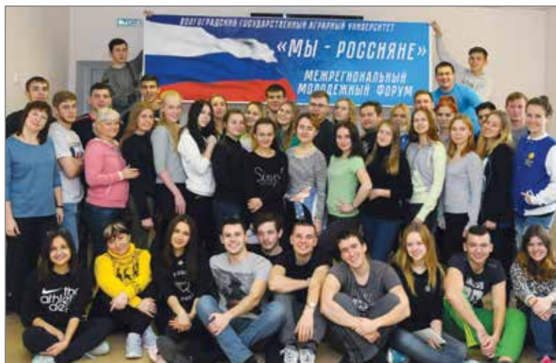
Участники межрегионального патриотического форума «Мы – россияне»