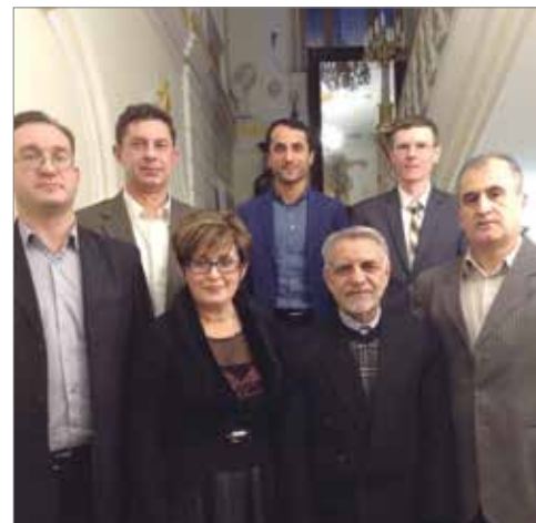
Представители волгоградских вузов и советники Посольства на встрече в Москве

– В настоящее время ректор Волгоградского государственного аграрного университета направил официальное письмо чрезвычайному и полномочному послу Исламской Республики Иран в Российской Федерации господину Мехди Санаи. Алексей Семенович обозначил в нем три наиболее перспективных вектора сотрудничества: