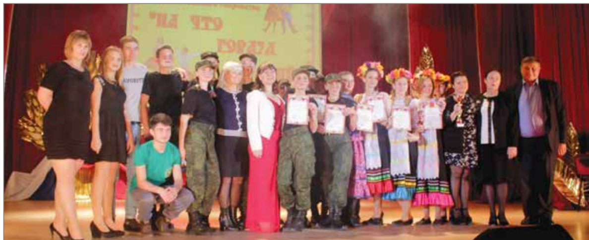
Участники гала-концерта с призами и грамотами

По традиции конкурс включал в себя три направления: «Музыка», «Хореография» и «Театральное направление». К «Хореографии» в этом году прибавилась номинация