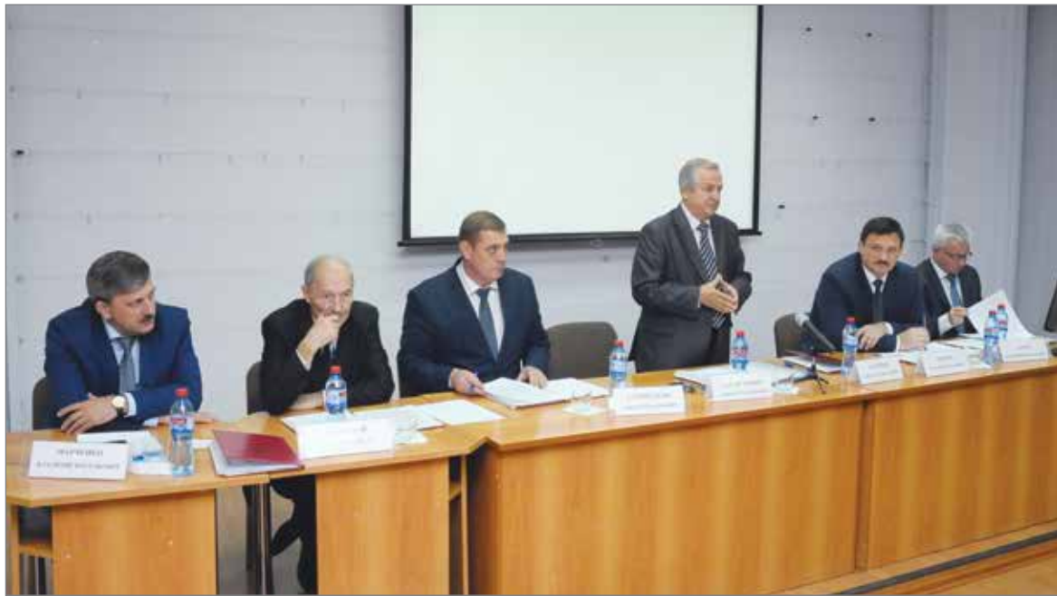
Попечительский совет принял решение о создании ассоциации выпускников

За свою многолетнюю историю Волгоградский ГАУ подготовил более 60 тысяч специалистов-аграриев. Коллектив вуза гордится ими и старается со всеми поддерживать деловые и дружеские отношения. А выпускники отвечают родной альма-матер взаимностью. Председатель Государственной Думы первого созыва Иван Рыбкин годы спустя не утратил связи с университетом. Он радуется успехам Волгоградского ГАУ и поддерживает новые начинания