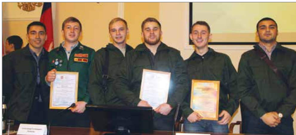
Студотряд «Зооветеринар» — лучший сельскохозяйственный отряд региона