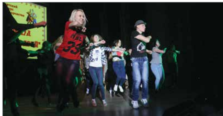
В 2016 году в смотре-конкурсе появилась номинация «Танцевальное массовое шоу»

– Мы – дружный сплоченный коллектив, поэтому были настроены завоевать первое место. Наш факультет представил самые разнообразные, смелые и творческие номера. Одним из самых ярких и запоминающихся получился импровизированный танец «Армия». Наши соперники оказались не менее подготовленными: у них были очень интересные и хорошо поставленные выступления. Борьба за первое ме-