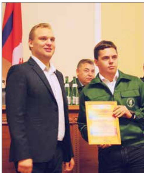
Серебро в номинации «Лучший сельскохозяйственный отряд» завоевал «Колос» Волгоградского ГАУ

13 декабря в Администрации Волгоградской области прошло торжественное подведение итогов областного смотра-конкурса на лучшую организацию работы студенческих отрядов в III трудовом семестре 2016 года. 37 представителей студенческих отрядов Волгоградской области отмечены почетными грамотами и ценными призами. Лучшим сельскохозяйственным отрядом признан студотряд «Зооветеринар» Волгоградского ГАУ.