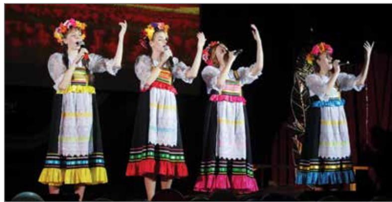
Гала-концерт стал одним из самых ярких событий уходящего года