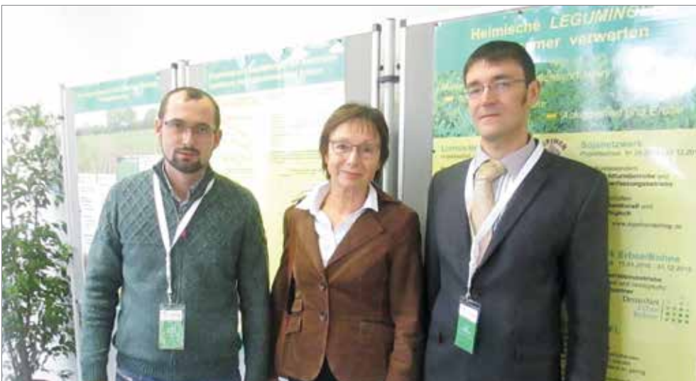
Университет прикладных наук Анхальт собрал специалистов и партнёров в области исследования проблем почвенного плодородия