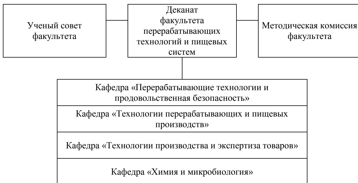
Рисунок 1 – Структура факультета перерабатывающих технологий и пищевых систем ФГБОУ ВО Волгоградский ГАУ

Подготовка магистров по образовательной программе высшего образования по направлению подготовки 19.04.02 Продукты питания из растительного сырья направленность (профиль) «Прогрессивные технологии в разработке продуктов питания из растительного сырья» (далее – образовательная программа) ведется на факультете перерабатывающих технологий и пищевых систем ФГБОУ ВО Волгоградский ГАУ ( https://volgau.ru/obrazovanie/fakultety-i-kafedry/fakultet-pererabatyvayushchikh-tekhnologiy-i-pishchevykh-sistem/ ) (рисунок 1).