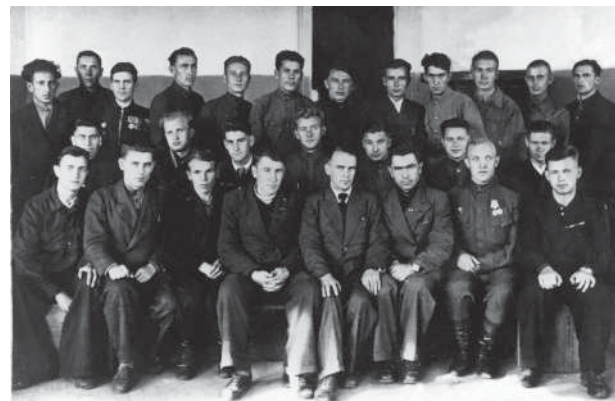
Студенты-фронтовики первого набора института

С чего же, с каких событий началась жизнь института, как проходили первые будни? Об этом волнующе свидетельствует, можно сказать, исторический приказ № 1 от 21 августа 1944 г. Примечательно, что написан он от руки, ведь даже пишущей машинки в вузе тогда не было. В приказе шла речь о комплектовании административно-хозяйственного персонала, проще говоря — срочно нужны были люди, которые бы начали создавать элементарные условия для начала занятий. Возглавил этот коллектив