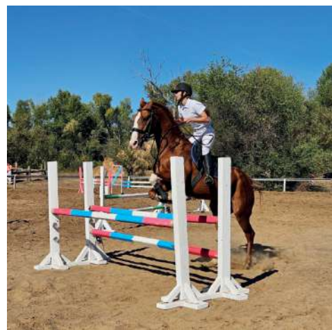
Спортсмены ВолГАУ – самые лучшие

результаты турнира пойдут в командный зачет Спартакиады «Первокурсник-2023» среди студентов ВолГАУ!