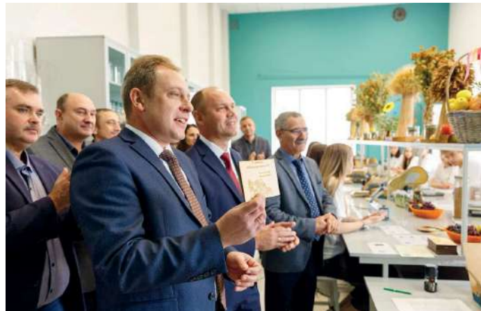
«Професионалитет объединяет» кластеры сельского хозяйства всей страны

Коллективом ученых-селекционеров университета созданы уникальные сорта различных отечественных агрокультур, которые были отобраны студентами Професионалитета с учетом агроклиматических условий регионов. Посылки с уникальной продукцией отправлены для экологических испытаний в учебно-производственные хозяйства кластеров Професионалитета.