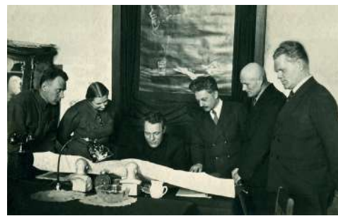
Директорат Сталинградского СХИ за обсуждением проекта нового здания института в г. Сталинграде

механизации сельского хозяйства — 34 человека. Всего приступило к учебе 359 первокурсников.