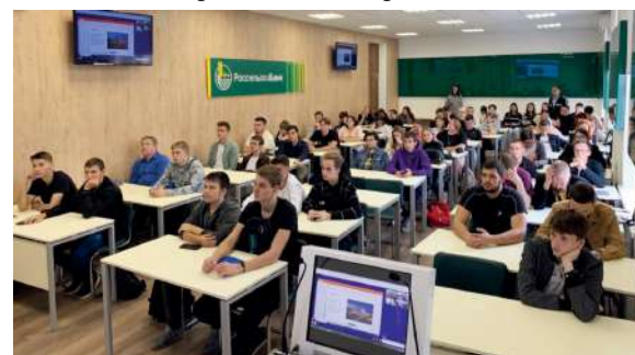
Из 400 слушателей программы будут собраны 70 команд, которые разработают стартап-проекты