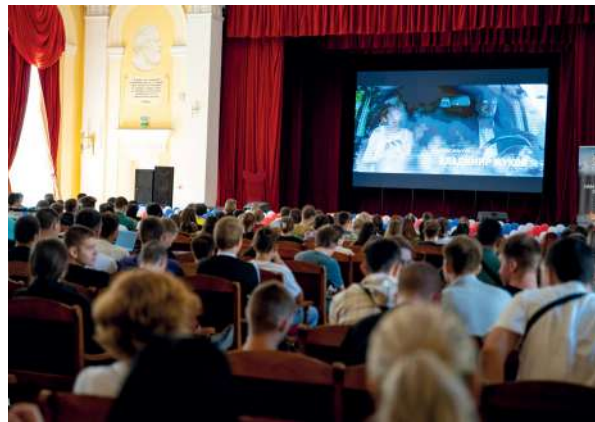
Волгоградская молодежь увидела картину на закрытом показе в ВолГАУ

Фильм говорит простыми словами о самом важном. О боях, их судьбах, о любви, вере и Родине. Чем больше в нашей