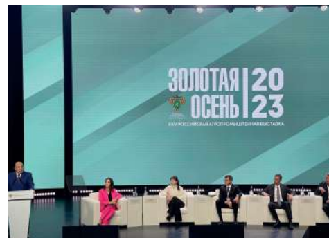
Пленарное заседание с участием Председателя Правительства РФ Михаила Мишустина

Ежегодно на «Золотой осени» вуз собирает большой урожай медалей различного