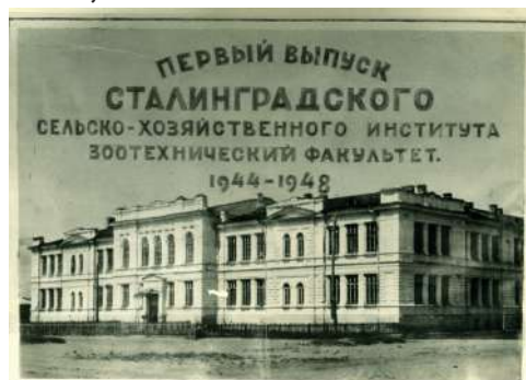
Здание Сталинградского СХИ в г. Урюпинске (1944–1948 гг.)

Эта биография началась в далеком 1944 году в небольшом, имеющем четырехсотлетнюю историю Урюпин-городке, станции Урюпинской, городе Урюпинске. О нём широко узнали в России из рассказа Михаила Шолохова «Судьба человека», а ныне его справедливо называют «столицей российской провинции». Волею судьбы своим рождением наш вуз обязан казачьему городу, в окрестке которого еще в 1906 году была открыта Хоперская сельскохозяйственная школа, а в советские годы в самом Урюпинске работал сельскохозяйственный техникум.