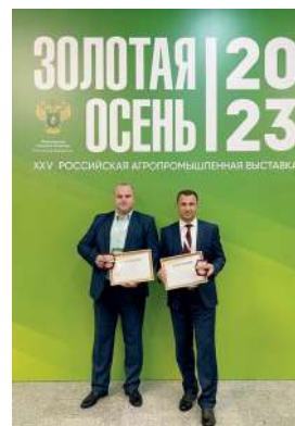
В этом году Волгоградский ГАУ награжден 22 медалями

«За успешное внедрение инноваций в сельском хозяйстве».