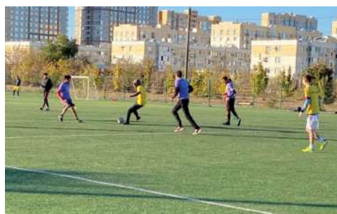
На Кубке ректора по футболу

Поздравляем всех победителей, призеров и участников Кубка и напоминаем, что