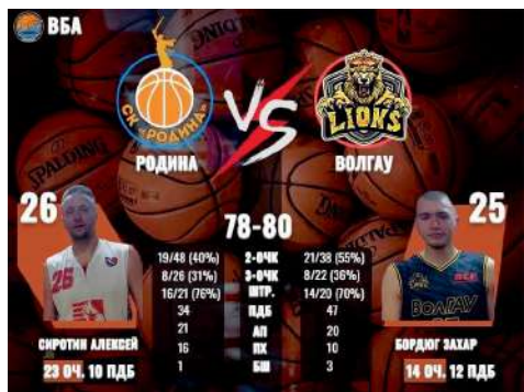
На первой игре наша команда встретила с баскетболистами клуба «Родина»

Матч держал в напряжении болельщиков от начала и до конца. До последней минуты победитель был не определен. Ценой невероятных усилий наши ребята вырвали победу. Итоговый счет игры 80:78 в пользу ВолГАУ.