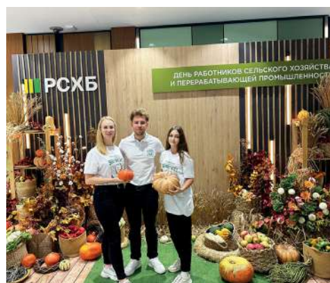
Студенты ВолГАУ в пятерке лучших Всероссийского конкурса

В головном офисе Россельхозбанка состоялась инвестиционная сессия молодежных команд «Стартапы для села», которая