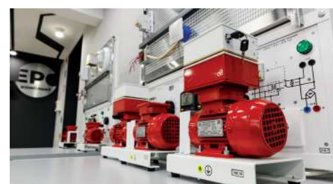
Оборудование в новой лаборатории

— Мы производим оборудование для распределения электрической энергии и для автоматизации систем управления. При последней реконструкции производственных мощностей мы взяли за основу чек-листы лидеров европейского рынка. Это передо-