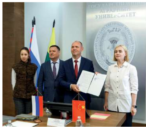
Меморандум между ВолГАУ и Байи Хэйлунцзянским аграрным университетом

Документ подписан между Волгоградским ГАУ и Байи Хэйлунцзянским аграрным университетом с целью развития академического обмена и сотрудничества в области преподавания, научных исследований и