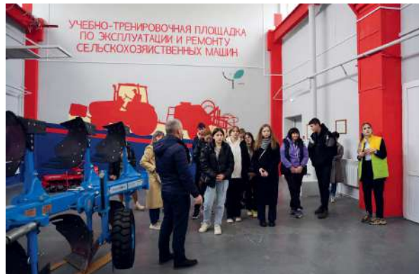
В ВолГАУ открыты десятки брендированных аудиторий и лабораторий