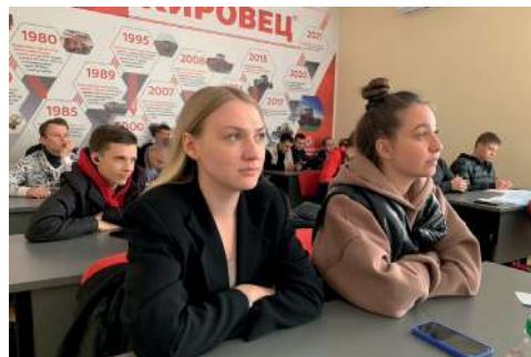
Акселерационная программа Бизнес-акселератора «АгроМир Будущего» рассчитана на восемь недель работы

Акселерационная программа Бизнес-акселератора «АгроМир Будущего» направлена на ускорение процесса развития стартапов путем обучения, финансовой и экспертной поддержки и создания катализирующей среды, а также поможет участникам сформировать предпринимательские инициативы в различных сферах агропромышленного комплекса.