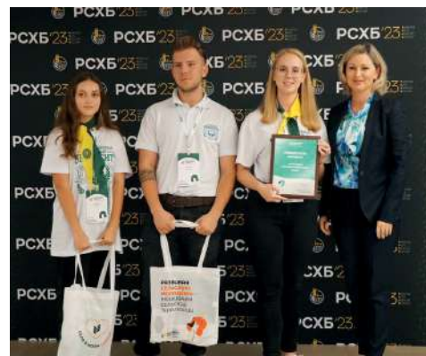
Команда ВолГАУ с проектом «ВкусV» заняла II место