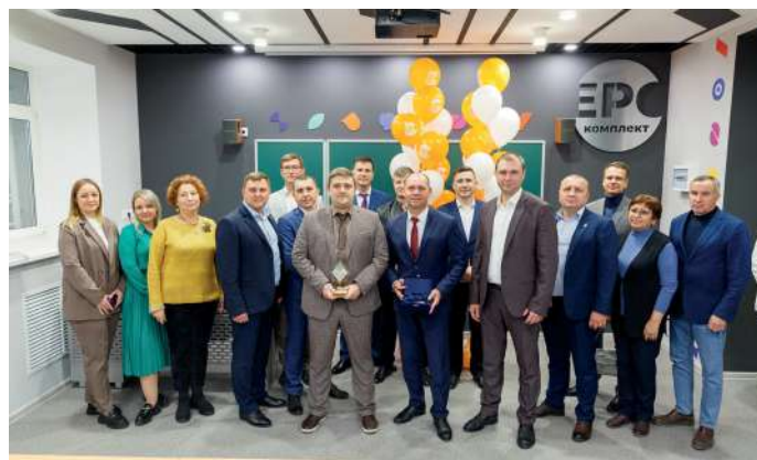
Партнерство университета и компании продолжается