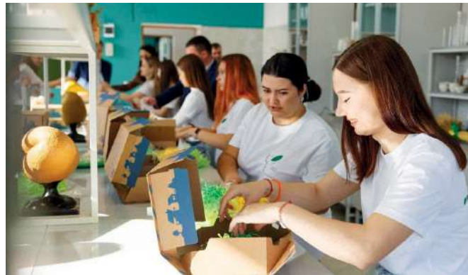
Посылки с уникальной продукцией отправлены в учебно-производственные хозяйства кластеров Професионалитета

ты по ее развитию. Современная молодежь проявляет высокий интерес к обучению в колледжах, и главная задача проекта – широкая информационно-просветительская работа. Любовь к профессии, уважение