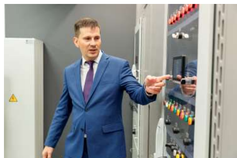
Студенты будут обучаться на высокоэффективном оборудовании

Здесь будут обучать студентов электроэнергетического факультета ВолГАУ. Ремонт помещения и поставку передового оборудования провела компания ООО «ЕРС-КОМПЛЕКТ»: большинство ее сотрудников — выпускники вуза.