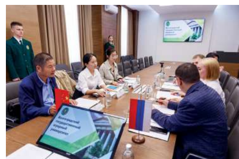
Встреча руководства вуза и компании SHANDONG HANS EDUCATION GROUP

Все обмены, визиты преподавателей и сотрудников, а также преподавание, проведение научных исследований и прием студентов будут осуществляться при условии соблюдения требований действующего законодательства Российской Федерации и Китайской Народной Республики.