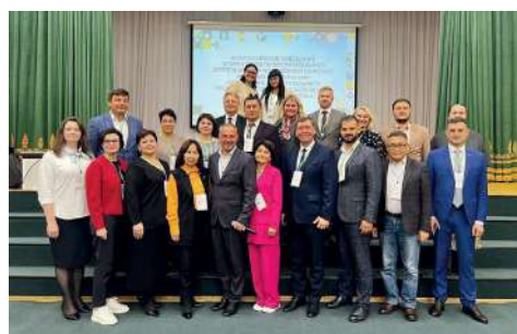
Участники Всероссийского совещания проректоров