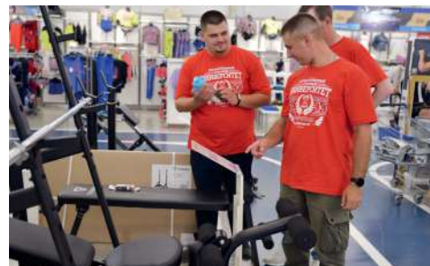
Спортивный инвентарь выбирали студенты вуза