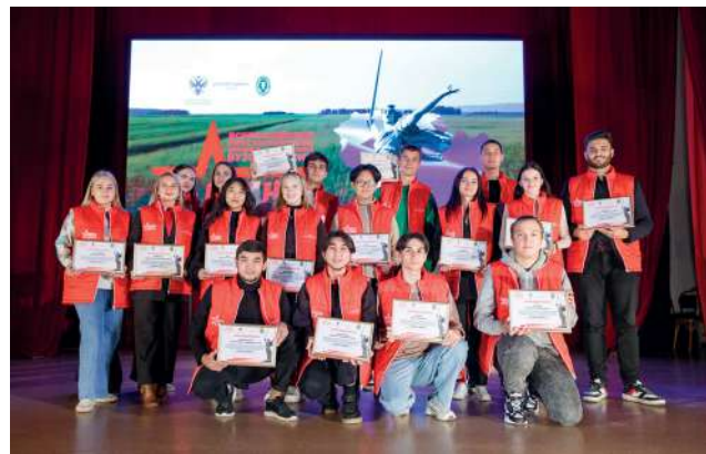
Кураторы форума тоже получили заслуженные Благодарности

– Я рад, что именно здесь, на священной Сталинградской земле, где 80 лет назад был разбит хребет фашизму, мы собрали представителей из 61 образовательного учреж-