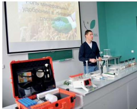
Материально-техническая база позволяет вести подготовку специалистов на самом высоком уровне

В преддверии Единого дня открытых дверей в Волгоградском государственном аграрном университете стартовала Всероссийская акция, объединившая агрокластеры по всей стране.