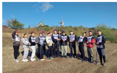
Участники соревнований по северной ходьбе

Состязания проходили на главной высоте России – Мамаевом кургане. В Первен-