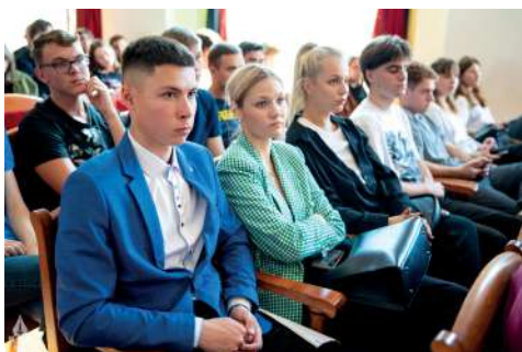
Студенты стали первыми зрителями картины

– Учили нас, киношников, что такое артефакты, как это поднимать, какова сама по себе тонкая техническая работа, которую