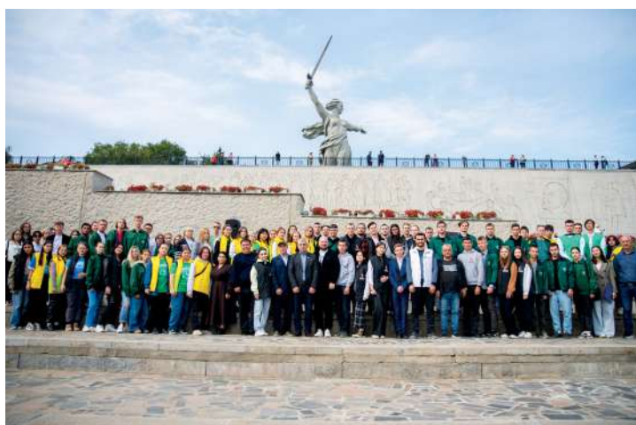
Участники акции в рамках международного проекта по молодежной дипломатии «Непокоренные»

Более 300 ребят из стран СНГ встретились в легендарном городе-герое и прикоснулись к самому большому в мире Знамени Победы. Оно полностью закрыло «Озеро слез» у подножия монумента Родина-мать зовет.