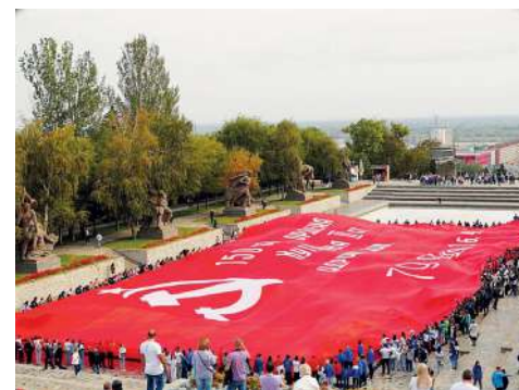
Самое большое в мире Знамя Победы накрыло «Озеро слез»

– Именно на нашей легендарной земле начался обратный отсчет самой кровопролит-