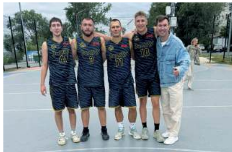
Команда ВолГАУ – чемпион турнира по фиджитал-баскетболу

В рамках Молодежного фестиваля #Три-Четыре на открытой площадке Училища олимпийского резерва имени дважды Героя Советского Союза А. И. Родимцева прошел турнир по фиджитал-баскетболу 3 x 3. В соревнованиях принимали участие команды из девяти вузов региона.