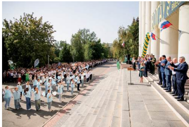
Парад факультетов и студенческих объединений университета – одна из традиций Волгоградского ГАУ

Первокурсники одного из лучших аграрных вузов России приняли участие в торжественной линейке, приуроченной ко Дню знаний. На ежегодном Посвящении в студенты с началом обучения поздравления принимали более трех тысяч человек, поступивших в этом году на программы высшего и среднего профессионального образования.