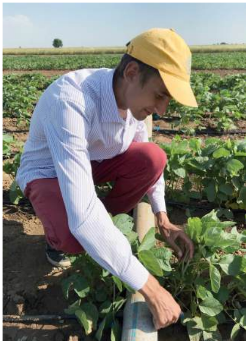
Вуз предоставляет полигоны на своих опытных полях

Если говорить конкретнее, моя работа заключается в том, чтобы найти оптимальное сочетание этих факторов. Я определяю, когда и сколько воды дать растениям в каждую критическую фазу их развития (всходы, цветение, образование бобов, налив семян). Это не просто полив «по графику», а точное поддержание оптимальной влажности почвы в корнеобитаемом слое, исходя из погодных условий и потребностей растения. Также я исследую, как различные дозы минеральных удобрений, азотные, фосфорные и калийные, работают в условиях разного водного режима. Моя задача – найти ту золотую середину, когда растение максимально эффективно использует и воду, и питательные вещества. И, наконец, способы полива – это вопрос того, как подать воду. Я сравниваю эффективность капельного