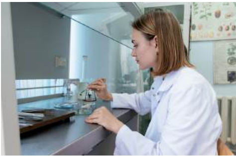
Исследования проводятся в современной лаборатории ВолГАУ

– Возможности для самореализации в сфере технологического предпринимательства сегодня доступны каждому студенту, независимо от направления