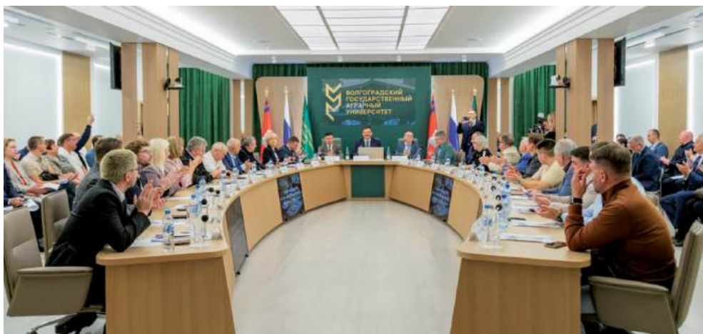
На совещании, прошедшем на площадке ВолГАУ, были рассмотрены вопросы хлебопекарного производства в России