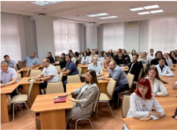
На пленарном заседании студентам рассказали о значимости акселерационной программы, о том, как будет организована ее работа

Мероприятие проводится в рамках реализации Бизнес-акселератора «Агромир будущего» ФГБОУ ВО «Волгоградский государственный аграрный университет» и федерального проекта «Технологии».