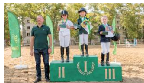
На пьедестале юные победители Кубка ректора

В рамках празднования Дня города в Волгограде на Нулевой продольной магистрали прошел традиционный легкоатлетический пробег «Волгоградская миля». Участники преодолели дистанцию в 1589 метров, символизирующую год основания города, семейные команды пробежали втрое меньше – 436 метров. Эта цифра привязана к возрасту Волгограда. В мероприятии приняли участие порядка нескольких сотен человек: школьники, студенты ссузов и вузов, семьи. Вместе со всеми бежали и наши спортсмены.