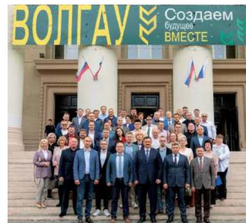
Участники выездного заседания правления Российского Союза пекарей

Дальнейшее развитие мукомольно-крупяной и хлебопекарной отраслей призваны обеспечить новые инвестпроекты: так, ООО «Городищенский комбинат хлебопродуктов» и ООО «Волжская мельница» планируют модернизацию производства и увеличение объема выпуска муки; АО «Хле-