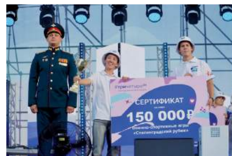
Команда ВолГАУ «Сталинград» – победитель военно-патриотической игры

Отметим, что на фестивале в рамках Парада студенчества Волгоградской об-