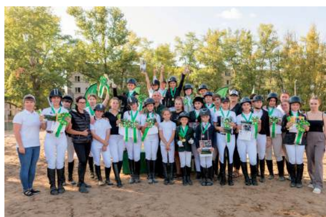
Участники и призеры детско-юношеских соревнований по конному виду спорта на Кубок ректора ВолГАУ