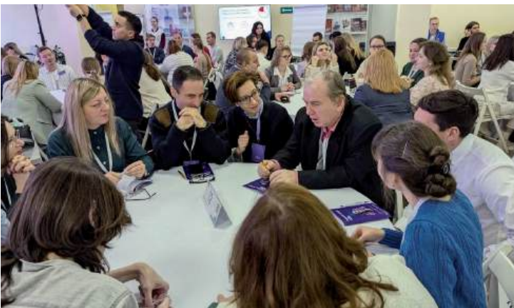
Общение с коллегами помогает определиться, в каком направлении работать, что более актуально, на что лучше обратить внимание

– Потому, что она проставляет правильно приоритеты. Понимает, что у аграрной науки есть очень хороший потенциал. Я уже в своем выступлении сказал, что у молодых ученых сегодня больше возможностей добиваться успехов в науке – поиск информации, взаимодействие с ведущими учеными мира, в том числе в онлайн-