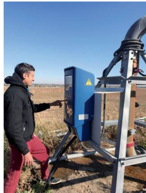
Проводить исследования без поддержки вуза было бы невозможно

орошения (когда вода подается прямо к корню) и дождевания (когда имитируется естественный дождь). Каждый способ по-разному влияет на микроклимат в посевах, структуру почвы, рост и развитие сельскохозяйственных культур и усвоение минеральных удобрений.