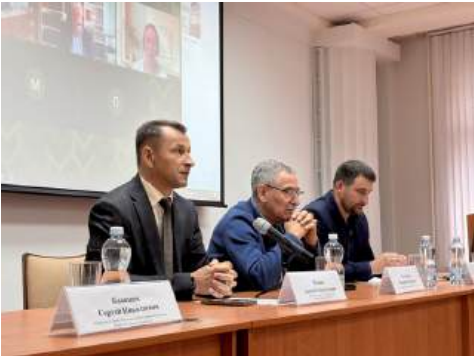
Торжественное открытие Бизнес-акселератора «Агромир будущего»

На пленарном заседании с участием руководства Волгоградского ГАУ, экспертов, наставников, лекторов и студентов рассказали о значимости проведения акселерационной программы, о том, как будет организована работа Бизнес-акселератора «Агромир будущего» и как он позволит обеспечить поддержку проектных команд и студенческих инициатив при формировании инновационных продуктов.