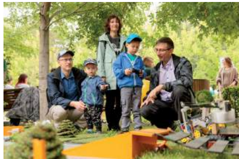
Профориентационную площадку ВолГАУ посетили более 4 тысяч человек

Кванториумы, колледжи и вузы Волгоградской области подготовили для гостей