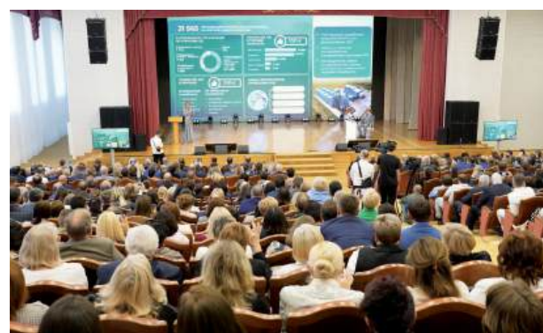
Министр сельского хозяйства РФ Оксана Лут рассказала о приоритетах в подготовке кадров для АПК