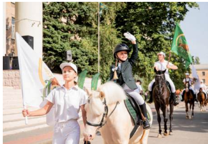
Конноспортивный клуб «Добрыня» ВолГАУ – участник Парада

На празднике провели традиционную церемонию возложения полномочий старост среди первокурсников. Почетное право вручить символ лидера предоставили Наставникам – студентам старших курсов, активистам, ставшим проводниками в мир студенчества.