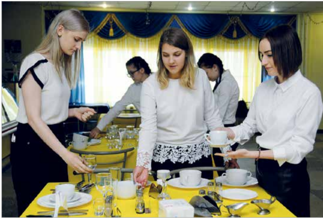
Новая номинация – «Лучший официант»