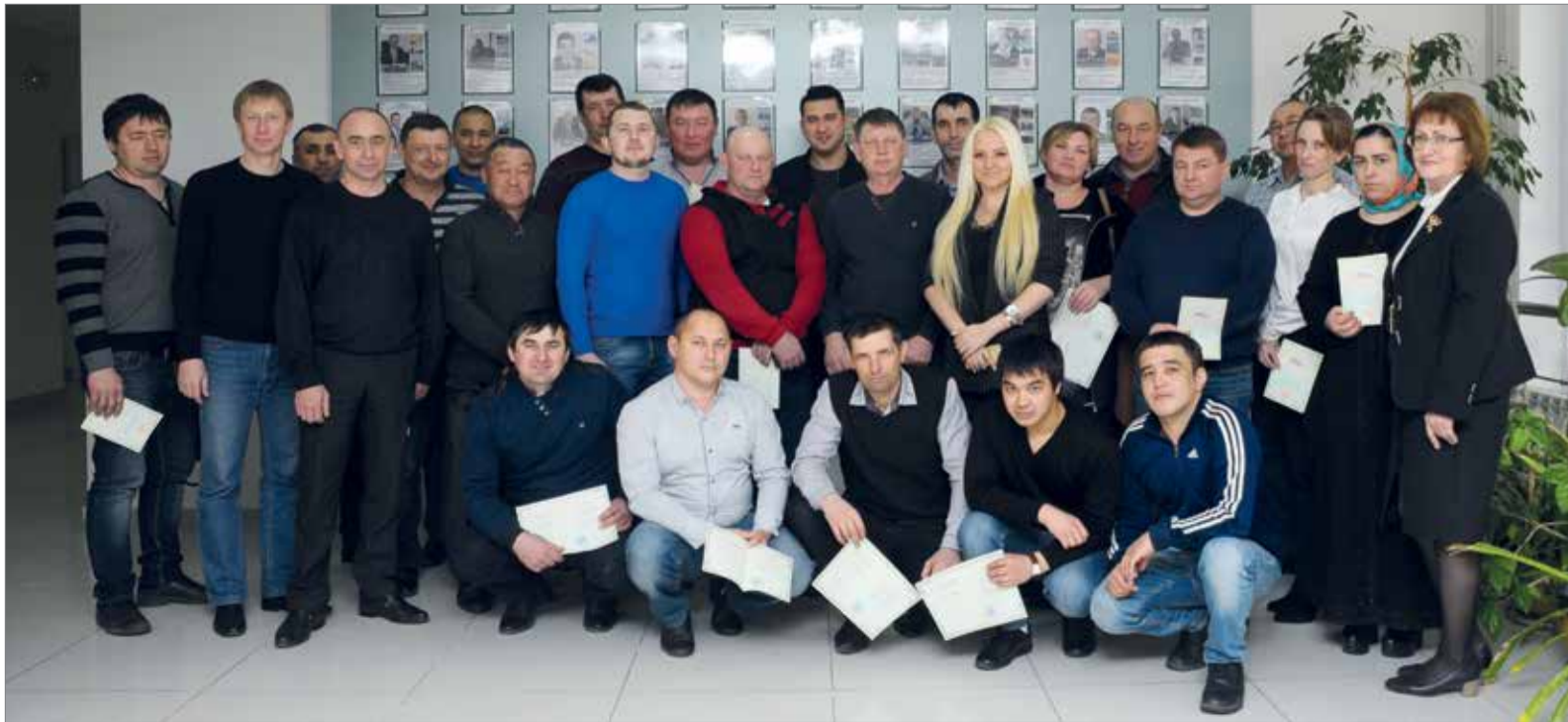
Очередной выпуск ИПККА