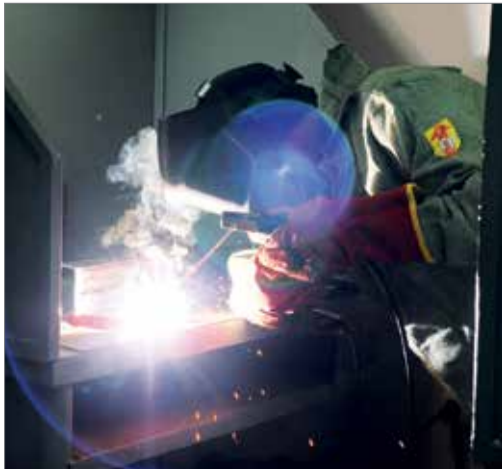
СОРЕВНОВАНИЯ В САМОМ РАЗГАРЕ

Конкурс профессионального мастерства «Лучший по профессии» проводится в Волгоградском ГАУ второй год подряд. В этот раз было увеличено количество номинаций. К уже имеющимся – «Лучший тракторист-машинист сельскохозяйственного производства», «Лучший сварщик (электросварщик ручной дуговой сварки)» и «Лучший электромонтёр по монтажу и эксплуатации распределительных сетей» – добавились еще три. Своими знаниями и умениями померялись участники в номинациях «Лучший ветеринарный фельдшер», «Лучший кинолог» и «Лучший официант».