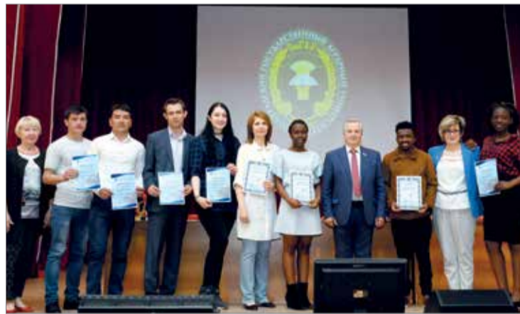
Призеры фестиваля русской речи иностранных студентов «Берега»