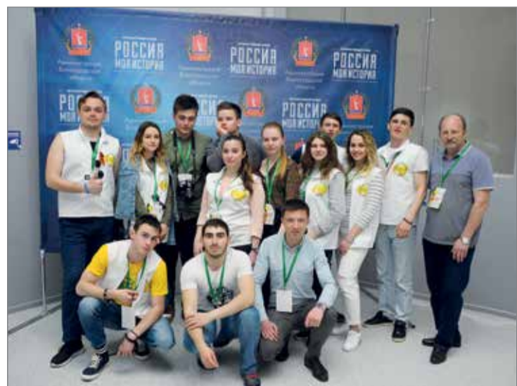
Для гостей подготовили насыщенную экскурсионную программу

– Очень символично, что в стенах нашего Волгоградского ГАУ на священной Сталинградской земле родилась эта замечательная традиция. Вас ждет серьезная насыщенная программа. Вы уже побывали на Мамаевом кургане, вам предстоит поездка в город во-