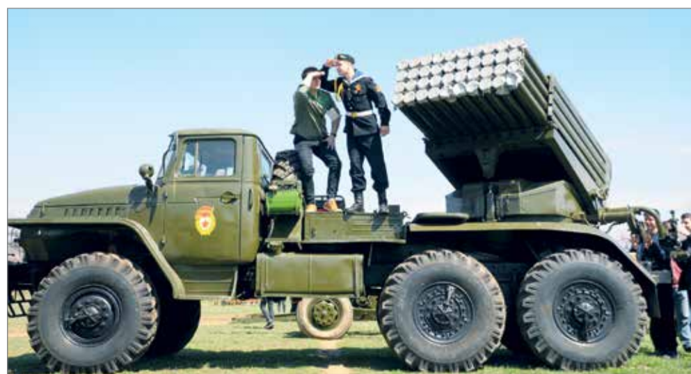
ВРАГ НЕ ПРОЙДЕТ!

– Впечатления шикарные! Мы знали, что третий слет приурочен к 75-летию Победы в Сталинградской битве, и программа поменяется. Но я и подумать не мог, что настолько. Добавилось много интерактивов для студентов и появилось больше возможностей проявить себя. На презентации клубов мы почерпнули много интересных идей. К примеру, ребята занимаются восстановлением уже существующих заброшенных братских могил. Мне очень понравилась экскурсия в Калач-на-Дону с его монументом «Соединение фронтов», музей истории России. Спасибо вам большое, все было очень здорово!