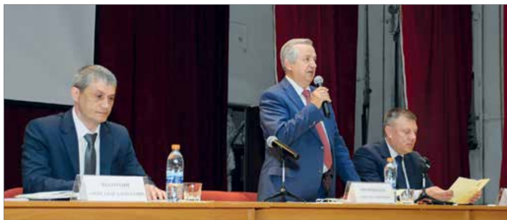
В ВолГАУ делается упор на научную деятельность

В нашем вузе ведется планомерная работа в данном направлении. Основной упор делается на научную деятельность. Так, ежегодно научными коллективами выигрывается свыше