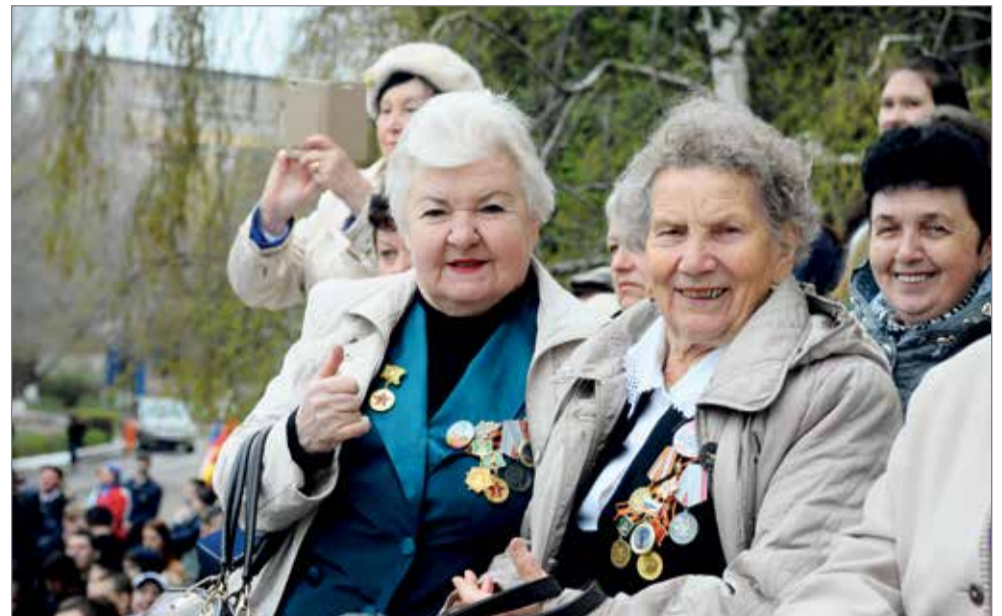
Главные гости слета

Делегаты и гости стали свидетелями одного из самых зрелищных и трогательных моментов – молодежной патриотической акции «Вальс Победы». Также в программу входил военно-исторический квест «200 дней и ночей», олимпиада для школьников «Юный историк – 2018», посвященная 75-летию Сталинградской битвы, работа молодежной дискуссионной площадки «Молодое поколение России против фальсификации истории!». Кроме того, ключевыми событиями трехдневного марафона стало Открытие центра молодежной политики Волгоградского ГАУ, открытие спортивно-патриотического радиоклуба «Колос», показательные выступления по пожарно-прикладной подготовке, мастер-класс по спортивной радиопеленгации «Охота на лис» и т. д.