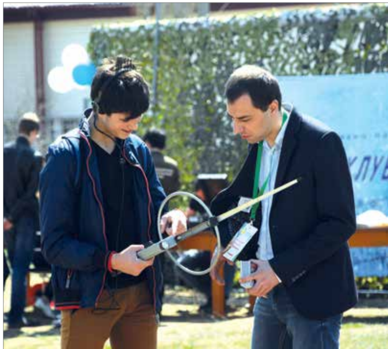
Гости проявили интерес к радиолобительскому делу

Для того чтобы участники слёта и студенты ВолГАУ прониклись духом радиолобительства, была организована работа двух радиостанций с выходом в эфир на КВ и УКВ диапазонах. Каждый имел возможность самостоятельно, под наблюдением инструктора, провести радиосвязь с радиолубителями России и всего мира.