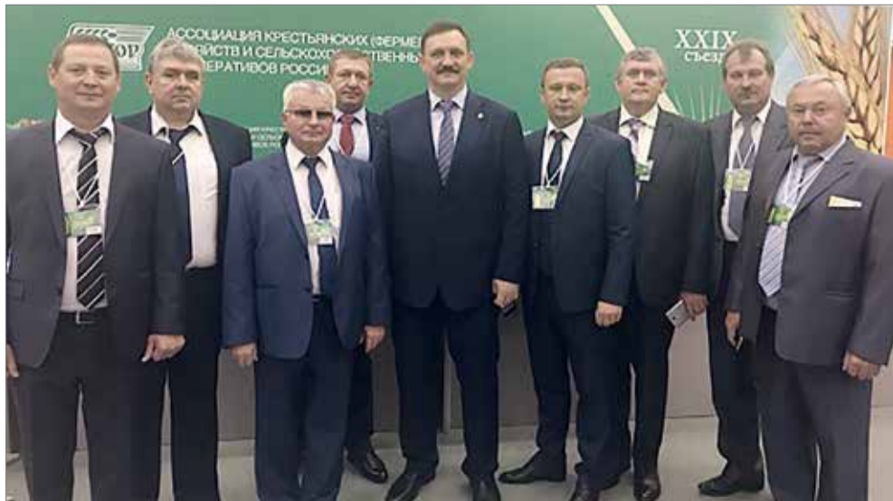
Волгоградские фермеры – лучшие в стране