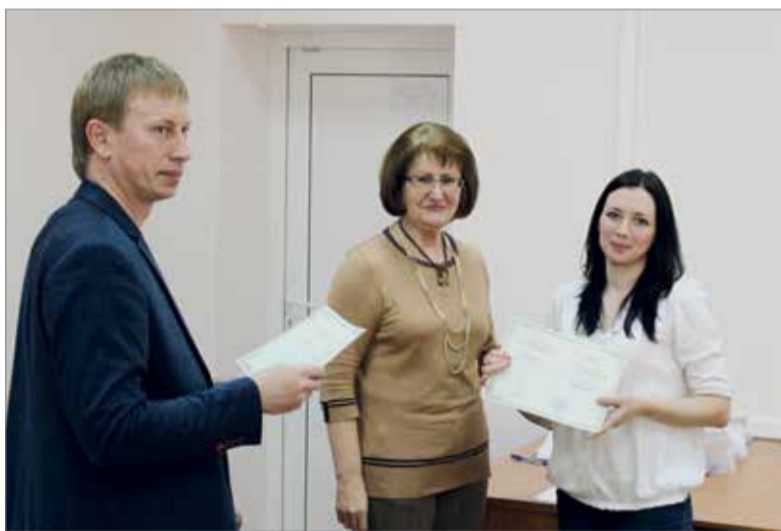
Вперед – множество свершений

Сельское хозяйство на сегодня – одна из наиболее динамично развивающихся отраслей экономики как в России в целом, так и особенно в Волгоградской области. Многие объясняют это введением санкций и последующими контрсанкциями. Но решение проблем обеспечения продовольственной безопасности и общее поступательное движение вперед в аграрной сфере невозможно без непрерывного обучения, повсеместного вовлечения научной базы в производственный процесс. Именно такой подход позволяет добиваться заметных успехов в аграрной сфере. Радует, что такое понимание идет и на государственном уровне и на местах. Сами сельхозпроизводители осознают необходимость дополнительных технологических знаний и умений, а руководство области старается обеспечить им соответствующие условия для получения необходимых профессиональных компетенций. Волгоградский государственный аграрный университет выступает в данной цепочке связующим звеном – носителем инновационных знаний, которыми с готовностью делаются его признанные ученые и высококвалифицированные сотрудники.