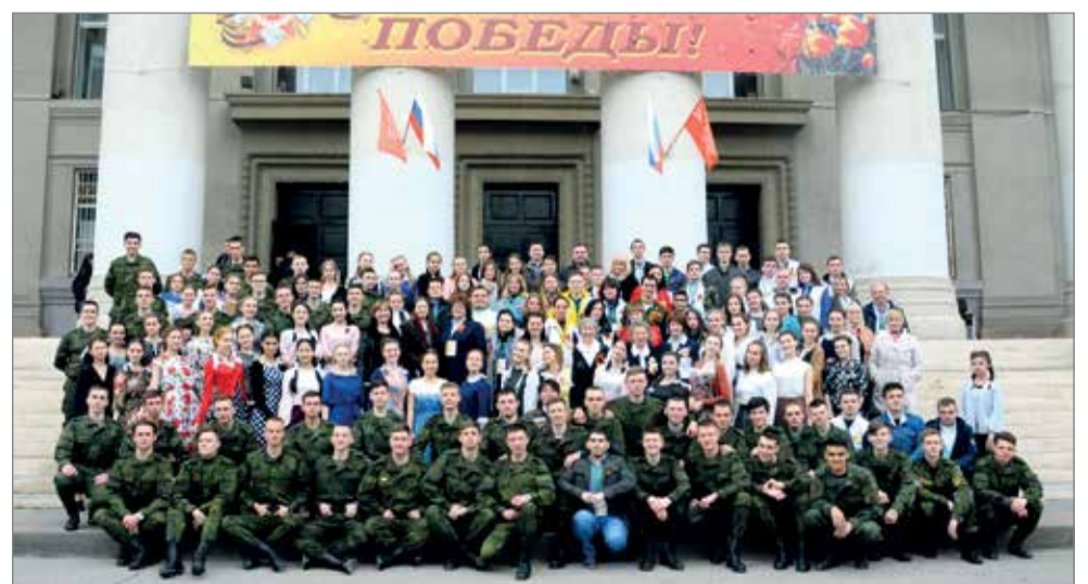
Мы снова встретимся в ВолГАУ