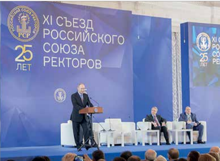
Выступление Президента РФ Владимира Путина

В конце апреля в Санкт-Петербургском политехническом университете Петра Великого состоялся XI Съезд Российского союза ректоров. На пленарном заседании выступил президент РФ Владимир Путин. На съезд также прибыли помощник президента А. А. Фурсенко, полпред президента в СЗФО А. Д. Беглов, министр образования и науки О. Ю. Васильева, президент РАН А. М. Сергеев, губернатор Санкт-Петербурга Г. С. Полтавченко и другие государственные служащие, представители науки и образования.