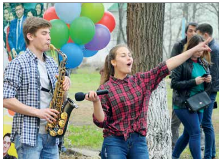
Сегодня наш день!

– Сталинград по праву считается сердцем Великой Победы, а город-герой Волгоград – это центр патриотического воспитания России. Именно поэтому Всероссийский слет «Родная земля» имеет особое значение на нашей легендарной сталинградской земле. Хранить традиции, хранить историю победы предков – наш главный долг перед поколением Победителей. Спасибо большое вам ребята за вашу просветительскую, поисковую работу. Низкий поклон нашим ветеранам за ратный подвиг, за доблестный труд, за мирное небо над головой!