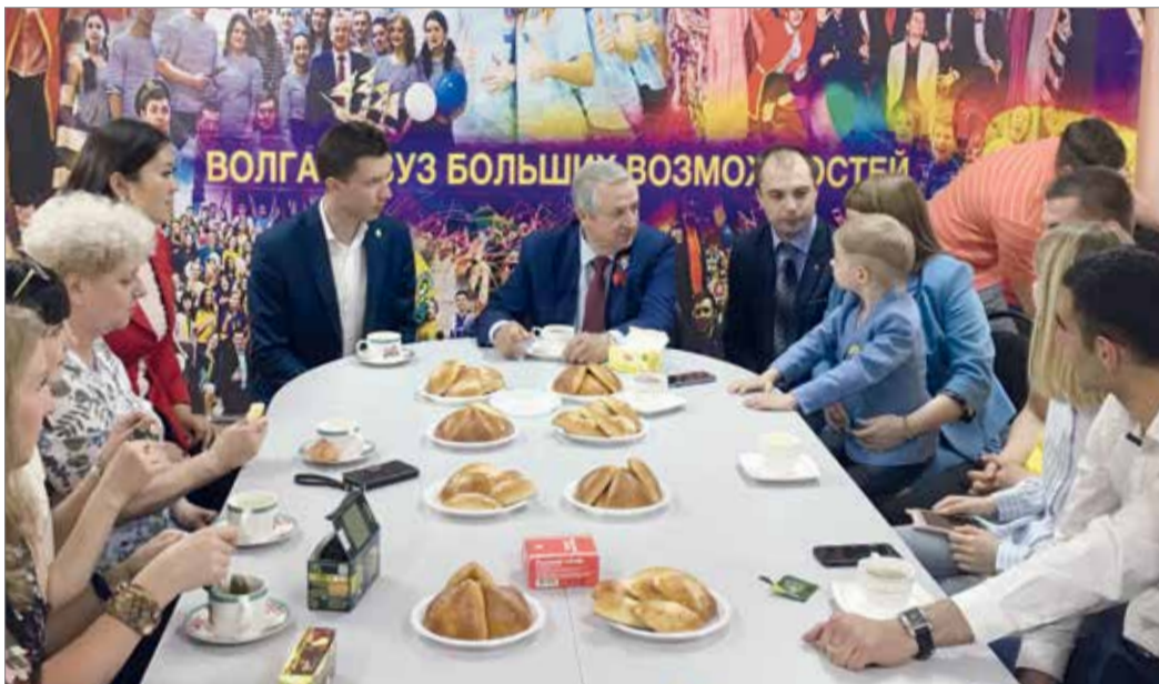
Перспективы работы обсудили за чашкой чая

1 февраля 2018 года в вузе был создан Центр молодежной политики, который объединил под своим крылом шесть основных направлений работы: РССМ (Российский союз сельской молодежи), АСАУ (Ассоциация самоуправления аграрного университета), волонтерский центр «Старт», РСО (Российские студенческие отряды), молодежная дружина «Рассвет», рекрутинговый центр ВолГАУ по набору городских волонтеров к мероприятиям