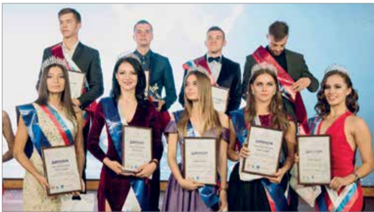
Выступления позиди: фотосессия победителей

В городе-герое Севастополь состоялся 12-й Всероссийский конкурс «Мисс и Мистер Студенчество России – 2018». В течение недели представители 45 регионов проходили различные этапы: сдавали нормы ГТО, учились самопрезентации, готовились к интеллектуальному и творческому состязаниям. Завершилось мероприятие грандиозным гала-концертом на территории Государственного музея-заповедника «Херсонес Таврический».