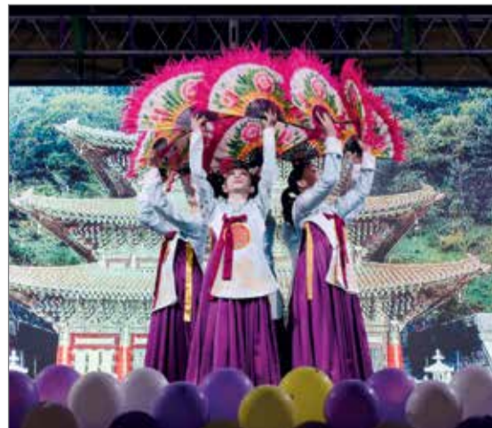
Культура каждого народа прекрасна по-своему