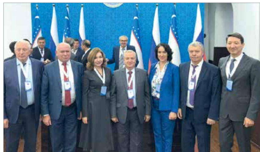
Ректора аграрных вузов России