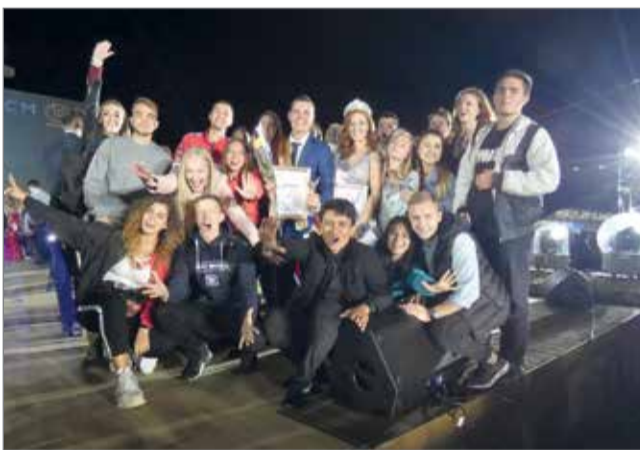
Поддержка – наше все!