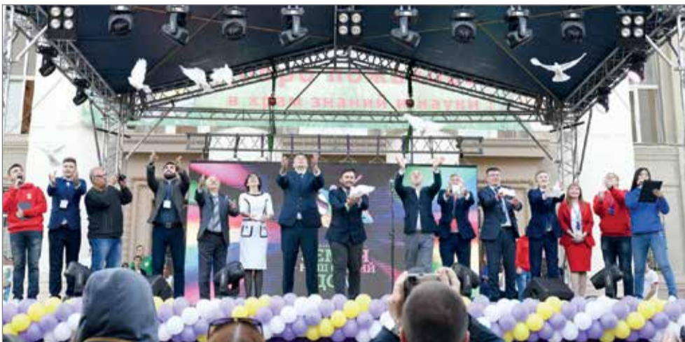
Белый голубь — символ мира

В Волгоградском государственном аграрном университете состоялся молодежный фестиваль народов мира «Земля – наш общий дом». Это масштабное мероприятие удалось организовать благодаря тому, что ВолГАУ стал победителем Всероссийского конкурса молодежных проектов среди образовательных организаций высшего образования от Федерального агентства по делам молодежи Российской Федерации. Подобный межнациональный диалог осуществляется на площадке нашего вуза уже в пятый раз: старт был дан еще в 2006 году.