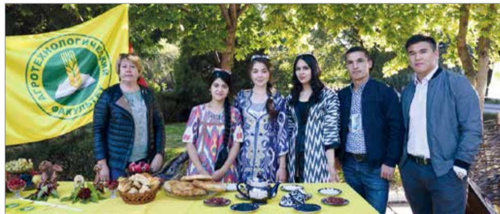
На фестивале можно было отведать блюда национальных кухонь

ВолГАУ также не остался в стороне от выставки кулинарных достижений. Подготовка к фестивалю в основном была осуществлена силами двух факультетов: агротехнологического и факультета перерабатывающих технологий и товароведения. Мастера аграрного университета порадовали гостей