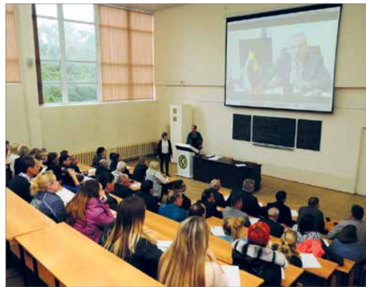
В ВолГАУ прошла масштабная проверка грамотности

В преддверии Дня учителя произошло знаковое событие в жизни нашего университета: 4 октября коллектив вуза написал «Ректорский диктант». Всеобщая проверка грамотности стала первым этапом Международной просветительской акции «Большой этнографический диктант», который пройдет по всей России 2 ноября.