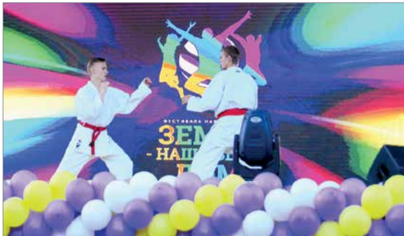
Программу фестиваля открыли выступления спортсменов