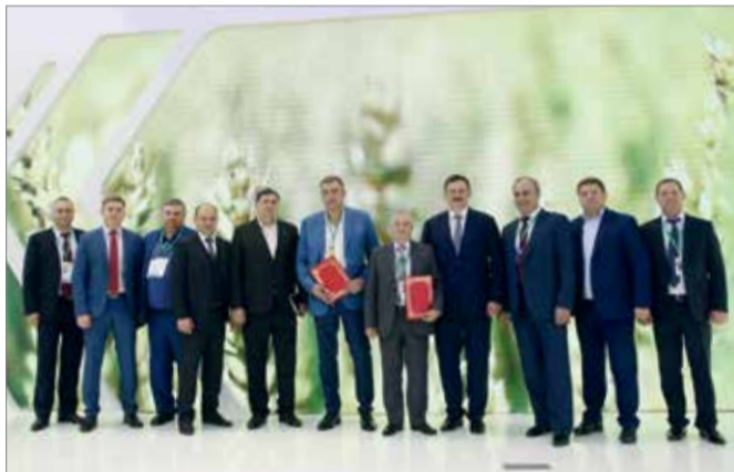
Участники форума: только что подписано важное соглашение между ВолГАУ и «Агро-Матик»

В октябре у работников агропромышленного комплекса России принято подводить итоги года. Не зря именно на этот месяц приходится и профессиональный праздник аграриев. Самый большой специализированный форум сельскохозяйственной отрасли – выставка «Золотая осень» – также обычно проходит в октябре. А в этом году она стала юбилейной – 20-й по счету.