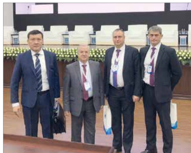
Делегация ВолГАУ на российско-узбекском образовательном форуме