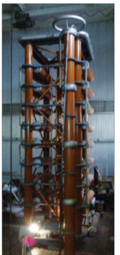
Лаборатория в институте электроэнергетики МЭИ

Сотрудничество факультетов московского и волгоградского вузов включает также и образовательную составляющую. Для студентов ВолГАУ, которые обучаются по направлению «Электроэнергетика и электротехника», будут проводиться открытые лекции, в планах кафедры электроснабжения сельского хозяйства и ТОЭ организация краткосрочных стажировок для лучших студентов в МЭИ. С московскими коллегами прорабатывается вопрос об использовании в учебных целях программно-аппаратного комплекса RTDS. Он моделирует электрические и электромеханические процессы и формирует соответствующие электрические сигналы, что позволяет моделировать работу энергосистем и их участков в реальном времени.