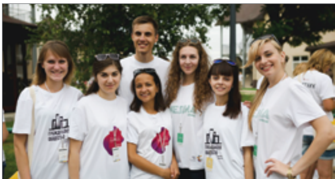
Команда Волгоградского ГАУ на СелиАСе

В рамках форума состоялся первый этап всероссийского конкурса молодежных проектов, победители и призеры которого смогут получить гранты Росмолодежи. Еще один грантовый конкурс проходил здесь под патронажем