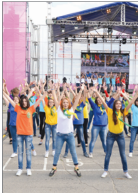
Студенты Волгоградского ГАУ выступили с танцевальным флэшмобом