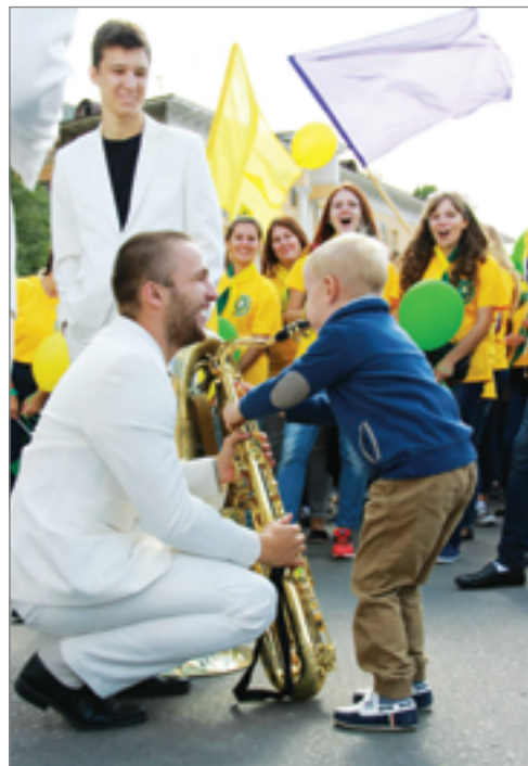
Музыкальный ВолГАУ завоевывает новых поклонников