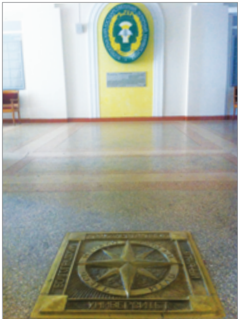
Точка отсчета успешной карьеры в сельском хозяйстве