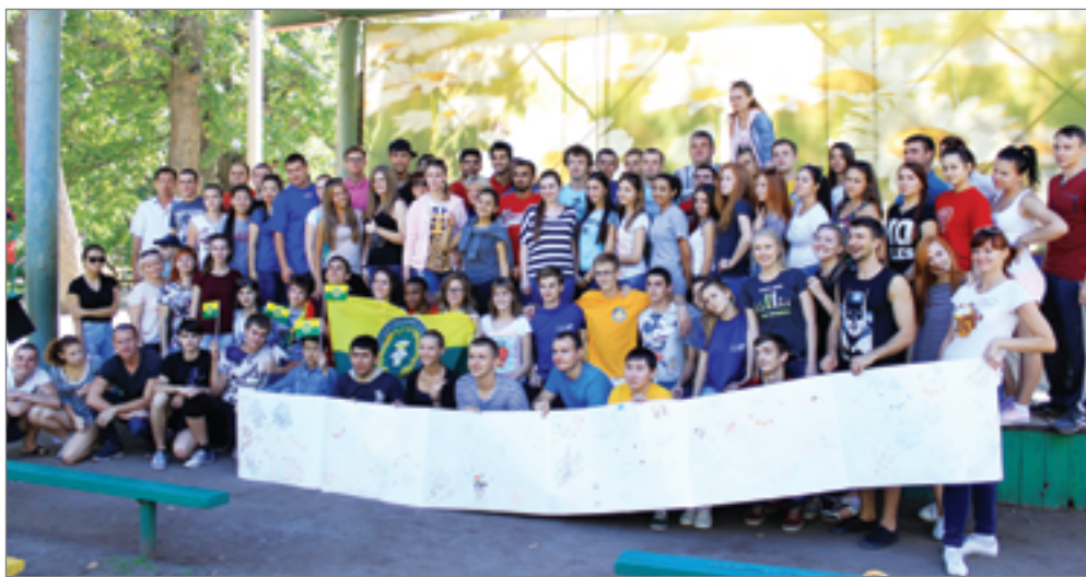
Молодые патриоты собрались в Волгограде

Форумчане, подводя итоги, высказали пожелание встречаться как можно чаще на подобных мероприятиях.