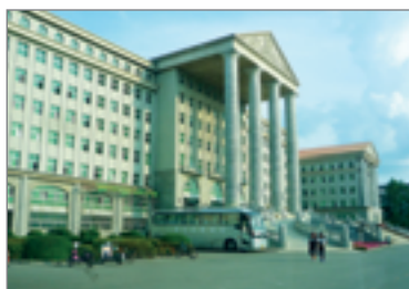
Цзилиньский аграрный университет — крупнейший аграрный вуз Китая

ся 27 000 студентов, из них 18 тыс. занимается очно. Более 1800 преподавателей работают в 15 колледжах. В Цзилиньском аграрном университете реализуется 59 программ бакалавриата, 72 магистерские программы, 23 докторские программы и 7 программ пост-докторских исследований. Обучение ведется как на китайском, так и на английском языках.