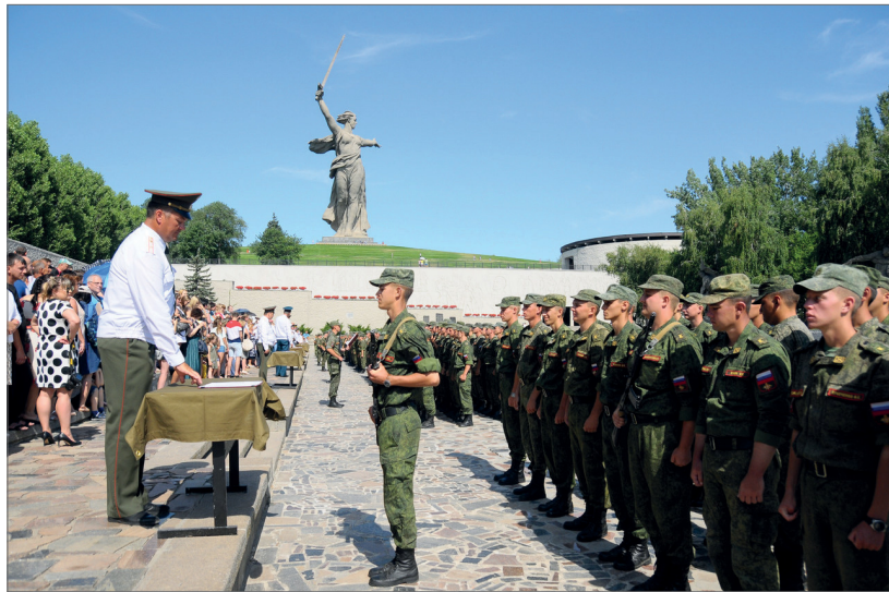
Приведение к военной присяге традиционно проходит на Мамаевом кургане

Служить Родине не только на золотой ниве полей, но и на поле ратном – девиз курсантов ВУЦ. Волгоградский ГАУ – единственный вуз в регионе, в котором вместе с дипломом о высшем образовании молодой человек может получить погоны офицера и сержанта запаса. В военном учебном центре ведется подготовка по военно-учетным специальностям для ракетных войск и артиллерии Вооруженных Сил Российской Федерации в соответствии с заказом Министерства обороны. Где бы ни оказались выпускники центра после окончания университета, каждый из них достойно несёт звание защитника Отечества.