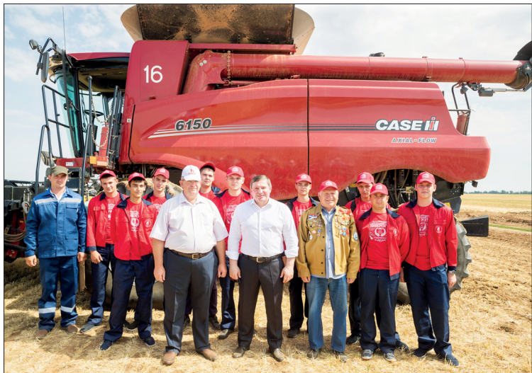
На полях АО «Аксайское» ежегодно проходят практику студенты ВолГАУ

В Волгоградской области привлечению молодежи к работе на селе уделяется огромное внимание – разработан целый ряд мер поддержки, способствующих становлению их как специалистов. После первого, второго и третьего года работы на сельхозпредприятии или в КФХ выпускник вуза в общей сложности получает 200 тысяч рублей, специалист со средним образованием – 140 тысяч. В 2021 году 36 человек воспользовались данной выплатой на обустройство своей жизни.