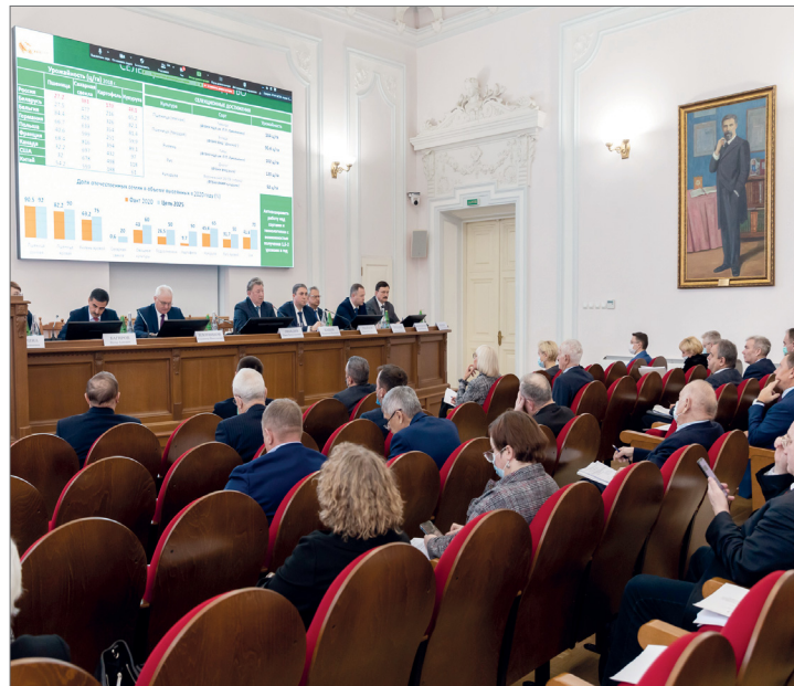
В ходе парламентских слушаний обсуждали развитие науки и кадровый потенциал АПК

Глава аграрного комитета Государственной думы Российской Федерации В. И. Ка-