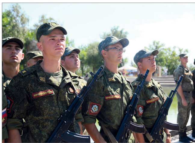
Торжественная присяга на верность Родине