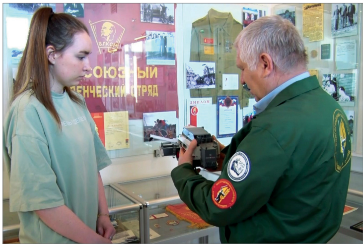
В музее вуза студенческим отрядам посвящена отдельная экспозиция

Труд – крут! Об этом точно знают бойцы российских студенческих отрядов. У них большая история, праздник объединяет миллионы жителей, которые трудились и продолжают трудиться на благо страны. Первый студенческий отряд в Волгоградском аграрном университете появился в 1957 году. Вот уже 65 лет его бойцы помогают в развитии сферы сельского хозяйства нашего государства.