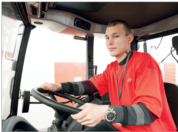
Соревнования по направлению «Эксплуатация сельскохозяйственных машин»

– Это не просто документ или протокольная встреча, своим желанием объединиться в единый агрокластер мы открываем