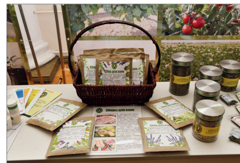
Разработки агротехнологического факультета

Ученые поделились опытом и обсудили научно-производ-