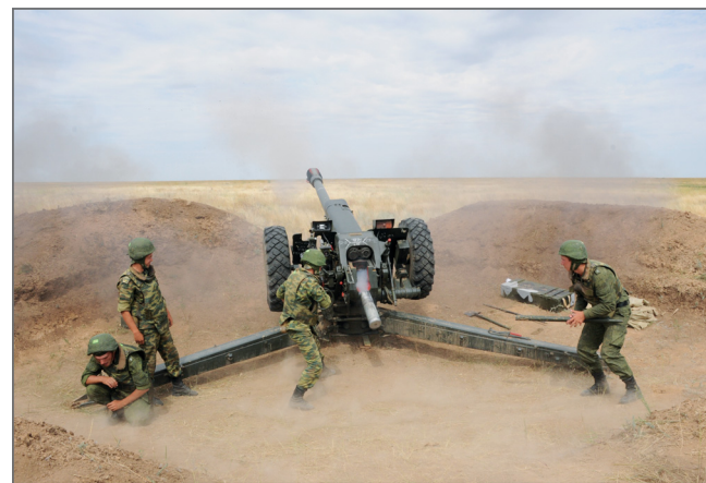
Практические занятия на полигоне в Прудбое

с выслугой лет и заслугами перед Отечеством. К студентам относятся очень серьезно и требуют такого же от тебя. Большинство из нас рассматривает военную службу не просто как запасной вариант, а как основную профессию.