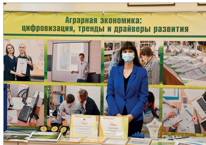
Факультеты вуза представили на выставке передовые разработки

Гостям и участникам форума продемонстрировали научные достижения ВолГАУ, востребованные и актуальные для сельхозтоваропроизводителей.