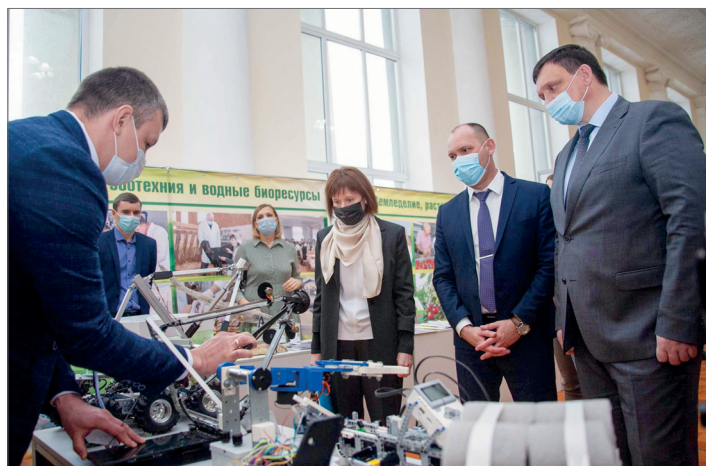
Демонстрация работ и научных достижений ВолГАУ

Участниками Международной научно-практической конференции «Инновационные технологии в агропромышленном комплексе в условиях цифровой трансформации» стали 450 ученых из 15 регионов России, а также других государств – Сербии, Греции, Китая, Германии, Узбекистана, Белоруссии, Молдовы, Казахстана, Армении и Кыргызстана. Дискуссионные площадки и секционные заседания работали в течение трех дней.