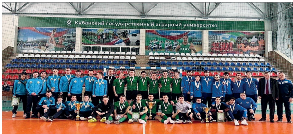
Участники Первенства Южного и Северо-Кавказского дивизионов по мини-футболу

забега, уступив первенство лишь Академии физической культуры.