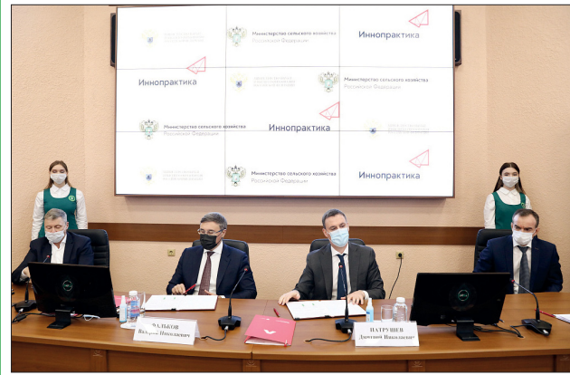
Перспективы развития аграрного образования обсудили в КубГАУ

Консорциум аграрных вузов Приволжского федерального округа в текущем году в рамках программы реализует 46 проектов, в том числе по таким важным направлениям, как создание новых технологий ведения тепличного хозяйства, разработка экологичной сельхозтехники и многое другое. За три месяца на базе объединения прошли подготовку и повышение квалификации более 2 тыс. специалистов.