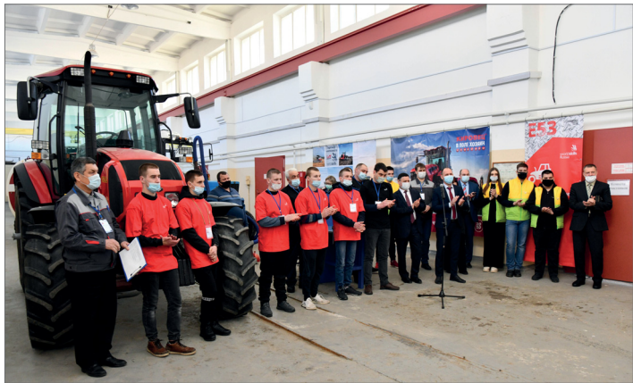
Открытие конкурса «Молодые профессионалы»