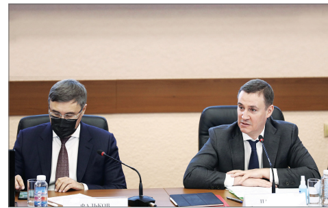
Дмитрий Патрушев и Валерий Фальков на пленарном заседании

В числе инициатив Волгоградского ГАУ федеральный проект агроолимпиада для школьников, грантовая поддержка победителей в форме стипендий на проведение исследований, федеральная программа по агроклассам (нормативно-методическое обеспечение организации агроклассов и их материальное обеспечение), а также запуск программы создания агрокванториумов на базе отраслевых вузов России.