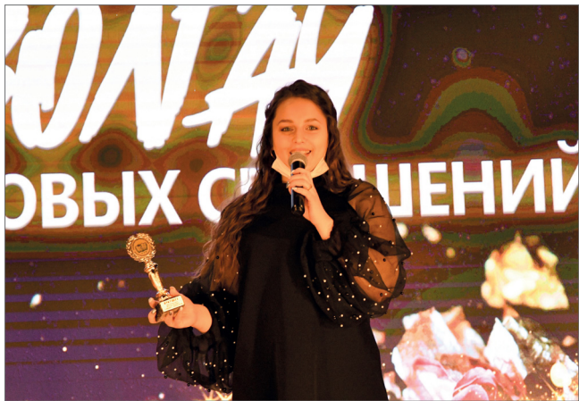
Лидеры уходящего года поблагодарили руководителей вуза за большие возможности

Святая великомученица Татьяна – покровительница всех студентов, именно она приносит удачу на экзаменах и зачетах. В знак благодарности защитнице в День российского студенчества уже 5 лет в ВолГАУ чествуют лучших обучающихся. На заседании Молодежного совета состоялась торжественная церемония передачи полномочий руководителям ведущих студенческих объединений вуза и председателя Ассоциации студентов аграрного университета.