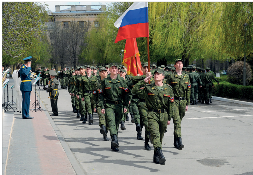
Курсанты – участники праздничного парада ко Дню Победы

– Из Группы советских войск Германии я поступил в Ленинградское артиллерийское училище, – начинает свою историю преподаватель цикла стрельбы и управления