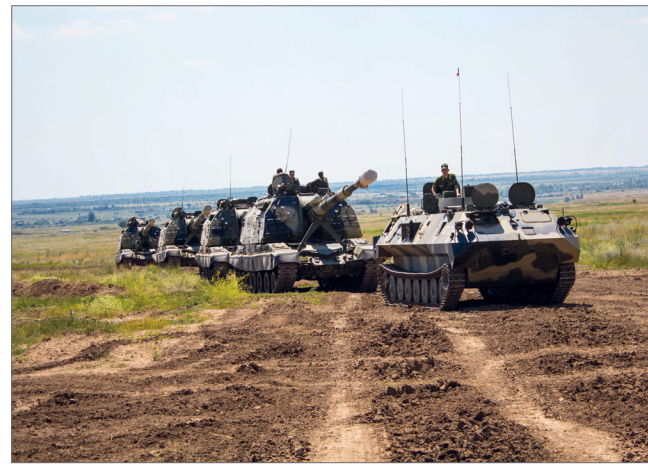
Курсанты ВУЦ закрепляют полученные знания в полевых условиях