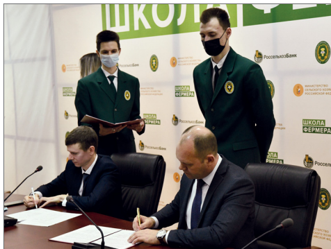
Торжественный момент подписания соглашения

В Волгоградской области пошел к завершению конкурс «Молодые профессионалы». За 4 дня работы в рамках состоявшихся мероприятий деловой программы, прошли соревнования по 64 компетенциям.