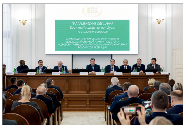
Парламентские слушания комитета Госдумы по аграрным вопросам

Однако получение грантовой поддержки в форме субсидий научными и образовательными организациями невозможно