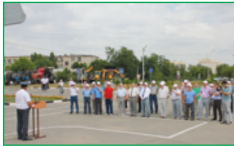
Участники семинара на автотрактородроме Волгоградского ГАУ