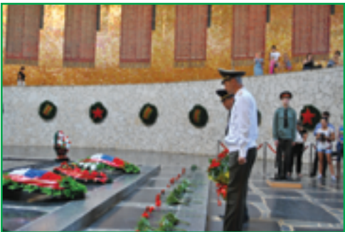
Возложение цветов в Пантеоне славы на Мамаевом кургане.