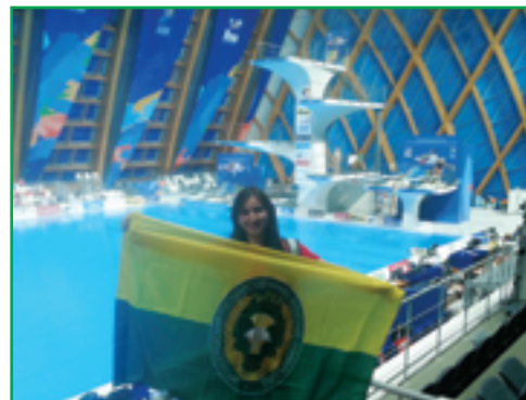
Во Дворце водных видов спорта