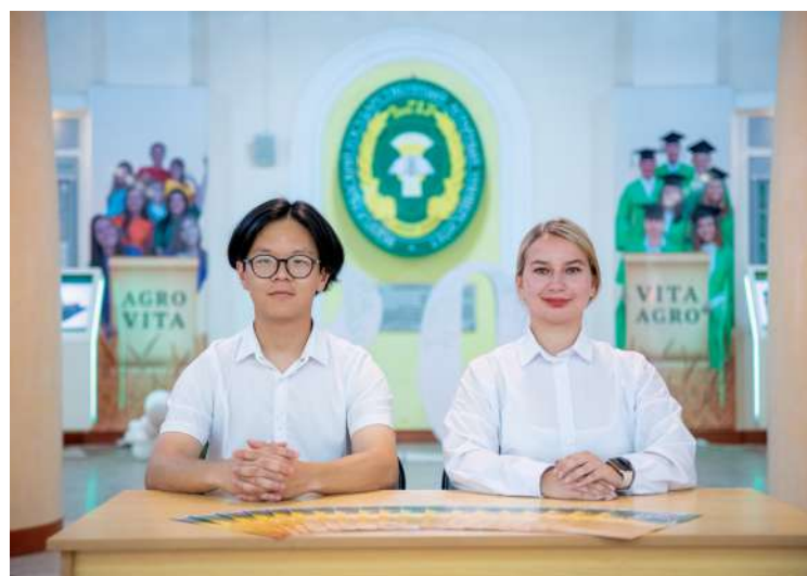
Абитуриентов встречают волонтеры

20 июня в Волгоградском ГАУ стартовала приемная кампания. В университете ждут всех, кто планирует поступать на программы бакалавриата, специалитета, магистратуры, аспирантуры и СПО. При подаче документов сотрудники приемной комиссии подробно расскажут о правилах приемах, выбранных специальностях и ответят на все интересующие вопросы.