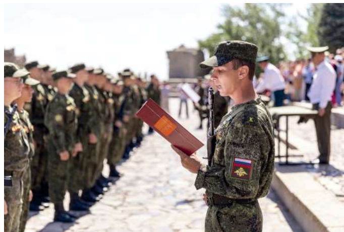
Волнительный момент – клятвы на верность Родине

Завершающим этапом обучения становятся тридцатидневные учебные сборы на полигоне Прудбой. Курсантами выполняются огневые задачи артиллерии с боевой стрельбой, упражнения из стрелкового оружия, метанию гранат. Боевые стрельбы обеспечивает 20-я отдельная мотострелковая бригада Южного военного округа, что позволяет курсантам пройти практическое обучение на реактивных системах и самоходных орудиях. У будущих артиллеристов имеется возможность управлять огнем при боевой стрельбе, пробуя себя в роли офицера. Кроме того, они проводят топогеодезическую привязку на местности, практически изучают технику и вооружение.