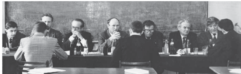
Государственный экзамен на факультете механизации сельского хозяйства

В том, что во время развернувшихся реформ и неоднозначных преобразований девяностых годов наш вуз сумел сохранить все свои структуры, педагогический и студенческий состав и, главное, должный моральный настрой и лучшие традиции коллектива, большая заслуга принадлежит академику, почетному гражданину Волгоградской области Алексею Максимовичу Гаврилову.