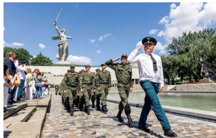
По традиции курсанты ВУЦа принимают присягу на главной высоте России

мной уже не маленький мальчик, а настоящий мужчина, готовый защищать Родину! В этот момент меня переполняет бесконечная любовь к нему, и не только меня, но и еще пятнадцать наших родственников, которые приехали разделить это событие.