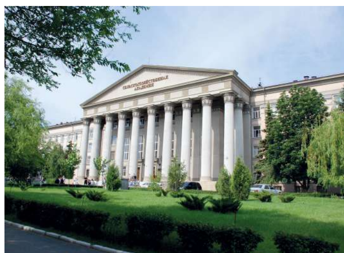
В апреле 1994 г. институт был преобразован в Волгоградскую государственную сельскохозяйственную академию