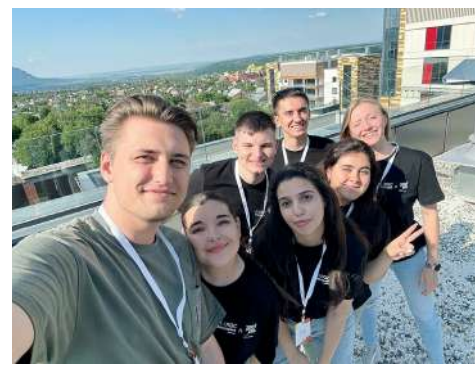
Программа создана для молодых людей, стремящихся к позитивным переменам

Спикерами «Голос Поколения. Студенты» выступили руководители крупных