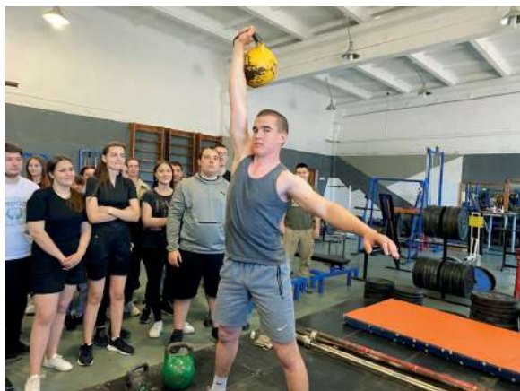
ГИРЕВОЙ СПОРТ: ТЕХНИКА И ТАКТИКА

С целью реализации гранта в размере 3 000 000 рублей в рамках государственной программы Российской Федерации «Научно-технологическое развитие Российской Федерации» кафедрой «Физическая культура и здоровье» разработан проект «Стальная хватка», направленный на развитие и популяризацию силовых видов спорта. Необходимо отметить, что мы – единственный вуз региона – обладатель данной премии. Благодаря предоставленному гранту закуплено оборудование для занятий силовыми видами спорта на сумму 2 000 000 рублей.