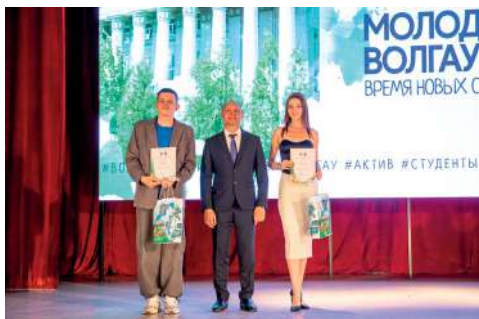
Победители «Мисс и Мистер Студенчество Волгограда» с наградами от ректора