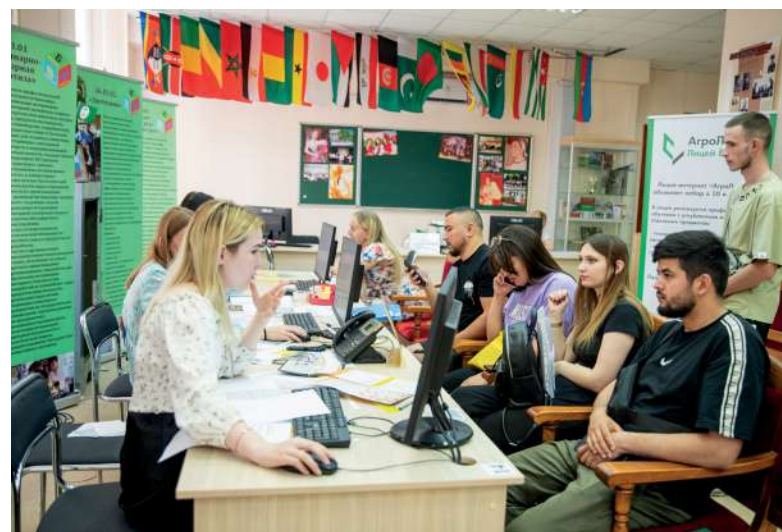
В первый день работы приемной комиссии ВолГАУ посетило более 200 человек

Не упускайте свой шанс и присоединяйтесь к дружной семье Волгоградского аграрного университета.