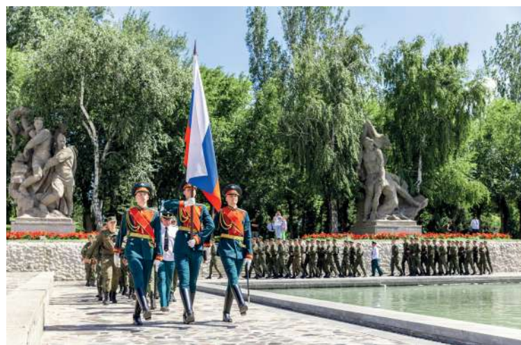
За годы работы Военным учебным центром подготовлено свыше 15 000 офицеров запаса