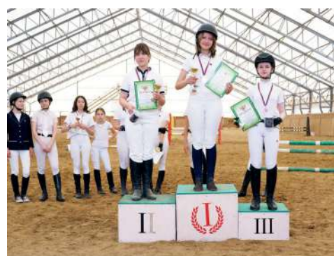
В КОПИЛКЕ ВОЛГАУ ВСЕ ПРИЗОВЫЕ МЕСТА

В конноспортивном клубе «Премьер» прошли первые для данной площадки соревнования по конкуру среди спортсменов-конников Волгограда. Всадники мерились силами на высотах до 80 см. Команда УК КСЦ «Добрыня» отправилась в составе пяти лошадей и десяти всадников. Всего в соревновательный день выступило 76 спортивных пар. И снова результаты нашей команды порадовали – в копилке ВолГАУ I, II и III места.