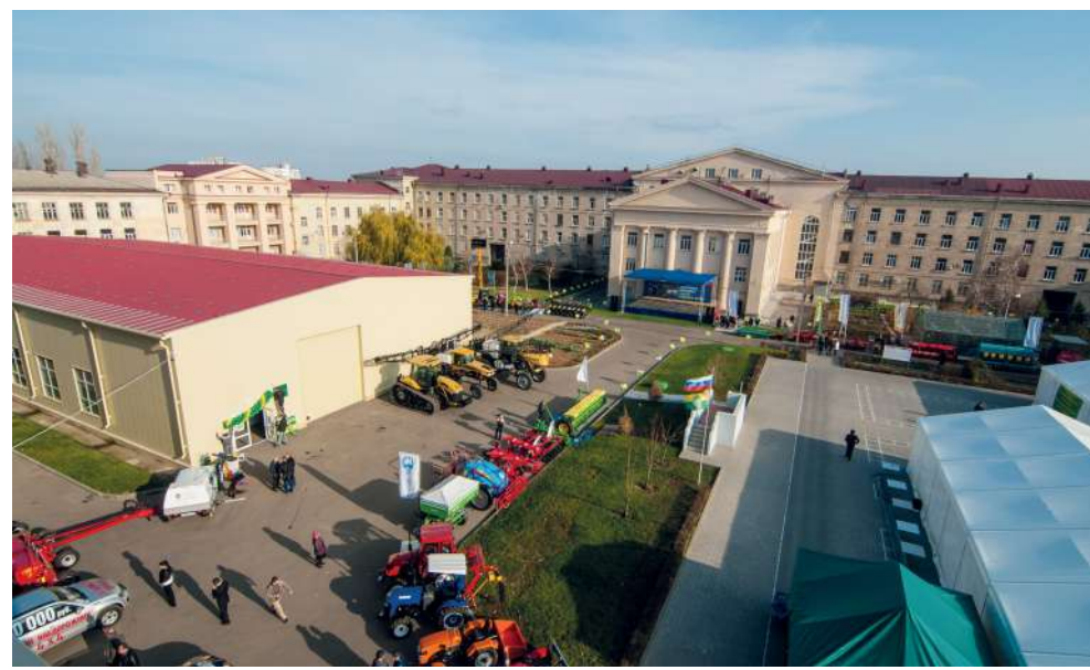
Дни сельского хозяйства Волгоградской области в ВолГАУ

II степени с мечами, орденов Дружбы и Почета, премий за выдающиеся научные и научно-технические достижения. Трижды лауреат регионального конкурса «Лучший менеджер года» в номинации «Наука».