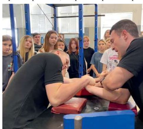
АРМРЕСТЛИНГ: ТЕХНИКА БОРЬБЫ В «КРЮК»

Помимо практических мастер-классов в рамках реализации проекта прошла Стратегическая сессия «Обучение спортивных менеджеров по силовым видам спорта».