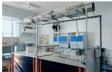
Аэрогидропонная установка для производства миниклубней картофеля

Полученные миниклубни калибруются и высаживают отдельно по фракциям в теплице первого полевого поколения и также ведется размножение до элитного семеноводства, которое в дальнейшем продолжается в полевых условиях.