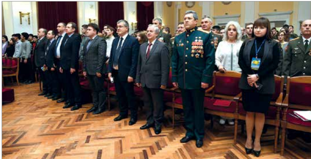
В ВолГАУ стало доброй традицией отмечать День ракетных войск и артиллерии

– В 90-е и 2000-е годы только аграрный университет смог сохранить военную кафедру. До этого она была и в политехническом, и в педагогическом университетах. Именно благодаря усилиям администрации Волгоградского ГАУ, офицерам