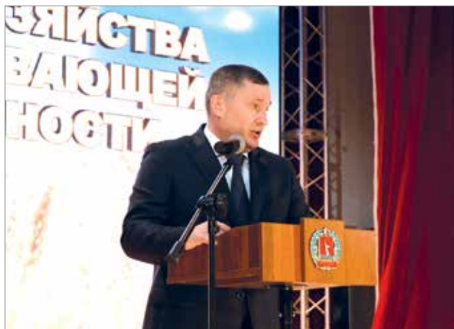
Губернатор Андрей Бочаров подводит итоги года

Итоги сельскохозяйственного года были подведены на торжественном собрании губернатором Андреем Бочаровым. Глава региона дал оценку результатам работы по приоритетным направлениям развития АПК и обозначил задачи на предстоящий период.