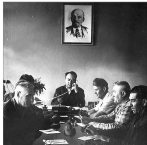
Заседание правления колхоза

А вот какую историю, лучше всего характеризующую председателя, вспоминают односельчане. Однажды он был по своим делам в Волгограде и узнал, что московские художники, которые будут создавать полот-