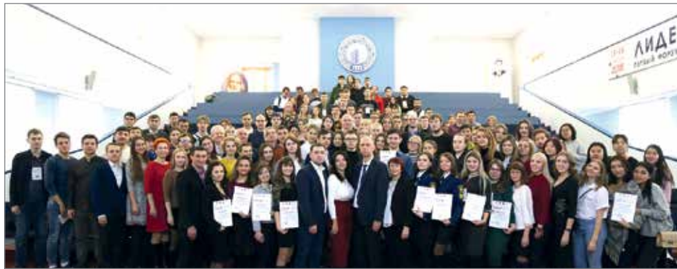
Участники форума «Лидеры перемен»