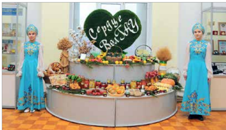
ВолГАУ выпускает широкую линейку собственной продукции