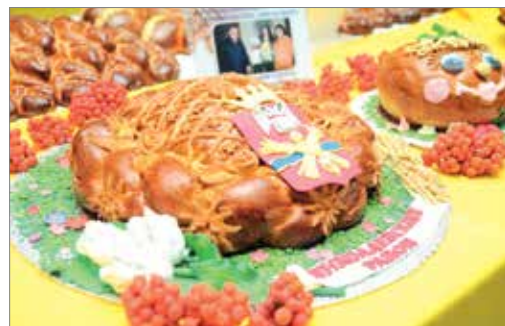
Хлеб – всему голова

При написании текстов использованы материалы сайта администрации Волгоградской области