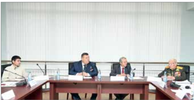
Центральное событие слета — межрегиональный семинар

В ВолГАУ состоялся IV Всероссийский слет патриотических клубов и объединений аграрных вузов «Родная земля». На мероприятии собрались руководители патриотического и гражданско-правового направлений воспитательной деятельности вузов, активисты и члены патриотических клубов и объединений образовательных учреждений Минсельхоза России, а также представители Российского союза сельской молодежи.