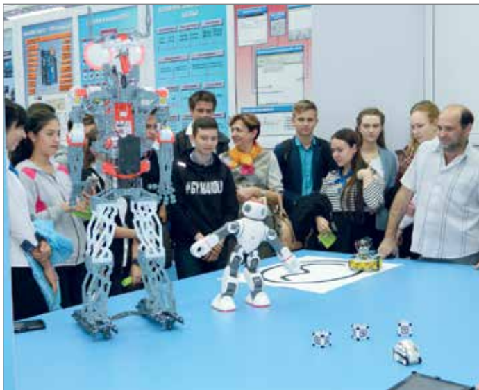
Роботы встречали гостей в День программиста

Мне в руки попало объявление о наборе детей в возрасте 8–14 лет и студентов вуза в клуб «Атом» для занятий в лаборатории «Робототехника, основы электроники и программирования». Эта тема интересовала меня давно: ученые и футурологи много лет предсказывают пришествие эры роботов. Другие – пугают этим. Но оказалось, что роботы гораздо ближе, чем мы думаем: с некоторыми из них можно познакомиться у нас в вузе. Поэтому, отбросив все сомнения, я отправился по адресу, указанному в объявлении.