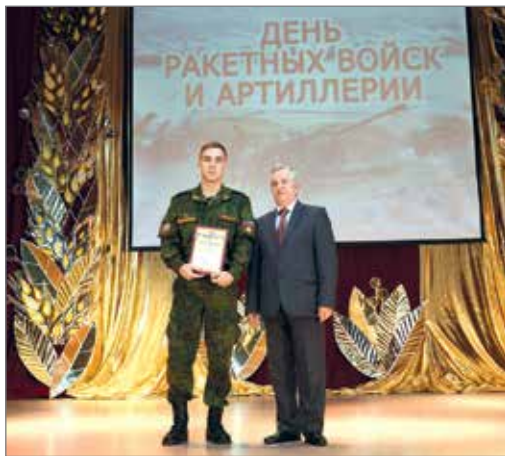
Награждение лучших из лучших

Ежегодно в Волгоградском ГАУ отмечается праздник – День ракетных войск и артиллерии. 19 ноября 1942 года советские войска начали контрнаступление, которое завершилось окружением и разгромом немецких войск под Сталинградом. Большой вклад в эту знаменательную победу внесла именно артиллерия.