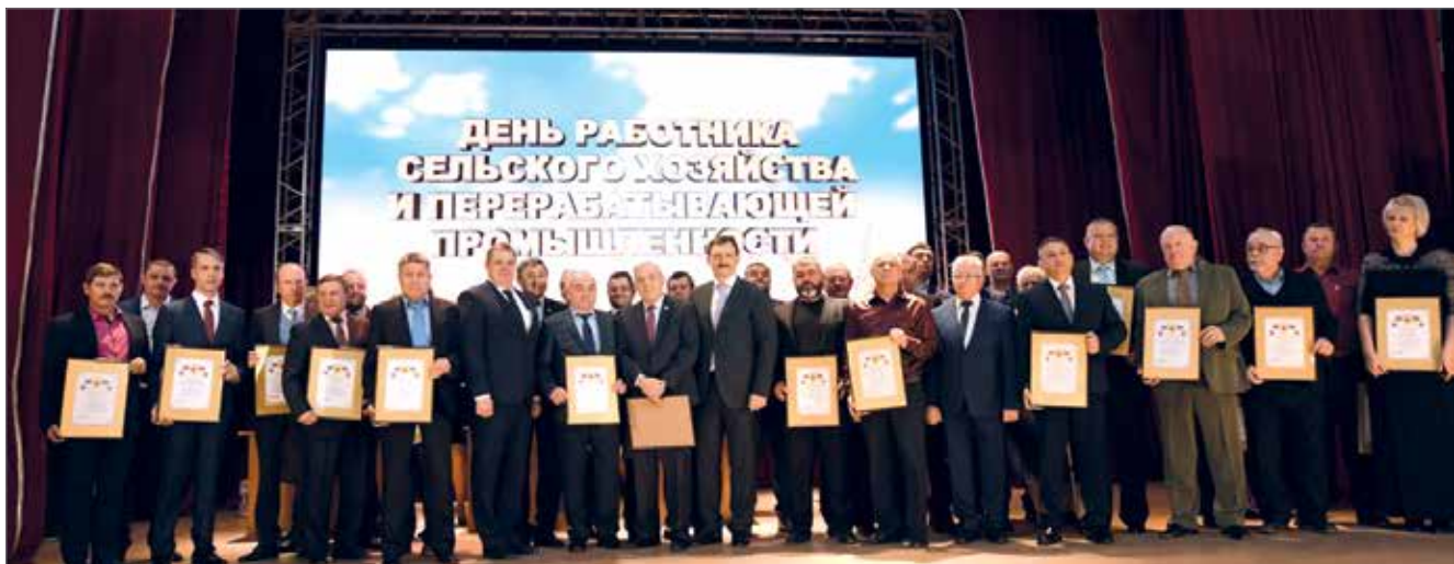
Аграрии, вошедшие в Аллею трудовой славы Волгоградской области