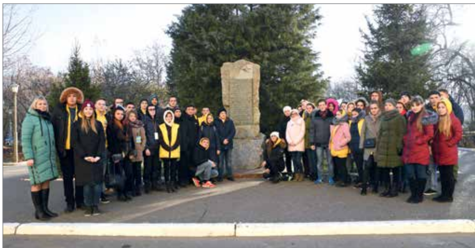
Участники слета возле памятника воинам 35-й Гвардейской дивизии

Также для участников форума подготовили обзорную экскурсию «Город-герой Волгоград» с посещением историко-мемориального комплекса «Героям Сталинградской битвы», экскурсионно-обучающую сессию «Бессмертен подвиг Сталинграда» хроника событий Сталинградской битвы, «Разгром немецко-фашистских войск под Сталинградом». Гости побывали в Калаче-на-Дону на экскурсионно-обучающей сессии «Место соединения двух фронтов, переломный момент Великой Отечественной войны», приняли участие в мастер-классе по работе поискового отряда Волгоградского ГАУ «Сталинград».