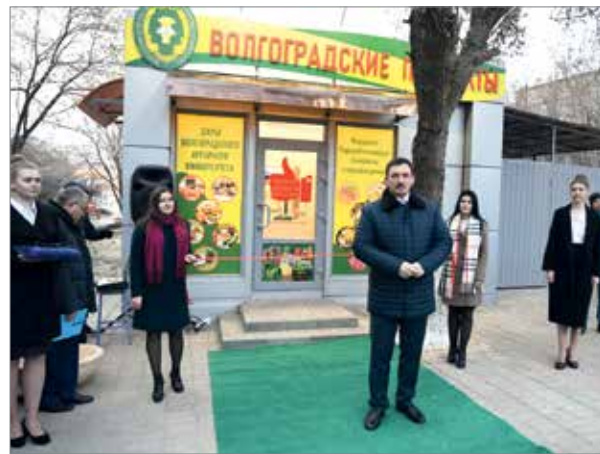
Вице-губернатор В.В. Иванов на открытии специализированного магазина

Важным моментом праздничного дня стало открытие специализированного магазина «Дары университета».