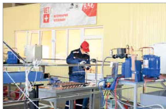
На базе вуза проходили соревнования в четырех компетенциях

Во время проведения регионального чемпионата «Молодые профессионалы» была организована широкая профориентационная работа со школьниками. Детям рассказали о перспективных направлениях обучения, познакомили с современным оборудованием.