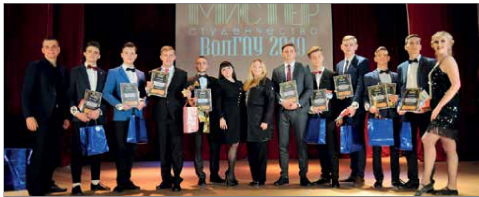
Фото на память: участники конкурса, организаторы, жюри