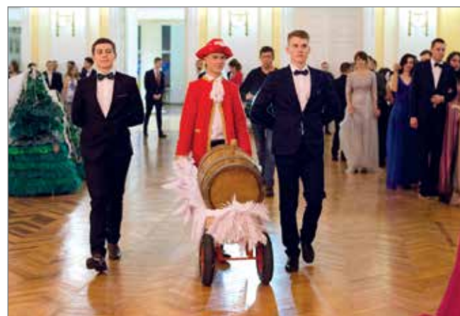
В конце всех угощили ароматной медовухой

Далее состоялось награждение лучших студентов самой почетной наградой – студенческим знаком отличия «Слава и гордость ВолГАУ». Также прошел конкурс Татьян, среди которых выбрали королеву бала, и торжественная передача полномочий вновь избранному руководящему составу молодежных общественных объединений вуза. Насыщенная программа