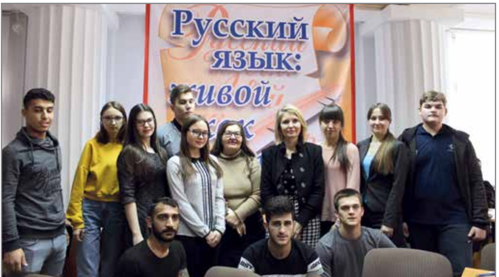
Участниками праздника русского языка стали ребята из ближнего и дальнего зарубежья

Также в рамках праздника состоялся Ректорский диктант «Зимние узоры», целью которого была популяризация грамотности. Звучал полный волшебства и такой родной текст начала гоголевской «Ночи перед Рождеством». Оказалось, что писать этот текст удивительно легко, потому что уже на втором предложении многие стали думать не о желаемой победе в конкурсе, а о волшебстве зимней ночи, о красоте и непостижимой выразитель-