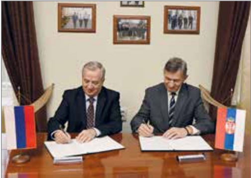
Подписание соглашения о сотрудничестве между ВолГАУ и Институтом животноводства (Белград, Сербия)