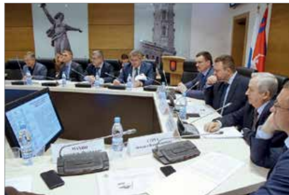
Участники рабочего совещания по развитию хлопководства в Волгоградской области

По мнению экспертов, в нашем регионе созданы условия для успешной реализации этого крупного проекта. Учеными Волгоградского государственного аграрного университета выведен сорт хлопчатника, адаптированный к местным климатическим и природным условиям. Он получил хорошие отзывы на Всероссийской выстав-