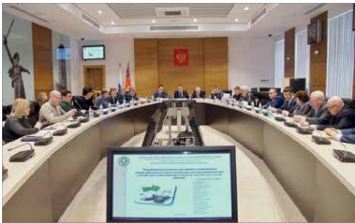
Представители власти, бизнеса и науки оценили перспективы направления

Хлопководство – стратегически важная отрасль не только для волгоградского региона, но и для всей страны. Эта сельскохозяйственная культура обладает большим потенциалом для импортозамещения – обеспечения сырьем отечественных текстильных предприятий – и наращивания экспорта. Это – новые рабочие места, гарантированные доходы, прежде всего, сельских жителей, дополнительные поступления в бюджеты.