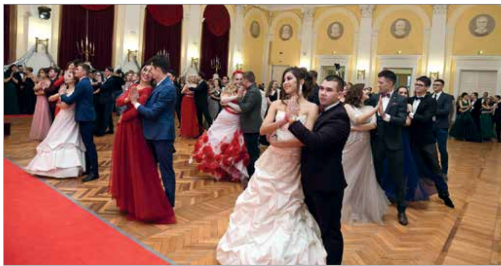
Молодежь 21 века с удовольствием станцевала полонез, мазурку, вальс

Ректорский бал – 2019 останется в памяти всех его участников. А многие из них уже начали готовиться к торжеству – 2020.