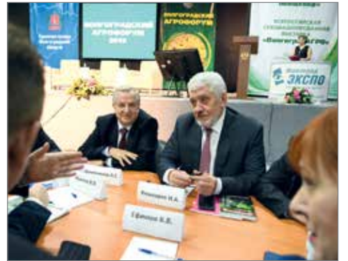
В рамках форума состоялись тематические круглые столы и бизнес-встречи