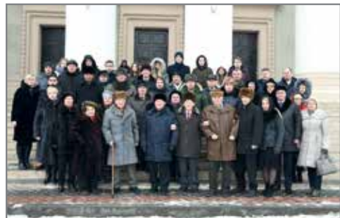
Самые почетные гости в родном вузе

В итоге все присутствующие сошлись во мнении, что работу по написанию общей истории университета необходимо начинать с кафедр и факультетов.