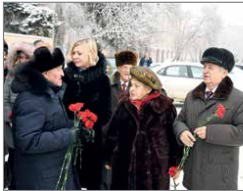
Возложение цветов к памятнику 35-й гвардейской стрелковой дивизии

В Волгоградском государственном аграрном университете прошли торжественные мероприятия, посвященные 76-й годовщине Победы в Сталинградской битве. Самыми почетными гостями стали ветераны ВОВ, участники Сталинградской битвы и труженики тыла, дети военного Сталинграда. Несмотря на солидный возраст, они ежегодно в канун 2 февраля приходят в родной университет.