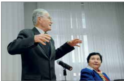
Ветераны вуза активно озвучивали свои инициативы

В Волгоградском ГАУ стартовали мероприятия, посвященные 75-летию юбилею вуза. Руководство университета перенесло встречу с Советом ветеранов учебного учреждения. С заслуженными работниками говорили о сохранении традиций, интересных подробностях того или иного исторического периода вуза, интересовались их мнением по поводу образовательного и воспитательного процесса.