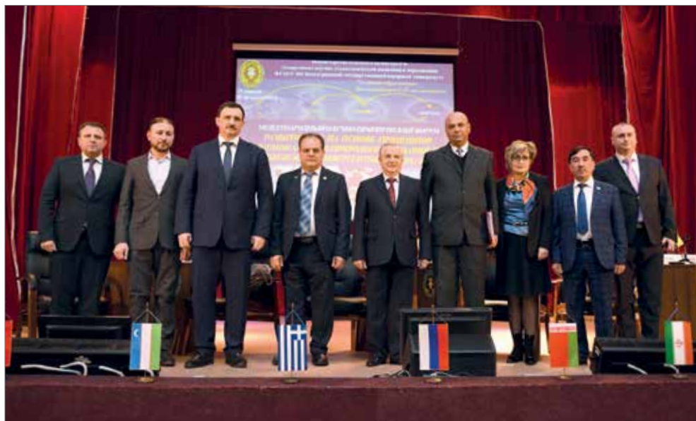
Участники международного форума

рация юга России», «Переход к высокопродуктивному и экологически чистому агро- и аквахозяйству», «Инновационные технологии в растениеводстве», «Перерабатывающие предприятия АПК в условиях цифровизации» и многие другие. В год 75-летия ВолГАУ традиционное мероприятие прошло в новом формате: работали 16 секций и 8 дискуссионных площадок, а также стендовые и онлайн-сессии. В рамках форума особое внимание было уделено исследованиям, связанным с развитием животноводства. Напомним, новые задачи в отрасли были поставлены на выездном совещании Совета при губернаторе Волгоградской области по вопросам развития сельских территорий и агропромышленного комплекса. Учеными подготовлены доклады о формировании единой электронной базы племенного учета хозяйств Волгоградской области; инновационно-ориентированном молочном скотоводстве; использовании цифровых технологий в управлении производственным процессом в животноводстве. Кроме того, на мероприятии обсуждались вопросы развития лесного хозяйства, прогрессивные технологии переработки сельхозпродукции, использования техники, цифровизации АПК. « В этом году ВолГАУ отмечает юбилей: 75 лет наш университет стоит на страже