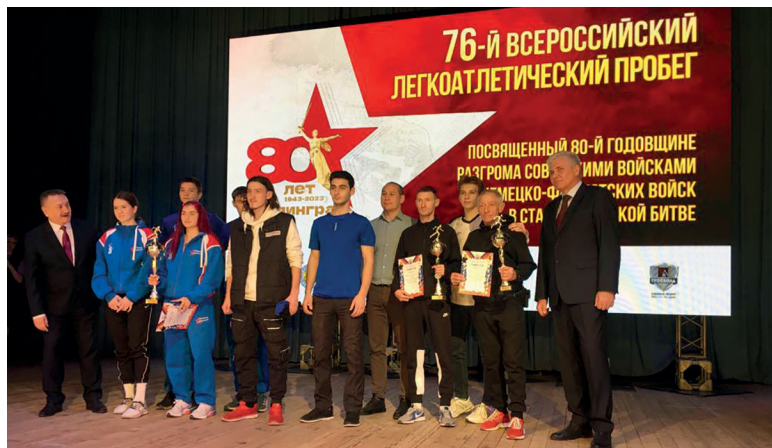
Среди награжденных — преподаватели и студенты Волгоградского ГАУ

Мероприятие не обошлось без именитых спортсменов и представителей администрации Волгограда. Поздравить участни-