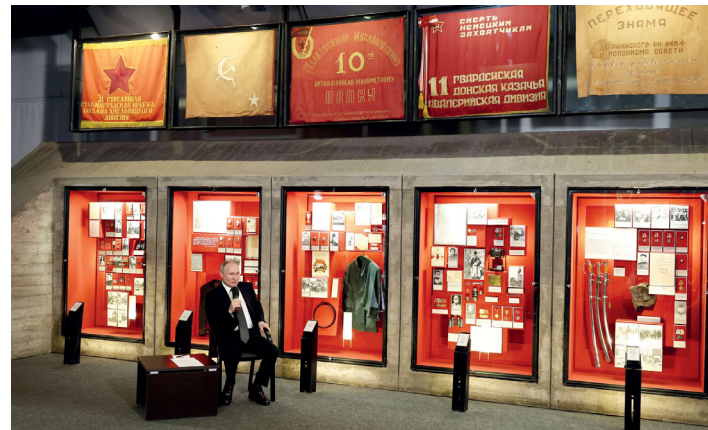
Президент России Владимир Путин в музее-панораме «Сталинградская битва» на встрече с молодежью

Это сражение было не просто сражением за город – на кону стояло само существование истерзанной, но не покорённой страны, определялся исход не только Великой Отечественной, но и всей Второй мировой войны, и это чувствовал, осознал каждый и в окопах, и в тылу. Мы, как это уже не раз бывало в нашей истории, сплотились в решающей схватке и победили.