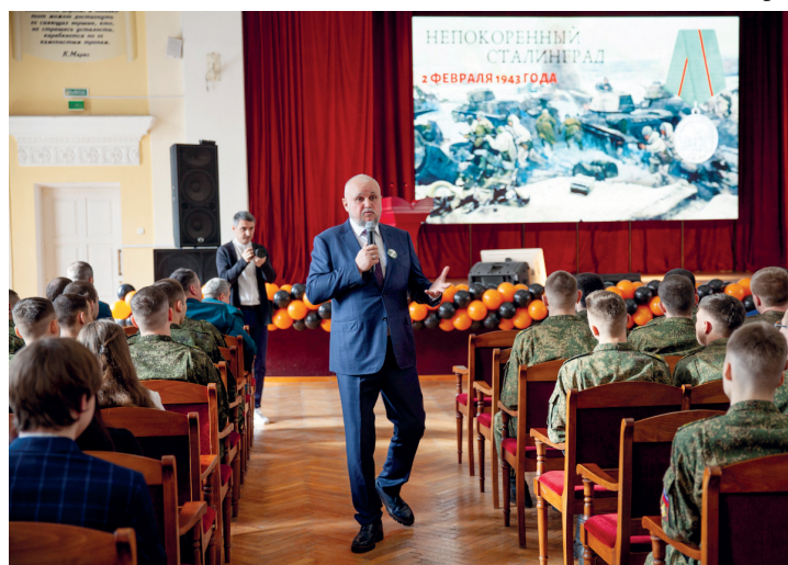
Губернатор Кузбасса Сергей Цивилев во время общения со студентами Волгоградского ГАУ

Очевидцы смогли увидеть современную и модернизированную военную технику, в том числе боевую машину пехоты БМП-1АМ «Басурманин» с новым боевым модулем, БМП-2М с модулем «Бережок», БМП-3, бронетранспортеры БТР-82А, танки Т-90М «Прорыв», пикапы на базе УАЗ «Патриот», спецавтомобили военной автоинспекции и военной полиции, а также «Урал-4320» с 122-мм орудиями Д-30 и 152-мм гаубицами «Гиацинт-Б».