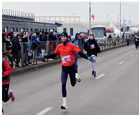
На дистанции легкоатлетического пробега

1 февраля тысячи волгоградцев вышли на старт 76-го Всероссийского легкоатлетического пробега, посвященного 80-й годовщине разгрома советскими войсками немецко-фашистских войск в Сталинградской битве. Мероприятие началось с возложения цветов к памятному знаку героям Волжской военной флотилии. Вместе со всеми отметили Великую Победу и отдали дань памяти защитникам Сталинграда и спортсмены Волгоградского государственного аграрного университета.