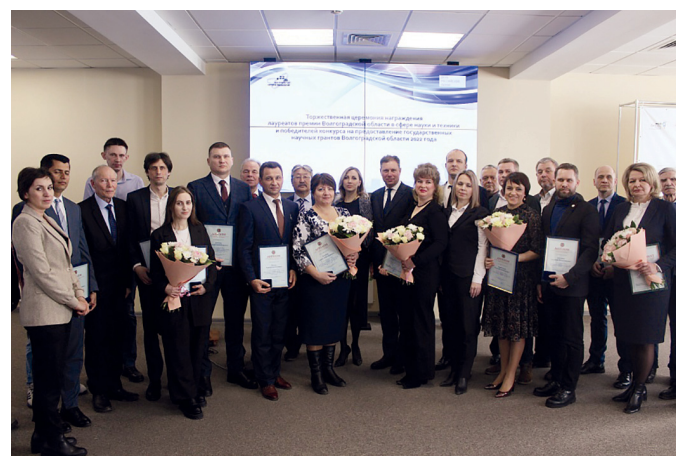
Лауреаты премии Волгоградской области в сфере науки и техники

Разработкой специалисты занимаются около двух лет. В планах увеличить количество рыбы для наблюдений. На это и направ-