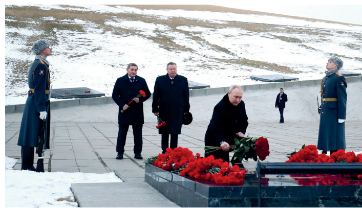
Владимир Путин на главной высоте России – Мамеевом кургане

Владимир Путин в Волгограде встретился с представителями общественных патриотических и молодёжных организаций