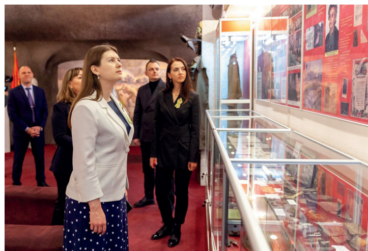
Депутат ГД РФ Ольга Занко в Зале боевой славы

Всероссийское движение «Бессмертный полк» – Общероссийское общественное гражданско-патриотическое движение объединяет 80 региональных отделений и более 200 международных координаторов на всех