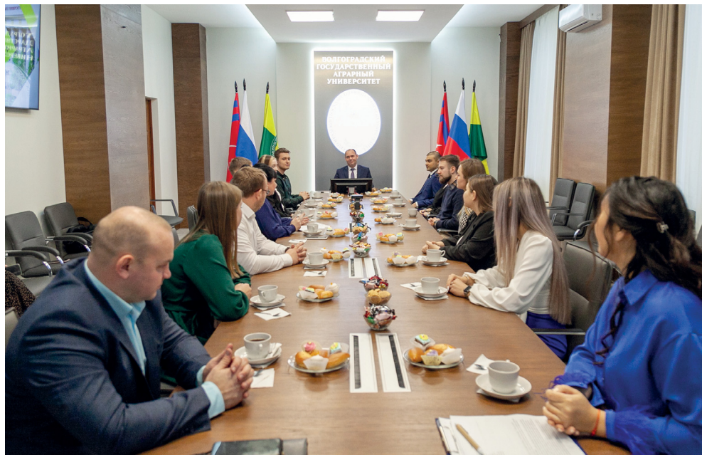
ВМЕСТЕ С РЕКТОРОМ ЗА ОДНИМ СТОЛОМ — ЛУЧШИЕ СТУДЕНТЫ, СОТРУДНИКИ И МОЛОДЫЕ УЧЕНЫЕ