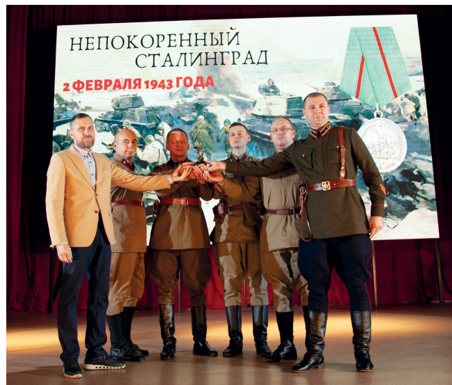
На базе ВолГАУ открыт реконструкционный клуб им. генерала В. А. Глазкова

Организация «Клубы исторической реконструкции России» создана в сентябре 2018 года и сегодня объединяет клубы исторической реконструкции по всей России. Работа ООД «Росрекон» строится на принципах сотрудничества и ориентированности на результат. Движение стремится стать сервисной площадкой для оказания методической, теоретической и практической поддержки реконструкции в стране и за рубежом, выступая навигатором в профильной работе военно-исто-