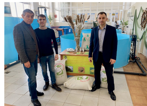
Сотрудники ВолГАУ разработали проект, позволяющий сформировать новый рынок экологически чистого и дешевого сырья