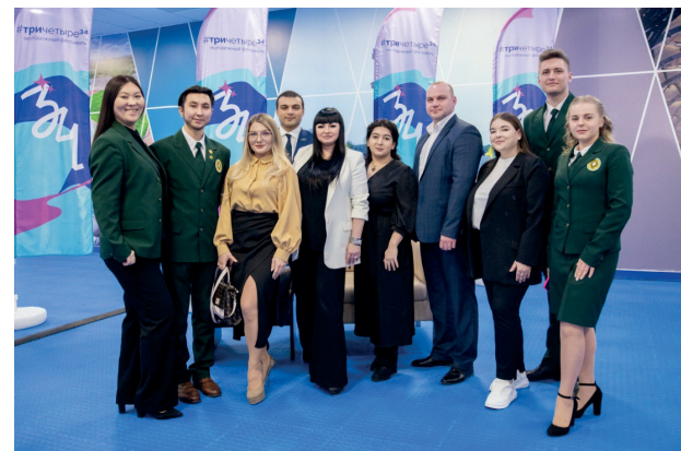
Команда Волгоградского ГАУ приняла участие в обсуждении программы молодёжного фестиваля