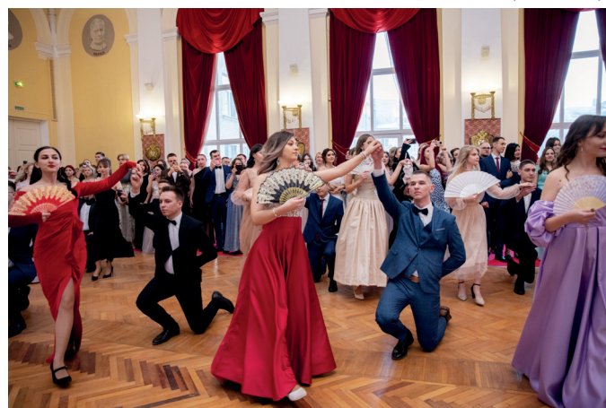
В День российского студенчества в вузе проходит одно из самых красивых событий – ректорский бал

К торжеству готовились со всей ответственностью, холл украсили фотозонами факультетов, а гости задолго до начала вели светские беседы.