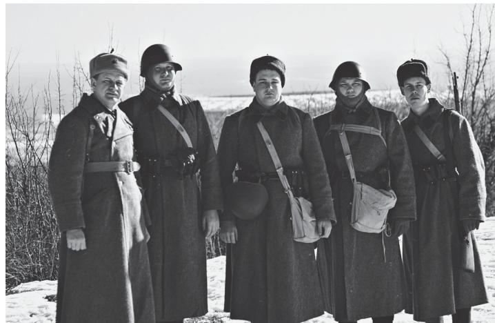
Участниками реконструкции на Мамаевом кургане стали представители ВолГАУ

На главной высоте России – Мамаевом кургане – более 100 реконструкторов воссоздали эпизод операции «Кольцо». События 26 января 1943 года воссоздали представители Общероссийского движе-