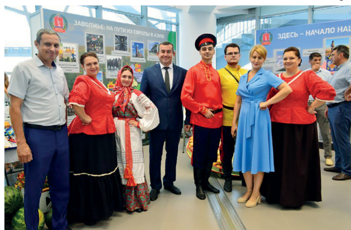
Фестиваль «Волга-Дон Агро Фест» на площадке «Волгоград Арена»

Проведут сортоиспытания хлопчатника сортов отечественной и зарубежной селекции на научно-производственной базе ФАНЦ РД в Хасавюртовском районе. По итогам научных исследований будут подготовлены рекомендации по возделыванию хлопчатника.