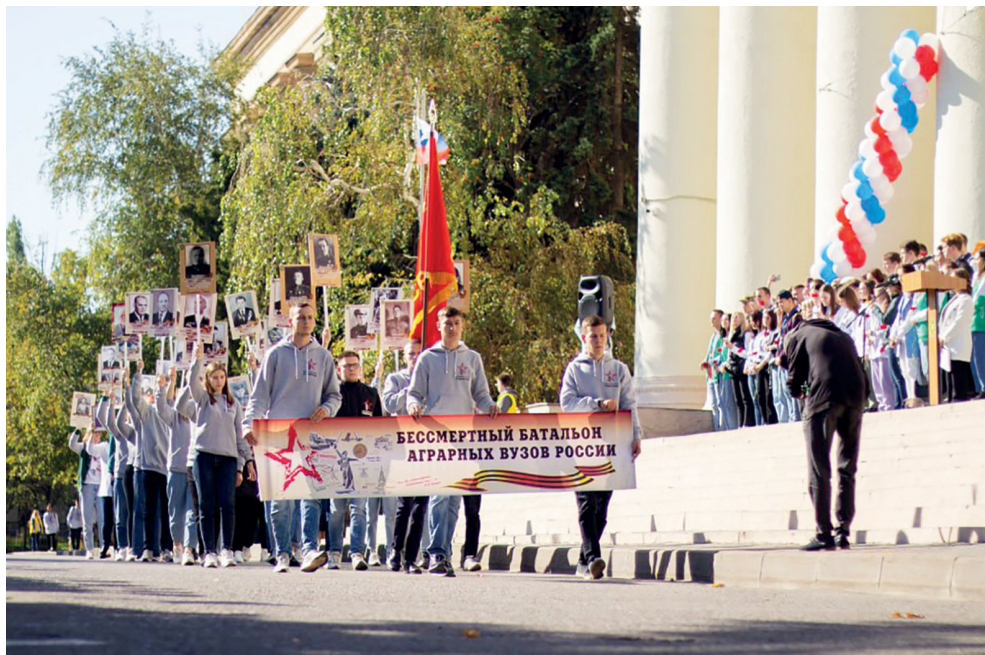
Шествие «Бессмертный батальон аграрных вузов России» — одна из патриотических традиций вуза

– Именно в Сталинграде был издан приказ «Ни шагу назад», и его исполняли беспрекословно. Бойцы стояли за каждую улицу, за каждый участок здания, за каждый этаж. Я, как поисковик с опытом, могу сказать то, что здесь история буквально на каждом шагу. Помню, в 2018 году во время слета патриотических клубов у нас в университете мы показывали нашим приезжим товарищам, как мы работаем с металлоискателями. На футбольном поле мы нашли бойца-красноармейца. Конечно, дети Сталинграда пережили много потрясений: у них должно было быть беззаботное детство, а оно прошло на войне. У меня самого прабабушка ребенок войны. Она жила в Сталинграде, в поселке Гумрак. Ее история заставляет за-