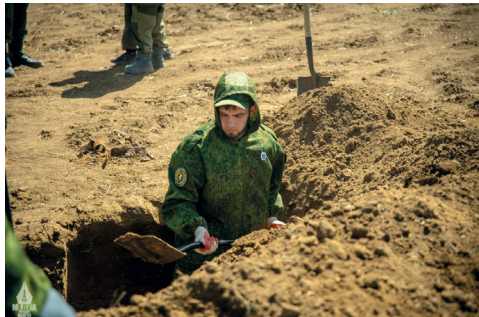
Бойцы студотряда «Сталинград» ВолГАУ на раскопках

Так когда-то написал о Сталинграде знаменитый чилийский поэт. И это заслуженно. В военном Сталинграде были мужественны все – солдаты и офицеры, сражавшиеся за каждый дюйм земли, старики и дети, стоявшие у станков на заводах, малыши и их матери, скрывающиеся от обстрелов в подвалах, но непокоренные.