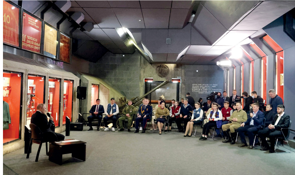
Владимир Путин: «Наша главная задача – обеспечить сохранение России, создать условия для её поступательного развития, для её укрепления»

С праздником вас, с праздником торжества жизни и справедливости!