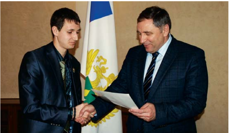
Благодарственное письмо вручает зам. Министра сельского хозяйства РФ Александр Петриков

На следующий день после финала с капитанами команд-участниц встретился статс-секретарь, заместитель Министра сельского хозяйства РФ Александр Петриков. Обращаясь к студентам, он отметил, что в современных условиях аграрная молодежь должна знать механизмы, действующие в странах-участницах Всемирной торговой организации, чтобы новые проекты отвечали мировым требованиям и были конкурентоспособными. «Необходимо создать прослойку креативных молодых специалистов, которые будут двигать вперед отечественный АПК», – отметил Александр Васильевич.