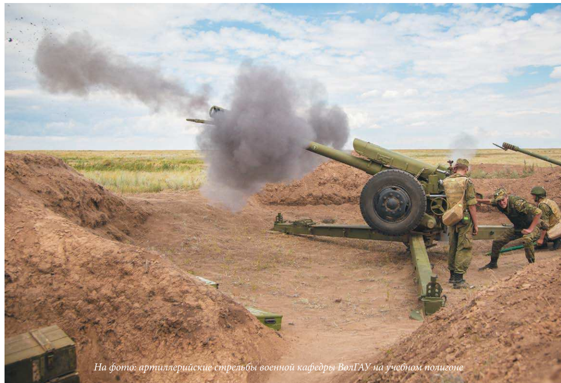
На фото: артиллерийские стрельбы на учебном полигоне