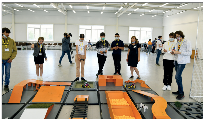
Пробный заезд на полигоне роботов

– Быть первым, конечно, волнительно, но у меня получилось справиться с эмоциями. Я уже пробовал управлять коптерами, но не такими. В школе мы учимся запускать подобные аппараты, но те, с которыми пришлось познакомиться здесь, сложнее и функций у них больше. Еще не определился с будущей профессией, но опыт участия в конкурсе может повлиять на мой выбор. Знаю, что коптеры сейчас широко