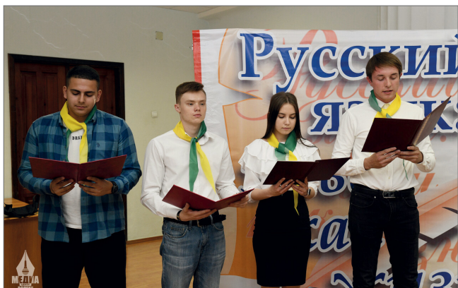
Поэтические конкурсы и обсуждения поэзии — непременный атрибут каждого праздника

В течение нескольких дней студенты и приглашенные гости участвовали в ярких, интересных мероприятиях – конкурсе каллиграфии, ректорском диктанте, литературной гостиной «Наш Сталинград» и т. д. В рамках торжественного открытия состоялось подписание соглашения о сотрудничестве с городским молодежным центром «Лидер».