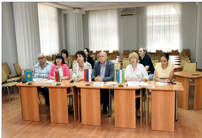
Международный круглый стол, посвященный 80-летию начала Великой Отечественной войны, прошел в онлайн-формате

Основные задачи мероприятия – формирование поликультурного образовательного пространства на основе ди-