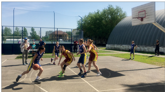
Студенты ВолГАУ стали бронзовыми призерами XIV летних игр вузов региона

После двухлетнего перерыва 15 мая спортивные площадки физкультурно-спортивного комплекса рабочего поселка Средняя Ахтуба вновь приняли участников XIV летних игр студенческой молодежи образовательных организаций высшего образования Волгоградской области. По итогам состязаний команда Волгоградского государственного аграрного университета вошла в тройку лидеров.