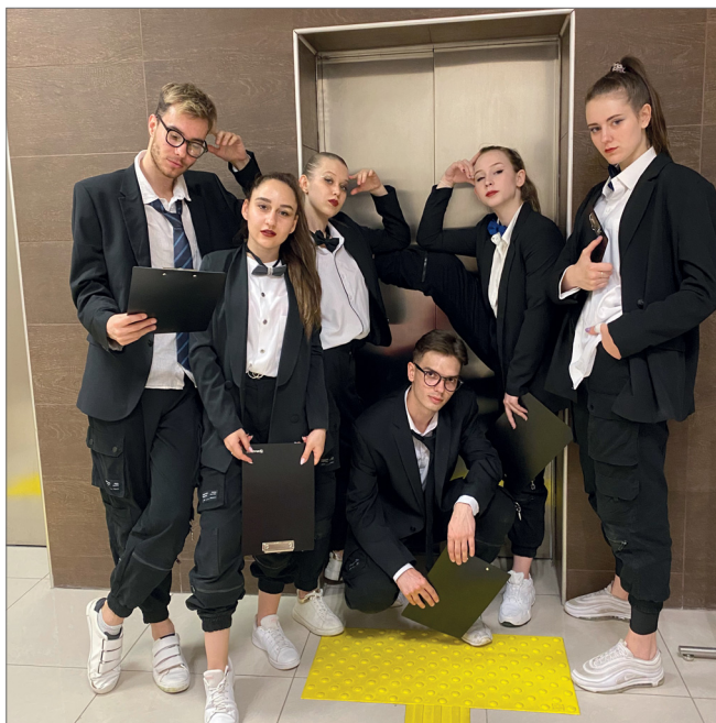
Триумфатор фестиваля — коллектив современного танца «Big Shot»

Делегация Волгоградского ГАУ с успехом выступила на VIII фестивале студенческого творчества среди вузов Минсельхоза России «Казань-2021». В этом году участниками мероприятия стали почти 500 человек из 38 аграрных учебных заведений России. Город-герой на Волге представляли 20 студентов в 4 направлениях – вокальное, театральное, оригинальный жанр и танцевальное.