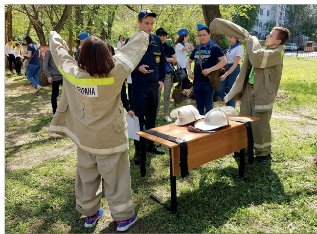
В перечень испытаний входила и примерка боевой одежды пожарных

В старшей группе победителями стали юные пожарные МОУ СШ № 27, второе место – МОУ СШ № 61 и МОУ СШ № 94, третье – МОУ СШ № 26.