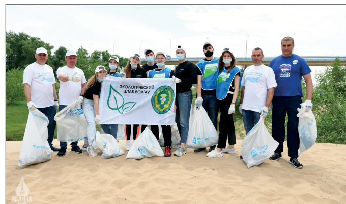
Активисты экоштаба ВолГАУ на уборке береговой линии в Среднеахтубинском районе