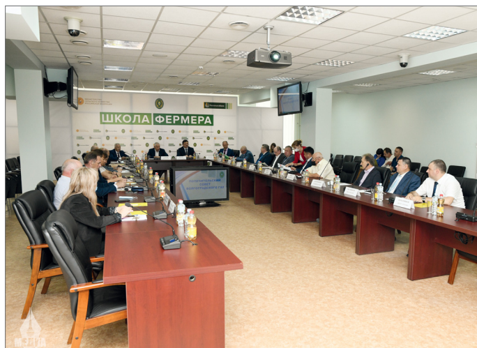
На заседании собрались представители исполнительной и законодательной власти, крупнейшие сельхозтоваропроизводители региона

В Волгоградском ГАУ состоялось плановое заседание попечительского совета университета. Основными темами обсуждения стали научные исследования студентов и профессорско-преподавательского состава вуза, программы обучения, сформированные совместно с базовыми организациями.