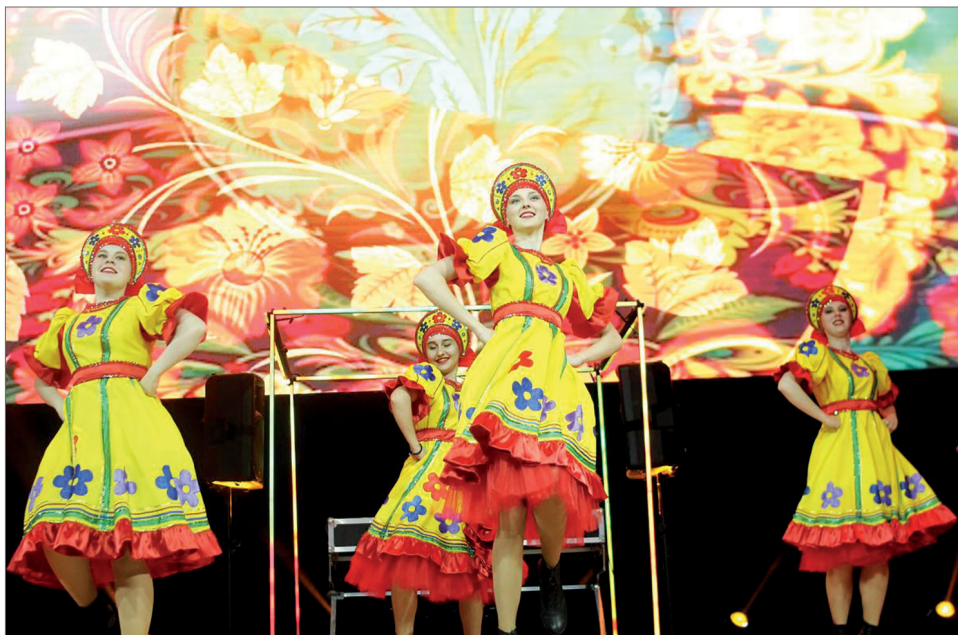
Хореографическая группа народного ансамбля песни и пляски «Золотой колос».

Фестиваль проходил в Казани с 13 по 16 мая на базе ФГБОУ ВО «Казанский государственный аграрный университет» и ФГБОУ ВО «Казанская государственная академия ветеринарной медицины». Перед отъездом творче-