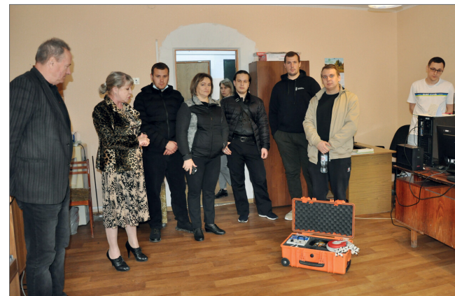
Наглядное знакомство с оборудованием, которое помогает следить за состоянием лесов

Специалисты ФБУ «Рослесозащита» – «Центр защиты леса Волгоградской области» включили в план своих работ лесопатологическое обследование насаждений перед главным корпусом ВолГАУ, что позволит продемонстрировать обучающимся новейшие приборы и передовое оборудование.