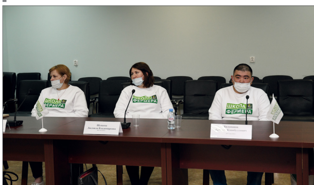
Обучение прошли порядка 20 человек по направлениям «Овощеводство» и «Молочное животноводство»

Завершилось обучение первого потока «Школы фермера», которое осуществлялось на базе ВолГАУ. Принято решение о выделении грантов по триста тысяч рублей трем выпускникам, которые подготовили лучшие проекты по развитию своих КФХ. В сентябре текущего года стартуют занятия со вторым потоком – повысить свою квалификацию смогут в два раза больше аграриев.