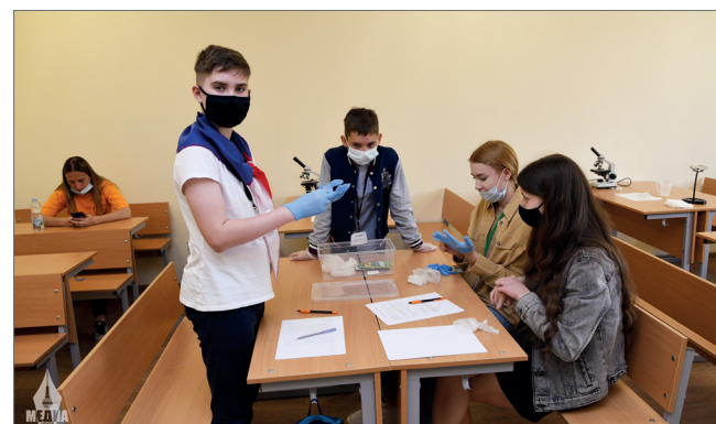
Нововведением-2021 стал конкурс по направлению «АгроБио»

По итогам конкурса в каждом направлении было выбрано 6 человек, показавших лучшие результаты работы. Они будут защищать Южный федеральный округ на Всероссийском финале конкурса «АгроНТИ-2021».