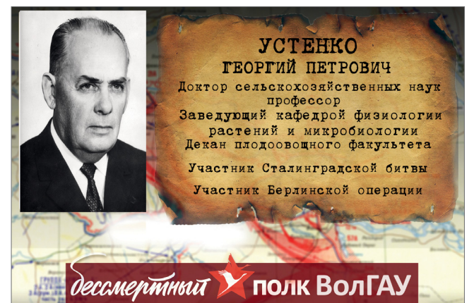
Студенты организовали в интернет-пространстве целый ряд акций, посвященных Дню Победы

Не остались в стороне и факультеты. Так, студенты АТФ запустили онлайн-эстафету «Мой город-герой» – ребята рассказывали о малых городах региона: как они пережили военное лихолетье, какой вклад внесли в общее дело. На страничках ИТФ размещались биографии Героев Советского Союза, совершивших подвиги в годы Великой Отечественной войны – многим из них на тот момент было не больше лет, чем сегодняшним студентам. На факультете биотехнологий и ветеринарной медицины подготовили материалы о различных профессиях, востребованных в годы войны. И конечно, обучающиеся всех направлений делились историями о своих