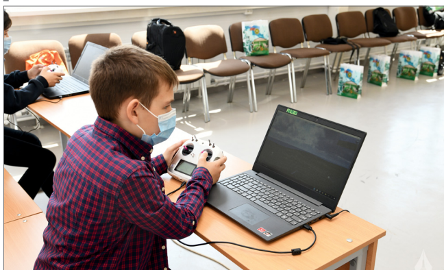
Участники тренировались управлять коптером на тренажерах

На заочный региональный этап «АгроНТИ-2021» поступило свыше двух тысяч заявок, на очные соревнования в ВолГАУ, который вот уже третий год является площадкой для проведения конкурса в ЮФО, прибыли 100 школьников, лучше всех справившихся с тестовыми заданиями. В этот раз к направлениям «АгроРоботы», «АгроМетео», «АгроКосмос», «АгроКоптеры» добавилось и «АгроБио». Кроме того, операторы коптеров, роботов и агротеплиц должны были работать в тесной коллаборации друг с другом.