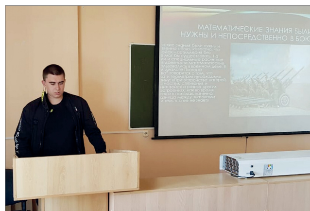
Победа вершилась не только на фронте, но и в научных лабораториях

12 мая в Волгоградском ГАУ преподавателями кафедры высшей математики был организован круглый стол «Математики и их открытия в годы Великой Отечественной войны» в честь 76-й годовщины Великой Победы.