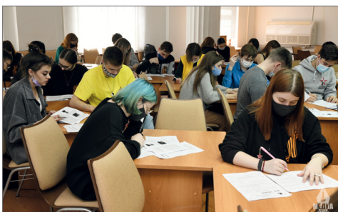
ВолГАУ стал одной из 150 площадок диктанта в регионе

Акция стартовала 29 апреля на 16 тысячах площадок в 80 странах мира. Первыми участниками стали жители Дальнего Востока и других регионов, разница с московским временем в которых составляет от шести до девяти часов. Проверили свои знания истории и представители Волгоградского государственного аграрного университета.