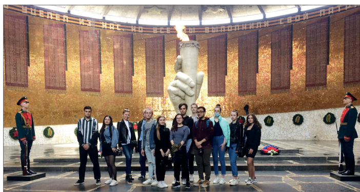
Студенты направления «Туризм» узнают секреты главной высоты России

Подобные экскурсии способствуют закреплению теоретических знаний и помогают освоить практические навыки, повышают интерес к профессии и позволяют студентам расширить свой кругозор.