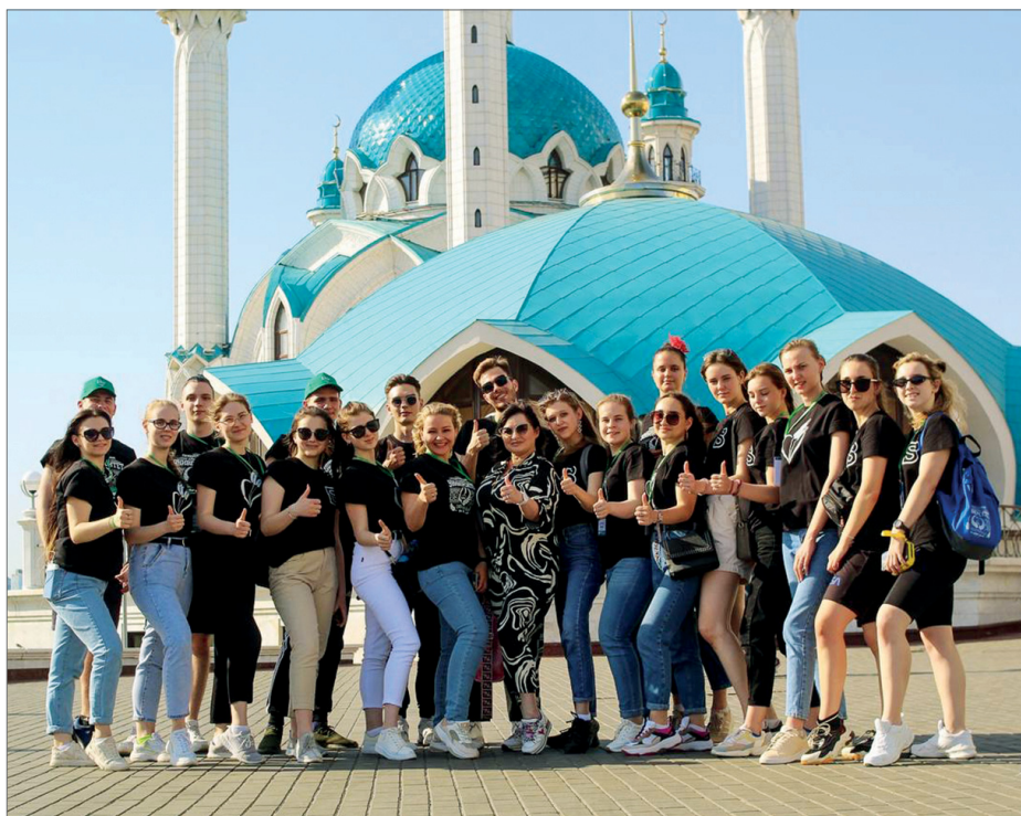
Фестиваль — это не только выступления, но и новые знакомства, обмен опытом, экскурсии по прекрасному городу

– Я хотел бы поздравить артистов ансамбля «Золотой колос» с премьерой трех номеров – в Казани они впервые были исполнены на сцене. Результат неплохой. За месяц сделать три постановки – это, конечно, непростая задача. Но все помогли, студенты работали от души. Еще один плюс – благодаря администрации университета нам пошили новые костюмы, которые хорошо сыграли