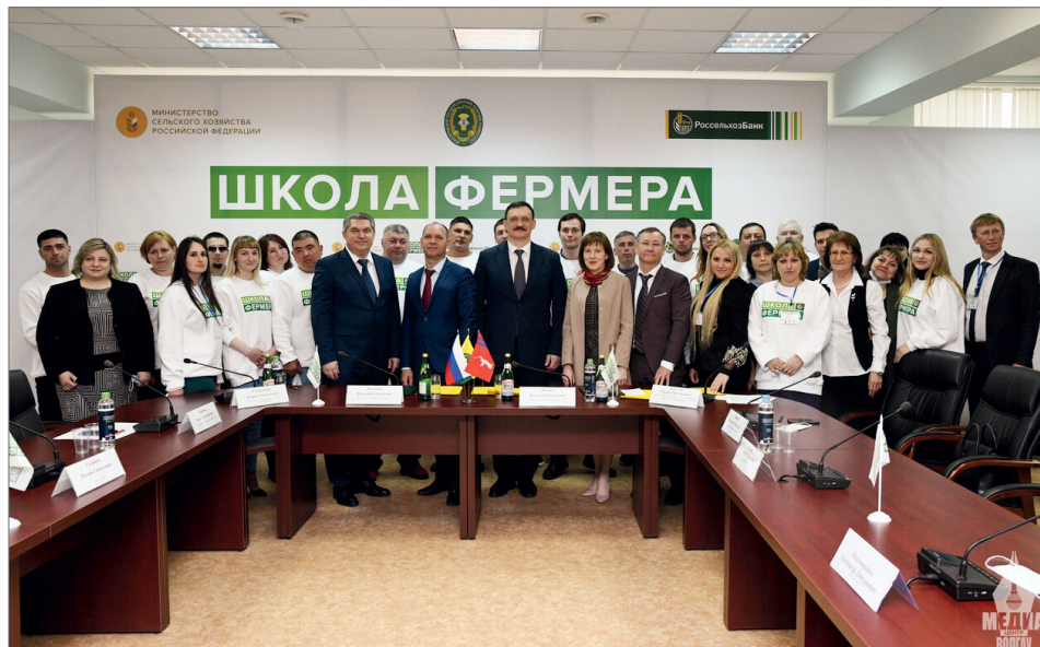
Исторический момент – первый выпуск «Школы фермера» в Волгоградском ГАУ

– В 90-х гг. прошлого века я принимал участие в процессе становления фермерства региона. Помню, как непросто все происходило, какими несбыточными казались мечты о прибыльном производстве, а сегодня это успешные предприятия с многомиллионными оборотами. В настоящее время половину земли области обрабатывают именно крестьянско-фермерские хозяйства. Волгоградский государственный аграрный университет давно и успешно занимается переподготовкой сельхозтоваропроизводителей, но сейчас мы вышли на новый уровень и будем дальше развиваться в этом направлении.