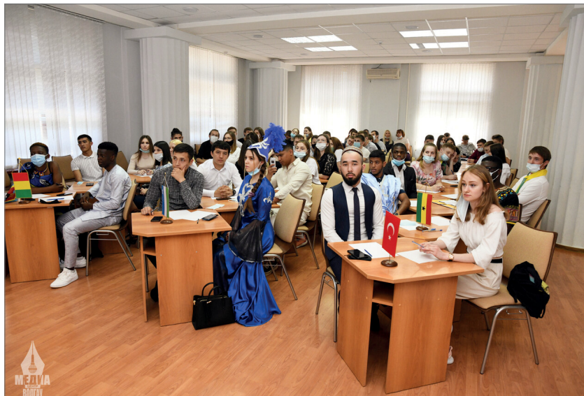
В мероприятии ежегодно принимают участие иностранные студенты

Кроме того, в рамках праздника состоялись значимые для культурной жизни университета мероприятия, среди которых следует особо отметить конкурсы «Кириллическая каллиграфия», «Сердце, равнодушное к Слову», «И славен буду я, доколь в подлунном мире жив будет хоть один пиит», викторину «Знамя Победы», а также литературную гостиную «Наш Сталинград». Молодые люди, заинтересовавшиеся «Кириллической каллиграфией», писали перьевыми ручками с нажимом и наклоном, демонстрируя изящество и индивидуальность. Также прошла выставка книг, посвященных духовной культуре Руси, демонстрировались фильмы, посвященные мастер-классам по каллиграфии и древнерусскому