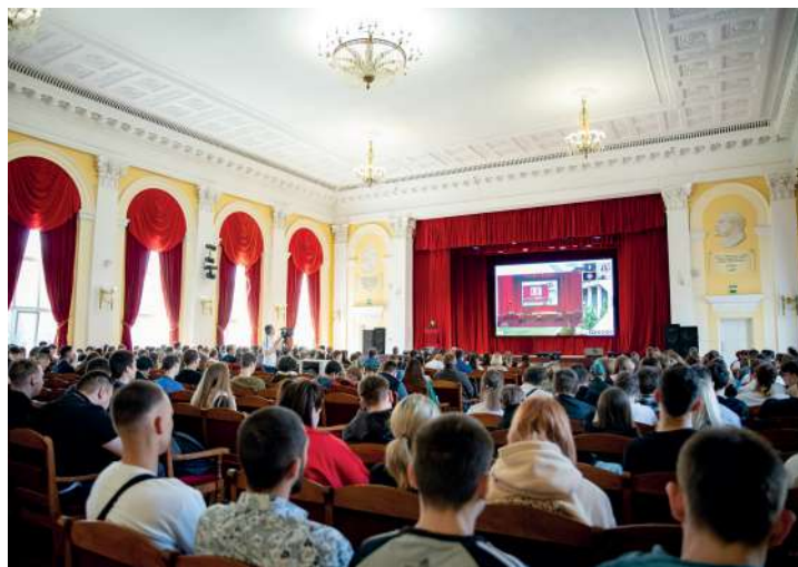
Для участия в Бизнес-акселераторе зарегистрировалось более 550 обучающихся Волгоградского ГАУ

Поздравляем участников, наставников и экспертов с началом работы и желаем плодотворной и эффективной работы!