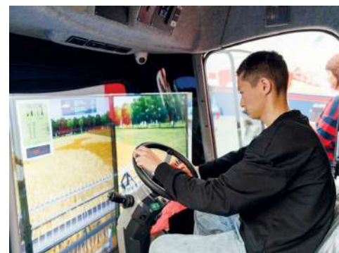
Почувствовать себя настоящим профессионалом можно было за штурвалом современного комбайна

В рамках мастер-классов участникам Единого дня открытых дверей в ВолГАУ показали как устроена сельскохозяйственная техника, рассказали о рабочих профессиях, которые можно получить в период обучения, продемонстрировали как создать дизайн участков в компьютерных программах. Будущие абитуриенты на симулято-