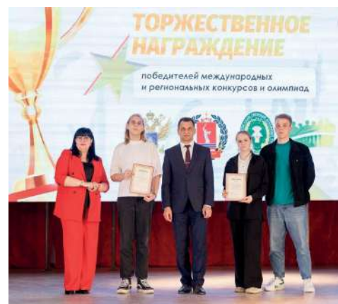
Победителям вручили заслуженные дипломы и памятные подарки

В этот день состоялось торжественное награждение победителей XV Регионального научно-исследовательского конкурса «Новое поколение выбирает науку» среди обучающихся образовательных организаций и обучающихся профессиональных образовательных организаций Волгоградской области и XVIII Международной научно-практической конференции молодых исследователей «Наука и молодежь: новые идеи и решения». Оба мероприятия были посвящены 80-летию со дня