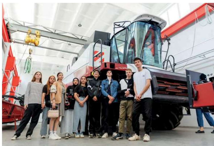
Для будущих студентов провели мастер-классы и профессиональные пробы на образовательной инфраструктуре агрокластера

Сохранение прежнего и создание нового, отвечающего всем современным трендам и вызовам – главная миссия руководства и коллектива. Благодаря грамотной имиджевой политике ВолГАУ с каждым днем повышает конкурентоспособность на рынке образовательных услуг.