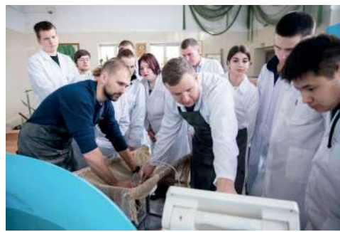
В Центре проходят практические занятия со студентами и научно-исследовательские работы

В настоящее время существует проблема высокой стоимости строительства и эксплуатации УЗВ – установок замкнутого водообеспечения, высокого энергопотребления, низкой плотности посадки объектов аквакультуры на единицу площади, низкого уровня автоматизации технологических процессов, низкой отказоустойчивости технологического оборудования. На основе собственных многолетних разработок в сфере модерни-