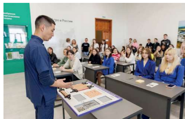
На одном из мастер-классов продемонстрировали различные манипуляции по ветеринарной обработке швов и их наложению

ре комбайна «Акрос» попробовали себя в уборке урожая. Также учащимся школ показали различные манипуляции по ветеринарной обработке швов, их наложению и т. д. В ходе мастер-класса по фитосанитарному контролю ребятам рассказали о роли удобрений в питании растений и о том, как определить необходимость подкормок сельскохозяйственных культур методом функциональной диагностики.