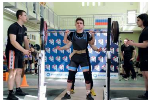
Первенство Волгограда по пауэрлифтингу

Все участники соревнований получили от Обкома профсоюза работников АПК РФ подарочные сертификаты мага-