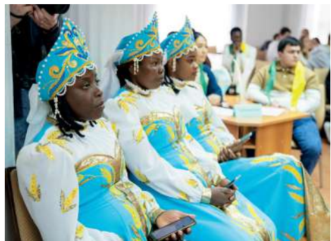
Истинным украшением праздника стали студентки из Африки

Идея и концепция мероприятия, нацеленного на сохранение и популяризацию русской культуры, разъяснение духовных основ русского мира, расширение культур-