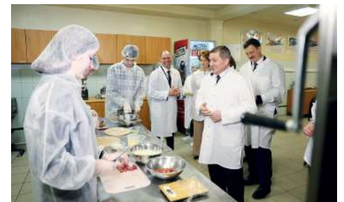
С будущими технологами Андрей Бочаров пообщался на учебном производстве вуза

Проекты создания новых перерабатывающих производств, перспективные направления в отрасли стали главной темой расширенного заседания Совета Волгоградской области по вопросам развития дальнейшей переработки продукции АПК под руководством губернатора Андрея Бочарова.