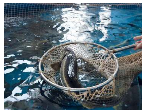
В Центре отработывают технологии воспроизводства ценных пород рыбы

организации, занимающиеся разведением аквакультуры не только для получения товарной рыбы, но и рыбовосадовочного материала. В 2023 году в Волгоградской области благодаря привлечению федеральных, региональных и внебюджетных средств в водоемы на территории региона выпущено более 12 млн мальков осетровых пород рыб, сазана, толстолобика, белого амура. Активная работа по восполнению рыбных ресурсов продолжится и в 2024 году. Кроме того, в Волгоградской области продолжится комплексное оздоровление и расчистка озер и ериков Волго-Ахтубинской поймы и рек Донского бассейна.