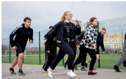
Участники Недели здоровья на беговой дорожке

В Саратов отправились наши юноши. Им предстояло сразиться с представителями Казани, Ростова-на-Дону, Астрахани, Чебоксар, Брянска, Курска, Саратова и Волгограда.