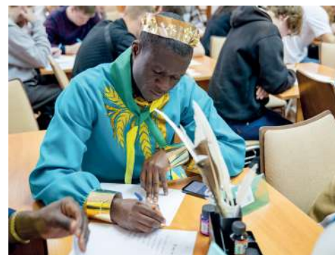
Идея мероприятия – сохранение и популяризация русской культуры

С увлечением и не без страха и благоговения перед трудностями великого русского