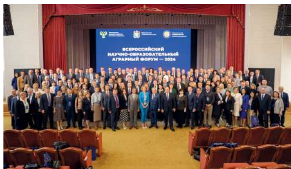
Участники Всероссийского научно-образовательного аграрного форума

По словам первого заместителя Министра сельского хозяйства РФ Оксаны Лут, одним из инструментов повышения заинтересованности молодежи в аграрных специальностях является система целевого обучения, которая подразумевает гарантированное трудоустройство. В июне текущего года стартует приемная кампания, и вузам необходимо провести работу по целевому приему на новый учебный год.