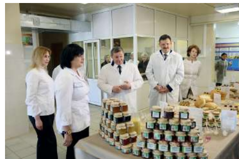
Андрею Бочарову продемонстрировали продукцию ВолГАУ

Стратегические инициативы университета позволяют создать новые точки роста, преодолеть внутрисистемные напряжения и в условиях внешних вызовов создать передовую модель аграрной науки и образования, соответствующую требованиям перехода к экономике знаний.