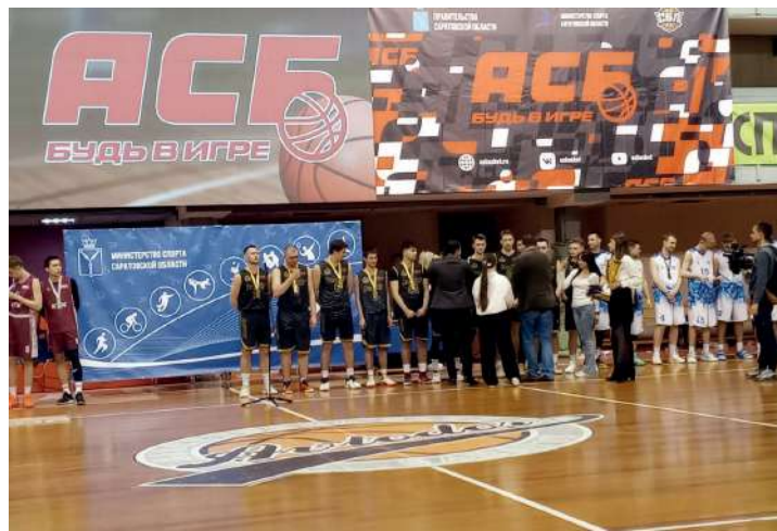
Команда баскетболистов Волгоградского ГАУ – чемпионы «Кубка регионов»

Конец марта – начало апреля 2024 года были ознаменованы выдающимися выступлениями наших команд в соревнованиях Ассоциации студенческого баскетбола России «Кубке регионов».