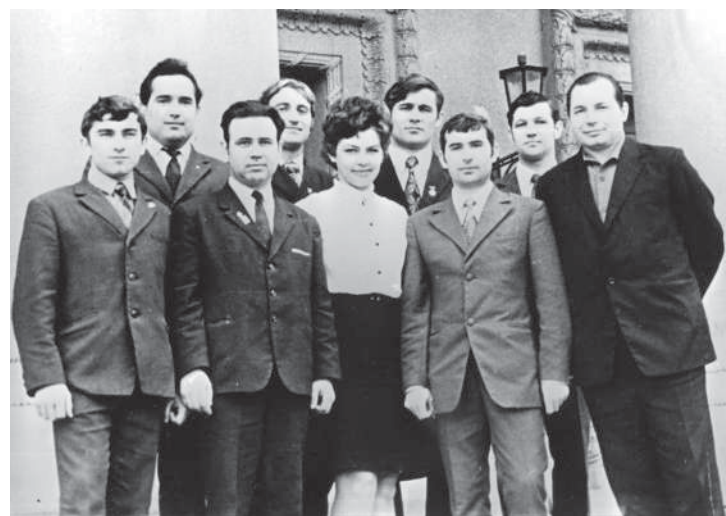
Руководители факультета общественных профессий и общественных организаций вуза, 60-е годы

Особое внимание уделялось программному выращиванию сельскохозяйственных культур. Отрадно ныне вспомнить, что эта проблема тогда только начинала решаться сельскохозяйственной наукой и наш СХИ был пионером этого насущного дела. В 1975 г. открылась опытная станция по программированию урожая. В это же время у нас состоялась 2-я Всесоюзная конференция по программированию.