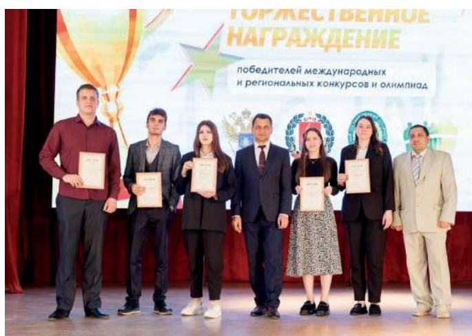
Масштабные события объединили школьников, студентов и молодых ученых России и зарубежья

Эти два масштабных события объединили школьников, студентов и молодых ученых России и зарубежья. Старшеклассники, занявшие призовые места, уже подали заявки и в настоящее время проходят тестирование в региональном этапе Всероссийского конкурса «АроНТРИ-2024», он пройдет в стенах ВолГАУ в мае. Большинство победителей конференции является участниками «Акселерационной программы – 2024» как лучшие представители научной молодежи.