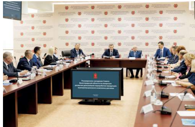
Заседание Совета по вопросам развития дальнейшей переработки продукции АПК