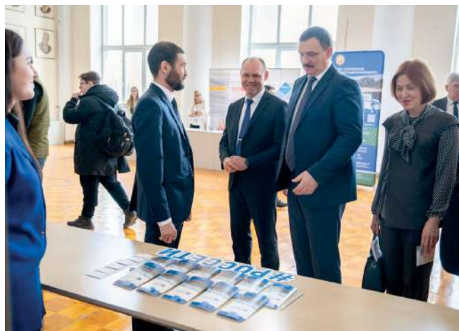
Ведущие предприятия региона – традиционные участники Ярмарки вакансий

Трудоустройство выпускников – одна из главных задач, которую ставит перед собой руководство вуза. Ярмарка вакансий, которая состоялась 29 марта 2024 года в ВолГАУ, предоставила отличную возможность в личной беседе узнать о деятельности предприятий, наличии вакансий, требованиях, предъявляемых к работникам.