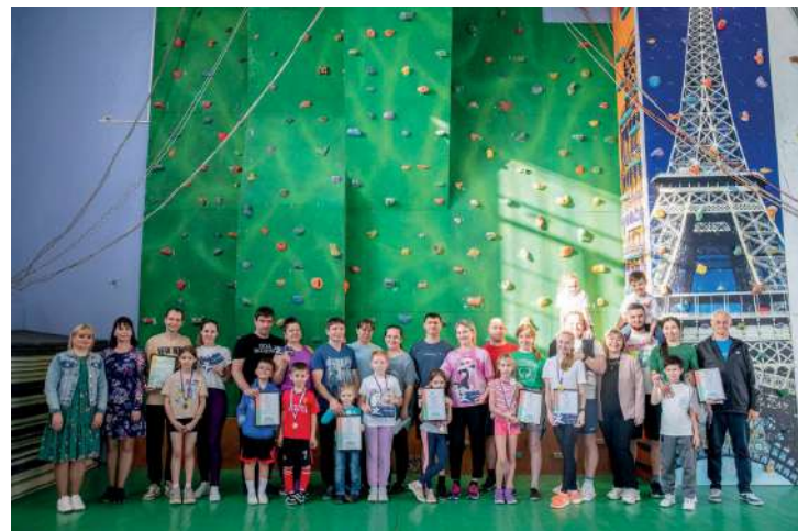
Победители и призеры семейных стартов «Папа, мама, я – спортивная семья»