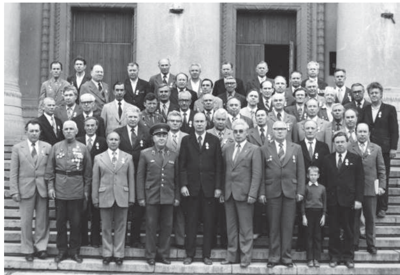
Преподаватели и сотрудники института – участники Великой Отечественной войны, 1975 г.

Открытый в начале шестидесятых, факультет общественных профессий набирал силу и популярность: с 1979 г. художественная самодеятельность ВСХИ долгие годы удерживала первое место среди вузов города. Факультет имел семь отделений, где обучалось до 300 студентов.