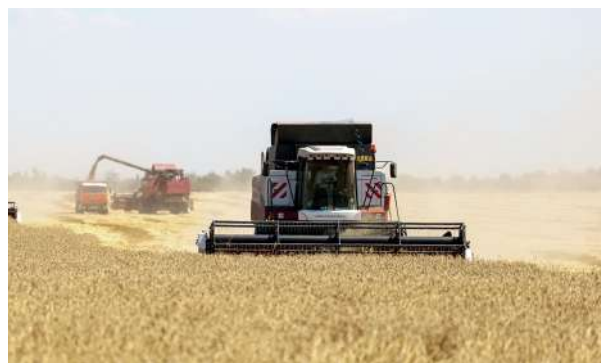
Уборка зерновых культур в УНПЦ «Горная поляна»

По итогам уборочной кампании хлеборобы Учебно-научно-производственного центра «Горная поляна» превзошли прошлогодний результат. Урожайность – 56,7 центнера с гектара. Это наивысший пока-