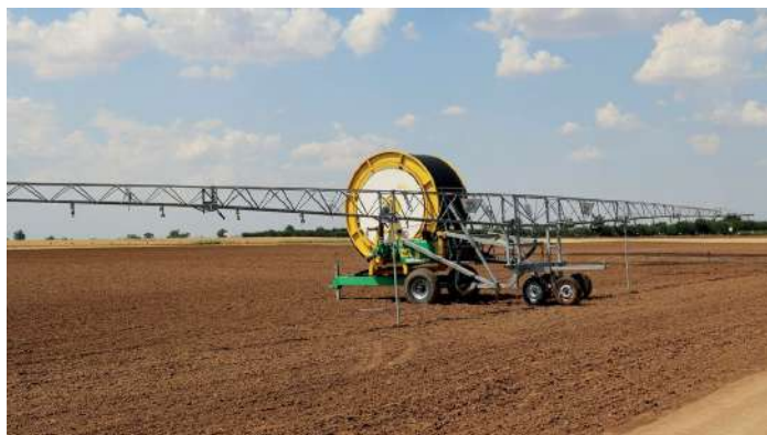
Полигон Центра оросительной мелиорации, разработки и испытания поливной техники

Центр искусственного интеллекта и цифровой энергетики в Центр фундаментальных исследований по математическому моделированию физических процессов в объектах техносферы, искусственного интеллекта и нейросетевых технологий;