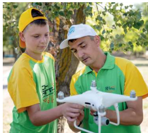
Одна из площадок — пилотирование квадрокоптеров

новодстве, инженерными технологиями и цифровыми решениями в агропромышленном комплексе.