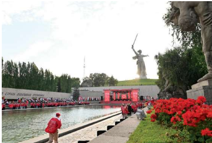
Посвящение в «Хранители истории» состоялось на главной высоте России — Мамеевом кургане