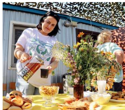
Гостеприимство — отличительная черта Волгоградского ГАУ

Со многими последствиями сложных природно-климатических условий, которыми отличаются разные территории региона, помогают справляться рекомендации ученых и соблюдение агротехнологий.