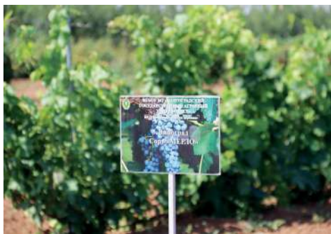
В ампелографической коллекции более 100 сортов винограда

За это время основана ампелографическая коллекция на площади 2,5 га, насчитывающая более 100 столовых и технических сортов винограда. Создана программа по развитию виноградарства, включающая изучение сортов и технологическую оценку: изготовление вина, соков, сушка винограда, консервация, выращивание саженцев винограда в теплицах.