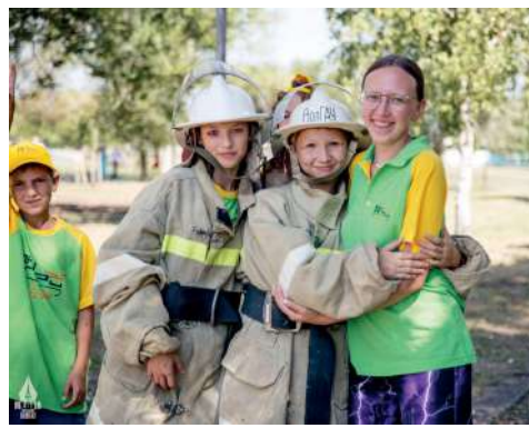
Девочкам тоже интересно побывать в роли спасателей

На протяжении всей смены в «ЮнАгро» действовали ознакомительные, образовательные и практические площадки в рамках трех тематических треков «АгроТех», «АгроБио» и «АгроIT». В день открытия таких было 12, в их числе площадки, посвященные прикладной геодезии, пилотированию квадрокоптеров, программированию, выращиванию мальков рыб, а также специальности «Пожарная безопасность» и направления, посвященного технологии конструкционных материалов, где школьники узнали о современных строительных материалах в АПК. Под руководством наставников — преподавателей Волгоградского ГАУ ребята познакомились с инновационными технологиями в растениеводстве и живот-