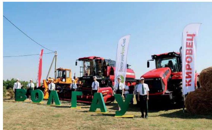
В Волгоградском ГАУ работают и учатся на самой новейшей технике

МТО уже используется в УНПЦ «Горная поляна», что позволяет сократить уровень потерь урожая, обеспечить достаточным