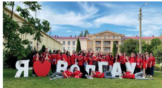
Работу волонтерского корпуса полностью взял на себя коллектив вуза

Совсем скоро будет дан старт набору добровольцев на Всероссийский форум патриотических клубов и объединений вузов России «Родная земля». Ребятам предстоит пройти серьезный отбор. К работе будут допущены лучшие волонтеры аграрного университета, те, кто готовы в режиме нон-стоп быть рядом с командой организаторов и стать частью важного воспитательного проекта.