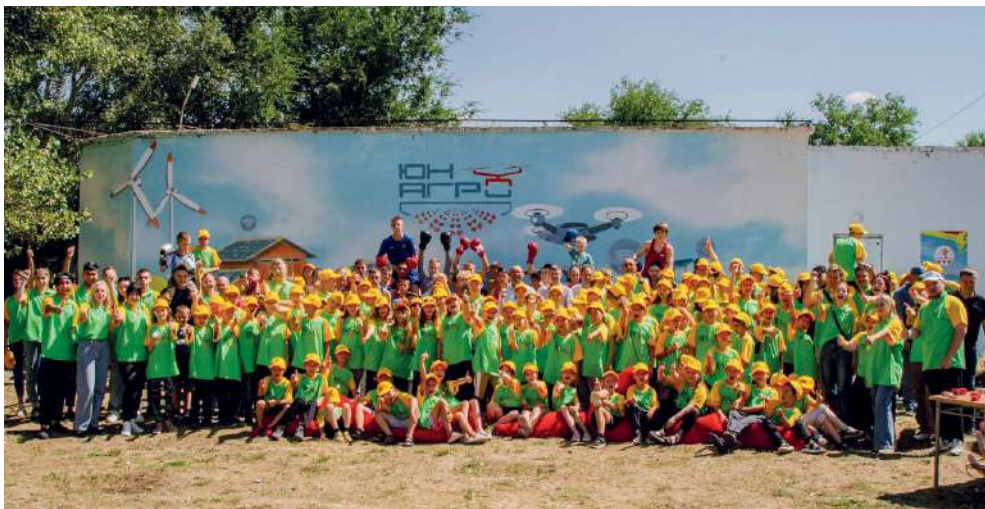
Участники и гости третьей профориентационной смены «ЮнАгро» на торжественном открытии

Без малого 200 человек стали участниками ежегодной профориентационной лагерной смены. Команда преподавателей Волгоградского государственного аграрного университета подготовила для них специальную программу. В расписание включены лекционные и практические занятия, встречи со специалистами ведущих аграрных предприятий региона.