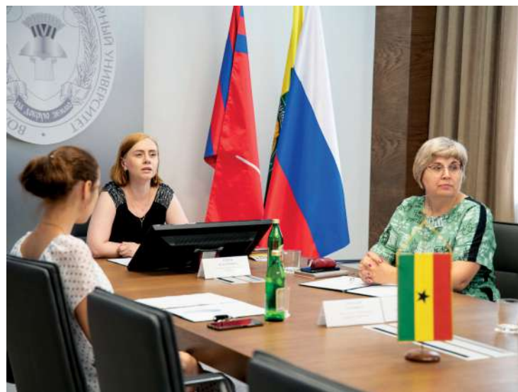
Участники мероприятия от Волгоградского ГАУ

Специалисты аграрного университета в онлайн-формате встретились с представителями Ганского профессионального союза студентов (GUPS). Стороны обсудили вопросы возможного сотрудничества в образовательной и научной сферах, уделив особое внимание вопросам академической мобильности и культурных обменов.