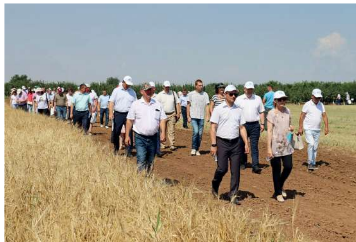
Обход участниками Дня поля опытных участков НИП «Агробиотехнологии»

В ходе мероприятия положено начало эффективному сотрудничеству с передовыми производителями юга России, а также