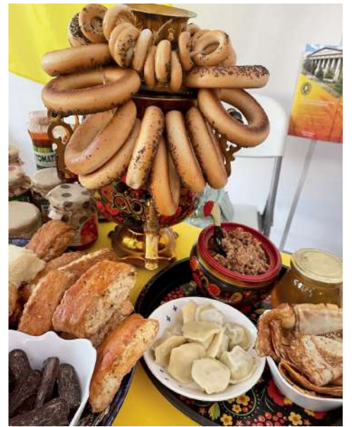
На фестивале сотрудники ВолГАУ угощали национальными блюдами

На аграрном фестивале сотрудники кафедры угощали гостей национальными блюдами. Это и армянская кухня, которая не обходится без лаваша, мясных блюд, зелени и сладкой выпечки, и азербайджанская – различные блюда из баранины: мясо