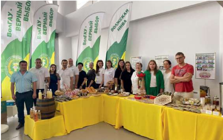
Сотрудники Волгоградского ГАУ – участники Межрегионального форума «Волга-Дон Агро Фест – 2023»

Фестиваль, проходивший на площадке стадиона «Волгоград Арена», прочно закрепился в перечне ключевых гастрономических событий волгоградского региона, привлекающих не только местных жителей, но и гостей из других субъектов. Ученые ВолГАУ продемонстрировали на Агрофесте результаты перспективных научных исследований в области производства и переработки сельскохозяйственной продукции.