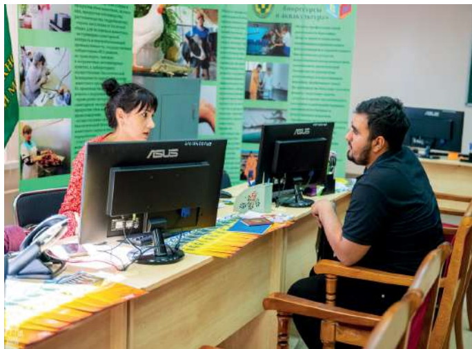
Приемная кампания – 2023 проходит максимально комфортно

Лето – самое волнительное и ответственное время не только для поступающих в вузы, но для самих учебных заведений. Первым нужно сделать правильный выбор, а вторым – грамотно организовать приёмную кампанию. В Волгоградском государственном аграрном университете знают, как привлечь студентов и в полном объеме обеспечить контрольные цифры приема на бюджетные места.