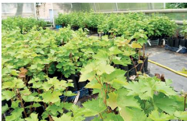
Саженцы винограда в одной из теплиц Центра

Отметим, в 2017 году Администрацией Волгоградской области совместно с Волгоградским ГАУ было принято решение о создании в университете центра виноградарства и питомниководства. В задачи исследований входило создание ампелографической коллекции, отечественных конкурентоспособных технических и столовых сортов, питомниководческой базы по производству посадочного материала винограда.