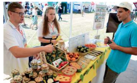
Достижения ученых Волгоградского ГАУ смогли оценить посетители выставки