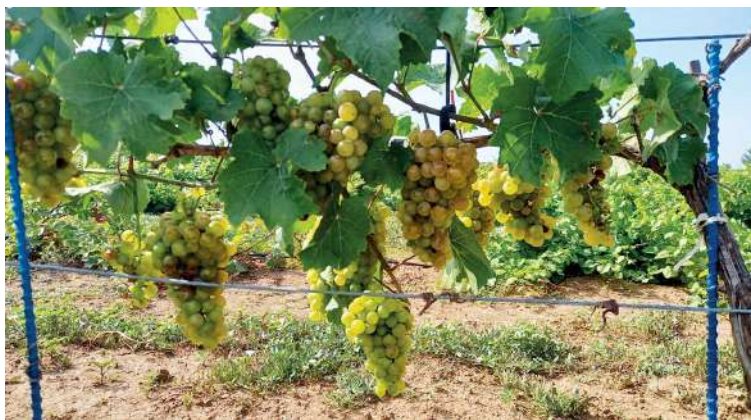
Ежегодно сотрудники Центра селекции и питомниководства винограда собирают богатый урожай

с представителями консорциума Кубанского ГАУ. С коллегами рассмотрены перспективы научных исследований в области виноградарства с учетом современных требований.