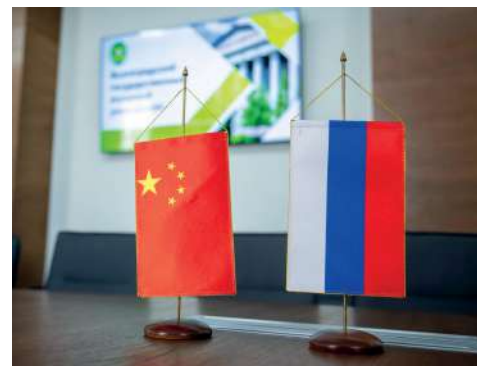
Соглашение будет способствовать укреплению российско-китайских отношений

– На раннем этапе сотрудничества подписание рамочного соглашения с Вэйфанским профессиональным колледжем машиностроения является для нас основополагающим и перспективным фактором для развития и укрепления партнерских отношений. Мы твердо уверены в том, что проведение нашей он-