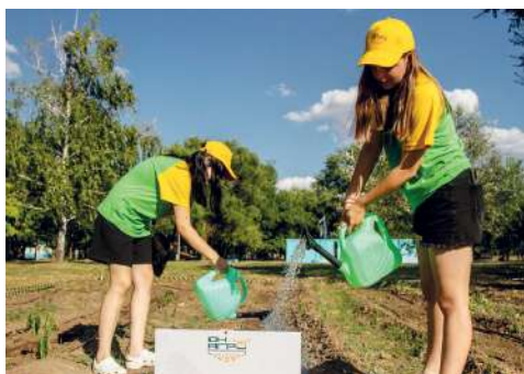
Юные агрономы в работе на опытном участке

«ЮнАгро» — это уникальная возможность погружения в профессии сельского хозяйства и производства продукции, знакомство с перспективами аграрного образования и карьеры в АПК региона. Старт образовательной программы смены дал