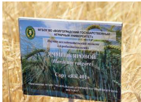
Создание перспективных сортов — основная задача ученых ВолГАУ

Центр инновационных технологий в системе точного и органического земледелия в Центр инновационных агробиотехнологий в системе органического и точного земледелия;