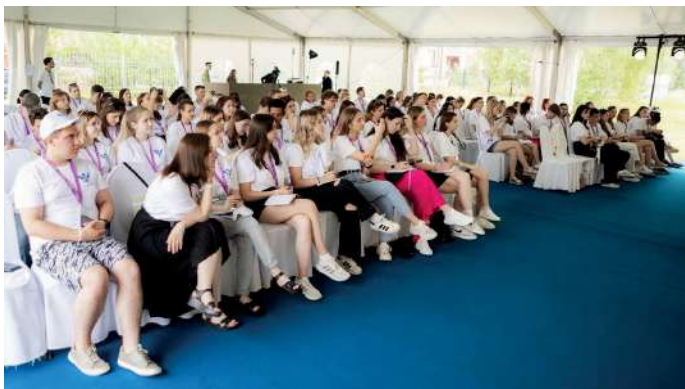
В Тверской области собрались 111 увлеченных медиасферой студентов из 81 российского университета

В конце образовательной программы ребята выступили с презентациями итогов своей работы перед экспертным жюри. В своих проектах они осветили темы цифровых технологий, новой медицины, климата и экологии, генетики и качества жизни, энергетики будущего, кибербезопасно-