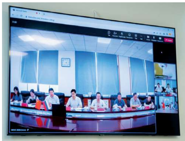
Мероприятие проходило в онлайн-формате

Подписано рамочное соглашение о сотрудничестве между Вэйфанским профессиональным колледжем машиностроения и Волгоградским государственным аграрным университетом. Стороны договорились взаимодействовать на равной основе в области обучения и научных исследований, содействовать развитию образования в обеих странах на основе гуманистических ценностей и культурного диалога и способствовать укреплению отношений между Российской Федерацией и Китайской Народной Республикой в сфере образовательной деятельности.