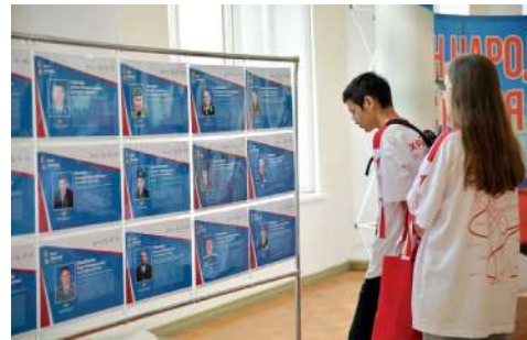
Юные хранители истории побывали на выставке «Про Героев» в ВолГАУ

Подведение итогов — это важный этап в любом деле. Ведь только оценив свои