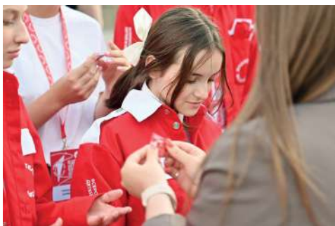
Один из торжественных моментов — вручение значков