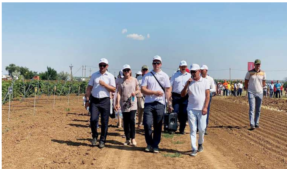
Научно-исследовательский полигон «Агробиотехнологии» — традиционное место проведения Дня поля «Волжская нива»

Научно-образовательно-демонстрационная платформа НОДП «Инновационная деревня» в научно-исследовательский полигон «Агробиотехнологии».