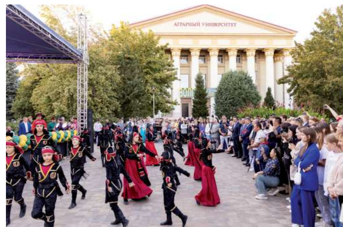
Традиции и обычаи любой национальности и нации лучше всего видны через культуру – костюмы, блюда, музыку, танцы

Настолько открытым и ярким был тот праздник, что спустя год, в 2006-м, по инициативе академии фестиваль национальных культур «Земля – наш общий дом» стал межвузовским, объединив студентов большинства вузов города. Именно тогда впервые состоялся круглый стол «Диалог культур: перспективы развития и взаимодействия», по его итогам принята резолюция и издан сборник докладов участников. Тогда же состоялась выставка прикладного искусства и блюд национальных кухонь, концерт художественных коллективов.