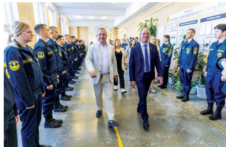
В рамках празднования 80-летия со дня образования вуза гости стали участниками открытия образовательных пространств

Руководители агровузов первыми увидели новую платформу сайта университета, побывали в Центре разведения ценных пород осетровых, в учебно-консультативном конноспортивном центре «Добрыня», в зале Боевой славы и в корпусе инженерно-технологического факультета. Ректоры посмотрели, как работает новая ступень образования – лицей «АгроЛидер» и Центр разведения ценных пород осетровых, оставили цифровое послание аграрной молодежи в видеостудии ВолГАУ.