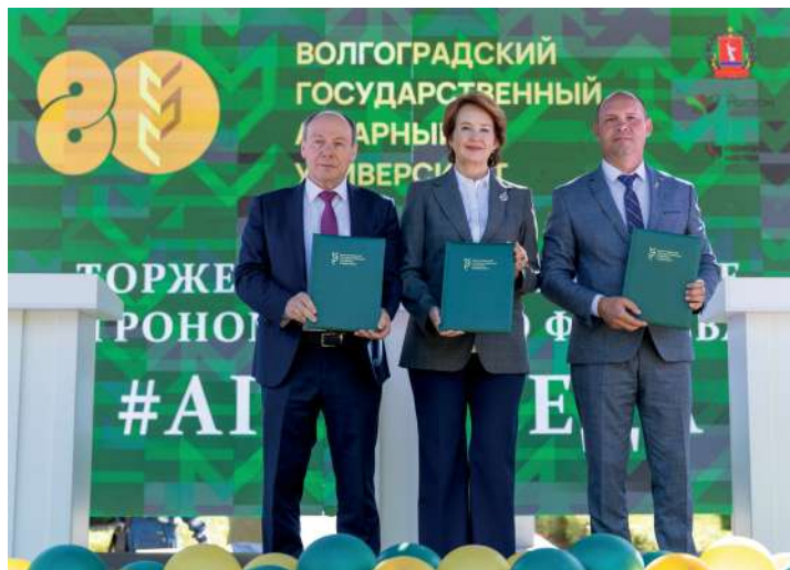
Подписано соглашение Волгоградского ГАУ с региональным отделением Всероссийского общества охраны природы и международным эногастрономическим центром

Под таким лейтмотивом прошел второй день юбилейной недели. С самого утра хлебосольный аграрный университет с только ему присущим радушием встречал гостей, сотрудников и студентов. Выставка-ярмарка даров родного края «Волжская нива», гастрономический фестиваль «АГРО-сРЕДА», фестиваль народов мира «Земля – наш общий дом» – это основные мероприятия праздничной программы.