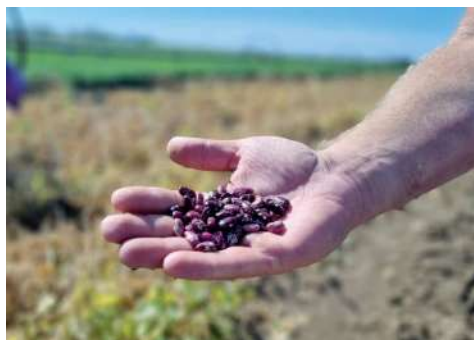
Ученые ВолГАУ приняли участие в разработке нового сорта фасоли

В команде центра – доктора и кандидаты сельскохозяйственных наук. Специалистами ведется совместная научно-исследовательская работа в области селекции овощей с ведущими научными организациями