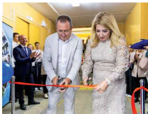
Торжественное открытие учебной аудитории ФГБУ «Управление «Волгоградмелиоводхоз»

Сегодня в университете обучается больше 10 тысяч студентов по 29 направлениям бакалавриата, 6 программам специалитета, 14 программам магистратуры. Уже несколько лет действует система непрерывного образования – от среднего профес-