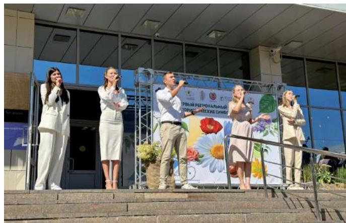
Вокальный ансамбль «Флокс» с музыкальной композицией «Матушка-земля»

А еще обучающиеся аграрного получили первое место в захватывающем квесте. Они почувствовали себя настоящими флористами, создавая невероятные композиции из живых цветов, проявили талант дизайнеров, оформляя украшения из сухоцветов, расширили свои знания на интересных лекциях.