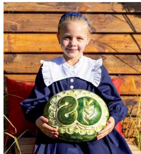
Юная участница гастрофестиваля