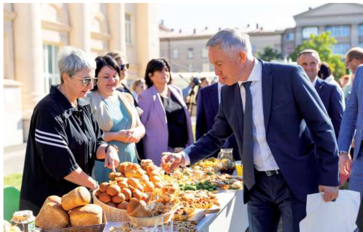
Волгоградский ГАУ представил свою продукцию на площадке фестиваля «АГРО-сРЕДА»

Центральным событием стал гастрономический фестиваль «АГРО-сРЕДА», организованный при поддержке администрации Волгоградской области, комитета сельского хозяйства Волгоградской области и комитета экономической политики и развития Волгоградской области, Международного гастрономического центра, а также группы компаний «Росток – Альянс».