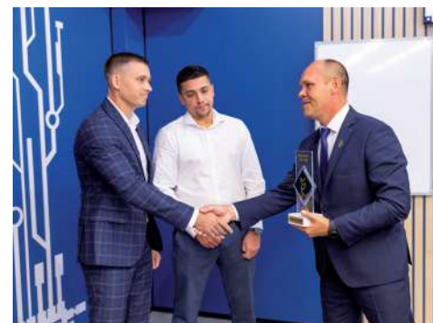
На открытии лаборатории «Виртуальные технологии обучения в электроэнергетике»

Центр нутригеномики сельскохозяйственных животных и птицы совместно с ГК «МегаМикс» создан для комплексного развития птицеводства в Нижнем Поволжье и входит в состав НИИ фундаментальных и прикладных агrobiотехнологий. Это уникальный инновационный центр по тестированию эффективности и безопасности кормов и кормовых добавок, обеспечивающий безопасность и натуральность кормов и продукции птицеводства. При содержании птицы используется современная