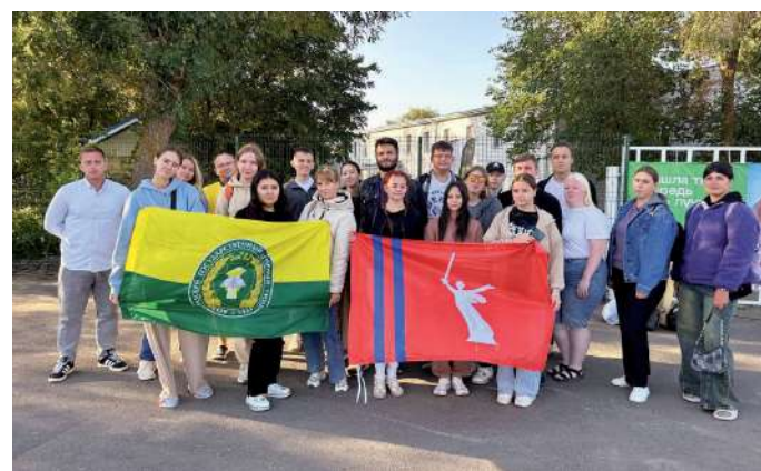
Представители Волгоградского ГАУ в составе региональной делегации принимали участие в форуме «Ростов»

В программу второго дня были включены такие важные темы, как «Правовая и гуманитарная оценка преступлений нацизма в отечественной и мировой практике. Механизмы предотвращения реванша нацизма в современных условиях», «Типология форматов мероприятий, направленных на сохранение исторической памяти. Основы социального проектирования в сфере сохранения исторической памяти», «Этика и методика работы в медийном пространстве с материалами по сохранению исторической памяти и вопросам гуманитарных катастроф», а также культурно-просветительский дискурс: лекция-экскурсия «Ростов-на-Дону в годы войны».