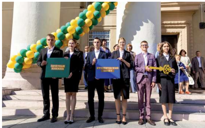
Торжественное вручение символических зачетной книжки, студенческого билета и ключа знаний

Юбилейные мероприятия, посвященные 80-летию со дня образования Волгоградского государственного аграрного университета, начались с одного из главных событий – Посвящения студентов 1-го курса. Самым ярким моментом стал парад факультетов и структурных подразделений вуза. В нём приняли участие больше 2000 человек.