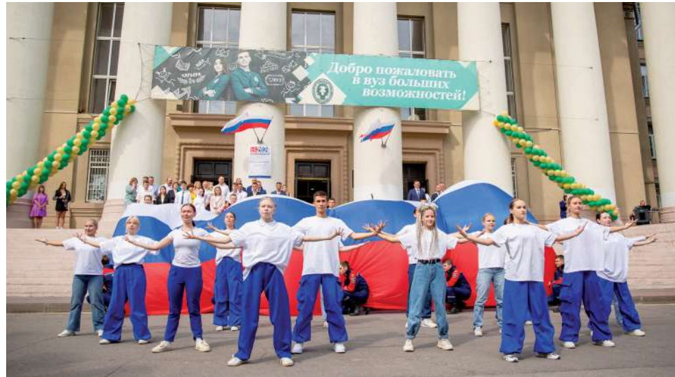
Ярким завершением торжественной линейки, посвященной Дню знаний, стал студенческий флешмоб