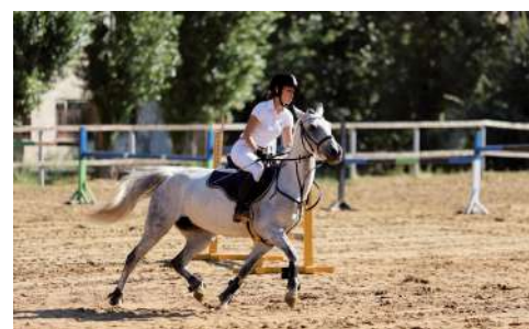
Участники продемонстрировали невероятные навыки и стойкость

Высокий уровень подготовки наши спортсмены показали и на дистанции «Конкур 50».