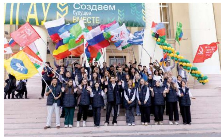
Участники традиционного молодежного фестиваля народов мира «Земля – наш общий дом»

Напомним, в 2005 году в стенах тогда ещё академии состоялся первый Межфакультетский фестиваль национальных культур. За всю историю вуза между обучающимися