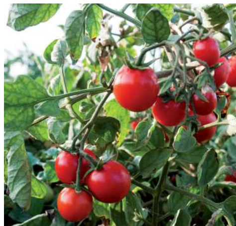
Совместно с Волгоградским ГАУ на базе ССЦ «Росток» организована работа по семеноводству томата