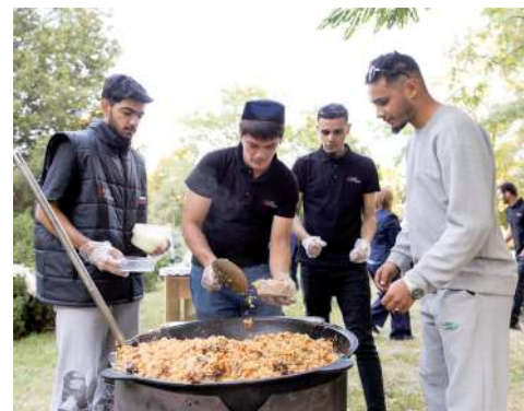
Изюминка фестиваля – плов дружбы

не было ни одного конфликта на межнациональной почве. И для студентов сорока национальностей мероприятие стало настоящим праздником дружбы между людьми разных верований, наций и цвета кожи.