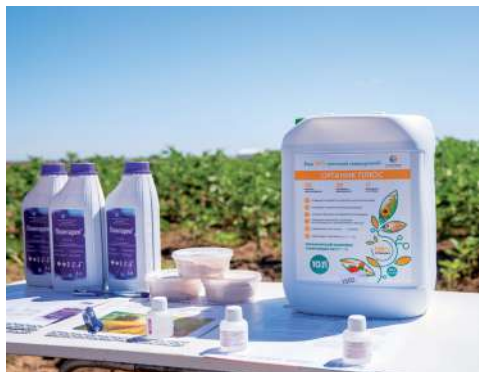
Препараты из портфеля «Иннагро» разработаны ведущими российскими научными центрами

Волгоградский государственный аграрный университет проводит в регионе научно-исследовательскую программу испытаний и внедрения инновационных препаратов для растениеводства. В настоящее время совместно с компанией «Иннагро», реализующей инновационные технологии для сельского хозяйства, осуществляется экспериментальная работа на посевах озимой пшеницы, кукурузы и подсолнечника.