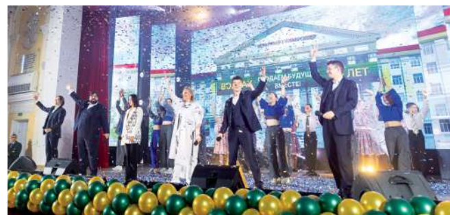
Кульминация торжеств – праздничный концерт

В честь юбилея вуза целый ряд сотрудников награждены Почетными грамотами и Благодарственными письмами губернатора Волгоградской области, Волгоградской облдумы, Министерства сельского хозяйства, Министерства науки и высшего образования РФ, а также получили звание «Почетный работник сферы образования Российской Федерации» и другие награды.