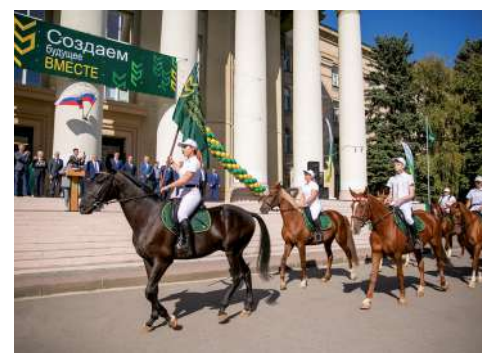
На Параде первокурсников – конноспортивный клуб «Добрыня»