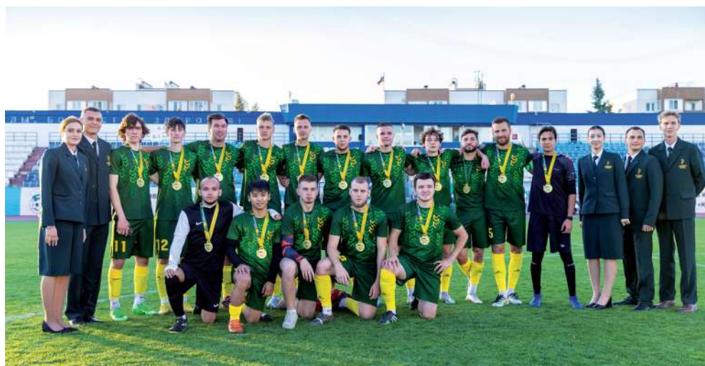
Сборная ВолГАУ – участник товарищеского матча с молодежной командой ФК «Ротор»