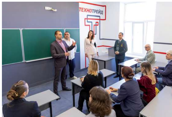
Совместно с компанией ООО «Технотрейд» открыта учебная аудитория «Высшая математика»

Высшее учебное заведение неслучайно называют альма-матер, как благотворительная, любящая мать она воспитывает в своих стенах элиту общества – будущих высококлассных специалистов.