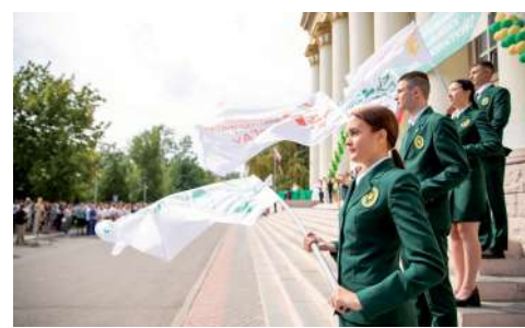
Протоколно-наградная группа Волгоградского ГАУ с флагами факультетов

Студенчество – это не только учеба, но и время поиска себя и единомышленников. В университете созданы десятки научных, молодежных объединений, студенческих клубов, спортивных секций, ассоциация