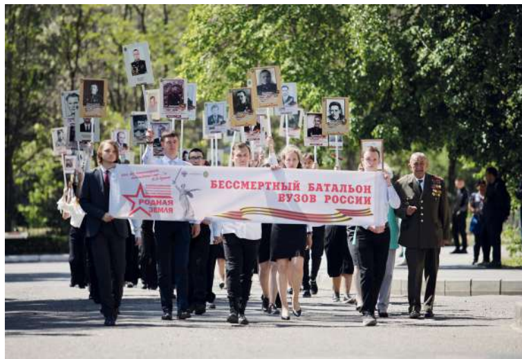
НА ПОРТРЕТАХ – ветераны Великой Отечественной войны и участники специальной военной операции

Шествие «Бессмертного батальона вузов России», Парад курсантов военного учебного центра, Вальс Победы, работа интерактивных площадок «Путь к победе», праздничный концерт «Сталинград – Родина Победы» – в ВолГАУ прошли торжественные мероприятия, посвященные 79-й годовщине Победы в Великой Отечественной войне.