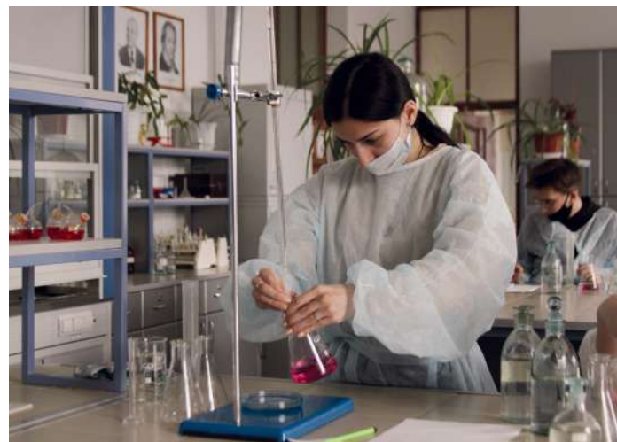
В лицее на углубленном уровне будут изучаться математика, физика, информатика, химия и биология

Новый, открывающийся лицей-интернат «АгроЛидер» – это очное обучение по основным программам среднего общего образования в соответствии с федеральными государственными образовательными стандартами. Выпускники, успешно прошедшие государственную итоговую аттестацию, получат аттестат о среднем общем образовании.