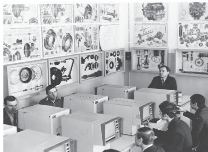
Занятия по правилам дорожного движения

Не прерывались международные связи института. Состоялись две содержательные поездки сотрудников вуза в Германию для изучения опыта работы консультационных служб в сельскохозяйственном производстве этой страны. Был заключен договор о сотрудничестве с Сычуаньским сельскохозяйственным университетом Китая. Кроме этого, поддерживались связи с коллегами из Польши, Румынии, Греции, Венгрии, Болгарии, Индии, Сирии. Институт готовил кадры для стран СНГ и дальнего зарубежья: Иордании, Конго, Израиля, Палестины.