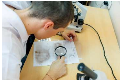
В криминалистической лаборатории вуза

С 1 сентября 2024 года в Волгоградском ГАУ будет вестись подготовка бакалавров-юристов. Лицензия на осуществление образовательной деятельности получена вузом осенью прошлого года. Открытие нового направления – 40.03.01 «Юриспруденция» (профиль – правоприменительный) обусловлено востребованностью высококвалифицированных специалистов в области практического применения правовых норм, в том числе с учетом специфики аграрных отношений.