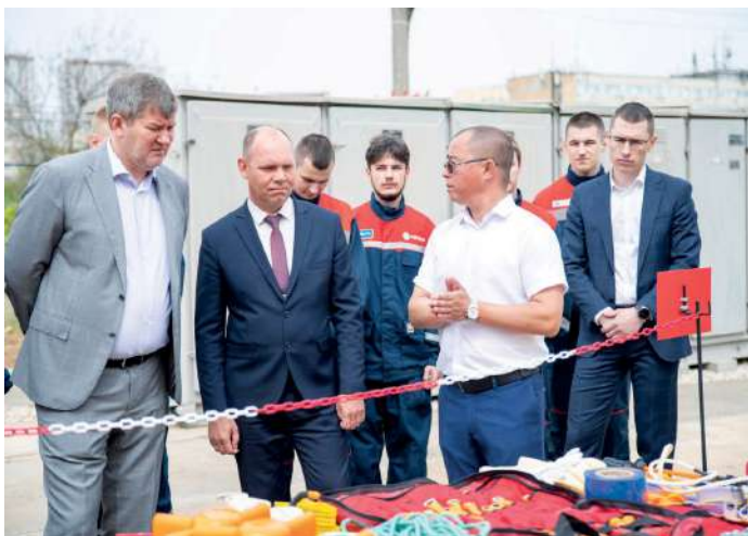
У Волгоградского ГАУ надежные партнеры

Мастер-класс «Организация работ под напряжением в электроустановках до и выше 1000 В» провели для обучающихся ЭЭФ сотрудники компании-партнера АО «Волгоградские межрайонные электрические сети» на учебно-тренировочном полигоне «Энергообеспечение сельскохозяйственных объектов».