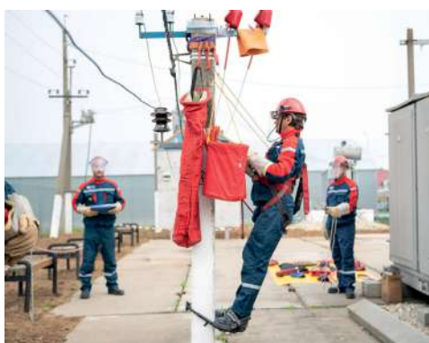
Мастер-класс от профильных специалистов

Сотрудники АО «Волгоградские межрайонные электрические сети» провели мастер-класс по замене штыревого изолятора на промежуточной железобетонной опоре ВЛ-0,4 кВ под напряжением, устранению нагрева болтового соединения шинного соединения в РУ-0,4 кВ под напряжением, а также восстановлению изоляции изолированного провода на ВЛИ-0,4 кВ под напряжением с применением автогидроподъемника.