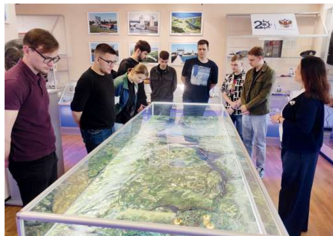
Особый интерес вызвал рассказ о системе управления шлюзами

Экскурсия на Волго-Донской канал стала для молодых людей не просто познавательной поездкой, а настоящим открытием. Они увидели, как история переплетается с современностью, как труд человека способен преобразовать мир и создавать уникальные сооружения. Это путешествие заставило их задуматься о важности таких качеств, как целеустремленность, упорство и вера в свои силы, вдохновило на собственные свершения, показав, что нет ничего невозможного для человека, обла-