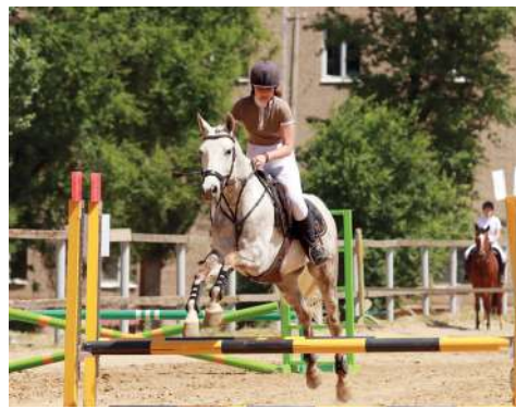
Весенний Кубок ВолГАУ – 2024

На дистанции в 2 км были установлены естественные препятствия высотой до 60 см. В данном виде наша команда участвовала впервые.