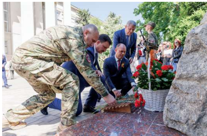
Красные гвоздики легли к подножию памятного знака воинам 35-й гвардейской стрелковой дивизии