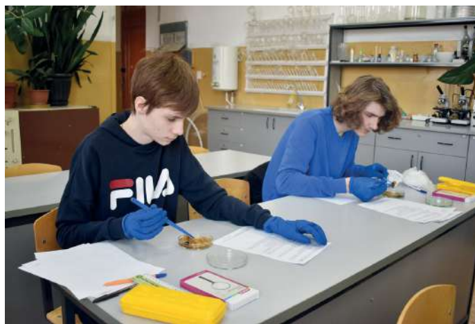
Ежегодно в университете проходит олимпиада «Поступи в ВолГАУ»

– Новость об открытии в вузе лицея сейчас активно обсуждается в регионе. Расскажите, пожалуйста, подробнее об идее его создания.