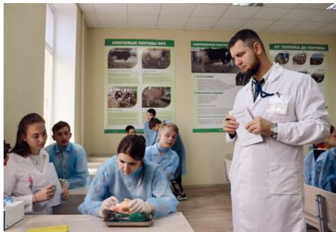
Направление «АгроВет» пользуется неизменным интересом у школьников

– Во все времена благополучие, экономическое развитие России было неразрывно связано с аграрно-промышленным комплексом, основа которого – сельское хозяйство, – отметил ректор ВолГАУ Виталий Цепляев. – Сейчас нам, аграриям, предстоит решить множество актуальных вопросов и проблем, связанных с загрязнением окружающей среды, использованием химикатов и иных вредных для человека веществ, негативными природными явлениями, влияющими на производство сельскохозяйственной продукции. Развитие сельского