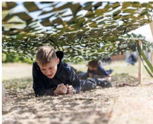
Одна из задач – проползти под сеткой

Военно-спортивная игра «Зарница 2.0» под патронажем «Движения первых» в Волгограде проходит второй раз. В отборочном туре приняли участие 4,5 тысячи ребят. Из них в муниципальный этап в составе команд прошли 130 школьников от 11 до 17 лет.