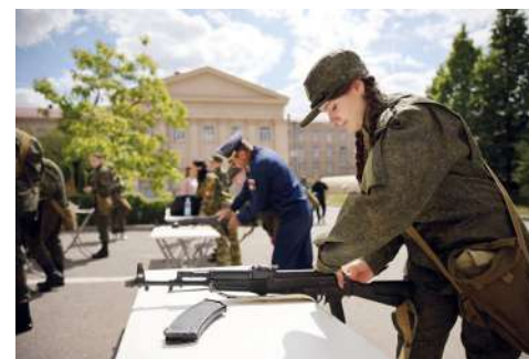
На «огневом рубеже» соревновались в меткости стрельбы, на скорость собирали и разбирали автоматы

На базе аграрного вуза действуют спортивно-патриотический радиоклуб «Колос» имени Героя Советского Союза Якова Павлова, студенческий клуб реконструкторов имени генерала Василия Глазкова, поисковый отряд «Сталинград» и не только.