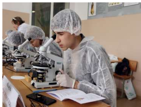
На очный региональный этап приехали лучшие

Отметим, «Школа фермера» – это федеральный образовательный проект Россельхозбанка на базе ведущих аграрных вузов и сельхозпредприятий, объединяющий возможности Министерства сельского хозяйства, регионов, профильных вузов, крупного