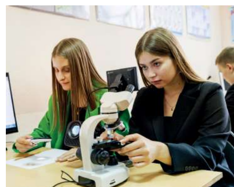
Выпускники будут конкурентоспособны на рынке труда