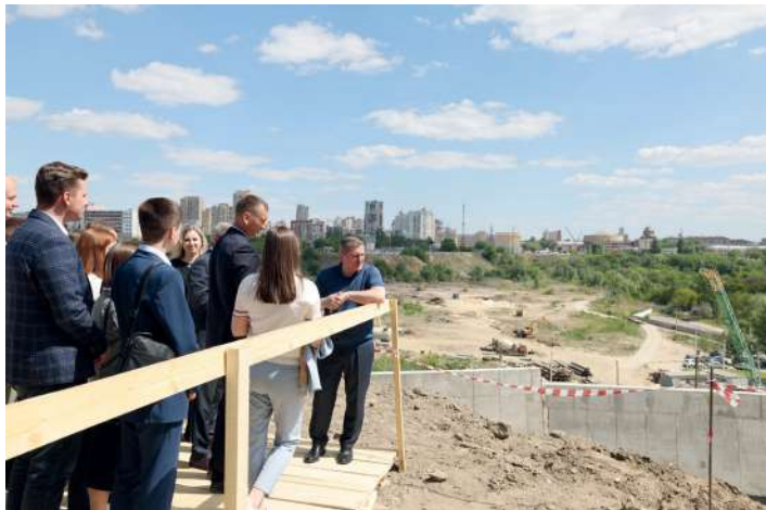
Участники встречи посетили площадки под будущие объекты