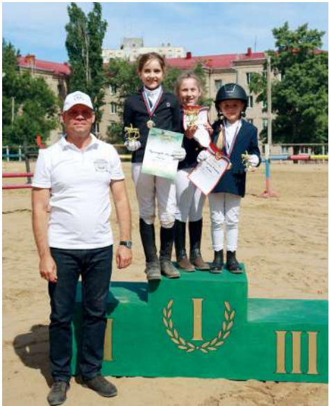
Юные всадники на высшей ступени пьедестала

Маршрут «Кавалетти в две фазы специальный», зачёт для юных всадников: