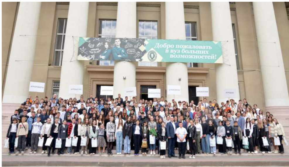
Участниками «АгроНТРИ» стали более 260 представителей школ сельских поселений и малых городов

С 2019 года Волгоградский ГАУ традиционно является одной из 19 окружных площадок «АгроНТРИ» и радушно принимает на своей территории десятки школьников из Волгоградской, Астраханской, Ростовской, Тамбовской областей, Краснодарского и Ставропольского края и других регионов. На торжественном открытии регионального этапа Всероссийского конкурса среди обучающихся общеобразовательных учреждений сельских поселений и малых городов «АгроНТРИ-2024» участники приветствовали руководство университета и почетные гости мероприятия.