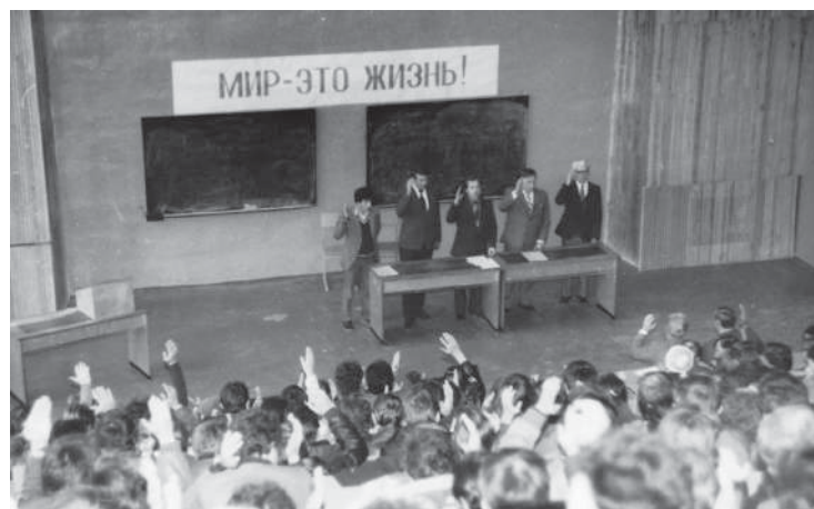
Собрание студентов и сотрудников вуза