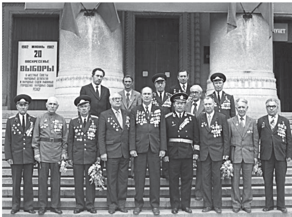
Преподаватели и сотрудники института – участники Великой Отечественной войны, 1975 г.

Значительные события произошли в жизни вуза в восьмидесятих годах прошлого века. Это, прежде всего, образование в 1988 г. Волгоградского УНПК – учебно-научно-производственного комплекса в составе нашего института, учебно-опытного хозяйства «Горная поляна» и опытной станции по программированию урожая.