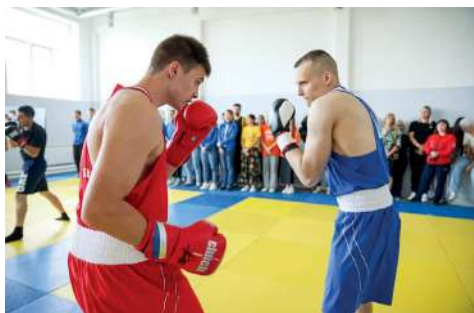
Показательная тренировка в новом зале единоборств

В Волгоградском ГАУ состоялось торжественное открытие зала спортивных единоборств. В просторном современном помещении будут проходить как учебные, так и тренировочные занятия по таким видам спорта, как дзюдо, самбо и бокс.