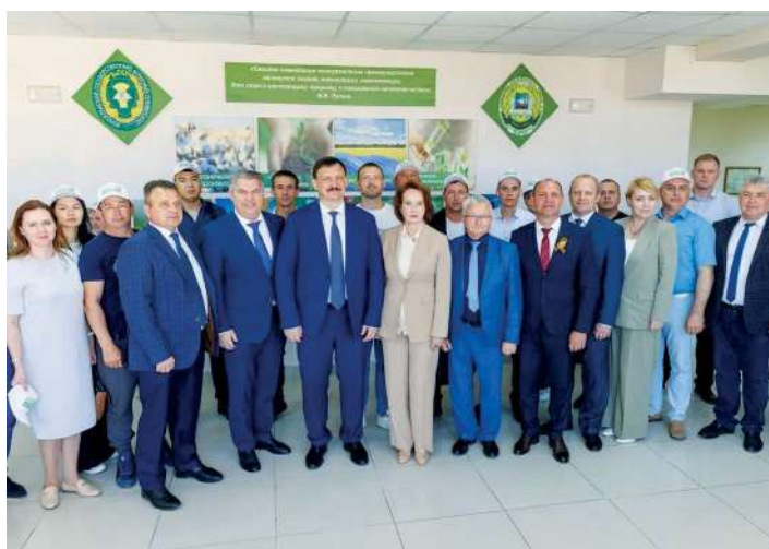
Слушатели седьмого потока «Школы фермера»

бизнеса и фермеров для теоретического и практического обучения профессиональных кадров для АПК. Слушатели изучают правовые аспекты работы фермерских хозяйств, финансовые бизнес-модели, основы маркетинга, знакомятся с новейшими агротехнологиями, учатся кооперироваться с крупными холдингами.