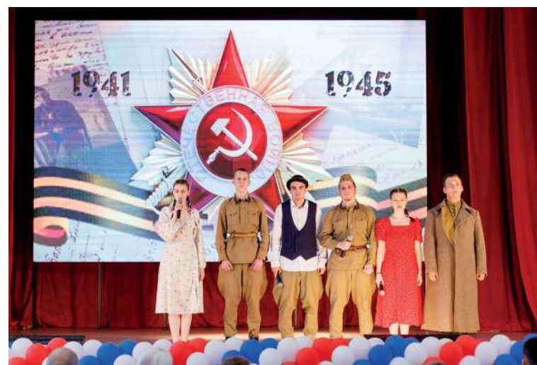
Концерт, посвященный 79-й годовщине Победы в Великой Отечественной войне