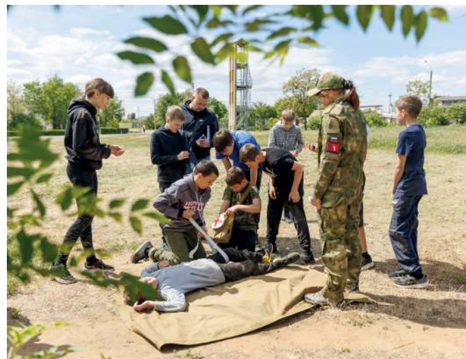
С оказанием первой медпомощи кадеты справились на отлично

– Наш Военный учебный центр – единственный в Волгограде и в ЮФО готовит офицеров запаса для ракетных войск и артиллерии. И мы, конечно, надеемся, что те ребята, которые сегодня участвуют в «Зарнице», в последующем придут к нам, будут студентами и курсантами ВУЗа, – подчеркнул ректор Волгоградского государственного аграрного университета Виталий Цепляев.