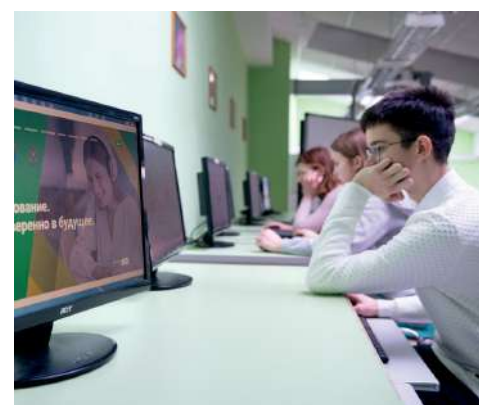
«АгроЛидер» – первый лицей, созданный на базе вуза

– Да, действительно, начиная с 2021 года в Волгоградском ГАУ