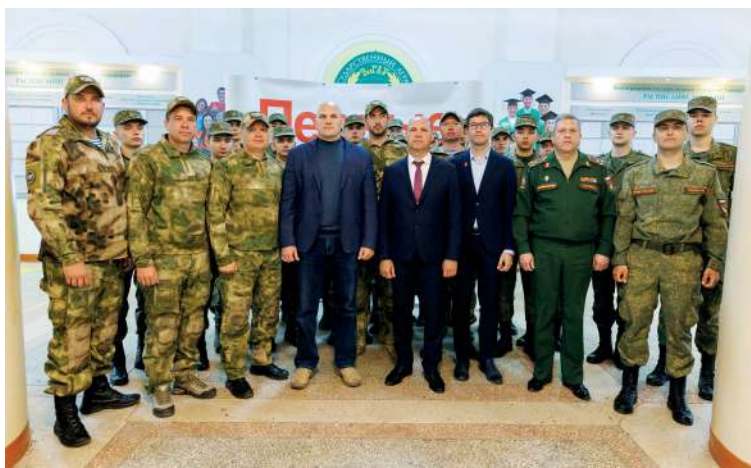
ВолГАУ и Центр военно-спортивной подготовки и патриотического воспитания молодежи «Воин» – надежные партнеры

Оказать первую помощь, пройти полосу препятствий, собрать и разобрать автомат – всё это умеют волгоградские школьники. На площадке аграрного университета прошел муниципальный этап Всероссийского проекта «Зарница 2.0». В рамках мероприятия вуз заключил соглашение о сотрудничестве с соорганизатором – региональным филиалом Центра военно-спортивной подготовки и патриотического воспитания молодежи «Воин».