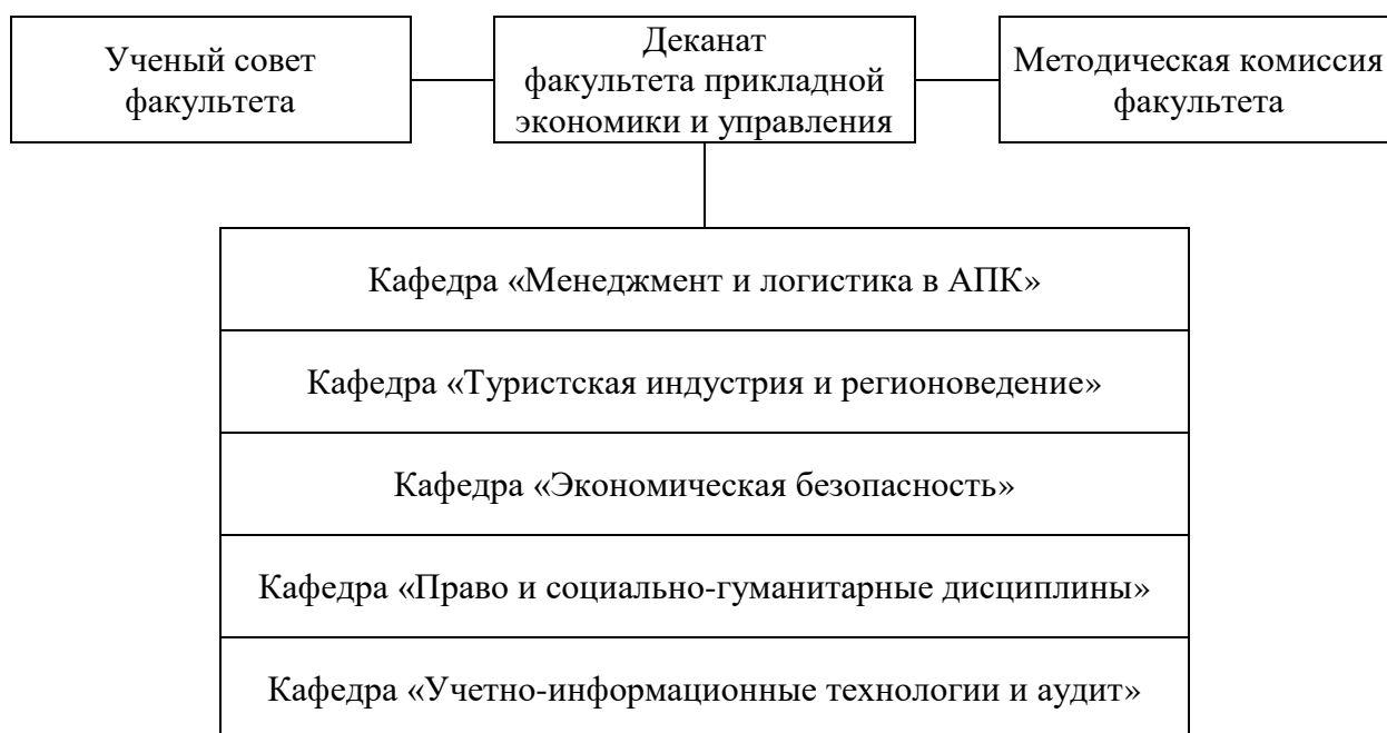
Рисунок 1 – Структура факультета прикладной экономики и управления ФГБОУ ВО Волгоградский ГАУ

Реализация образовательной программы высшего образования по направлению подготовки 38.03.02 Менеджмент направленность (профиль) «Управление логистической деятельностью» (далее – образовательная программа) в ФГБОУ ВО Волгоградский ГАУ осуществляется с 2022 года. Подготовка ведется на факультете прикладной экономики и управления ( https://volgau.ru/obrazovanie/fakultety-i-kafedry/fakultet-prikladnoy-ekonomiki-i-upravleniya/ ) (рисунок 1).