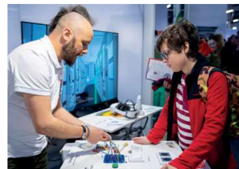
Эксперты рассказали о преимуществах Волгоградского ГАУ

Напомним, Владимир Путин в Послании Федеральному Собранию подчеркнул значимость подготовки высококвалифицированных кадров для экономики страны. В Волгоградской области система образования активно развивается в соответствии с целями нацпроекта «Образование». Подготовка высокопрофессиональных, востребованных специалистов – одна из ключевых задач региональной политики.