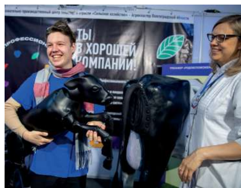
На площадке ВолГАУ можно было принять роды у коровы

Работала площадка «Я – вожатый: организация отдыха и оздоровления детей Волгоградской области» с презентацией ведущих летних лагерей. Координаторы помогли родителям определиться, где детям провести каникулы, а студенты смогли подать заявку в региональную школу вожатых с последующим трудоустройством.