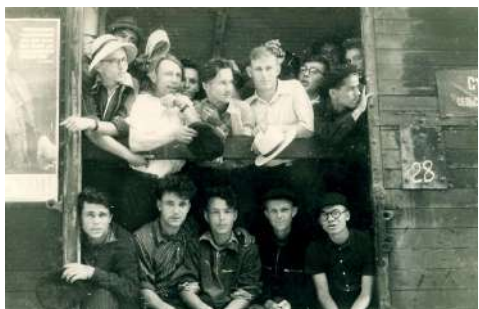
Студенты СХИ перед отправкой на целину в Казахстан

Движению студенческих отрядов Российской Федерации – 65! Молодежной общероссийской общественной организации «Российские Студенческие Отряды» – 20! Юбилейные мероприятия в честь этих знаменательных дат завершились презентацией «Движения РСО в Волгоградском ГАУ». Бойцов студотрядов поздравил ректор вуза Виталий Цепляев.