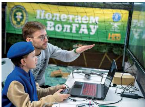
На мастер-классе «Полетаем с ВолГАУ»

Порядка 250 образовательных организаций из Волгоградской области, Санкт-Петербурга, Астрахани, Владивостока и Республики Беларусь демонстрировали свои лучшие разработки на XVIII форуме «Образование-2024», который проходил на площадке стадиона «Волгоград Арена». Для гостей организовали экскурсии, презентационные показы, выступления творческих коллективов и многое другое.