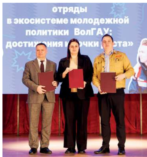
Подписание соглашения между ВолГАУ, АО «Сады Придонья» и ВРО МООО «РСО»

В рамках презентации «Движения РСО в Волгоградском ГАУ» было