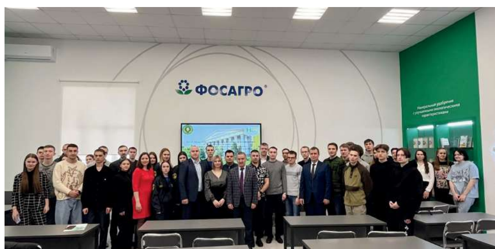
Участники Международной научно-практической конференции «Наука и молодежь: новые идеи и решения»

Среди конкурсных тем: механизация, электрификация и автоматизация сельскохозяйственного производства, перерабатывающие технологии, производство и организация продукции общественного питания и товароведение, перспективы развития агротуризма и социокультурного сервиса в Нижневолжском регионе, перспективы развития мелиорации, сель-