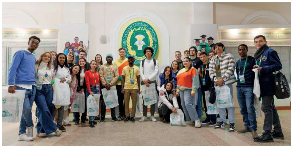
Иностранную делегацию тепло встретили в аграрном университете

Порядка 100 иностранцев из 41 страны мира принимали участие в пятидневном тематическом маршруте «Дорога памяти» – Волгоградская область вошла в число 30 субъектов страны, которые организовали региональную программу для иностранных участников Всемирного фестиваля молодежи. Международная делегация прибыла в город-герой 9 марта, а уже на следующий день гости посетили Волгоградский государственный аграрный университет.