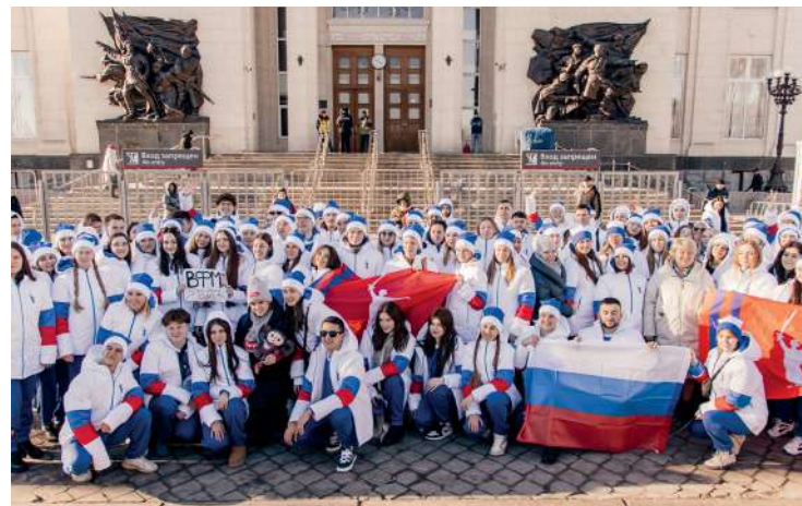
Студенты ВолГАУ в составе волгоградской делегации

Для гостей подготовили насыщенную образовательную, выставочную, спортивную и культурную программы. Молодежь со всего мира получила возможность проявить себя в спортивных соревнованиях, мастер-классах, добровольческих акциях, экскурсиях, панельных сессиях, увидеть выступления лучших творческих коллективов. Прошли марафон «Знание.Первые», региональный гастрофестиваль «Россия на вкус», фестиваль уличного искусства, выставка «Самая красивая страна», ледовое шоу и многое другое.