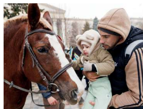
На празднике всем нашлись занятия по душе

В этот день работало множество интерактивных площадок. Каждая из них – неповторима. Преподаватели и студенты разработали уникальный стиль, который