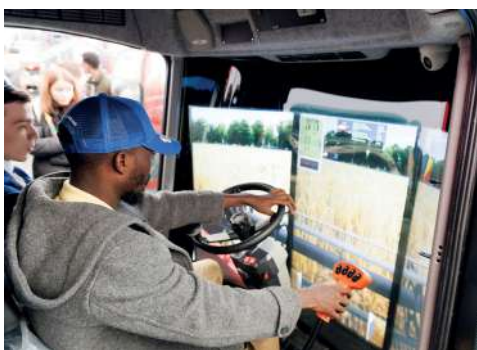
Во время презентации современной сельскохозяйственной техники

По информации регионального комитета образования, науки и молодежной политики, сразу после завершения основной