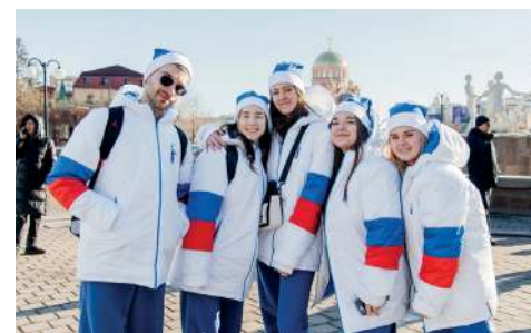
СОВСЕМ СКОРО ОНИ ОКУНУТСЯ В НЕПОВТОРИМУЮ АТМОСФЕРУ ВФМ

– Хочу пожелать вам успеха и в качестве напутствия поделиться собственным опытом – это десять принципов жизни, которые помогают мне управлять процессами в условиях непредсказуемого