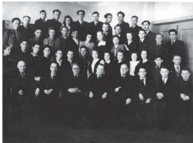
Преподаватели и студенты зоотехнического факультета. Сталинград, 1950 г.

С середины шестидесятых годов студенты СХИ под началом комсомольской организации принимали активное участие в полезных начинаниях, в том числе организации трудовых студенческих строительных отрядов. В 1969 г. наша молодежь стала инициатором создания студенческих механизированных отрядов для работы в хозяйствах области. Она шла в авангарде движения вузовских стройотрядов города, а двенадцать наших студентов за самоотверженную работу были удостоены правительственных наград.