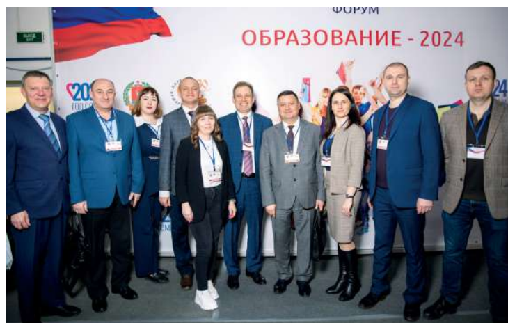
Волгоградский ГАУ – ежегодный участник образовательного форума