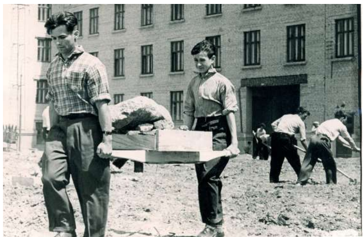
Здесь будет сад. Во дворе главного корпуса, 18 мая 1959 г.