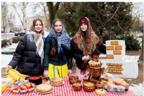
«Душа моя, Масленица»

Масленица – один из самых веселых праздников в году, который широко отмечается по всей России. Он отражает вековые традиции, бережно хранимые и передаваемые из поколения в поколение.