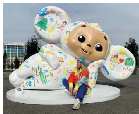
ОФИЦИАЛЬНЫМ СИМВОЛОМ ФЕСТИВАЛЯ

– Вы лично сможете убедиться, например, что улыбка для нас не дешевая маска,