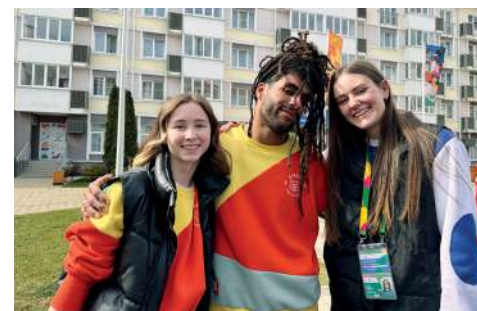
НАСТОЯЩИЙ ПРАЗДНИК МОЛОДОСТИ, ТВОРЧЕСТВА И ДРУЖБЫ

За время Фестиваля состоялось более 800 мероприятий, а каждый день был посвящен определенному тренду-смыслу: «Ответственность за судьбы мира», «Многонациональное единство», «Мир возможностей для каждого», «Сохраним семью во имя детей и мира», «Мы – вместе с Россией».