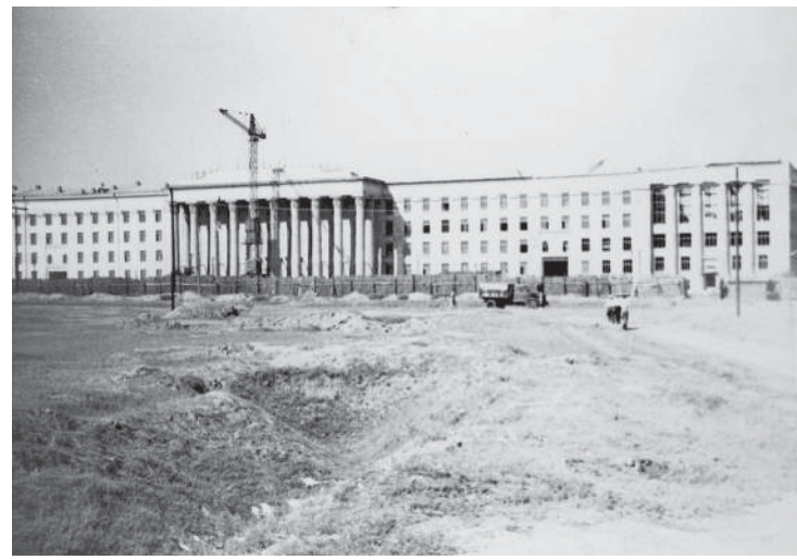
Строительство главного корпуса Сталинградского СХИ на завершающем этапе, 1957 г.

Они заинтересованно способствовали тому, чтобы в каждой детали проекта ясно вырисовывался именно сельскохозяйственный профиль вуза. В 1957-м, в год сорокалетия Октябрьской революции, первая очередь строительства главного учебного корпуса была завершена.