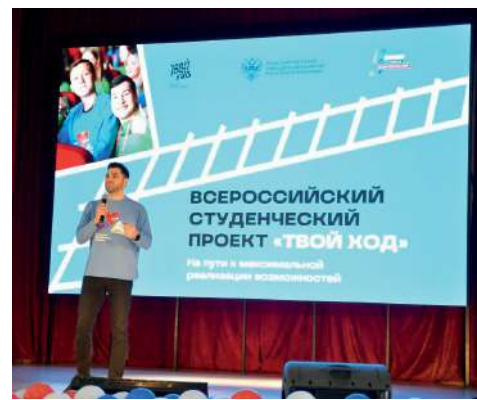
Федеральные эксперты представили «Твой ход»

Принять участие в проекте могут граждане Российской Федерации в возрасте до 35 лет, которые на момент 1 сентября 2024 года будут являться студентами высшего образовательного учреждения вне зависимости от формы обучения. Заявки на участие в конкурсной части проекта принимаются