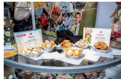
Аграрный вуз продемонстрировал не только достижения, но и собственную продукцию

В рамках форума состоялась стратегическая сессия «Кадры для регионов. Баланс спроса и предложения через образование». К профессиональному сообществу