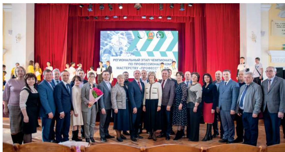
ВолГАУ в очередной раз выступил площадкой подведения итогов чемпионата по профмастерству «Профессионалы»

Поддержка кадрового потенциала – это сейчас одна из ключевых задач в масштабах страны. Об этом в своем Послании Федеральному Собранию говорил и президент