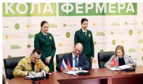
Подписание соглашения между ВолГАУ, ВРО МООО «РСО» и ВРМДОО «Участие»

Стороны достигли договоренности о совместной деятельности по развитию «ВРО МООО «РСО», эффективной организации