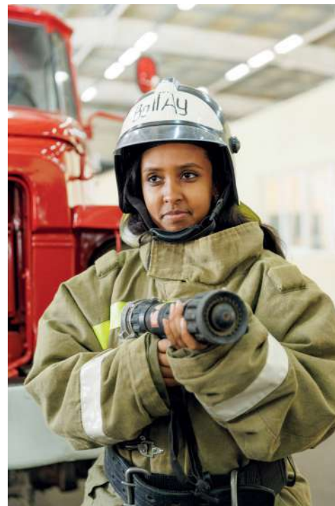
Гости почувствовали себя в роли спасателей

в России», «Дорога памяти», «Страна без границ», «Мы вернулись в Россию», Международная выставка-форум «Россия».