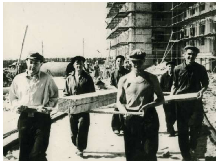
Строится главный корпус Сталинградского СХИ, 1956 г.