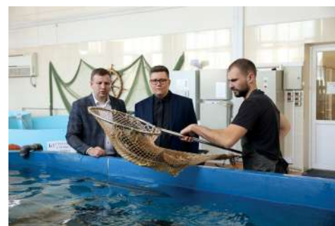
В Центре разведения ценных пород осетровых

– Новое оборудование, которое будет использоваться в образовательной и научной деятельности, создано совместно учеными вуза и специалистами компании. В последнее время благодаря нашим молодым исследователям мы продвину-