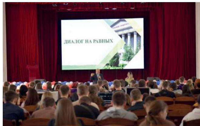
Диалог на равных с руководителем ведущего животноводческого предприятия региона

– Самое главное – найти себя в профессии, вот когда человек сделает правильный выбор, то у него обязательно всё получится: он будет высококвалифицированным и востребованным специалистом.