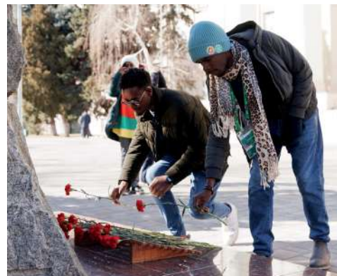
Знакомство с вузом началось с возложения цветов к памятнику

Добавим, региональная программа Всемирного фестиваля молодежи позволила иностранным участникам познакомиться с Россией, её культурным достоянием, историческим наследием, национальным многообразием народов и их традициями, уникальной природой и экономическим потенциалом. В программу вошли пять тематических маршрутов: «Жить и работать