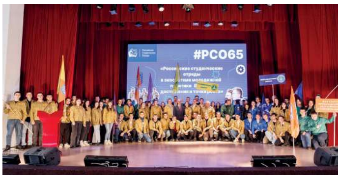
Движению студенческих отрядов Российской Федерации – 65!

В ВолГАУ подвели итоги I этапа Всероссийского конкурса на лучшую научную работу среди студентов, аспирантов и молодых ученых аграрных образовательных и научных организаций России в 2024 году. Мероприятие проходило по пятнадцати профильным направлениям для студентов и семи – для аспирантов и молодых ученых. Общее количество участников составило 55 человек. Победители, занявшие I и II места, будут представлять наш университет во II этапе, который состоится на площадках ведущих аграрных вузов Южного и Северо-Кавказского федеральных округов. Подробности на официальном сайте вуза.