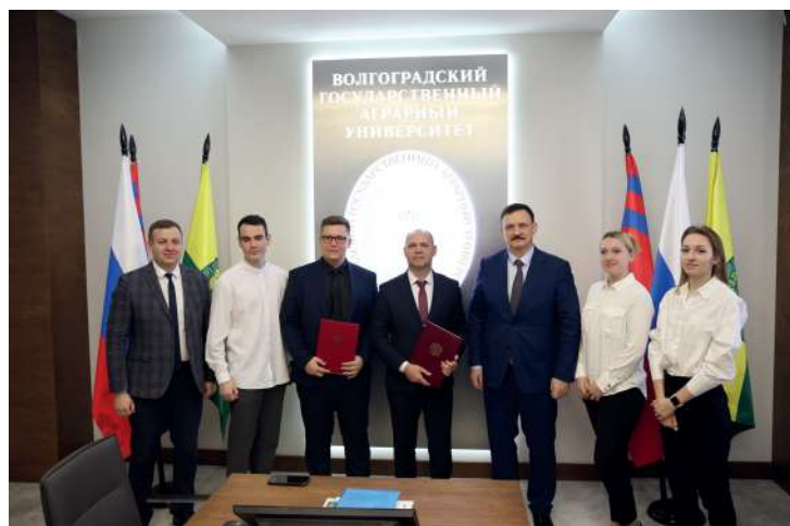
Участники подписания соглашения ВолГАУ с ООО «МОРЕПЛАСТ»

В субъекте также уделяется большое внимание воспроизводству рыбных ресурсов: только в 2023 году в Волгоградской области благодаря привлечению федеральных, региональных и внебюджетных средств в водоемы выпущено более 12 млн мальков осетровых пород рыб, сазана, толстолобика, белого амура.