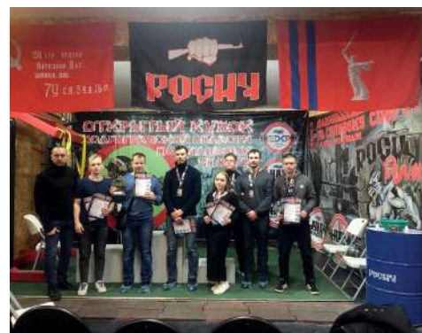
Сборная ВолГАУ на III месте Открытого Кубка по силовым видам спорта

Подведены итоги проходившего в г. Волжском Открытого Кубка Волгоградской об-