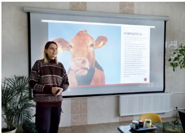
Представление проекта перед экспертами и специалистами индустриального партнера в СП «Донское»

Эти разработки стали победителями акселерационной программы «Бизнес-акселератор «Агромир будущего» – мероприятие проводилось в вузе четвертый год подряд благодаря грантовой поддержке Министерства науки и высшего образования. Участники научились разрабатывать качественные, востребованные на современном рынке стартап-проекты.