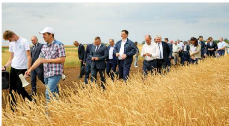
Региональный День поля «Волжская нива» — современная площадка для демонстрации передовых достижений

Изо дня в день Волгоградский ГАУ с уверенностью шагает в будущее. Приближается новый, 2026 год, он олицетворяет неукротимую энергию, скорость, стремительные и яркие перемены. Год подходит для тех, кто готов действовать, принимать смелые и честные решения, проявлять инициативу и двигаться вперед, а значит, настает новая эпоха новых достижений Волгоградского государственного аграрного университета.