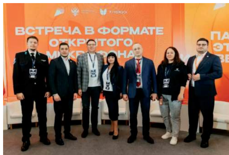
Формат открытого микрофона «Друзья Ассоциации» стал площадкой для обсуждения актуальных подходов к патриотическому воспитанию

Участники подчеркнули, что задача молодежных сообществ – не изобретать заново инструменты, а адаптировать уже работающие форматы и усиливать горизонтальные связи между клубами, школами, вузами и общественными организациями.