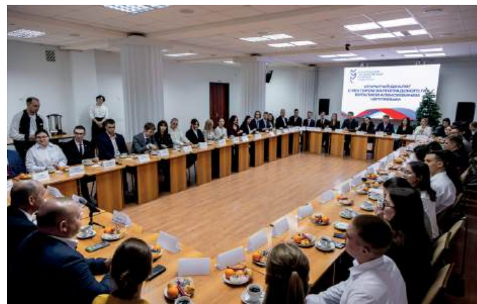
Общение с самыми неравнодушными и активными представителями вуза прошло в теплой дружеской обстановке за чашкой чая

В завершение встречи ректору вручили небольшую статуэтку символа наступающего года, а каждый ее участник по уже сложившейся традиции загадал исполнение мечты и произнес пожелания собравшимся – здоровья, счастья, сил, быть первыми во всём и везде, оставаться верными себе, своему выбору, вузу и стране.