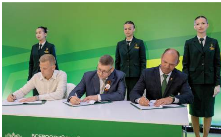
На Всероссийском дне поля подписано трехстороннее соглашение о сотрудничестве между ВолГАУ, АО «Россельхозбанк» и ООО «STEMY»

Благодаря стратегическому партнерству и финансовой поддержке компании «Сады Придонья» стала возможной реализация масштабного проекта – открытие конгресс-холла НПП «Сады Придонья», обновленного и оснащенного