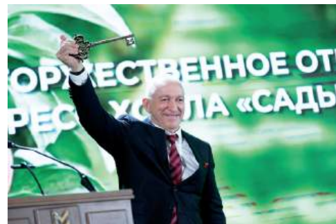
Торжественное открытие конгресс-холла НПП «Сады Придонья»

лица-интерната «АгроЛидер» и модернизации арочного ангара в «Крытый конный манеж».