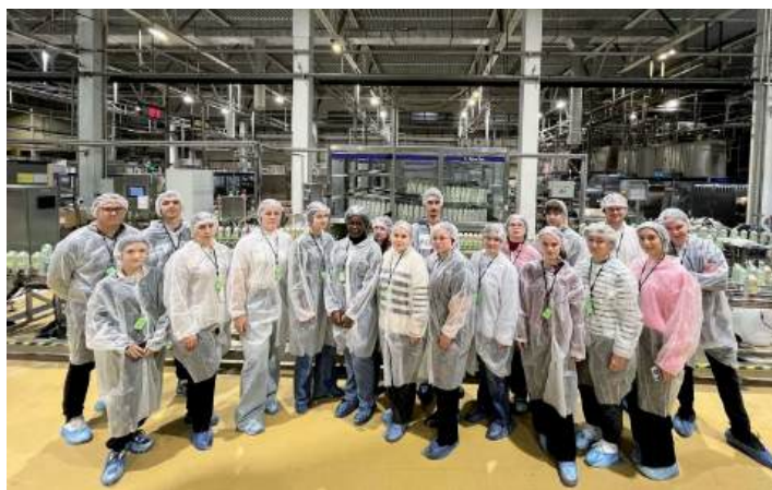
Организация экскурсий на ведущие агропромышленные предприятия региона – одна из задач амбассадоров Центра карьеры