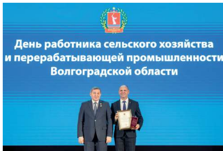
Губернатор Андрей Бочаров вручил орден «За заслуги перед Волгоградской областью»

В Год Великой Победы и защитника Отечества университет получил высочайшую оценку региона – орден «За заслуги перед Волгоградской областью». Вручение состоялось в торжественной обстановке, награду за особо выдающиеся заслуги в социально-экономическом развитии Волгоградского края вручил Герой России Губернатор Андрей Бочаров.