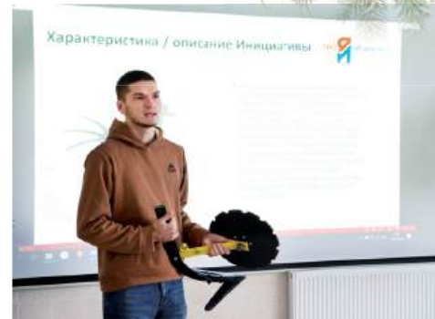
Разработчиков инновационных проектов пригласили в СП «Донское»

– Проект «НеПростой хлеб» относится к группе биомедицинских технологий, поскольку направлен на разработку персонализированного питания посредством создания хлебобулочных изделий с использованием нетрадиционного сырья, обогащенных биологически активными компонентами, что способствует улучшению здоровья и поддержанию активного долголетия, – уточняет капитан команды.