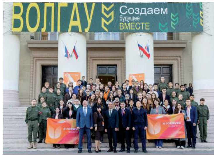
В 2025 году Волгоградский ГАУ стал площадкой Всероссийского молодежного патриотического форума «Юг России на страже продовольственной безопасности страны»

Волгоградский ГАУ – победитель Всероссийского конкурса команд по воспитательной работе и молодежной политике в номинации «Патриотическое воспитание и единство народов». Торжественная церемония награждения прошла 18 декабря в Национальном центре «Россия» на Всероссийском конгрессе по молодежной политике и воспитательной работе.