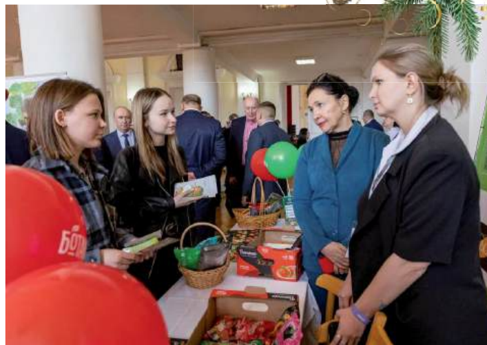
Традиционная ярмарка вакансий проходит также с участием Центра карьеры