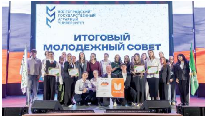
На сцене конгресс-холла – победители итогового рейтинга факультетов по воспитательной работе и молодежной политике