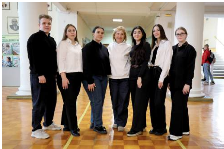
Команда амбассадоров Центра карьеры ВолГАУ расширяет карьерные перспективы для студентов

Завершается 2025 год, и Центр карьеры Волгоградского государственного аграрного университета подводит итоги работы вместе с командой студентов-амбассадоров. Именно благодаря их усилиям обучающиеся нашего вуза получают уникальную возможность строить карьеру, находить стажировки и развивать профессиональные компетенции.