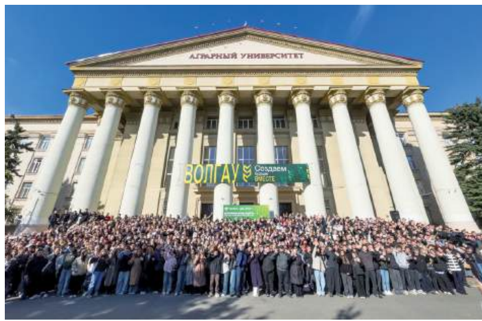
Грантовый проект «Агромир будущего: жить и работать в АПК» объединил 145 000 участников из 40 регионов страны

Шестой год подряд ВолГАУ принимает участников Всероссийского конкурса среди обучающихся образовательных учреждений сельской местности «АгроНТРИ».