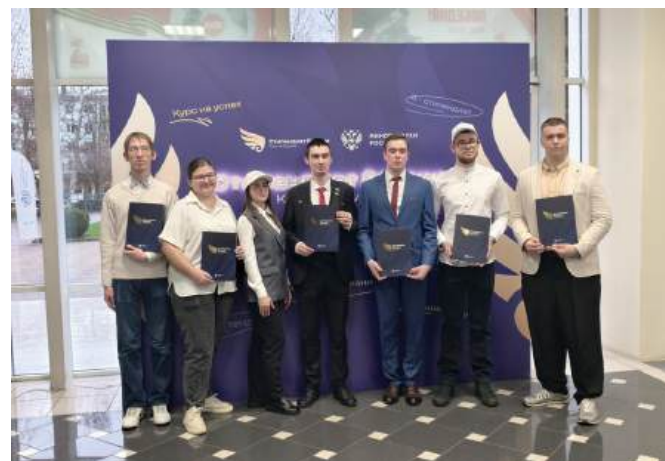
Победители конкурса на торжественном вручении стипендий Президента и Правительства Российской Федерации

Стипендии Правительства Российской Федерации удостоены три человека, обучающихся по образовательным программам высшего образования. В конкурсной группе «Сельское хозяйство и сельскохозяйственные науки» – студент 2-го курса направления подготовки магистратуры факультета биотехнологий и ветеринар-