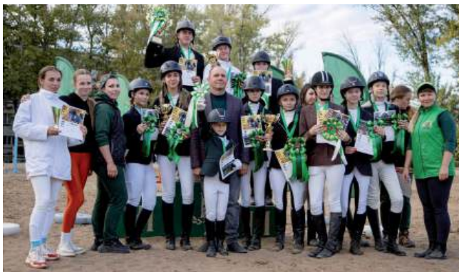
Воспитанники консультационного конноспортивного центра «Добрыня» продемонстрировали рекордные показатели

Визитной карточкой вуза остается учебно-консультационный конно-