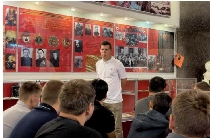
Экскурсионно-патриотический проект «200 дней и ночей» ВолГАУ признан лучшей практикой по патриотической работе

В этом году в проекте, который реализует Обществом «Знание» совместно с Минобрнауки и при поддержке Росмолодежи, приняло участие 866 заявок от университетов из 82 регионов страны. В итоге в финал вышли 143 команды из 58 регионов, а победителями в восьми номинациях стали 29 команд.