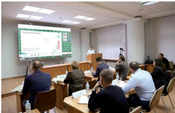
На итоговом демодне все десять проектов прошли экспертизу