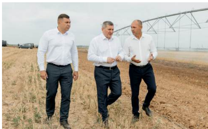
Результаты научно-исследовательской деятельности представлены губернатору на площадке полигона «Агробиотехнологий»

2025 год стал рекордным по количеству поданных заявлений в рамках приемной кампании – 22 042, что почти в два раза превышает показатели прошлого года.