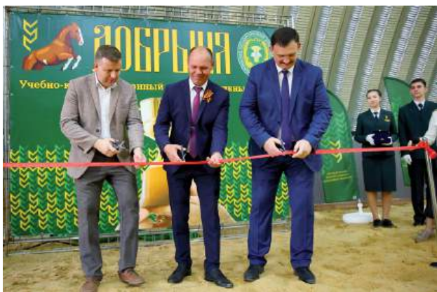
Торжественное открытие модернизированного «Крытого конного манежа»

По итогам года университет вошел в топ-5 вузов Министерства науки и высшего образования РФ, заняв четвертое место в России по эффективности воспитательной работы и молодежной политики среди 590 образовательных организаций высшего образования.