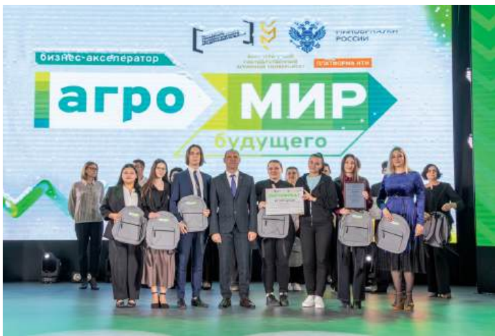
Победителей бизнес-акселератора наградили на заключительном Молодежном совете вуза

Напомним, что целью акселерационной программы «Бизнес-акселератор «Агромир будущего» является поддержка проектных команд и студенческих инициатив для формирования инновационных продуктов в рамках федерального проекта «Платформа университетского технологического предпринимательства». При этом приоритетным направлением является решение реальных производственных задач сельхозтоваропроизводителей.