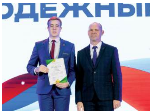
На Молодежном совете ВолГАУ наградили лучших из лучших

Завершена еще одна триумфальная страница истории в жизни вуза – на торжественном, заключительном в этом году заседании Молодежного совета поздравили и наградили всех причастных к ее написанию. Конгресс-холл «Сады Придонья» едва вместил всех, кто в 2025 году демонстрировал свои лучшие качества, получал новые знания, развивал научную сферу, занимал лидирующие позиции в конкурсах и фестивалях.