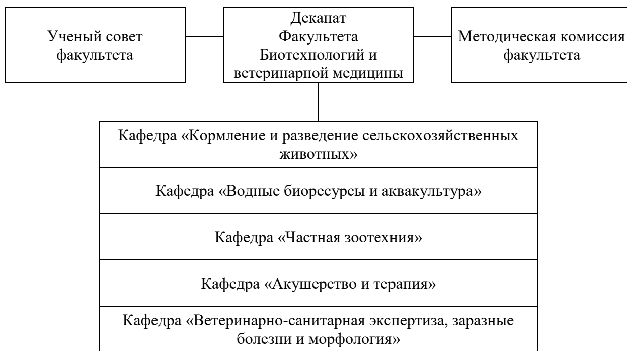
Рисунок 1 – Структура факультета Биотехнологий и ветеринарной медицины ФГБОУ ВО Волгоградский ГАУ

Реализация образовательной программы высшего образования по направлению подготовки 36.04.02 Зоотехния (профиль) «Разведение генетика и селекция сельскохозяйственных животных» (далее – образовательная программа) в ФГБОУ ВО Волгоградский ГАУ осуществляется с 2023 года. Подготовка ведется на факультете биотехнологий и ветеринарной медицины ( https://volgau.ru/obrazovanie/fakultety-i-kafedry/fakultet-biotekhnologiy-i-veterinarnoy-meditsiny/ ) (рисунок 1).