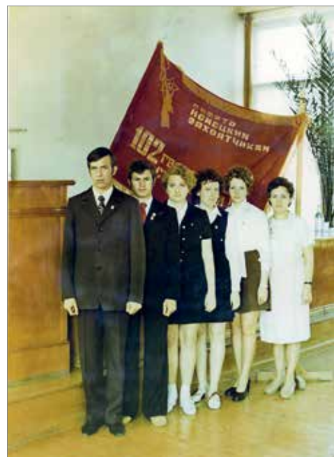
Группа «Поиск», 1973 год

С 1995 по 2018 годы в полевых выездах с участием отряда «Сталинград» были обнаружены и торжественно перезахоронены останки более 3 800 солдат и офицеров