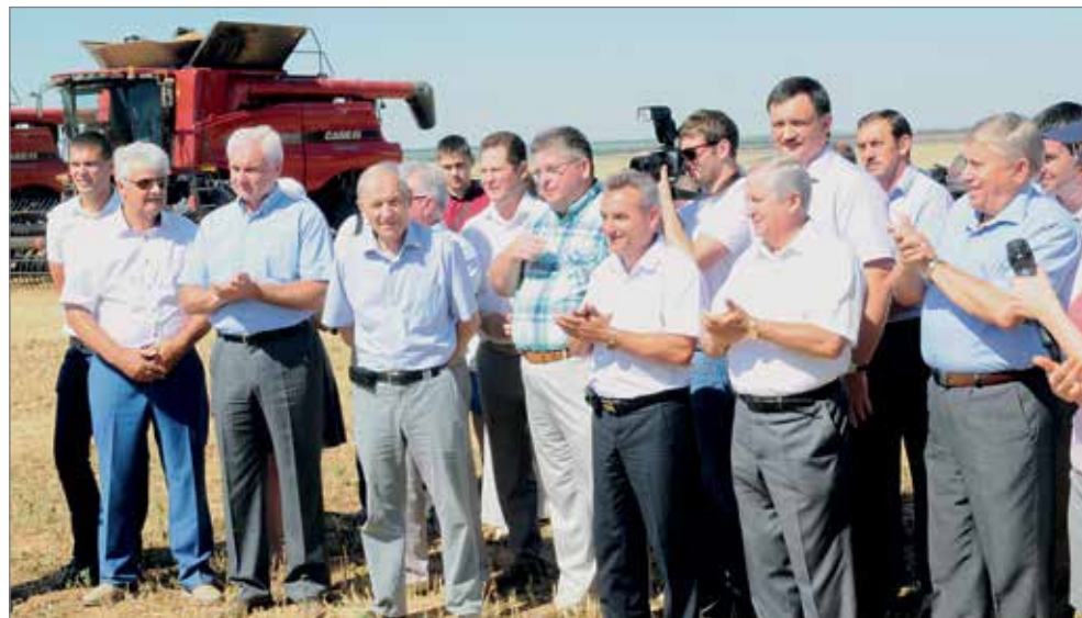
День поля в АО «АКСАЙСКОЕ»

1944 • ССХИ • ВСХИ • ВТСКА • ВОЛГАУ • 2019