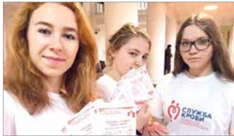
Активисты центра «СТАРТ» призывают всех присоединиться к донорскому движению

Они делают много, гораздо больше, чем другие люди. Они спасают жизни и лечат покалеченные души, отогревают замёрзших и помогают найти дорогу сбившимся с пути. Да, речь идёт о волонтерах. О тех, у кого большие и чистые сердца. Это настоящие герои современного мира, которые живут своим делом и верны себе.