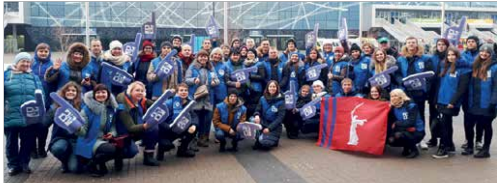
Волгоградские волонтеры в Москве, декабрь 2018 г.

Число добровольцев постоянно растет, а количество их добрых дел увеличивается