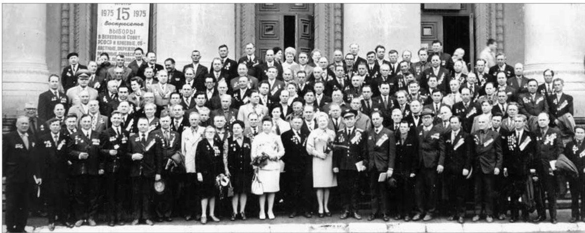
Ветераны 35-й гвардейской стрелковой дивизии, 1975 год

Праздничные мероприятия, посвященный 45-летию группы «Поиск», будут приурочены к 76-й годовщине Победы в Сталинградской битве и пройдут в январе 2019 года.