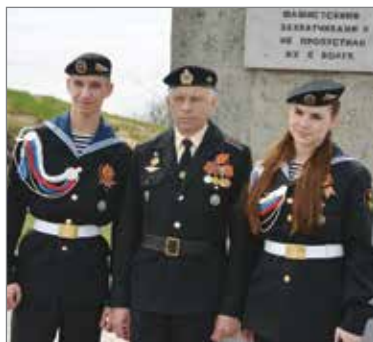
Участники слета на Мемориальном комплексе «Лысая гора»