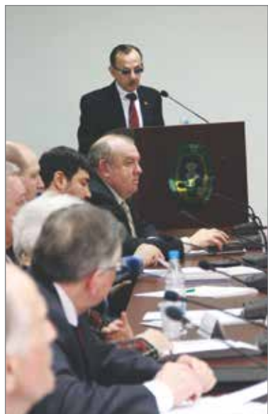
Ученые ВолГАУ озвучили предложения по развитию АПК региона

На заседании шла речь о развитии дорожной сети, строительстве новых школ и больниц, обеспечении социальных учреждений на селе продуктами питания и многим другим. Аграрии говорили о набравшем – реализации продукции, высокой стоимости энергоносителей, налоговой нагрузке. В итоге было решено, что местные сельхозпроизводители должны получить свое место на полках сетевых магазинов. Для этого необходимо строить новые логистические центры и склады и повысить ответственность глав сельских поселений за состояние дел в фермерских хозяйствах в их районах.