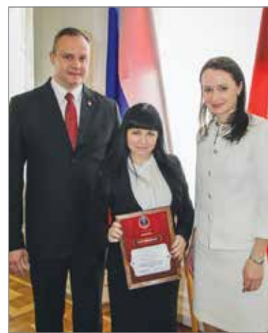
На церемонии награждения победителей конкурса на создание РЕКРУТИНГОВЫХ ЦЕНТРОВ

Рекрутинговые центры откроются в регионе в апреле-мае, в середине апреля уже состоялся первый тренинг для руководителей и сотрудников рекрутинговых центров. В течение трех дней на базе детского лагеря «Зеленая волна» участники семинара ознакомились с программой и правилами подготовки волонтеров, рассмотрели ключевые направления деятельности. Регистрация кандидатов в городские волонтеры начнется уже во втором квартале 2016 года, поэтому в процессе обучения особое внимание уделено технологиям