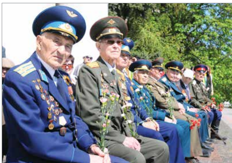
Сильны традиции: ветераны наблюдают за парадом курсантов военной кафедры на Аллее им. 35-й Гвардейской дивизии