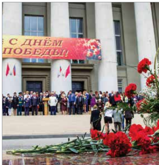
Торжественные мероприятия, приуроченные ко Дню Победы, проходят в вузе каждый год

Несомненно, «лидер» и «личность» – понятия разных уровней. Личность – уровень глу-