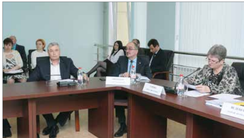
СТРАТЕГИЮ СОЦИАЛЬНО-ЭКОНОМИЧЕСКОГО РАЗВИТИЯ РЕГИОНА ОБСУЖДАЮТ ПРЕДСТАВИТЕЛИ ВЛАСТИ, ОБЩЕСТВЕННОСТИ И НАУЧНОГО СООБЩЕСТВА

Основное внимание при планировании производства в растениеводстве и животноводстве