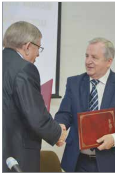
58 лет ГОСТЕХНАДЗОРУ РФ отметили в Волгоградском ГАУ: наградили лучших, отчитались о работе, подписали соглашение и победили в Спартакиаде

Волгоградоблгостехнадзор и Волгоградский ГАУ связывают долгие партнерские отношения, с 2012 года действует соглашение о взаимодействии. Ежегодно студенты проходят производственную прак-