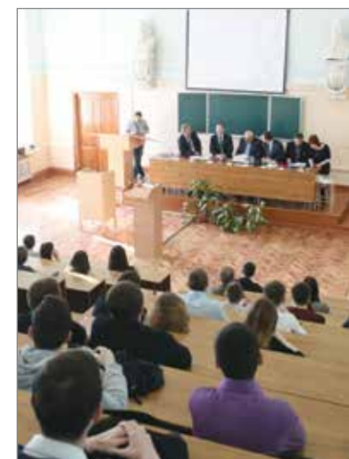
Студенты и район: КОНТАКТ ЕСТЬ!

Встречи проходили в дружеской и теплой атмосфере и были полезны не только студентам. Представители власти и руководители хозяйств могли оценить уровень подготовки и заинтересованность в работе на селе специалистов, которые через несколько лет приедут в район.