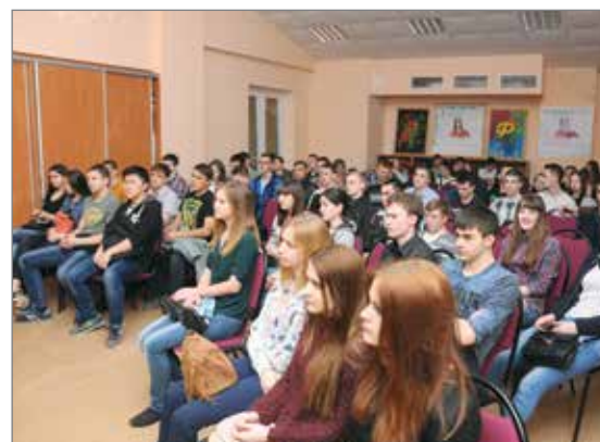
Проект «Кинопутешествие в Сталинградскую битву» собрал заинтересованную аудиторию