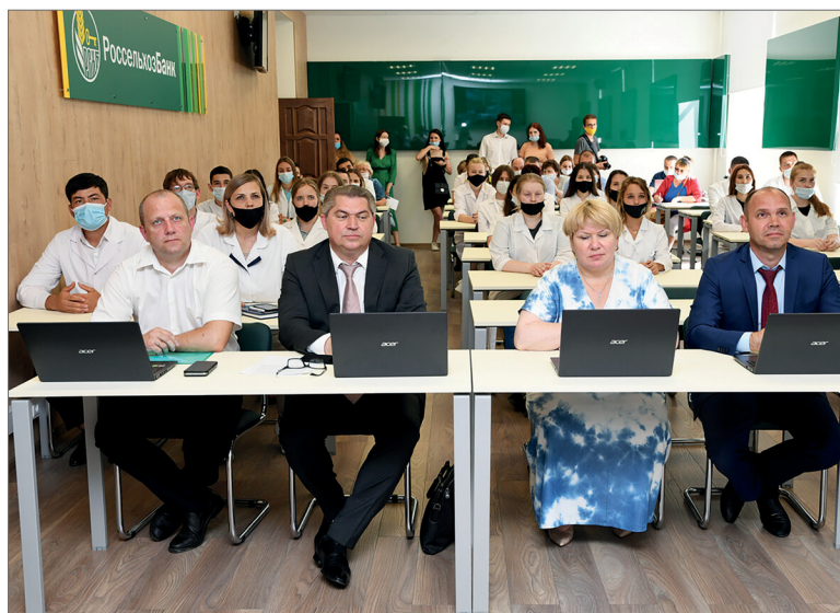
Первое занятие в многофункциональной онлайн-агностудии