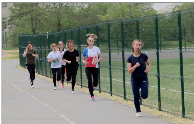
Бег входит в число обязательных испытаний

дая ступень нормативов распределяет результаты по трем уровням сложности, при сдаче которых участник награждается золотым, серебряным или бронзовым знаком отличия вместе с удостоверением.