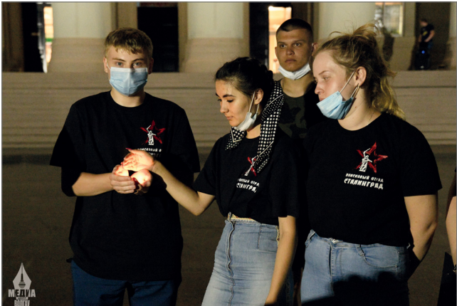
Акция «Свеча Памяти»

Испытания и победы многонационального советского народа в Великой Отечественной войне наряду с россиянами вспомнили граждане других стран СНГ – в аграрном университете состоялись круглый стол и торжественная акция, посвященные 80-й годовщине начала главного противостояния XX века.