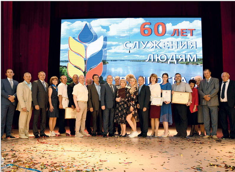
На юбилей съехались работники организации со всей области