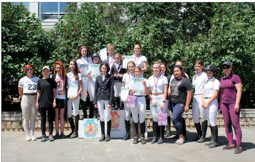
Участники домашних соревнований