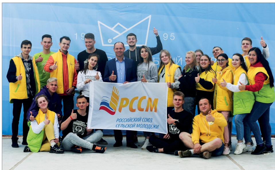
Форум сельской молодежи «Точка роста» собрал порядка 300 делегатов со всей области

– Важно, что презентация конкурса «Твой ход» проходила совместно с образовательными площадками от «Лидеров России» – действующих предпринимателей, директоров фирм, компаний и предприятий. Особо ценно, что они смогли передать студентам свой опыт, знания