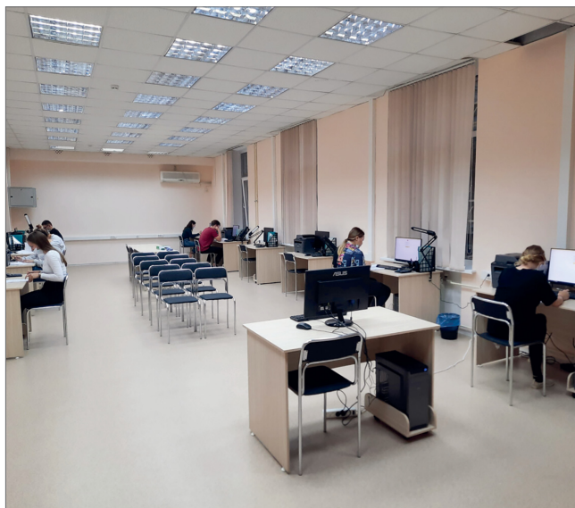
Демонстрационный экзамен сдали студенты ИНО по компетенции «Бухгалтерский учет»

Демонстрационный экзамен предусматривает моделирование реальных производственных условий, чтобы выпускники могли показать экзаменаторам свои профессиональные умения и навыки. Испытания состоялись на аккредитованной площадке Волгоградского государственного аграрного университета с участием сертифицированных экспертов Агентства развития профессионального мастерства (Ворлдскиллс Россия). В 2021 году экзамен сдавали 24 студента очной формы обучения. При успешном результате выпускник получает паспорт компетенции (Skills Passport).