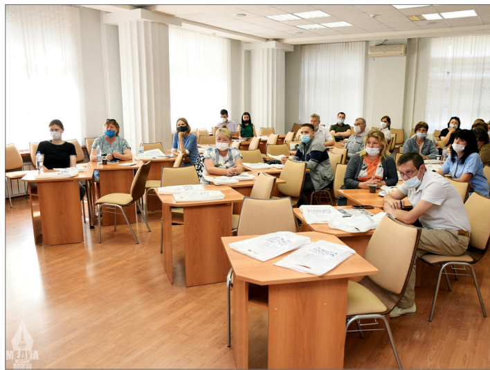
Занятием заинтересовались представители крупных сельхозпредприятий региона

Компания GENEX – признанный мировой лидер в индустрии искусственного осеменения. Быки GENEX происходят от выдающихся предков и проходят тщательный отбор, генетическая ценность каждого из них устанавливается при помощи геномного анализа и подтверждается в ходе программы оценки по потомству. GENEX входит в состав компании CRI («Кооператив Рисорсиз Интернешнл», Си-Ар-Ай), крупнейшего кооператива, который объединяет около 18 тысяч фермеров со всей территории США. Это самая большая организация подобного рода в мире, в которой трудятся около 2 тысяч работников всех уровней и специальностей. Компания реализует семя быков молочных и мясных пород в более чем 80 стран мира.