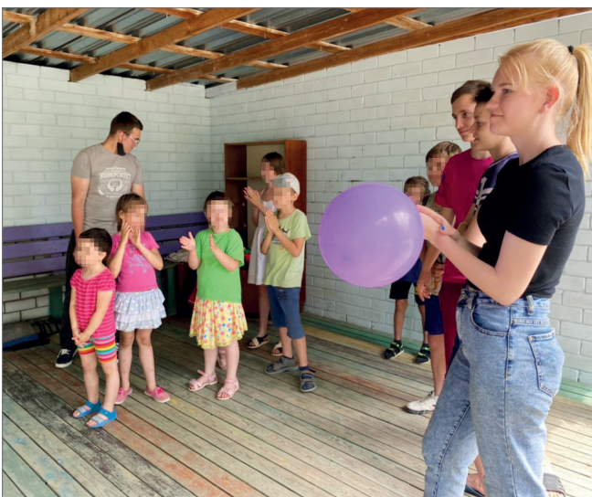
Главным событием стал тематический квест «В поисках сокровищ»

В течение всего этого дня в стенах учреждения не смолкали музыка и детский смех. Ребята с удовольствием участвовали в конкурсах и выигрывали сладкие призы, разучивали движения флешмоба. Но главным событием, безусловно, стал тематический квест: необходимо было перехитрить коварных пиратов и вернуть самым лучшим мальчикам и девочкам коробку мороженого.