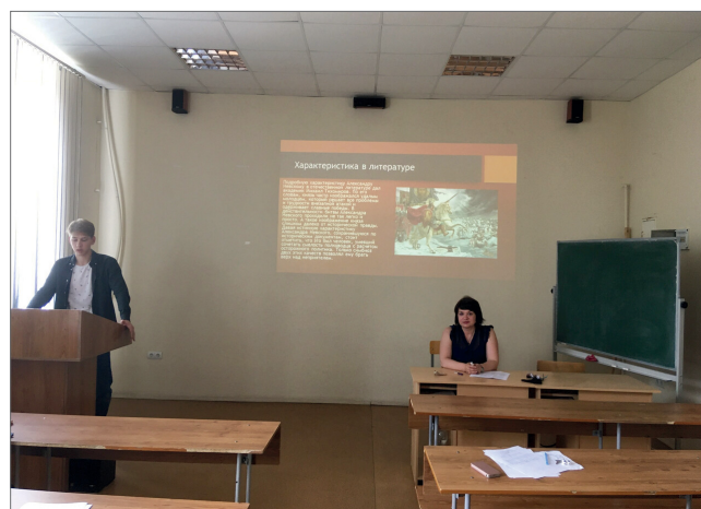
Студенты отметили, что после мероприятия у них появилось желание больше узнать о личности Александра Невского

В ходе работы конференции прозвучали доклады, которые оживили образ князя и повысили интерес к его