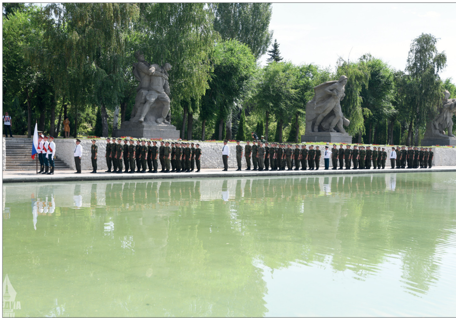
Присяга на главной высоте России — добрая традиция Волгоградского ГАУ

Участники церемонии возложили цветы и венки к Вечному огню в память о павших в Великой Отечественной войне.