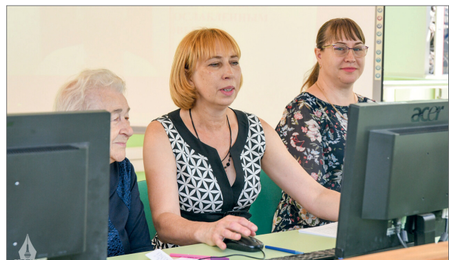
Преподаватели вуза поделились опытом работы со студентами специальной медицинской группы

В режиме онлайн состоялся круглый стол «Особенности организации учебной, научной и физкультурно-оздоровительной работы со студентами с ослабленным здоровьем», организованный в соответствии с планом работы Совета по физической культуре и спортивно-массовой работе при ассоциации «Агрообразование».