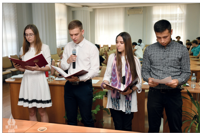
Студенты России и Узбекистана поделились своими любимыми произведениями о войне

В подтверждение ее слов обучающиеся двух постсоветских государств подготовили целый ряд номеров на воен-