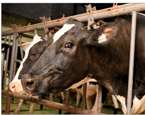
Практическая часть семинара проводилась в ООО «СП «Донское»

Практическая часть семинара проводилась на базе ООО «СП «Донское», где участникам продемонстрировали применение новаторских технологий искусственного осеменения, рассказали