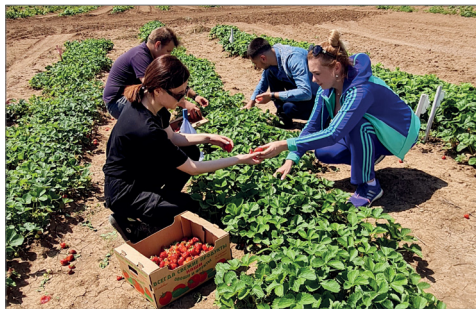
Студенты любят работать с этой культурой — земляника благодарное растение

В июне на полях инновационной деревни ВолГАУ уже собрали первый урожай – созрела земляника, которая возделывается по технологиям органического земледелия. Хотя погодные условия и внесли свои коррективы в сроки, качество и объем плодов порадовали специалистов.