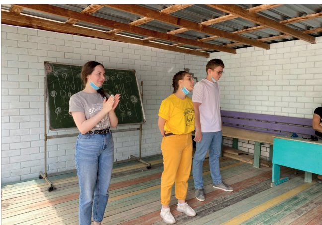
Активисты вуза всегда с удовольствием участвуют в выездах в центр для несовершеннолетних