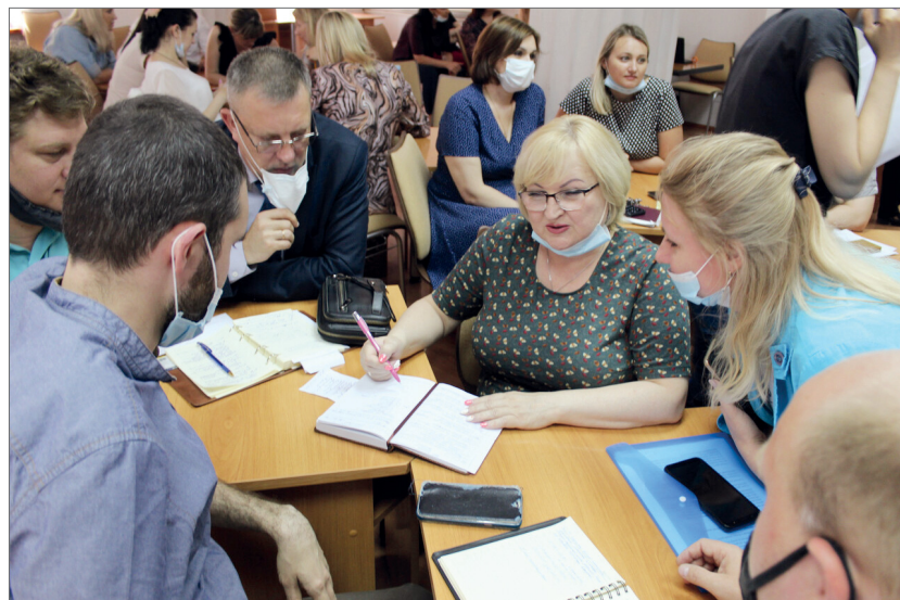
В рамках конференции прошли повышение квалификации 156 человек из числа сотрудников вуза