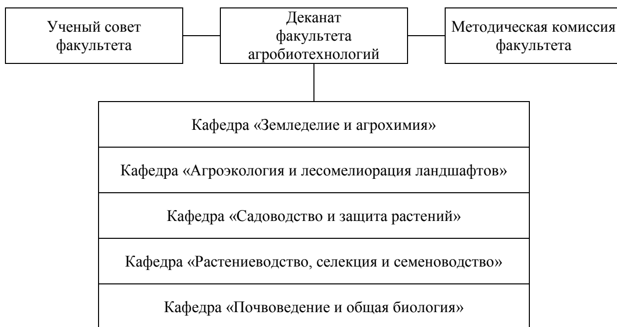
Рисунок 1 – Структура факультета агроботехнологий ФГБОУ ВО Волгоградский ГАУ

Реализация образовательной программы высшего образования по направлению подготовки 35.03.01 Лесное дело (профиль) «Воспроизводство лесов и их использование» (далее – образовательная программа) в ФГБОУ ВО Волгоградский ГАУ осуществляется с 2022 года. Подготовка ведется на факультете агроботехнологий ( https://volgau.ru/obrazovanie/fakultety-i-kafedry/fakultet-agrobiotekhnologiy ) (рисунок 1).