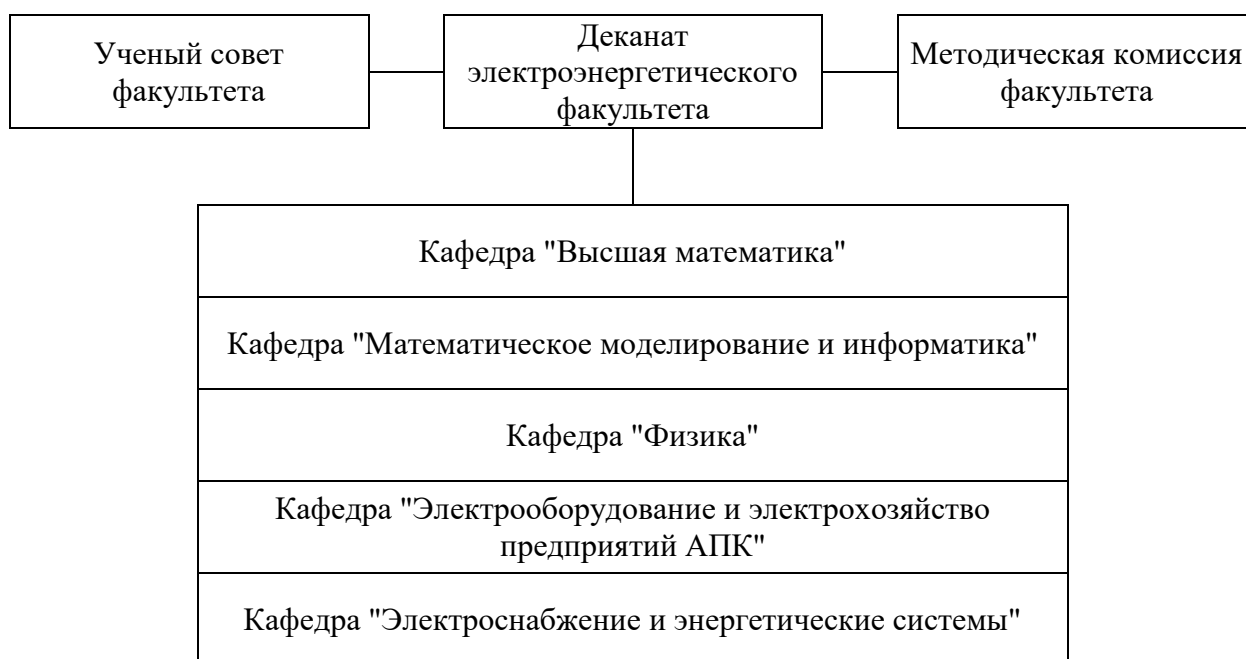
Рисунок 1 – Структура электроэнергетического факультета ФГБОУ ВО Волгоградский ГАУ

Реализация образовательной программы высшего образования по направлению подготовки 35.03.06 Агроинженерия направленность (профиль) «Автоматизация и роботизация технологических процессов в АПК» (далее – образовательная программа) в ФГБОУ ВО Волгоградский ГАУ осуществляется с 2019 года. Подготовка ведется на электроэнергетическом факультете ( https://volgau.ru/obrazovanie/fakultety-i-kafedry/elektroenergeticheskiy-fakultet/ ) (рисунок 1).