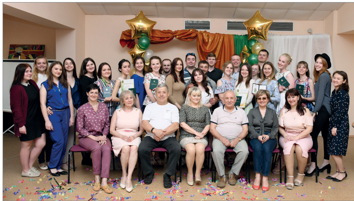
Выпуск-2019 Центра духовно-нравственного воспитания и художественного творчества

В целом данное направление координирует центр духовно-нравственного воспитания и ху-