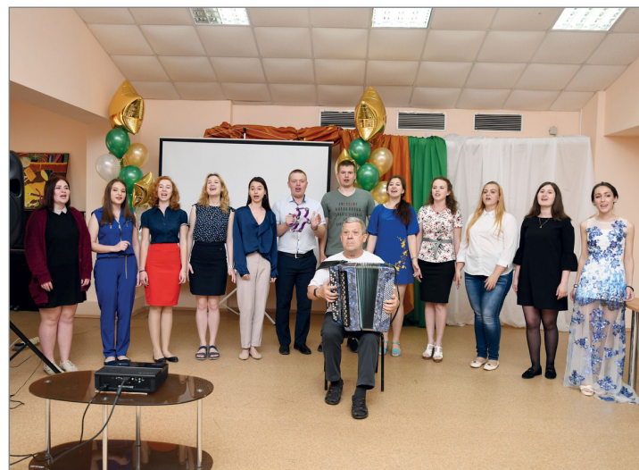
Выпускников поздравил ансамбль песни и пляски «Колос»