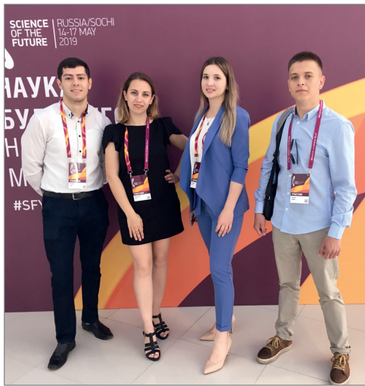
Представители ВолГАУ на форуме в Сочи

Добавим, что на форуме «Наука будущего – наука молодых» для финалистов была запланирована не только деловая программа, но и множество культурных мероприятий. Одним из них стал музыкальный вечер России и Австрии, прошедший под патронатом Санкт-Петербургского дома музыки, а также, множество экскурсий по объектам Парка науки и искусства «Сириус», достопримечательностям города Сочи и окрестностям.