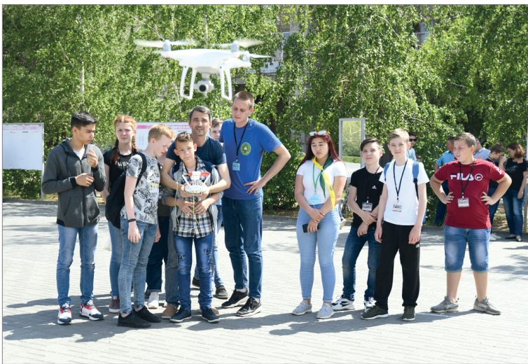
Каждый участник попробовал управлять агрокоптером

– Здесь мне нравится всё! В нашем плотном графике есть не только занятия, но и развлечения. У меня был выбор между «АгроКосмосом» и «АгроМетео», но я выбрал первое, так как тематика космоса мне интереснее.