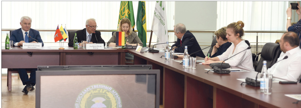
На презентации проекта присутствовали депутаты облдумы и Госдумы, преподаватели вуза, аграрии региона

Волгоградский ГАУ с визитом посетили официальная делегация АККОР и эксперт Немецкого крестьянского союза (ФРГ) доктор Франц Йозеф Файтер. На площадках аграрного университета состоялось обсуждение международного проекта развития сельскохозяйственных кооперативов на территории Российской Федерации. Также немецкого гостя познакомили с инвестиционным потенциалом вуза, продемонстрировали достижения отечественных селекционеров, рассказали об истории развития кооперативного движения в нашем регионе.