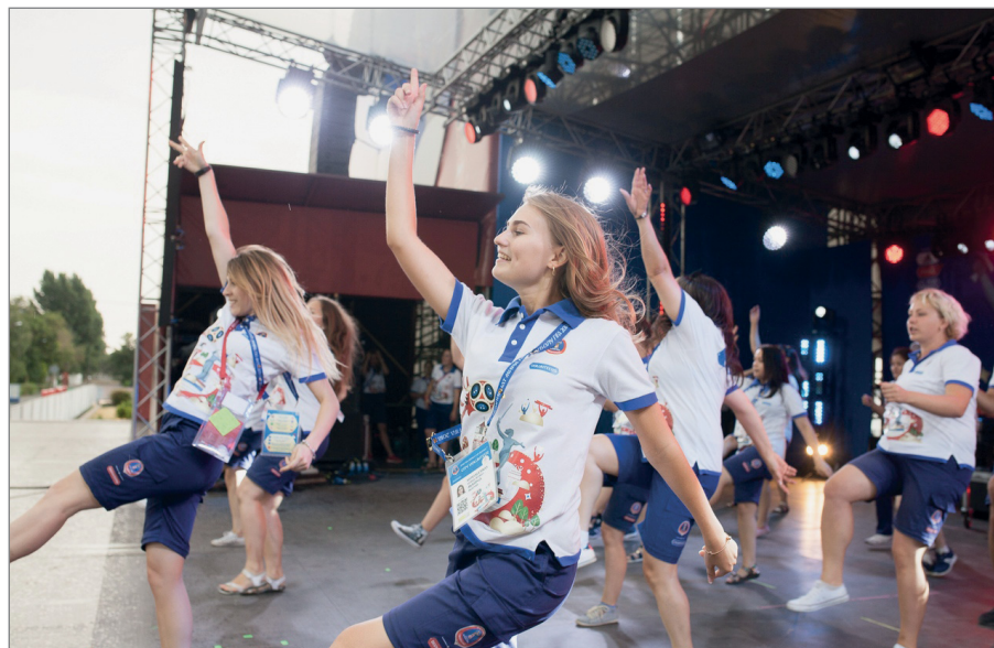
Волонтеры ВолГАУ на чемпионате мира – 2018