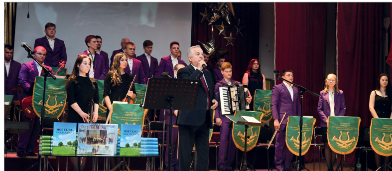
Презентация книги школьных сочинений «Моё село – моя гордость»

– В опубликованной книге живая история нашего края в реальных событиях, судьбах и лицах, рассказы о простых скромных хлеборобах и о знаменитых на всю страну Героях Труда. Волгоградская земля вдохновила вас на искренние слова любви не только к своему родному краю, но и к людям, которые живут в сельской глубинке. Спасибо всем, кто принял участие в конкурсе! Ждем вас в нашем вузе теперь в качестве студентов.