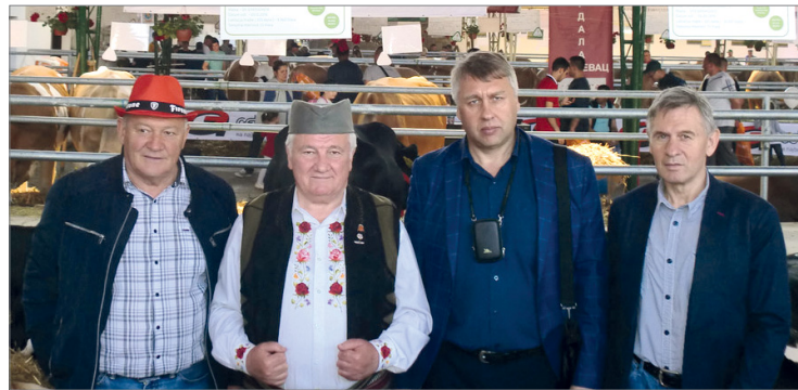
Волгоградская делегация посетила животноводческий комплекс «Дельта Аграр»

Добавлю, благоустройство и использование «живых уголков» является своеобразной визитной карточкой современных крупных животноводческих комплексов