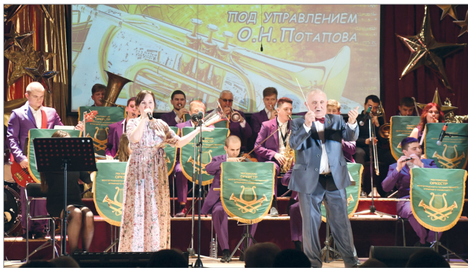
Юбилей оркестра отметили в теплой дружеской обстановке

В последний день апреля в Волгоградском государственном аграрном университете состоялся праздничный концерт ректорского эстрадно-духового оркестра, посвященный 10-летию коллектива. К своему юбилею оркестр подготовил большую праздничную программу с участием как действующих музыкантов и вокалистов, так и выпускников вуза.