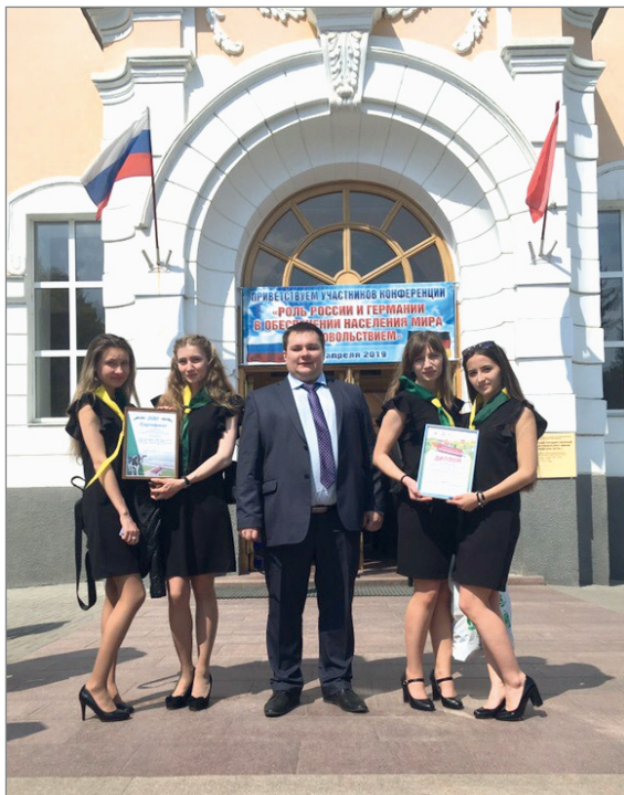
Команда – победитель всероссийской игры «Начинающий фермер»

экономическую и юридическую обоснованность бизнес-плана. Также учитывалось качество презентации продукции. Кроме победы в конкурсе, команда Волгоградского государственного аграрного университета была отмечена специальным призом – сертификатом, который дает право прохождения оплачиваемой стажировки на предприятиях агрохолдинга «ЭкоНива».