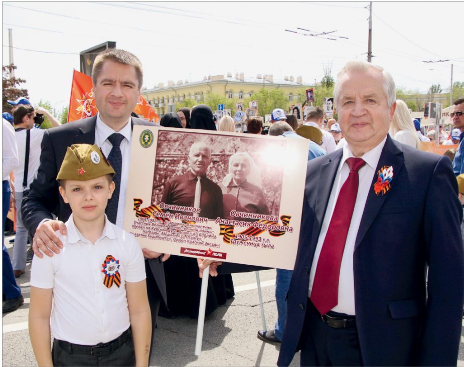
Акция «Бессмертный полк»

Май в Волгоградском государственном аграрном университете прошел под знаком Дня Победы. Как в преддверии великой даты, так и после нее состоялось множество мероприятий. В торжествах приняли участие студенты, сотрудники, преподаватели и ветераны вуза, гости из других регионов.