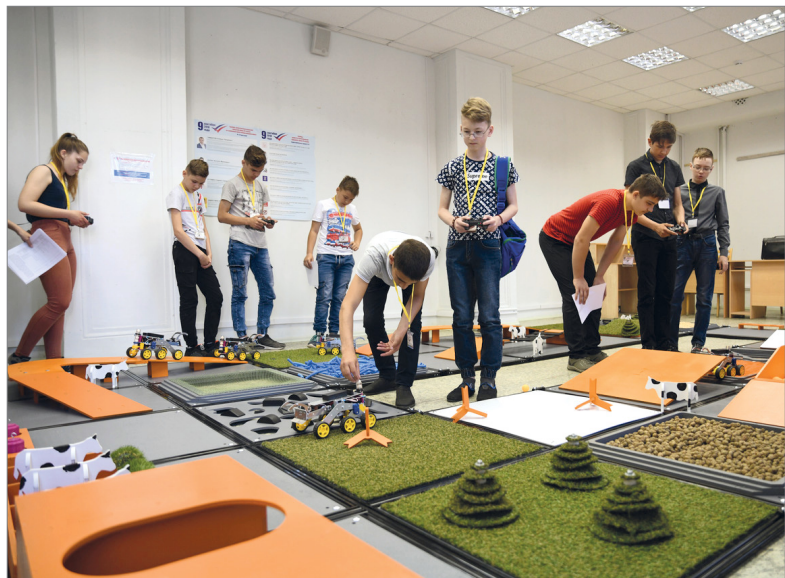
Участники направления «АгроРоботы» тренируются на конкурсном полигоне

Каждый год в летний период увеличивается число пожаров в нашем регионе. К сожалению, из-за удаленности пожарных частей, плохих дорог, отсутствия связи и первичных средств пожаротушения обычно до приезда огнеборцев в населенных пунктах успевает сгореть не один дом. Если не хотите попасть летом в такую тяжелую ситуацию, то, прежде всего, не разводите костры вблизи строений. Запрещено разжигать огонь ближе 50 метров от жилья в ветреную погоду, а также оставлять непотушенное пламя без присмотра. Постоянно следите за чистотой на участке, вовремя окашивайте траву и убирайте мусор. Разъясните детям правила пожарной безопасности, расскажите им о трагических последствиях игр с огнем. В садоводческих товариществах нужно обязательно позаботиться о запасе воды для тушения пожара, регулярно чистить искусственные или естественные водоемы, сделать удобные подъезды для пожарных автомобилей. Обнаружив пожар, немедленно вызывайте пожарную охрану по телефону: 01 или 101.