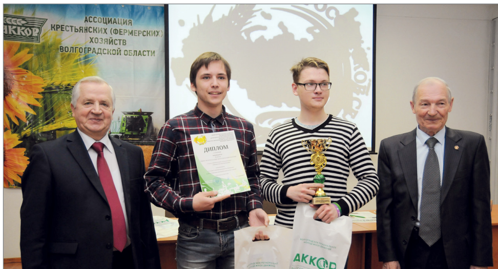
Награждение победителей конкурса

– Нужна молодежь с ее передовыми знаниями, с ее медийным опытом. В наш стремительный век молодежь должна быть лидером аграрного движения, – отметила в