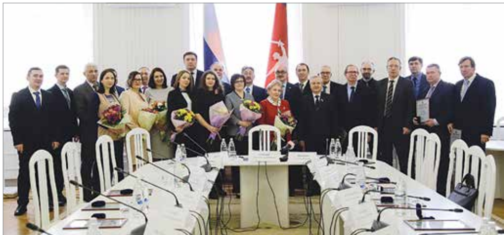
УЧАСТНИКИ ТОРЖЕСТВЕННОЙ ЦЕРЕМОНИИ НАГРАЖДЕНИЯ