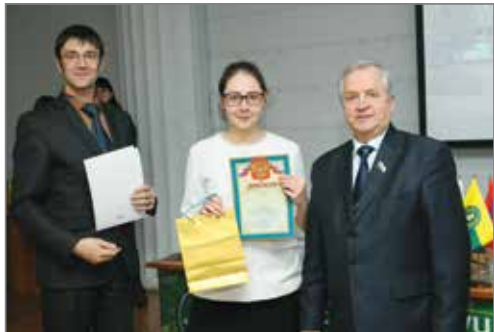
Лучшие из лучших были награждены дипломами, сертификатами и памятным подарками

Популяризация и развитие науки – одно из приоритетных направлений работы Волгоградского аграрного университета. С 14 января по 10 февраля уже в восьмой раз в вузе проходил Региональный научно-исследовательский конкурс «Новое поколение выбирает науку». В мероприятии, организованном при поддержке областного комитета образования и науки, приняли участие более 120 человек - студенты средних профессиональных образовательных учреждений, а также школьники Волгограда и области.