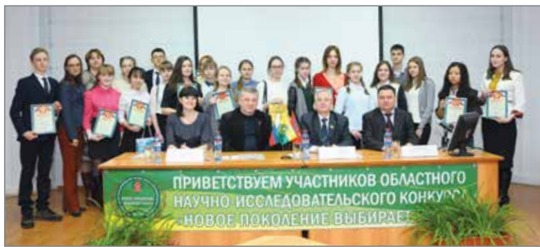
Участники Регионального научно-исследовательского конкурса «Новое поколение выбирает науку»