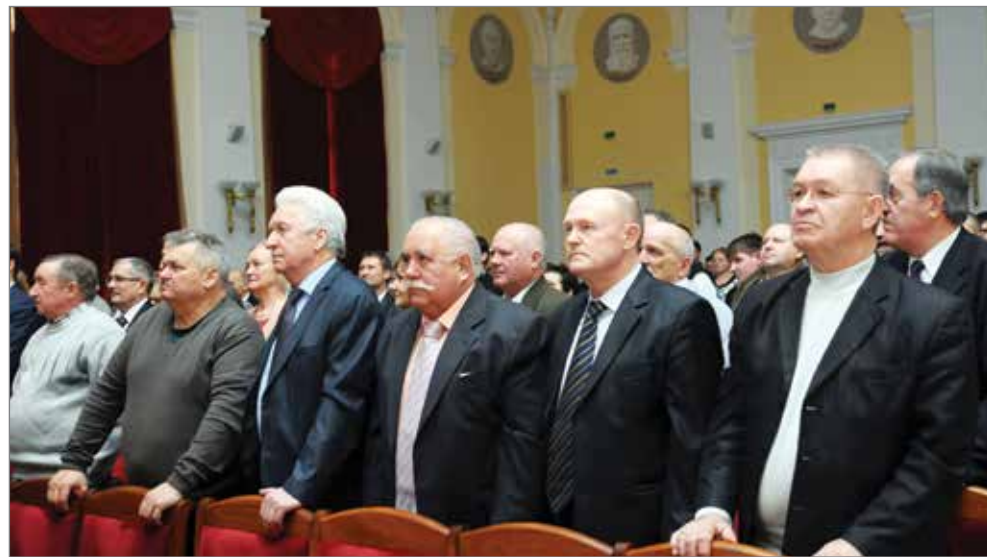
Гости торжества внимательно слушают гимн Волгоградского ГАУ

Партнеры университета ПАО «МРСКА Юга», ПАО «Волгоградоблэлектро», ПАО «Волгоградэнерго» и другие отметили высокий потенциал выпускников факультета.