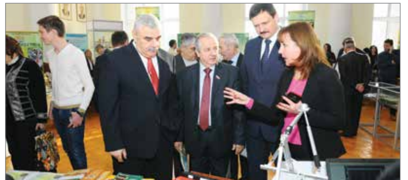
Международная научно-практическая конференция началась с выставки достижений Волгоградского ГАУ