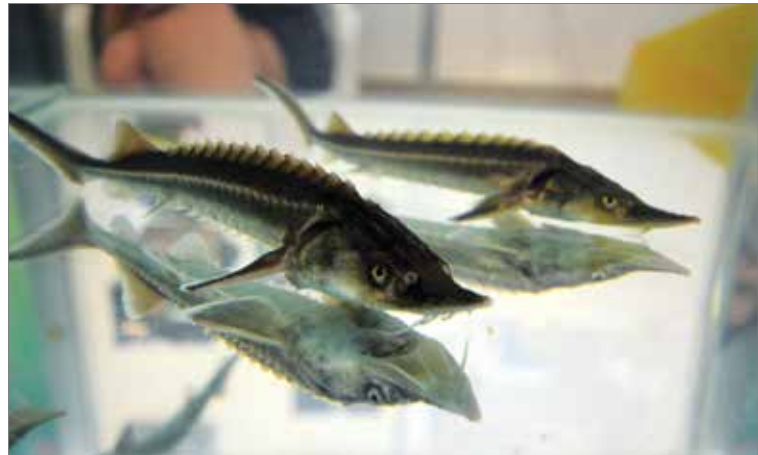
Полосатые мальки русского осетра в проблемной научно-исследовательской лаборатории вуза