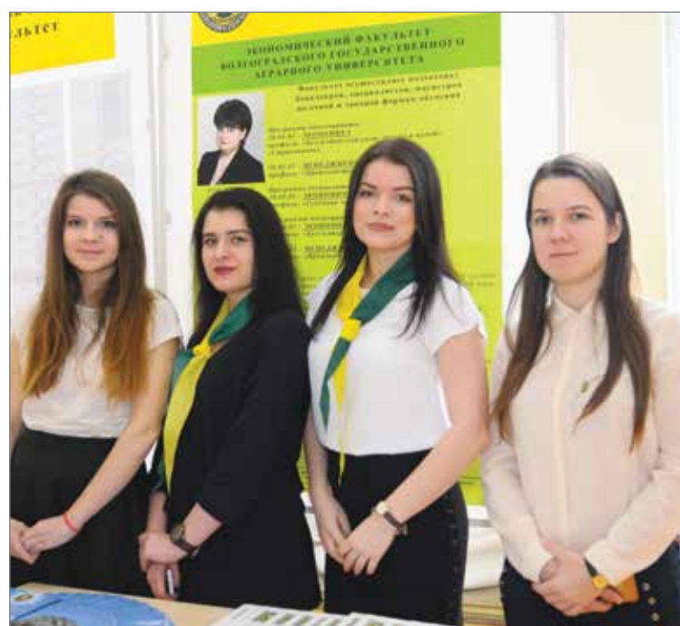
Студенты экономического факультета на ярмарке вакансий

Официальная часть завершилась вручением выпускникам вуза направлений