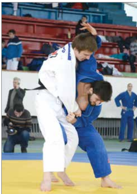
Участники соревнований проявили небывалое мужество, отвагу и волю к победе

7 февраля команды 15 ведущих аграрных вузов России встретились, чтобы сразиться за звание лучшего. Чемпионат по дзюдо прошел в рамках VIII Зимней универсиады высших учебных заведений Министерства сельского хозяйства Российской Федерации. Организатором мероприятия выступил Волгоградский ГАУ. Местом проведения состязания стал легкоатлетический манеж ВГАФК.