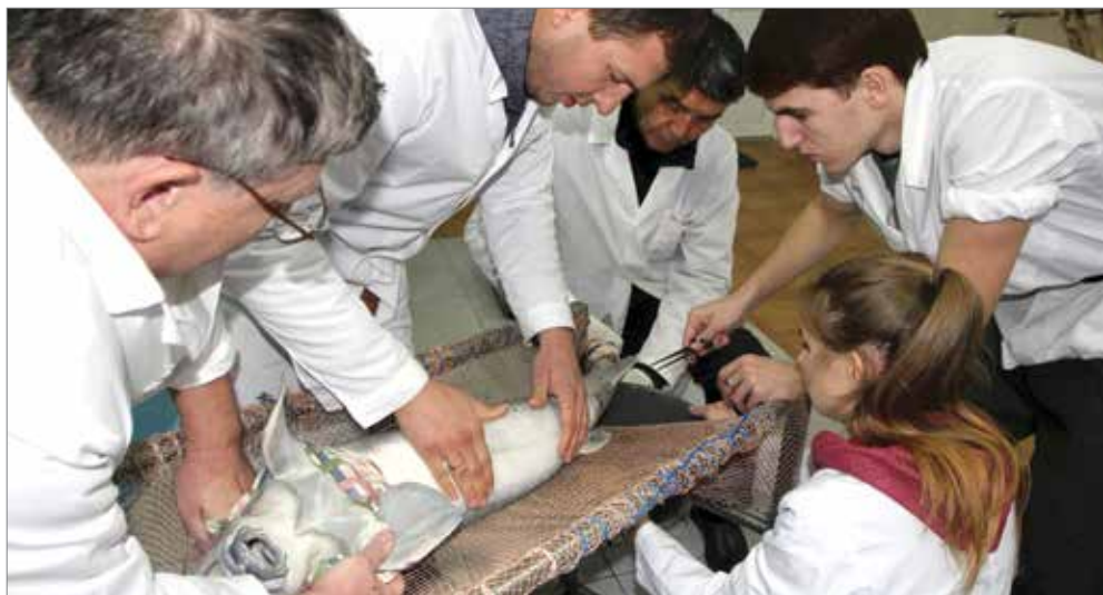
Исследователи ВолГАУ готовят брать икру у самки русского осетра

Сегодня ПНИЛ «Разведение ценных пород осетровых» реализует несколько ключевых направлений работы. Важнейшим из них является подготовка квалифицирован-