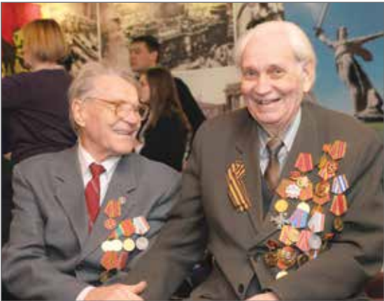
Гости в Музее боевой славы Волгоградского ГАУ