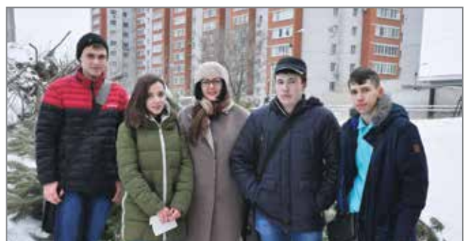
Участники акции «Вторая жизнь новогодней красавицы»

В рамках акции «Вторая жизнь новогодней красавицы» группе активистов ИНО удалось собрать 77 ёлок. Подготовка деревьев к дальнейшему использованию происходила в несколько этапов: с них собирали хвою, затем ее закладывали на сушку, а стволы распиливались на мелкие части. Весной руководство ИНО планирует исполь-