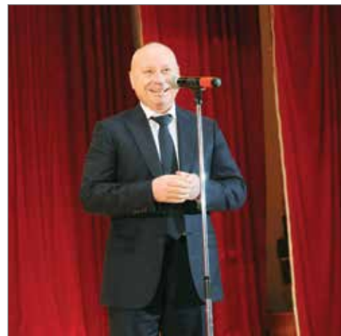
Гость праздника — Глава администрации Волгограда, выпускник электроэнергетического факультета В. В. Лихачев

3 февраля один из старейших факультетов Волгоградского ГАУ отметил юбилей. Поздравить преподавателей и студентов пришли выдающиеся выпускники и партнеры университета. В честь 65-летия в актовом зале Волгоградского ГАУ состоялся праздничный концерт.