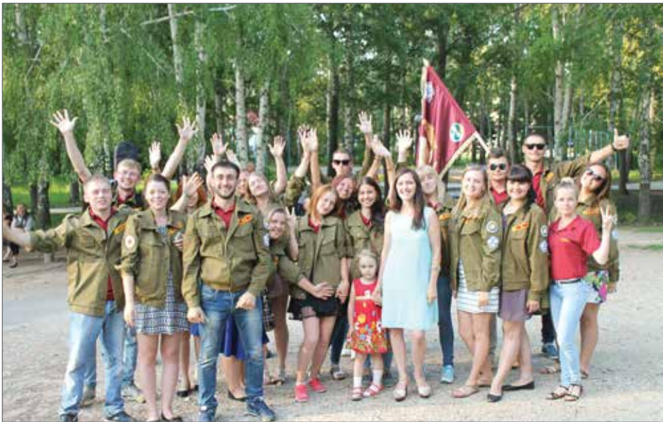
Всероссийский студенческий сельскохозяйственный отряд «Янтарь»

продуктов в мире. Но для этого необходимо и дальше прилагать усилия по подготовке молодых специалистов, благодаря участию которых будет возможно вывести работу агропредприятий на качественно новый уровень. Мы верим в сохранение сложившихся деловых и дружеских отношений, надеемся на дальнейшее сотрудничество. Желаем успешного развития и достижения новых вершин в профессиональной деятельности!