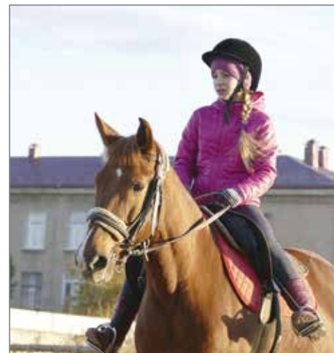
В 2017 году воспитанники конно-спортивного клуба «Добрыня» надеются вновь завоевать престижные награды на соревнованиях

Занятия с детьми проходят в конно-спортивном клубе «Добрыня» не только в рамках реабилитации. Более 700 часов в год инструкторы обучают ребят от 2 до 10 лет держаться в седле, преодолевать препятствия, ухаживать за животными, соблюдать технику безопасности и многому другому. Так, в 2016 году участие в Региональных конных пробегах принесло воспитанникам центра золотую медаль. Золото, серебро и бронзу юные спортсмены заво-