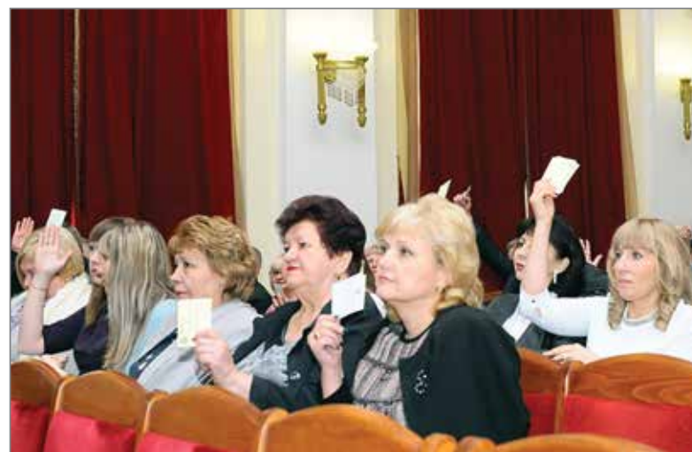
Участники конференции во время голосования