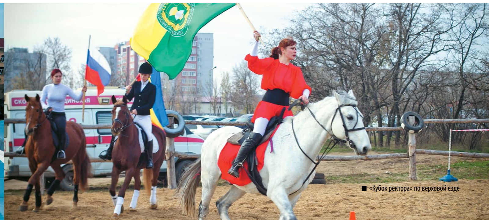
■ «Кубок ректора» по верховой езде