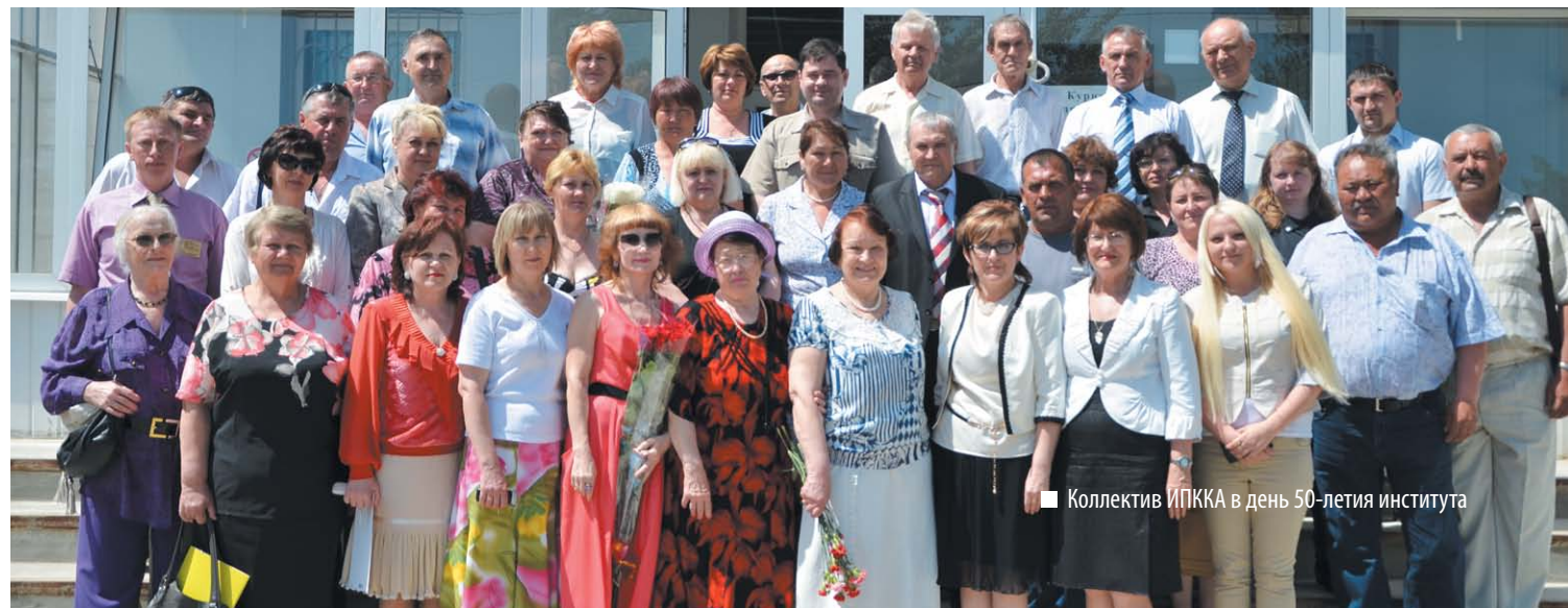
■ Коллектив ИПККА в день 50-летия института

Сегодня ИПККА уверенно смотрит в будущее и видит перспективы своего дальнейшего развития через максимальное расширение информационного и образовательного пространства, эффективное использование интеллектуального и производственного потенциала университета для своевременного и качественного обновления профессиональных знаний всех категорий специалистов, работающих в сфере АПК.