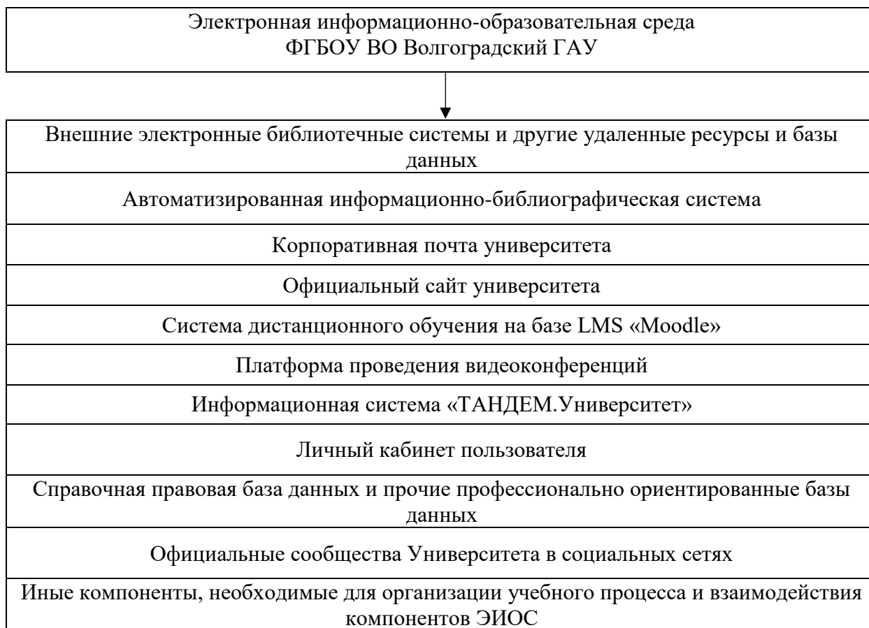
Рисунок 2 – Основные элементы электронной информационно-образовательной среды ФГБОУ ВО Волгоградский ГАУ

Электронная информационно-образовательная среда обеспечивает: