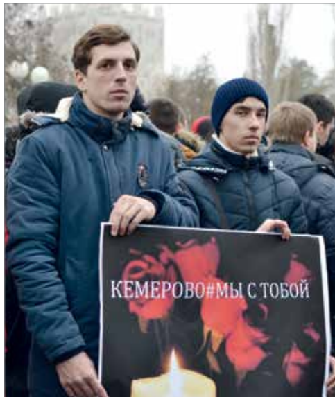
Участники митинга принесли цветы и игрушки, чтобы почтить память погибших