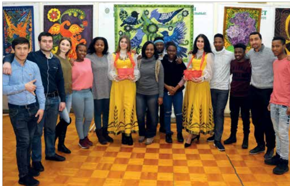
Фестиваль объединил студентов вуза из России и зарубежья

– Идея организовать фестиваль славянской культуры пришла сама собой, я давно увлекаюсь народными традиция-