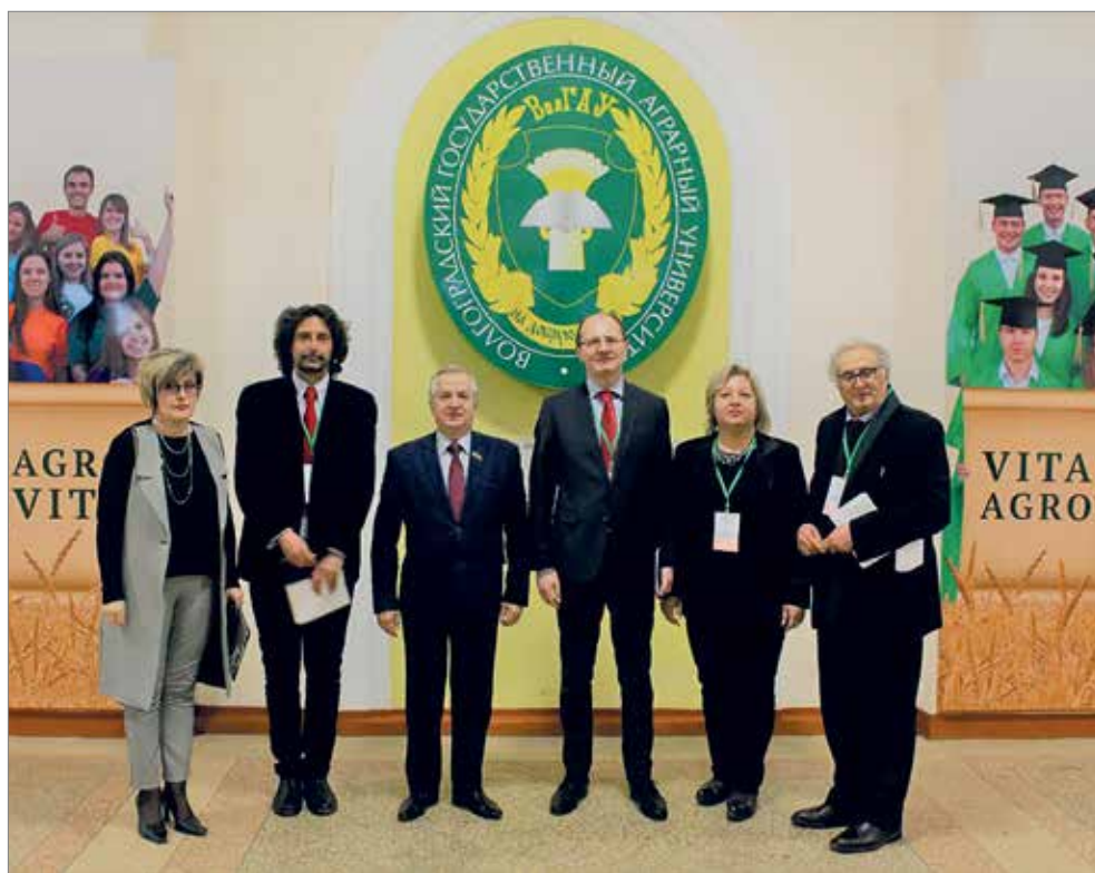
Иностранные наблюдатели в Волгоградском ГАУ

Кроме того, была подготовлена большая праздничная программа «Страна выбирает». В то время пока родители го-