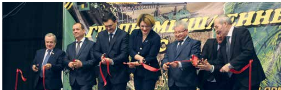
Открытие выставки «Агропромышленный комплекс – 2018»