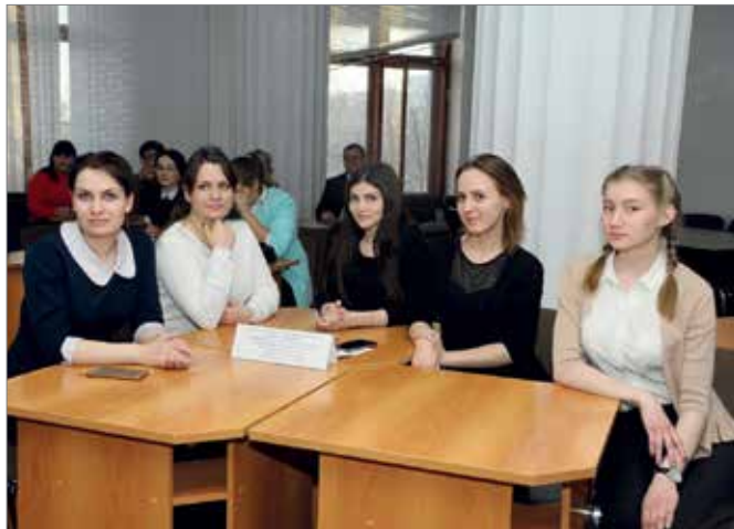
Команда экономического факультета – победители регионального этапа конкурса