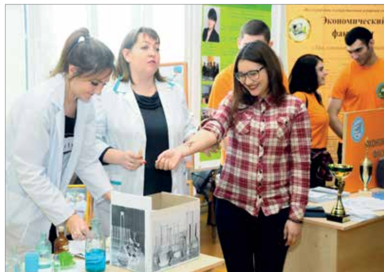
Активисты демонстрируют химические и биологические опыты для гостей вуза

25 марта в университете прошел День открытых дверей для будущих абитуриентов. По традиции гостями вуза стали старшеклассники и их родители из Фроловского, Еланского, Урюпинского, Калачевского, Среднеахтубинского и других районов Волгоградской области. Свои экспозиции представили 8 факультетов Волгоградского ГАУ и институт непрерывного образования.