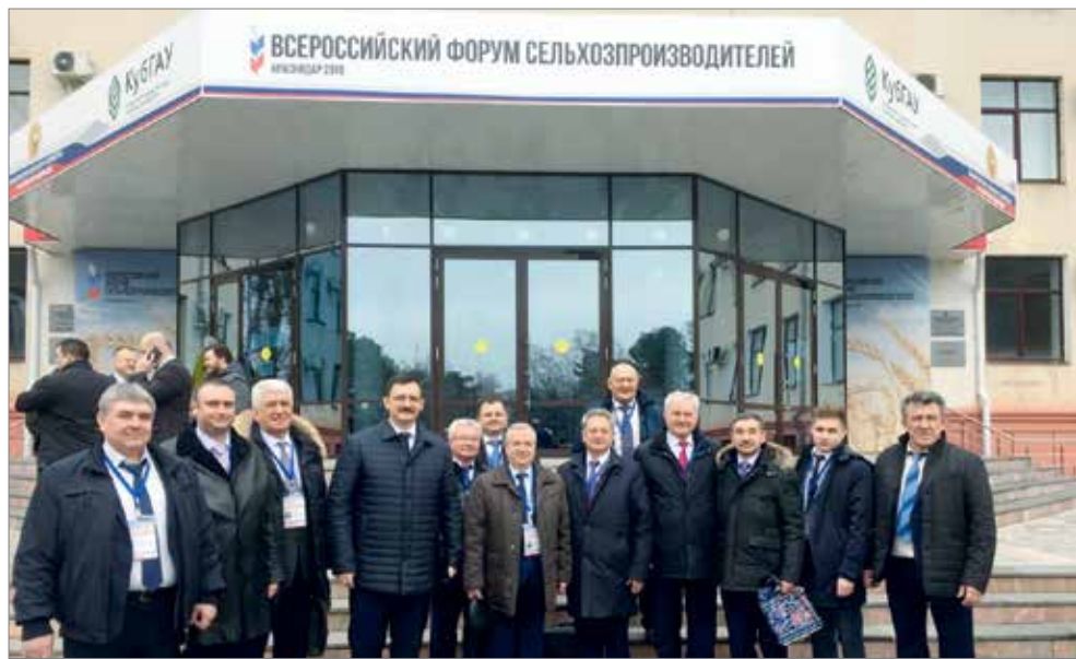
Делегация Волгоградской области