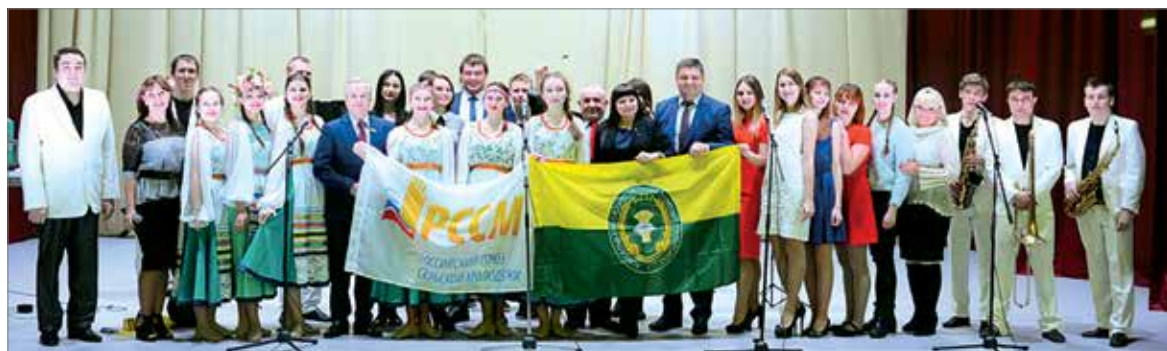
Всероссийская акция «Активность. Развитие. Творчество в село» в Среднеахтубинском районе