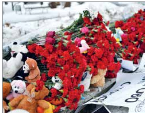
Траурная акция по погибшим в Кемерове в Комсомольском сквере

27 марта ВолГАУ присоединился к общенациональному трауру. Университет принял участие в акции «Кемерово, мы с тобой», которая проходила по всей России. Волгоградцы принесли в Комсо-