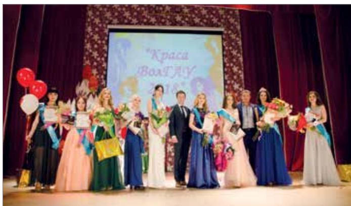
Участницы конкурса «Краса ВолГАУ – 2018»

По итогам 4 этапов конкурсного отбора компетентная комиссия сделала следующий выбор: