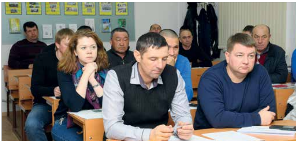
Слушатели программы «ПРОЕКТИРОВАНИЕ АГРОБИЗНЕСА НАЧИНАЮЩЕГО ФЕРМЕРА»

В Институте повышения квалификации кадров агробизнеса проходит обучение по программам «Проектирование агробизнеса начинающего фермера» и «Проектирование агробизнеса в условиях семейной животноводческой фермы». Курсы объединили предпринимателей в сфере АПК, которые будут претендовать на государственную финансовую поддержку в 2018 году. С февраля по март обучение прошли четыре группы слушателей, в планах – обучение еще двух.