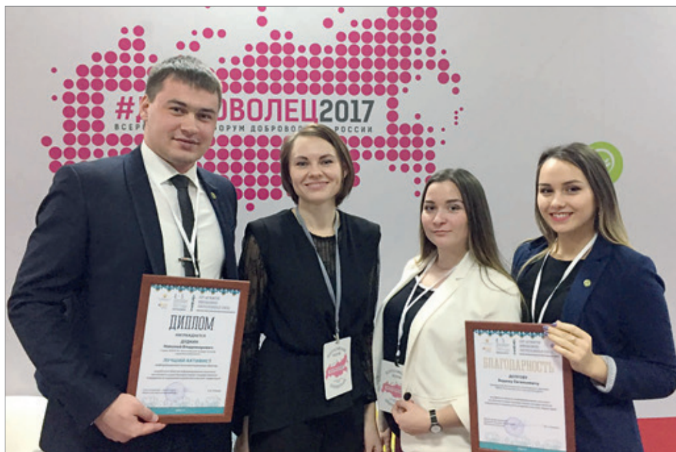
Участники Всероссийского слета активистов информационно-консультационных бригад

Напомним, что «Информационно-консультационные бригады» – это совместный проект РССМ, комитета сельского хозяйства Волгоградской области и Волгоградского ГАУ. За два года его реализации активисты посетили Дубовский, Иловлинский, Жирновский, Клетский, Новониколаевский, Еланский, Котельниковский, Старополтавский, Ленинский и Быковский районы. В мероприятиях приняли участие в общей сложности около тысячи жителей сельской мест-