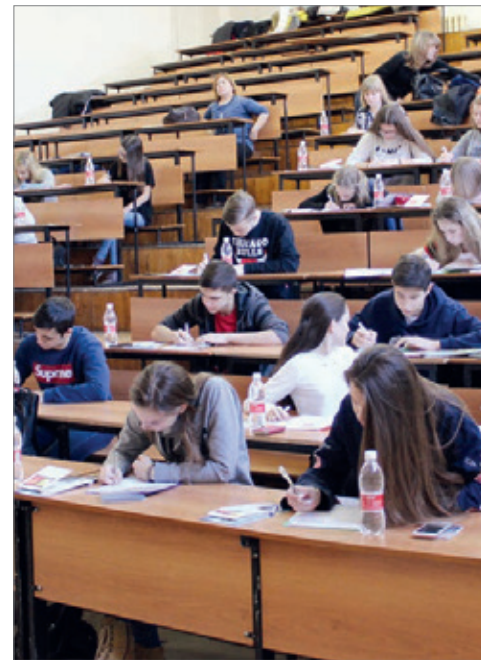
Очный этап I Региональной олимпиады по географии

9 декабря кафедра «Экология и экономика природопользования» организовала и провела I Региональную олимпиаду по географии. Мероприятие было направлено на популяризацию географических знаний и стимулирование массового интереса к географии и другим общественным и естественным наукам среди школьников города Волгограда и Волгоградской области, развитие познавательного интереса и творческих возможностей школьников по географическим дисциплинам, повышение общего уровня географической культуры.