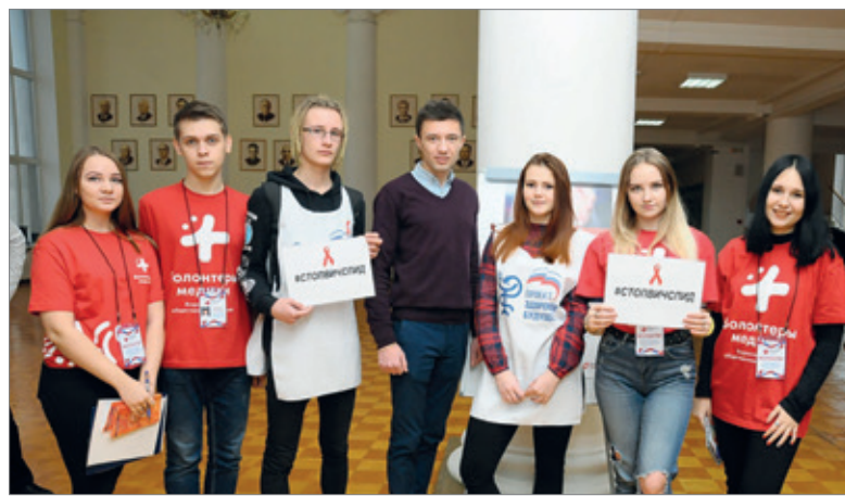
Волонтеры Волгоградского ГАУ на всероссийской акции «Стоп ВИЧ/СПИД»

– В этом году в Государственной Думе состоялся круглый стол по охране здоровья, на котором обсуждался вопрос обеспечения