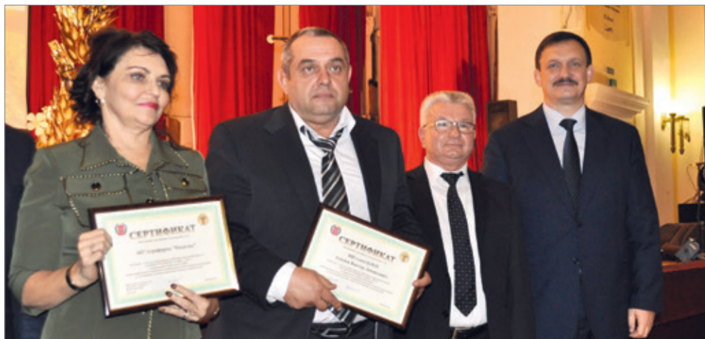
Церемония награждения в честь Дня работника сельского хозяйства

В 2017 году завершена реализация трех проектов по мелиорации, инициатор которых – глава КФХ