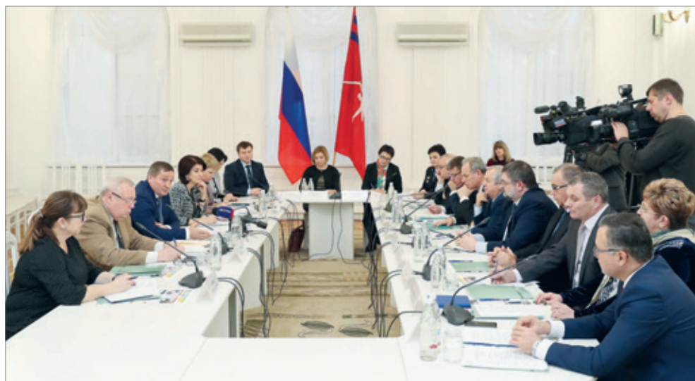
Губернатор Андрей Бочаров с ректорами волгоградских вузов

Сегодня увеличивается число бюджетных мест на специальности машиностроительного, химико-технологического, радиотехниче-