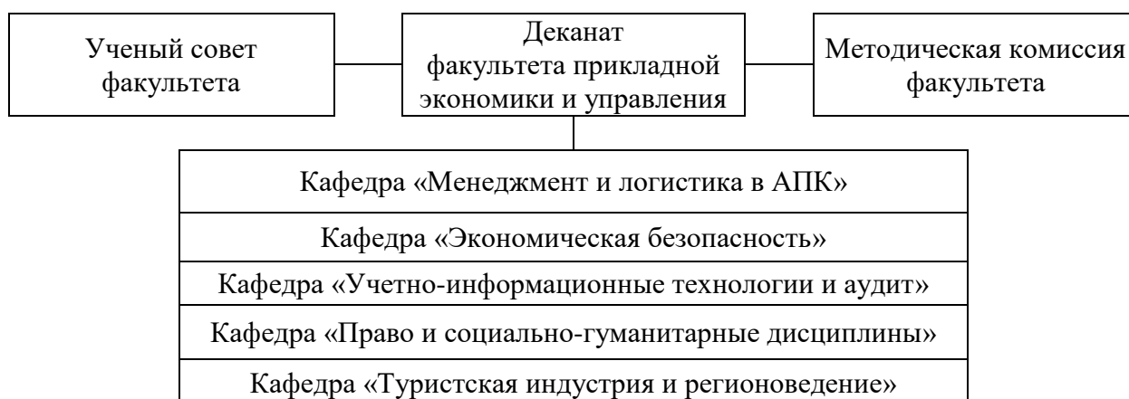
Рисунок 1 – Структура факультета прикладной экономики и управления ФГБОУ ВО Волгоградский ГАУ

Реализация образовательной программы высшего образования по направлению подготовки 43.04.02 Туризм направленность (профиль) «Стратегическое управление в индустрии гостеприимства» (далее – образовательная программа) в ФГБОУ ВО Волгоградский ГАУ осуществляется с 2023 года. Подготовка ведется на факультете прикладной экономики и управления ( https://volgau.ru/obrazovanie/fakultety-i-kafedry/fakultet-prikladnoy-ekonomiki-i-upravleniya/ ) (рисунок 1).