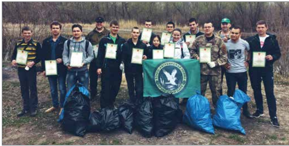
Участники акции «Чистый берег»