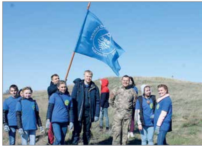
Активисты эколого-мелиоративного факультета на городском субботнике