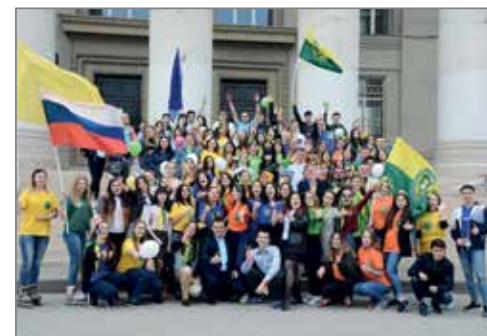
Активисты ВолГАУ празднуют День рождения АСАУ

Можно с уверенностью сказать, что 9 отделов самого разного профиля – достаточное количество для воплощения ваших самых грандиозных проектов и самых необычных идей, проявления лучших личностных качеств!