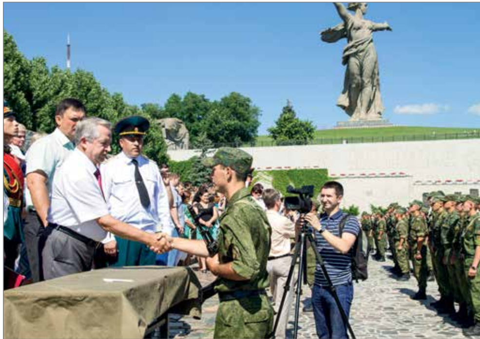
По традиции курсанты принимают присягу на главной высоте России – Мамеевом кургане

В 2017 году единственная в регионе военная кафедра отметит свое 50-летие. За эти годы в вузе сложились традиции воспитания воинской доблести, чести и служения Родине. Пример военного мастерства, стойкости и настоящей армейской солидарности для будущих офицеров и сержантов запаса – это преподаватели кафедры, полковники, подполковники и майоры, многим из которых довелось пройти службу в горячих точках. Медицинское освидетельствование, высокий средний балл обучения в университете, успешная сдача тестирования и установочных нормативов по физической подготовке – таковы критерии отбора для обучения.