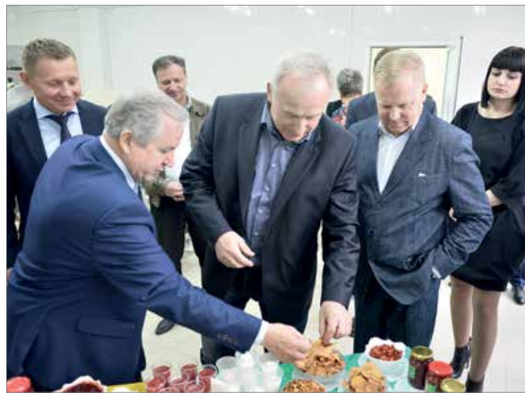
Гости из Белоруссии дегустируют эксклюзивную университетскую продукцию