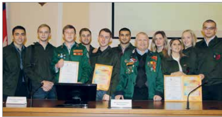
Сельскохозяйственный отряд «Зооветеринар» – лучший студотряд 2016 года

В Волгоградском ГАУ традиция студенческого трудового движения берет свое начало с освоения целинных земель. Тогда в 1954 году преподаватели, сотрудники и студенты – всего более 100 человек – отправились в Казахстан, чтобы вырастить на богатых, но необработанных землях зерно для советской страны. Сегодня студенческие отряды – гордость университета. В вузе их насчитывается более 30. Ежегодно несколько сотен человек отправляются на практику во все районы нашей области. Ребята трудятся в составе студенческих отрядов: «Колос» агротехнологического факультета, «Зооветеринар» факультета биотехнологий и ветеринарной медицины, «Механик» инженерно-технологического факультета, «Норд» факультета перерабатывающих технологий и товароведения, «Турист» факультета сервиса и туризма, «Строитель», «Сталкер», «Эколог» эколого-мелиоративного факультета, «Электрон» электроэнергетического факультета, «Сельхозстроитель» экономического факультета, а также в составе отрядов «Сталинград», «Горизонт» и др. Большинство работает в базовых хозяйствах университета.