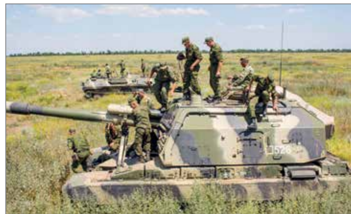
Курсанты военной кафедры во время полевых сборов

У курсантов есть все условия для успешного прохождения службы. В 50 км от университета размещается полигон, куда ребята отправляются на сборы, чтобы в полной мере прочувствовать жизнь в военно-полевых условиях, ощутить дух армейской солидарности и проверить себя на стойкость. В распоряжении курсантов учебное вооружение и военная техника: самоходные установки 2С3М «Акация» и 2С1 «Гвоздика», боевая машина реактивной артиллерии БМ-21 «Град», гаубицы, минометы, командно-штабные машины управления, приборы разведки и космической топогеодезической привязки, учебное стрелковое оружие.