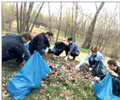
Добровольцы за работой

14 апреля студенты Волгоградского государственного аграрного университета приняли участие в межрегиональной природоохранной акции «Чистый берег». Природный парк «Волго-Ахтубинская пойма» пригласил всех, кто неравнодушен к судьбе природы, поучаствовать в уборке водоохранных зон ериков «Верблюд» и «Гнилой». На приглашение откликнулись люди разных возрастов: школьники, студенты, местные жители. В их число вошли и ребята добровольческого экологического объединения ЭМФ «ЭкоПатруль».