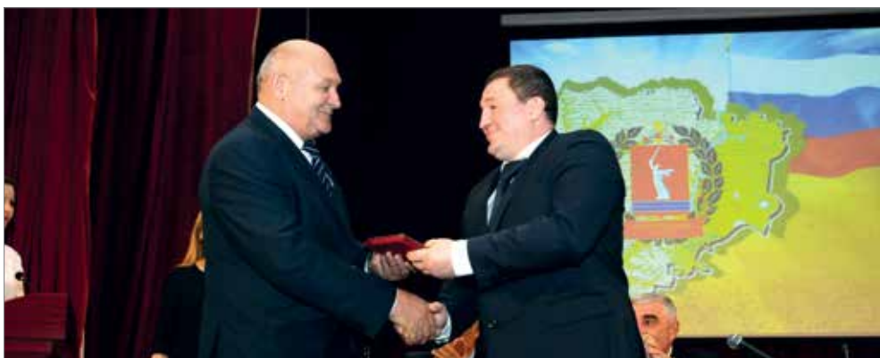
Губернатор Волгоградской области А. И. Бочаров вручает Орден Почеты А. Б. Колесниченко

МАТЕРИАЛ ВЫПОЛНЕН В РАМКАХ ПРОЕКТА «АПК: ТЕХНОЛОГИИ УСПЕХА»