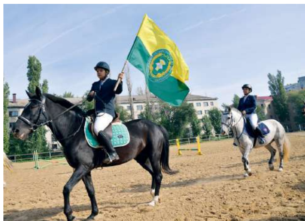
Осенний кубок ВолГАУ – зрелищное мероприятие, повышающее интерес к конному спорту

Конечно, все это не было бы возможно без поддержки ректора Волгоградского ГАУ