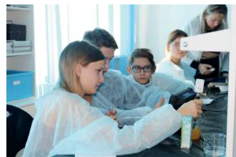
Во время школьных каникул лицеисты с удовольствием занимаются в стенах вуза

Движение профильных аграрных классов – явление не новое, но сейчас оно обрело дополнительный импульс и переживает