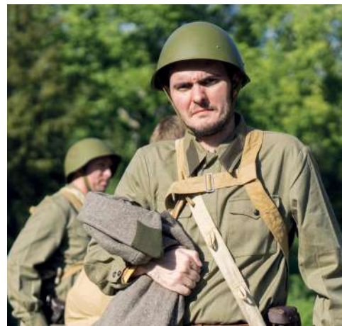
В реконструкции приняли участие преподаватели и студенты ВолГАУ

души – это монументы, стоя возле которых начинаешь ценить жизнь и мирное небо над головой. Хочу поблагодарить всех, кто был с нами в поездке, её я не забуду никогда!