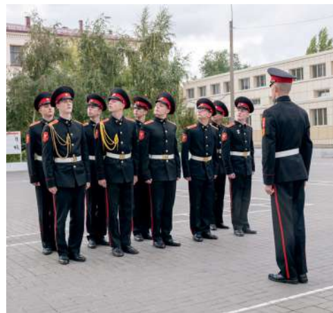
Участники спартакиады демонстрировали строевую подготовку

245 школьников из 16 регионов страны приняли участие во Всероссийской военно-спортивной игре «Казачий сполох» и Всероссийской спартакиаде допризывной казачьей молодёжи. Впервые Волгоградский государственный аграрный университет выступил одной из площадок мероприятия.