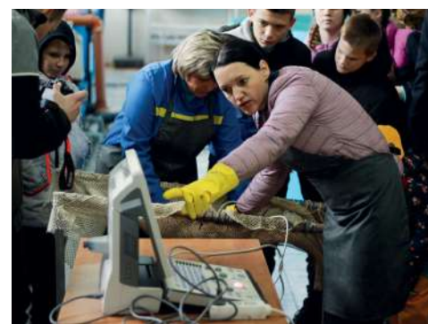
Будущие аграрии в Центре разведения ценных пород осетровых

Преподаватели всех факультетов Волгоградского ГАУ постарались оправдать надежды школьников. В течение недели они проводили интересные мастер-классы по темам: «Устройство и монтаж внутри-