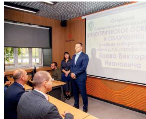
Презентация брендированной аудитории имени профессора В. И. Баева

– Наша компания ценит партнерство с аграрным университетом, мы всегда отмечаем высокие профессиональные навыки выпускников. История энергетики – это история открытий, и мне хочется пожелать, чтобы каждого из вас сопровождали открытия. Пусть наша сложная, ответственная профессия вдохновляет на достижение новых результатов, даёт возможности получать новые знания и накапливать опыт, – пожелал генеральный