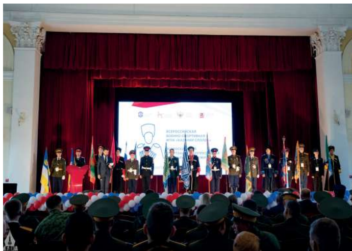
В Волгоградском ГАУ на Всероссийских казачьих соревнованиях собрались представители 16 регионов

В соревнованиях определили лучшие команды общеобразовательных организаций с использованием культурно-исторических традиций казачества. Для школьников подготовили экскурсионную программу: Ма-