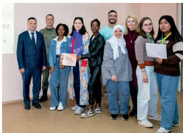
Участники фестиваля – большие ценители русского языка