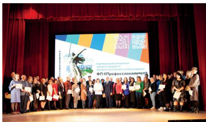
Торжественное вручение сотрудникам Агрокластера удостоверений о повышении квалификации со стажировкой на производстве

Обучение дополнительной профессиональной программе «Интенсификация образовательной деятельности при проведении практической подготовки обучающихся на предприятии» в Институте повы-