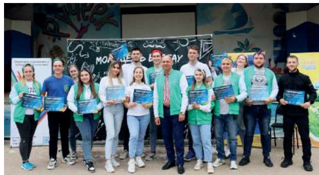
Награждение активистов университета на форуме сельской молодежи

Трудовую деятельность начал в 1994 г. с должности инженера в «Агроснабзапчасть». Начиная с 2002 года работал в администрации Волгоградской области,