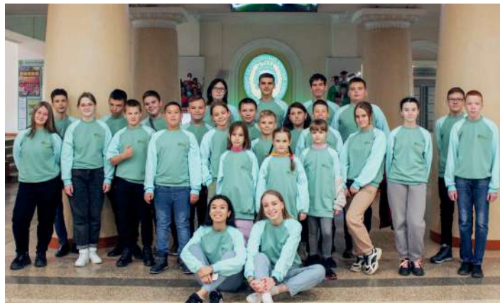
Участники профильной смены познакомилась с Волгоградским аграрным университетом

Очередная региональная профильная смена «ЮнАгро» для школьников 8–11-х классов, организованная Волгоградским ГАУ, состоялась на площадке городского оздоровительного центра для детей и молодежи «Орленок». Уникальность смены в этом сезоне в том, что ее участниками стали лицеисты Университетского лицея ВолГАУ и учащиеся агроклассов Волгоградской области.