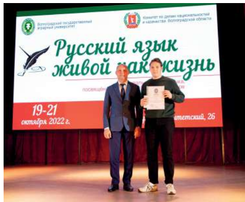
Награждение самых активных участников фестиваля

В этом году важное для культурной жизни университета событие – фестиваль русского языка «Русский язык живой как жизнь» – посвятили единству братских народов. Мероприятие с участием русских и иностранных студентов состоялось при поддержке Комитета по делам национальностей и казачества Волгоградской области.