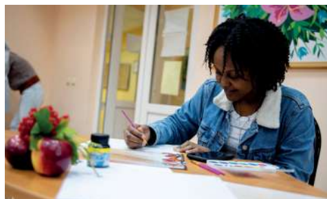
Иностранные студенты с удовольствием писали перьевой ручкой

– Правильно говорят, что, когда заканчиваются слова, начинается война. Я хочу, чтобы наше и последующие поколения студентов знали русский язык, понимали его, могли им правильно пользоваться, чтобы