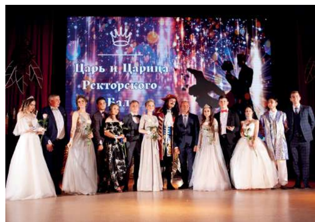
На традиционном ректорском балу ежегодно собираются самые лучшие студенты

Это даже не профессия, нет, ректор – это образ жизни. И иначе нельзя, ведь под Вашим руководством только крепнет и с каждым днем расцветает наш вуз. Вуз, где студенты приобретают разносторонние знания и становятся настоящими профес-