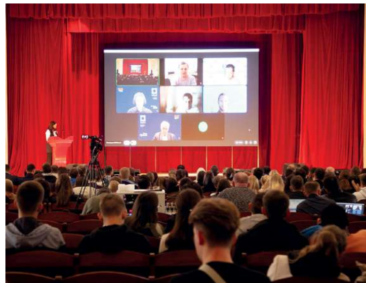
Торжественное открытие бизнес-акселератора «Агромир будущего»

В 2022 году Волгоградский ГАУ стал победителем конкурсного отбора среди образовательных организаций высшего образования Министерства науки и высшего образования Российской Федерации, проводимого в рамках федерального проекта «Платформа университетского технологического предпринимательства» на реализацию Акселерационной программы студенческих стартап-проектов бизнес-акселератор «Агромир будущего».