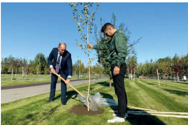
На земле, израненной снарядами, теперь растут деревья

Здесь раньше вставала земля на дыбы... В годы Великой Отечественной войны Сталинград буквально был перепахан минами и снарядами. Восстал из пепла город сразу же после битвы, как легендарная птица Феникс: строились заводы и дома, восстанавливались школы и вузы, рождались дети, зеленели парки.