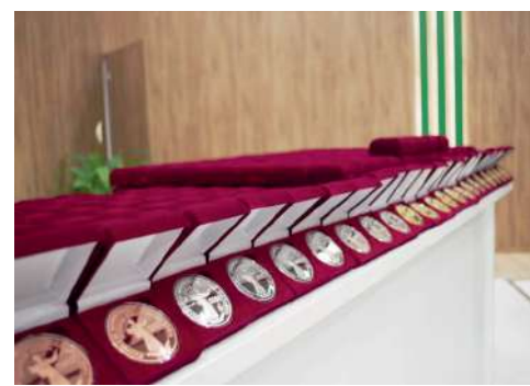
В 2022 году ВолГАУ собрал рекордное количество медалей