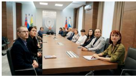
В торжественном онлайн-открытии приняли участие руководители и сотрудники ВолГАУ, образовательных учреждений

Более тысячи ребят из 23 школ региона влились в большую семью Волгоградского государственного аграрного университета. В торжественном онлайн-мероприятии, посвященном открытию агроклассов и старту образовательного процесса по дополнительным программам Университетского лицея, приняли участие руководители, преподаватели и сотрудники вуза, педагогические и ученические коллективы школ-партнеров, лицеисты.