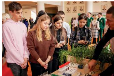
Абитуриентам ФП «Профессионалитет» продемонстрировали возможности и достижения факультетов

Для школьников 9–11-х классов и их родителей свои двери распахнул аграрный университет, представив образовательно-производственный кластер «Сельское хозяйство». В этот день в вузе прошли экскурсии, мастер-классы, родительские собрания, встречи с мастерами и представителями компаний-партнёров (работодателей), профессиональные пробы, презентации.