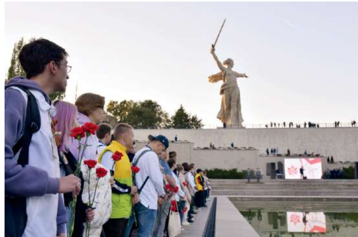
Торжественное закрытие слёта проходило на главной высоте России – Мамаевом кургане