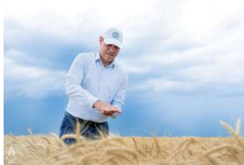
В 2022 году университет вырастил и собрал рекордный урожай