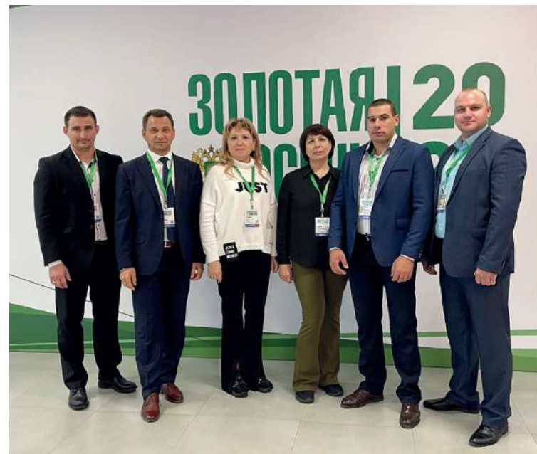
Делегация Волгоградского ГАУ на главной агропромышленной выставке страны