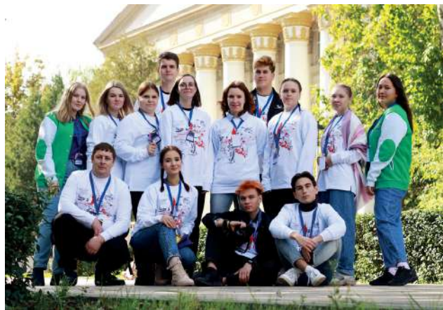
Сталинградская – Волгоградская земля объединила патриотов из разных уголков России

Экскурсионные туры, интерактивные обучающие сессии, презентации лучших практик гражданско-патриотического направления – за три дня пребывания в Волгограде участники VI Всероссийского слёта патриотических клубов и объединений аграрных вузов «Родная земля», посвящённого 55-летию Мамаева кургана, приняли участие в 25 мероприятиях.