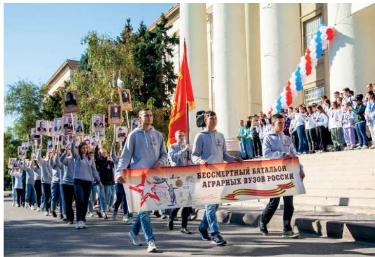
В колонне «Бессмертного батальона аграрных вузов» пронесли портреты героев Великой Отечественной войны