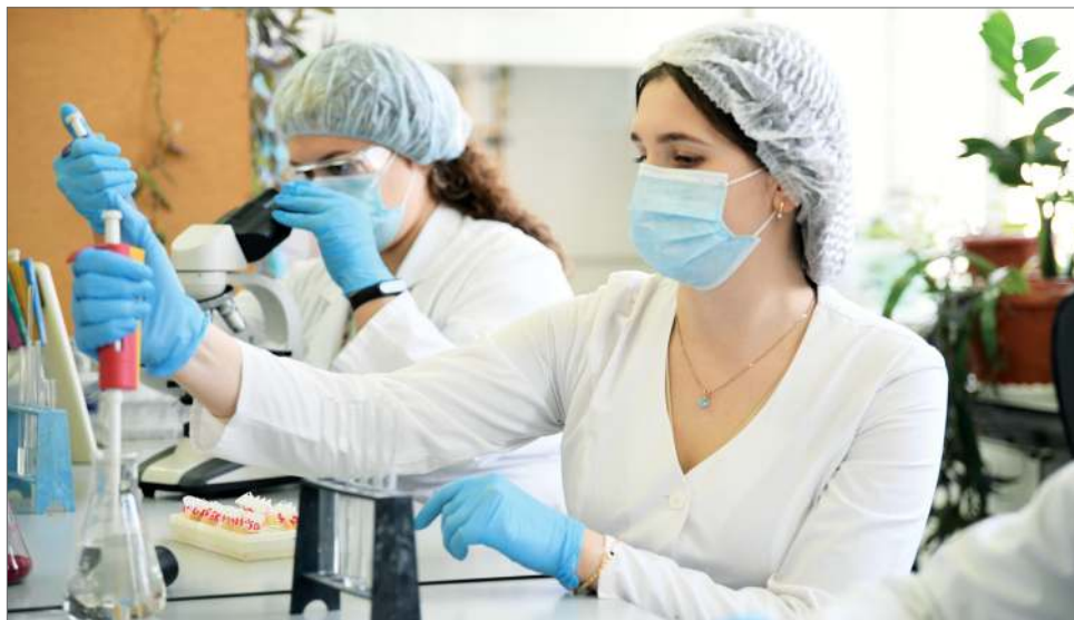
Для централизации научно-исследовательской работы в ВолГАУ создан НИИ перспективных исследований и инноваций в АПК