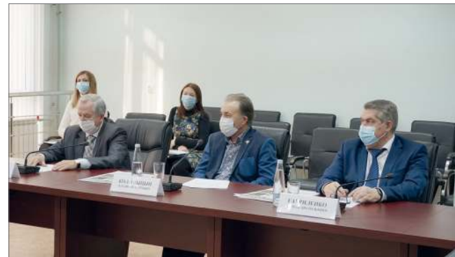
Задача совета – консолидировать усилия руководства вуза, представителей АПК, бизнеса для решения проблем университета

И вот насколько наши дети стали прогрессивные. В этом году ко мне пришли новые студенты. Я провел с ними беседу, рассказал, что они пройдут хорошую практику на современных комбайнах и, значит, на хлеб себе уже всегда смогут заработать. Они хорошо отработали уборочную кампанию. Когда я с ними встретился в конце лета, то поинтересовался: чем они занимались? Где отдыхали? Но они ответили так: мы почувствовали, что у нас все получается и поехали поработать в более северный регион. То