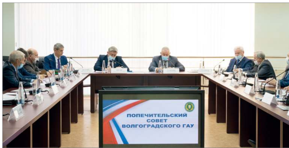
На заседании 4 декабря о проделанной работе присутствующих проинформировали руководители рабочих групп совета

– У нас несколько задач: одно дело войти в те программы, которые существуют в Россельхозбанке, но нужно посмотреть, где еще возможно наладить взаимовыгодное сотрудничество. Банк уже сегодня делает шаги навстречу, в частности, выплачи-