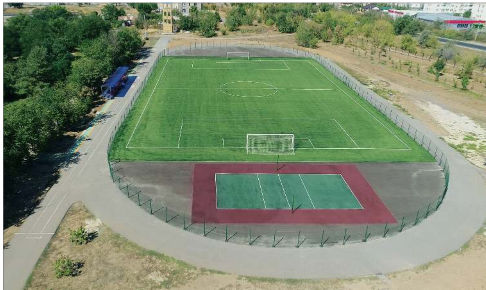
В 2020 году в ВолГАУ была проведена масштабная реконструкция стадиона. Реализации этого проекта вуз ждал много лет

на» превысил 100 млн рублей, и во многом – это заслуга тех сотрудников, которые помогали вузу в сборе урожая.