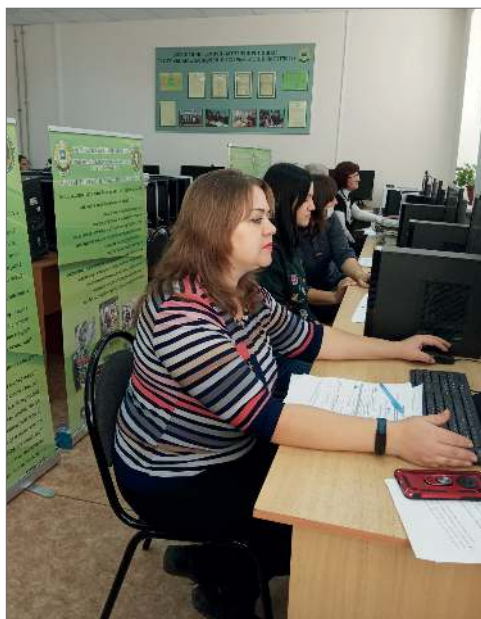
Трансляция вебинаров осуществлялась в прямом эфире, но сейчас записи курса можно посмотреть на YouTube-канале ВолГАУ