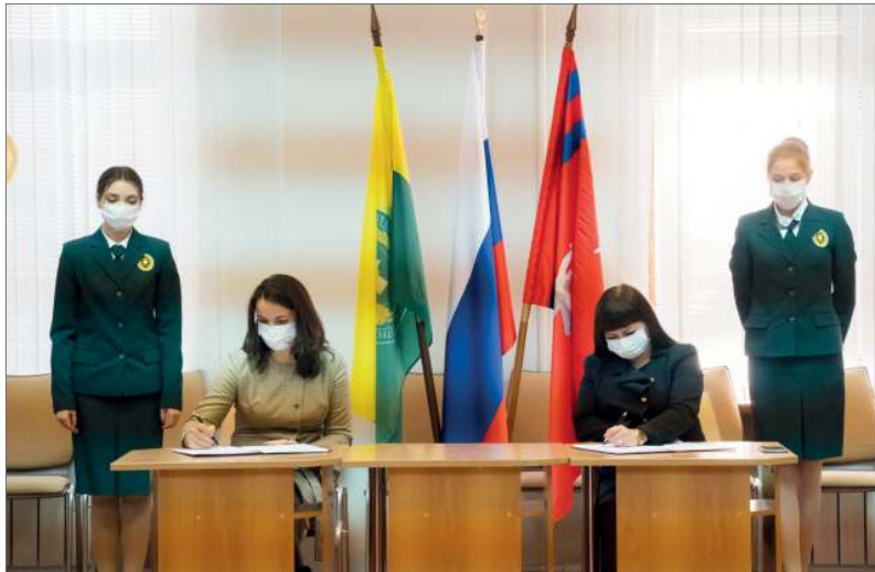
Подписание договора о сотрудничестве между Волгоградским ГАУ и Волгоградпатриотцентром

Представители Волгоградского государственного аграрного университета подписали соглашение о сотрудничестве с руководством Волгоградпатриотцентра. Мероприятие было организовано в рамках юбилейных торжеств, посвященных 25-летию поискового отряда «Сталинград».