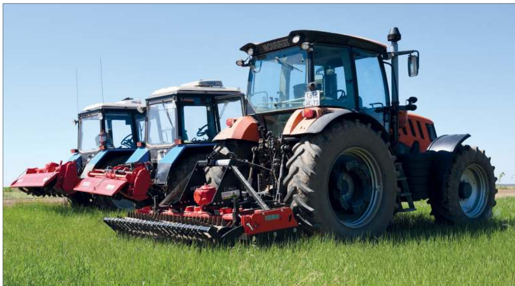
Весной в университет поступила сельскохозяйственная техника иранской фирмы «Хади». Технические испытания еще продолжаются

Например, сейчас совместно с ООО «Агрокомплекс Волжский» наши селекционеры занимаются выведением сортов томатов и баклажан для выращивания в закрытом грунте, чтобы решить проблему с обеспечением семенами местных сельхозпроизводителей. Второй проект касается создания лаборатории брожения пива и кваса. Совместно с ООО «ПК «Хлебнаш» мы организуем лабораторию, где будем отрабатывать новые технологии производства этих продуктов. Также в планах создание мини-сыроварни совместно с ООО «Любимый город». Важный момент: при создании этих цехов фактических затрат университет не понесет. Все оборудование будет поставлено за счет произ-