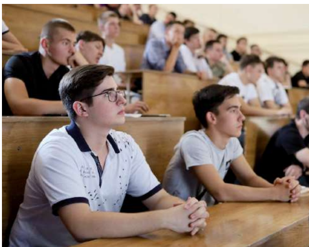
Первокурсники ВолГАУ на своей первой встрече с деканом