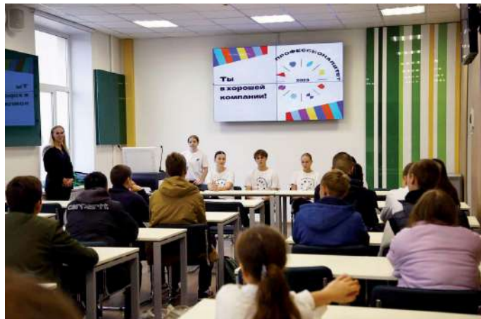
Единый день открытых дверей начался с Всероссийского классного часа

По традиции Волгоградский ГАУ присоединился к Единому дню открытых дверей проекта «Профессионалитет». В вузе собрались самые активные и заинтересованные в получении востребованной рабочей профессии школьники 8–9-х классов, родители, педагоги и работодатели. Мероприятие открылось Всероссийским классным часом «Профессионалитет: ты в хорошей компании!».