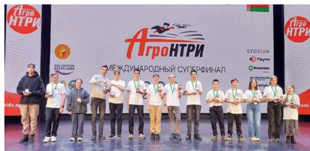
Волгоградская команда школьников – победители и призеры суперфинала «АгроНТРИ-2024»

Волгоградские команды школьников – победители регионального тура под руководством преподавателей ВолГАУ разрабатывали для финального этапа «АгроНТРИ-2024» проекты по своим конкурсным направлениям: ДоброПчел «Обеспечение продовольственной безопасности страны, посредством инновационной технологии в пчеловодстве»; АгроСмарт «Интеграция вертикального фермерства в урбанистическую среду»; АгроКоптеры «Интеграция технологий БПЛА и энтомофагов»; АгроВет «Применение ультразвукового скалера в ветеринарии»; АгроМетео «Изменение климата в связи с глобальным потеплением на примере Волгоградской области».