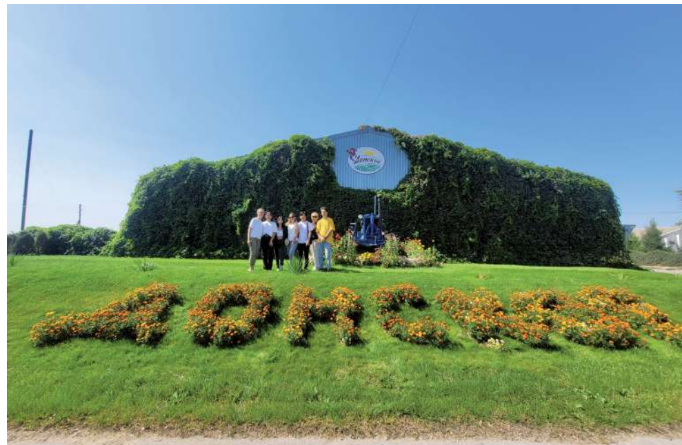
Гости прогулялись по территории, полюбовались буйством зелени и летних цветов