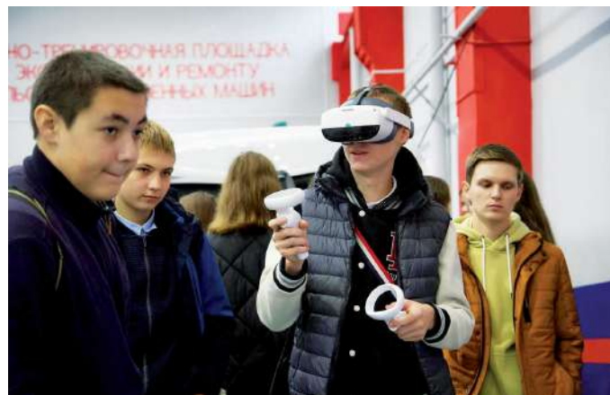
Амбассадоры «Профессионалитета» провели для ребят экскурсию по университетскому кампусу