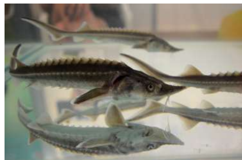
Выращиванием осетровых в ВолГАУ занимаются уже больше 10 лет

На базе Центра по разведению ценных пород осетровых строят акваферму высокотехнологичного уровня. Специалисты уже установили замкнутую систему водоотведения. В планах – внедрение технологий с дистанционным управлением.