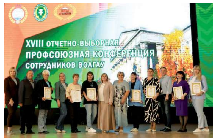
Самые активные участники профсоюзного движения с наградами

Активистов профсоюзного движения наградили почетными грамотами.