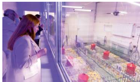
В Центре нутригеномики сельскохозяйственных животных и птицы

На основании полученных данных в лабораториях центра будут созданы рецепты комбикормов и добавок. Испытания на безопасность проводятся в фистульной лаборатории на курах-несушках и цыплятах-бройлерах. Их поголовье составляет 400 и 700 голов соответственно.