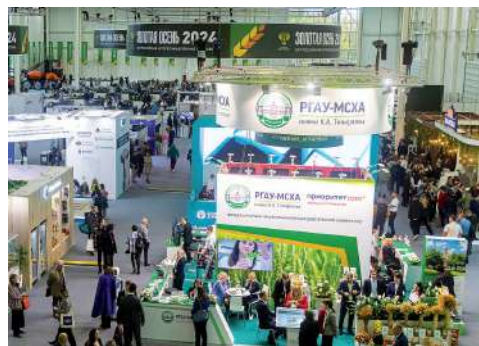
Главная аграрная выставка страны «Золотая осень» демонстрирует лучшие достижения АПК

Результатом участия Волгоградского ГАУ в XXVI Российской агропромышленной выставке «Золотая осень – 2024» стали десять наград различного достоинства, из них: четыре золотых медали, пять – серебряных и одна – бронзовая. Такая оценка в очередной раз подтверждает высокий уровень научно-исследовательской работы вуза.