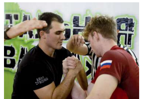
Сильнейшие атлеты Волгограда на турнире «Стальная хватка: Армрестлинг»

После празднования Дня народного единства спортивные баталии в рамках проекта продолжатся – 6–8 ноября в спортивном комплексе ЭМФ пройдут городские межвузовские соревнования «Стальная хватка: пауэрлифтинг». И вновь Главная судейская коллегия представлена мастерами спорта России – это старшие преподаватели