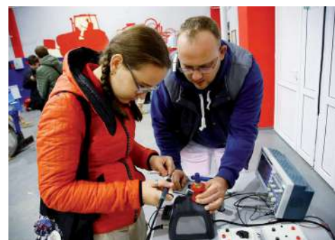
Педагоги организовали увлекательные мастер-классы

Отметим, количество таких площадок растет – в 2025 году их будет уже девять вместо стартовых трех. Задачу по модернизации инфраструктуры учреждений, созданию современных условий и дополнительных воз-