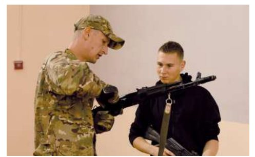
Занятие по огневой подготовке

профильной смены «Время юных героев», участники Всероссийской военно-патриотической игры «Зарница 2.0» и учителя ОБЖ.