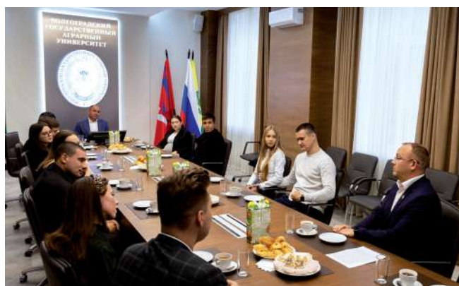
Участники встречи с ректором обсуждают меры поддержки молодых семей