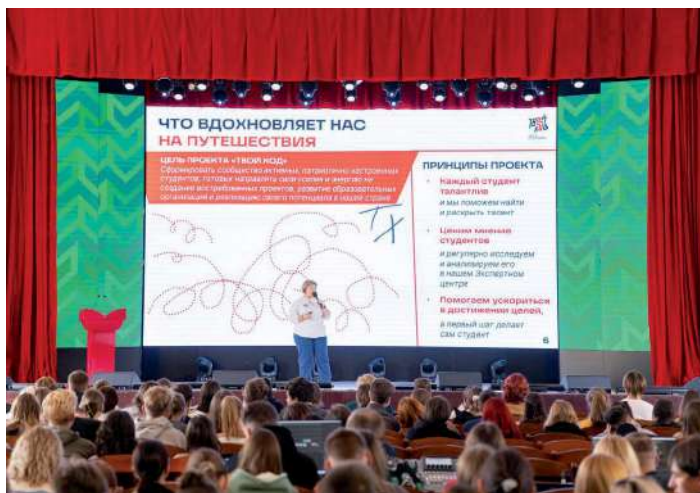
Презентация Всероссийского студенческого проекта «Твой ход»

программы, который состоится в начале декабря в Волгограде. Отметим, флагманская образовательная программа «Голос Поколения. Преподаватели» разработана в 2022 году Министерством науки и высшего образования РФ совместно с Федеральным агентством по делам молодежи (Росмолодежь). В 2023 году инициатива объединила порядка 1,6 тысячи участников из восьми федеральных округов.