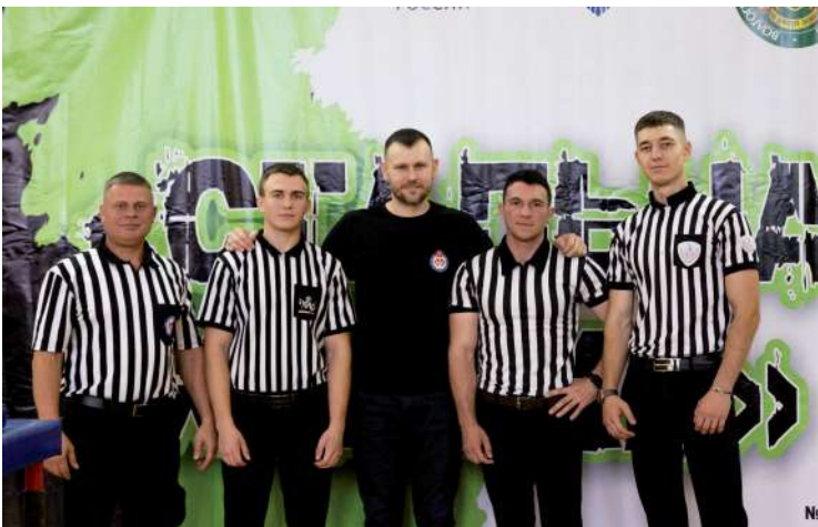
Судейская коллегия городских межвузовских соревнований «Стальная хватка: Армрестлинг»

С мая этого года кафедра «Физическая культура и здоровье» ВолГАУ реализует грантовый проект, направленный на развитие и популяризацию силовых видов спорта. Субсидия предоставлена в рамках государственной программы Российской Федерации «Научно-технологическое развитие Российской Федерации».