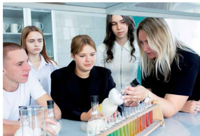
Лицейсты ВолГАУ на лабораторном занятии