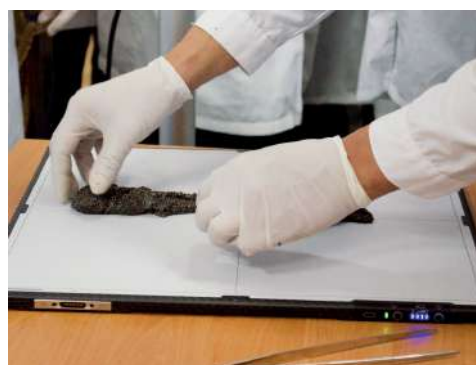
Ученые вместе с практиками создают оптимальную научно-производственную систему

– Мы сейчас внедряем новые модели барбанных механических фильтров, нами разработаны системы аксегинации, которые позволяют практически на 50 % сократить потребление электроэнергии при насыщении воды кислородом. У нас низконапорная подача воды, при этом очень большие объемы перекачиваются, насыщаются кислородом, обеззараживаются. Здесь и ультрафиолетовая очистка, и очистка за счет озонации, – отмечают ученые.