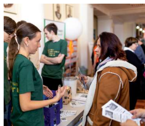
Представители факультетов рассказали о направлениях подготовки

Наши студенты – победители и призеры конкурсов, чемпионатов, конференций в области научных, учебных, общественных, спортивных и творческих мероприятий международного и федерального значения. В стенах вуза живут такие красивые традиции, как Ректорский бал, смотр первокурсников «Время первых», Молодежный форум лучших активистов ВолГАУ «Точка роста» и многое другое. Свои навыки можно развивать в конно-спортивном клубе «Добрыне», в спортивных кружках по баскетболу, пауэр-