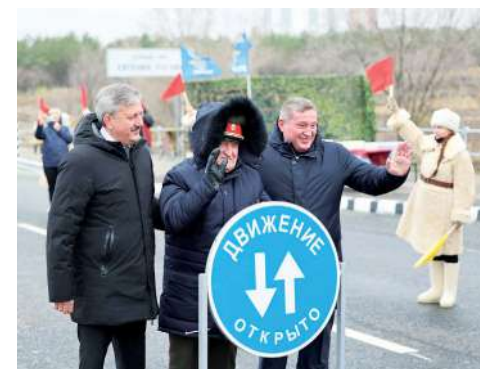
Торжественное открытие движения на улице имени Евгения Рогова