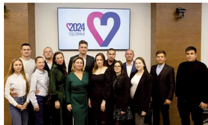
Душевная встреча за чашкой чая завершилась общим фото на память

А вот в чём единогласно сошлись все участники, так это в организации «Клуба молодых семей». К сообществу смогут присоединиться как состоявшиеся супруги, так и те, кто только планирует создать новую ячейку общества. Именно сюда можно будет приходить, чтобы поделиться радостью или проблемой, обратиться за психологической помощью или помочь самому, чтобы реализовать интересный проект или организовать совместное мероприятие. Клуб молодых семей ВолГАУ начнет свою работу уже с 1 ноября 2024 года.