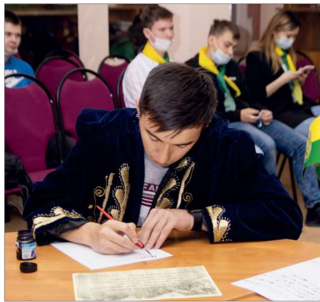
Конкурс каллиграфии – один из самых изящных

На празднике русского языка, по сложившейся традиции, были и представители областной библиотеки имени М. Горького – культурного центра нашего города, чью гуманитарно-просветительскую роль трудно переоценить.