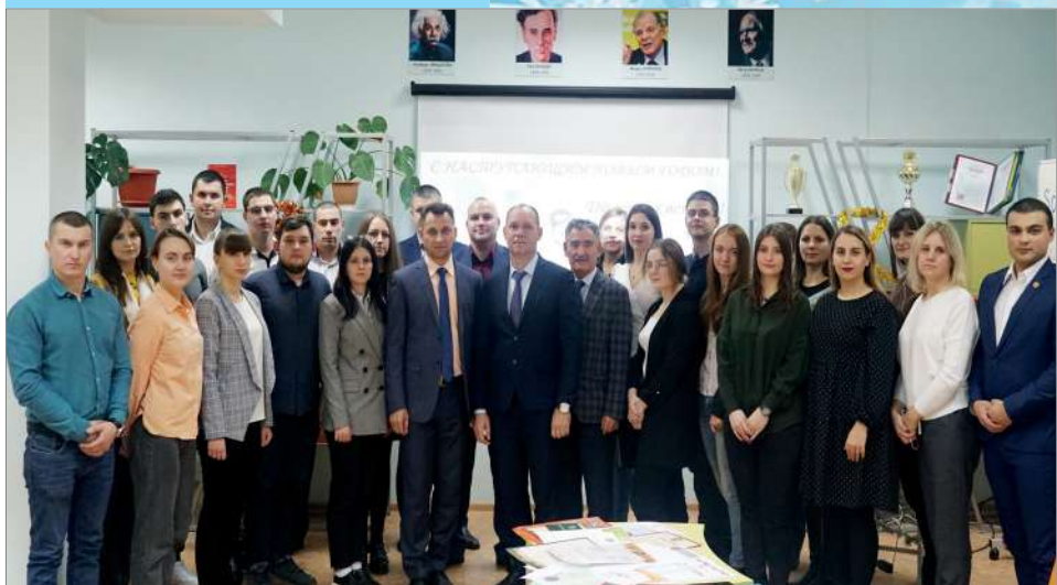
Лучшие представители молодежной науки на традиционной встрече с ректором

В этом году впервые за счет средств целевого капитала, сформированного членами попечительского совета во главе с компанией «Сады Придонья», осуществляется финансирование «Творческой премии университета», основанной для материальной