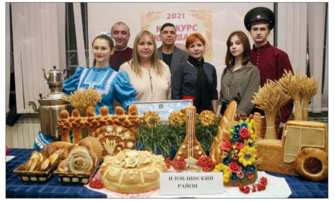
Участники областного конкурса «Каравай»

Добавим, участники торжественного собрания также ознакомились с региональными брендами на ярмарке-выставке «Дары родного края», попробовали продукцию пекарей из 19 районов Волгоградской области, представивших свои творения на конкурс «Каравай».