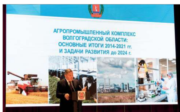
Губернатор Андрей Бочаров во время выступления на торжественном собрании в ВолГАУ

Андрей Бочаров отметил, что Волгоградская область в 2021 году выполнила поставленные перед ней президентом и Правительством России задачи по обеспечению продовольственной безопасности. Несмотря на пандемию и непростые погодные условия, получен хороший урожай: 4,1 млн тонн зерновых; рекордный за последние годы объем