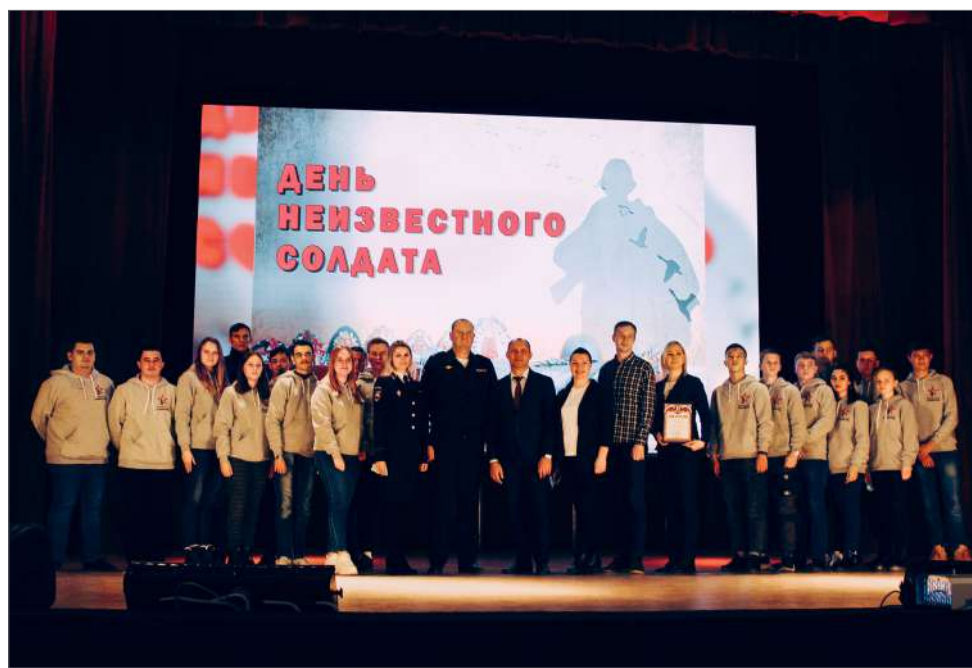
Поисковики ВолГАУ и создатели фильма «Цена жизни»

Добавим, что в Волгоградской области с 2011 года создан и успешно работает сводный отряд поисковиков, состоящий из действующих сотрудников полиции и ветеранов МВД России Волгоградской и Ростовской областей. Они участвуют в выездных поисковых экспедициях по нахождению и перезахоронению останков воинов, погибших при защите Сталинграда. За время выездных экспедиций отряд обнаружил останки 736 погибших солдат, из которых 33 уже опознаны, родственников четверых удалось найти.