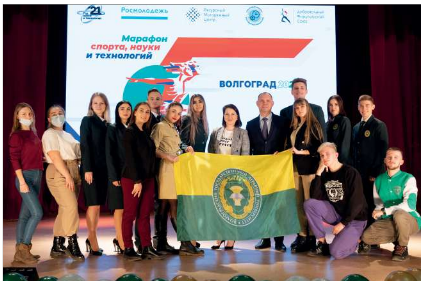
Именитая фигуристка покорила сердца волгоградцев

В Волгоградском ГАУ освоили новый вид спорта – северную ходьбу и уже успели отличиться на соревнованиях всероссийского проекта «Марафон спорта, науки и технологий» в рамках объявленного в России Года науки и технологий. Куратор марафона прославленная российская фигуристка чемпионка мира и Европы, призер Олимпийских игр Ирина Слуцкая вручила победителям и призерам заслуженные награды, а также провела мастер-класс, в ходе которого поделилась своей историей успеха в жизни и спорте.