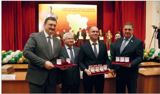
Волгоградский ГАУ награжден 13 медалями выставки «Золотая осень»

– В целом ожидаем, что по итогам 2021 года объем валовой продукции в отрасли сельского хозяйства составит