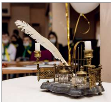
Уникальный письменный прибор конца XIX века

Этой теме был посвящен конкурс «Кириллическая каллиграфия». Студенты не только старательно писали перьевыми ручками, передавая изящество и стиль кириллической каллиграфии, но и говорили о роли символов в целом и о букве как одном из главных духовных знаков в частно-