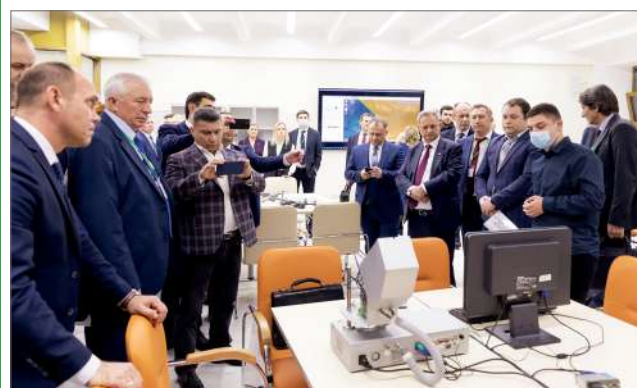
Руководители аграрных вузов знакомятся с оснащением РГАУ – МСХА имени К. А. Тимирязева