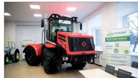
Учебная аудитория Росагролизинга

В ходе визита в Тимирязевскую академию Дмитрий Патрушев осматривал современный инженеринговый центр с лабораторией цифровизации и точного земледелия, а также современные учебные аудитории, созданные в партнерстве с крупнейшими компаниями отрасли.