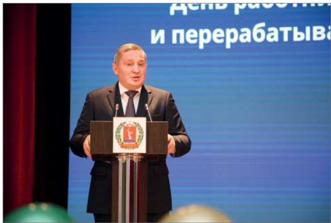
Губернатор Андрей Бочаров ставит задачи на 2022 год

Помимо подведения итогов сельскохозяйственного года, губернатор поставил перед профильными органами власти и работниками АПК Волгоградской области задачи развития отрасли на 2022 год и среднесрочный период.