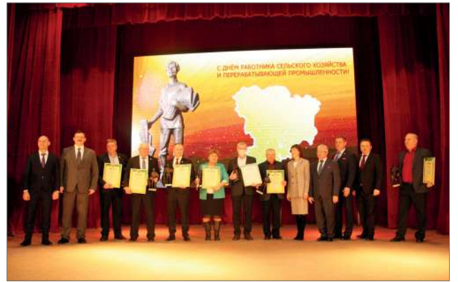
Награждение передовиков АПК регионов

Состоялось также вручение дипломов и медалей XXIII Российской агропромышленной выставки «Золотая