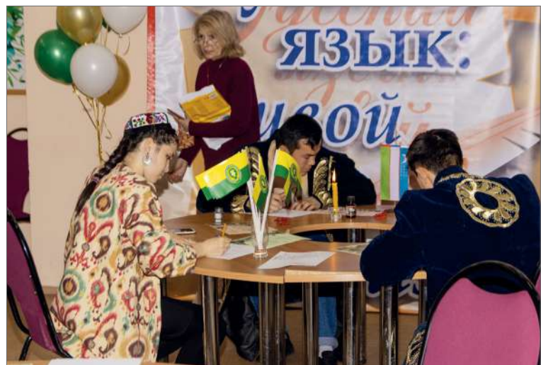
Иностранные студенты учатся любить и понимать язык великой страны

Привлечение иностранных студентов способствует воспитанию любви к России, пониманию ее великой судьбы, что, безусловно, обладает огромной значимостью в контексте современных событий. Нет сомнения и в том, что совместное участие в культурно-лингвистических мероприятиях способствует творческому саморазвитию и самосовершенствованию обучающихся, формированию подлинно культурной личности, интеллектуала, умеющего принимать решения и брать на себя ответственность за их реализацию.