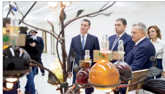
Дмитрий Патрушев осматривает современный инженеринговый центр

интеграции аграрного образования и науки. Вузы Минсельхоза всё активнее включаются в Федеральную научно-техническую программу развития сельского хозяйства. На сегодня 13 образовательных организаций реализуют проекты в области селекции