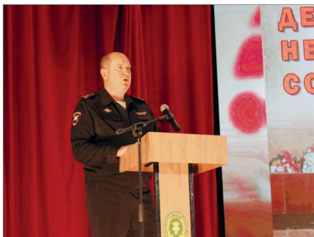
Начальник Управления ГИБДД ГУ МВД России по Волгоградской области Александр Степанов

В День Неизвестного Солдата в университете состоялась презентация короткометражного фильма «Цена жизни», посвященного всем тем, кто принимает участие в поисковых экспедициях по увековечиванию памяти защитников Отечества. Проект представил поисковик, начальник Управления Государственной инспекции безопасности дорожного движения Главного управления МВД России по Волгоградской области, полковник полиции Александр Степанов.