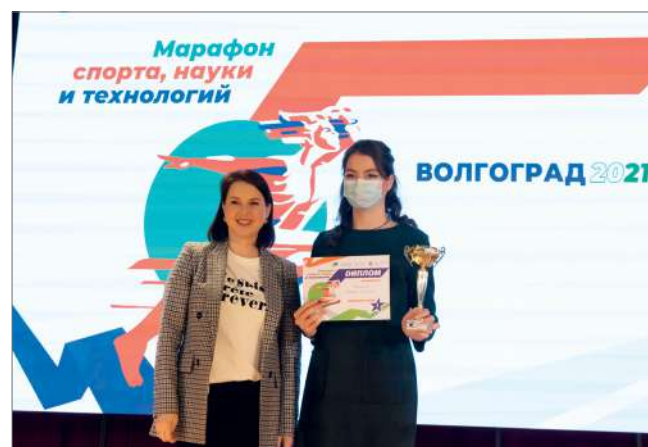
Ирина Слуцкая вручила победителям марафона дипломы и кубки

На самом пике спортивной карьеры врачи поставили Слуцкой диагноз, который мог положить конец всему. Ноги Ирины отекали так, что она не могла ходить. Еще страшнее был прогноз медиков, что она вряд ли станет мамой. Привыкшая побеждать, спортсменка сделала невозможное. Она не только продолжила тренироваться, но и, заручившись