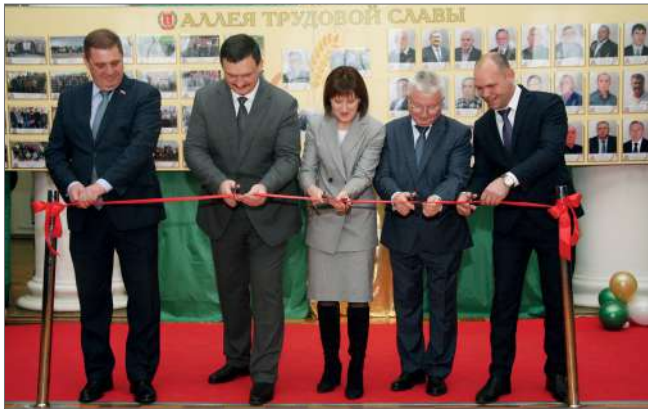
Торжественное открытие Аллеи трудовой славы

– Эти результаты, даже в таких непростых условиях, как сегодня, могут получать только люди, которые по-настоящему любят свою работу, трудятся непосредственно на земле, любят свою землю, – обратился к представителям отрасли Андрей Бочаров. – Серьезным подспорьем в этой работе является также высокий уровень господдержки, которая по всем направлениям из года в год продолжает оставаться высокой. Еще одним важным фактором повышения эффективности является широкое использование современной техники и оборудования, современных технологий и научных подходов в сельском хозяйстве, в том числе разрабатываемых учеными нашего сельхозуниверситета.