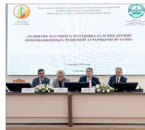
Состоялось обсуждение основных векторов развития высшего образования

пользования – «Сервисная лаборатория комплексного анализа химических соединений», Конно-спортивный комплекс, Инжиниринговый центр Тимирязевской академии, учебную аудиторию Росагролизинга, учебную аудиторию Россельхозбанка.