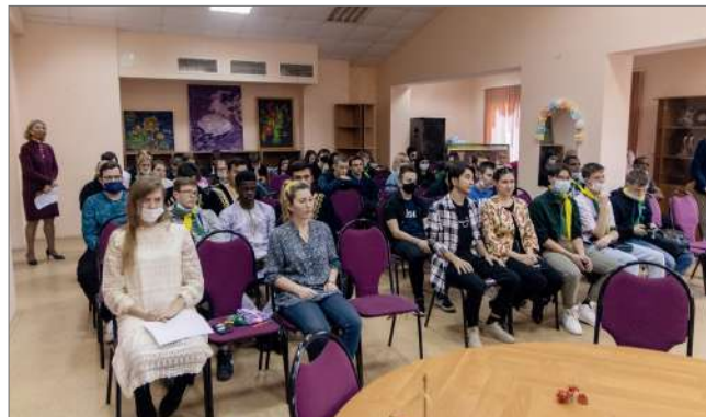
Участие в культурно-лингвистических мероприятиях способствует творческому саморазвитию