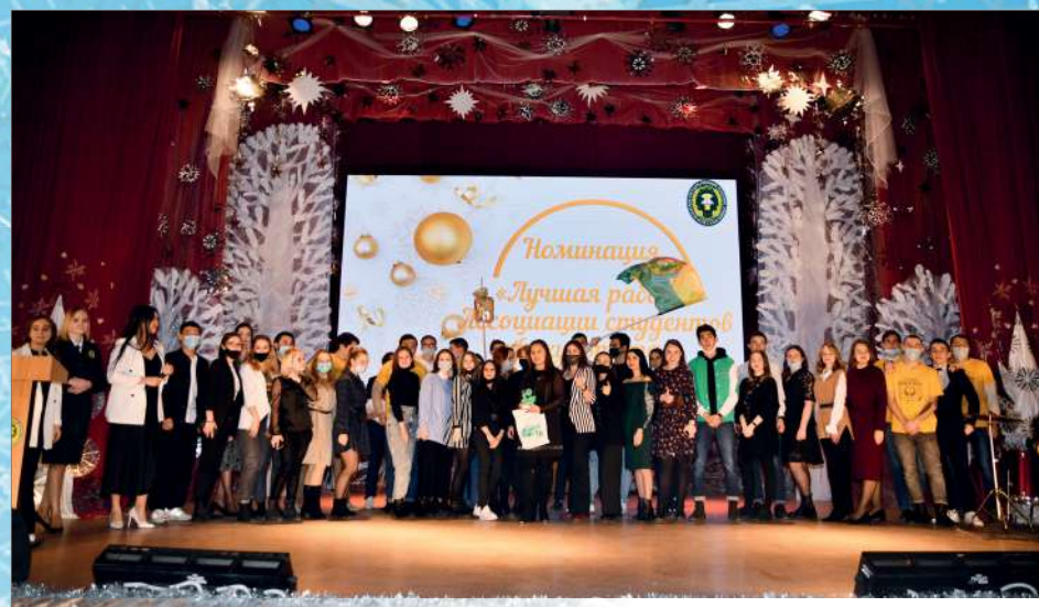
Ассоциация студентов агротехнологического факультета лучшая по итогам года

В этом году построена универсальная спортивная площадка и благоустроена пло-