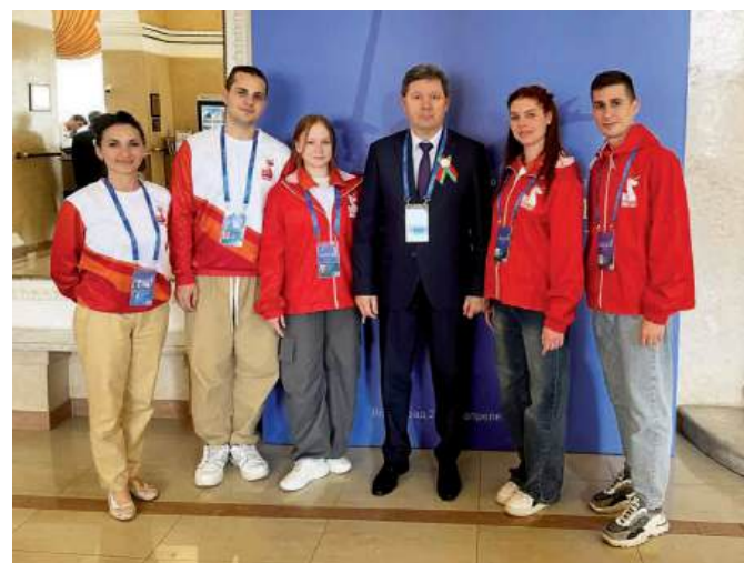
Волонтерский корпус Волгоградского ГАУ на Международном форуме союзного государства