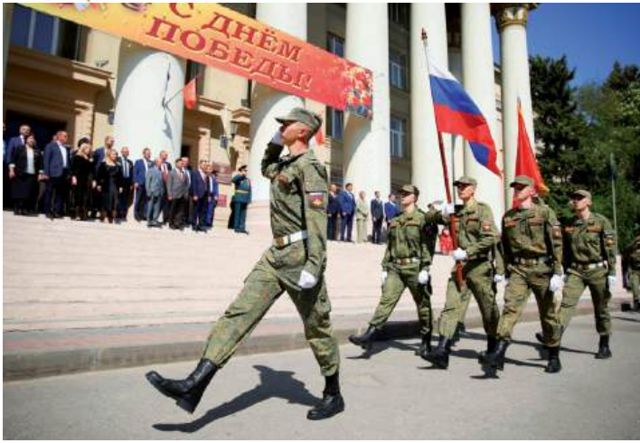
Чеканя шаг, открыли Парад Победы в ВолГАУ курсанты Военного учебного центра

Парад курсантов Военного учебного центра и патриотических объединений, «Бессмертный батальон ВолГАУ», «Вальс Победы», «Солдатский привал», праздничный концерт – в Волгоградском государственном аграрном университете состоялись мероприятия, посвященные 80-летию Великой Победы. Почетные гости, студенты, преподаватели и сотрудники вуза вспомнили всех тех, кто с честью погиб на поле боя, защищая Родину, благодаря кому мы сегодня живем, учимся и работаем на свободной земле.