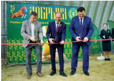
Торжественное открытие нового конноспортивного манежа в ВолГАУ

Осуществилась давняя большая мечта воспитанников и тренеров Учебно-консультационного конноспортивного центра «Добрыня» – визитной карточки Волгоградского ГАУ. В мае этого года центр отмечает 15-летие со дня создания, и в честь этой знаковой даты в вузе состоялось открытие нового просторного современного крытого манежа. Уникальный подарок позволит спортсменам выйти на более высокий качественный уровень.