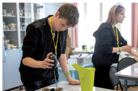
ВолГАУ сумел сохранить все девять направлений конкурса

В шестой раз Волгоградский государственный аграрный университет распахнул двери перед участниками регионального этапа Всероссийского конкурса среди учащихся общеобразовательных учреждений сельских поселений и малых городов «АгроНТРИ-2025». Организаторами конкурса выступают Фонд содействия инновациям и Ассоциация образовательных учреждений АПК и рыболовства.