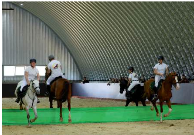
Показательные выступления спортсменов КСК «Добрыня» увидели участники торжества