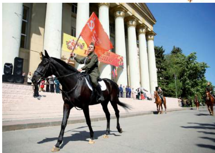
Неизменные участники Парада Победы в ВолГАУ – представители КСК «Добрыня»

Активисты патриотического клуба «Я горжусь», клуба ВИР