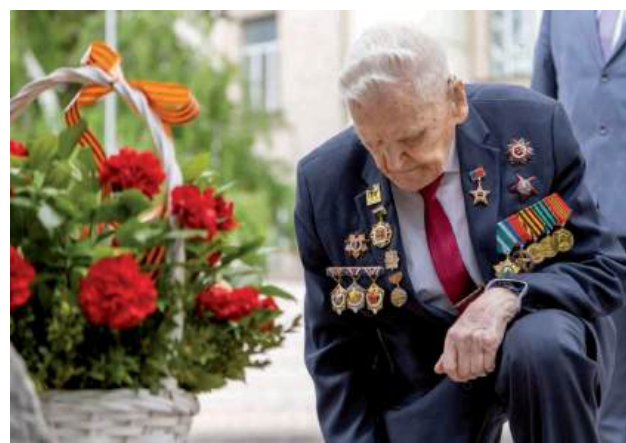
Низкий поклон бойцам 35-й гвардейской стрелковой дивизии, сложившим головы на Сталинградской земле

В начале 2025 года министр обороны РФ Андрей Белоусов отметил, что в настоящее время в живых осталось всего 7000 фронтовиков, большинству из них около ста лет.