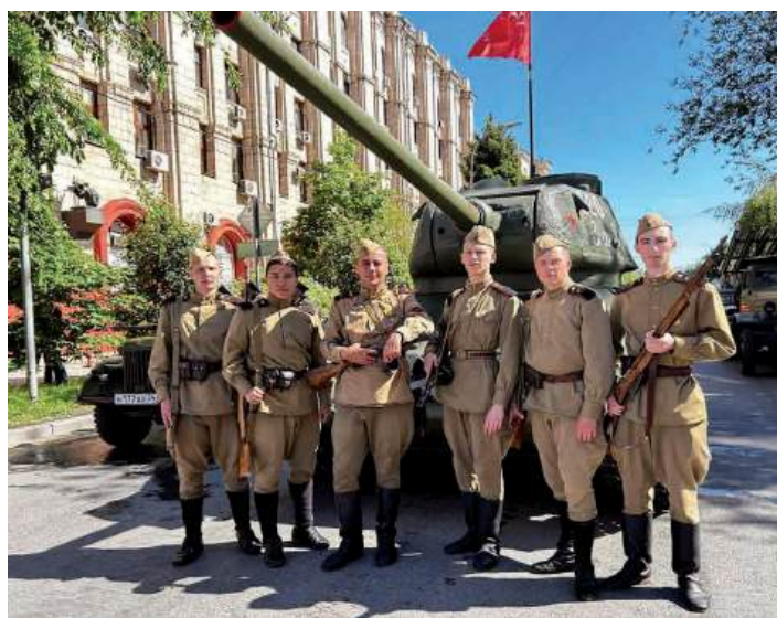
Активисты ВолГАУ стали участниками торжественного парада, посвященного 80-й годовщине Победы в Великой Отечественной войне