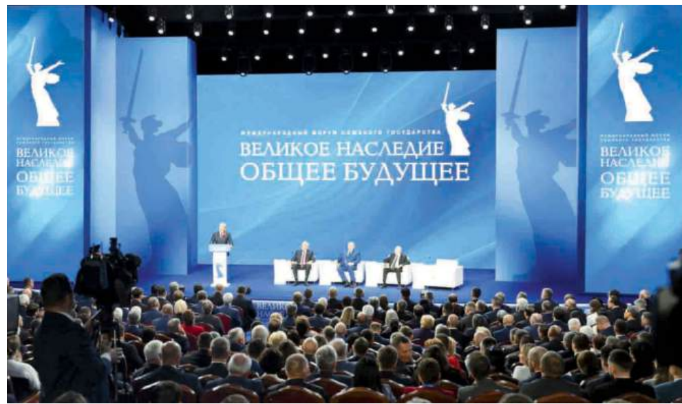
В пленарном заседании Международного форума союзного государства приняли участие Президенты России и Белоруссии

Работа форума идет успешно. На его сессиях состоялись дискуссии по таким значи-