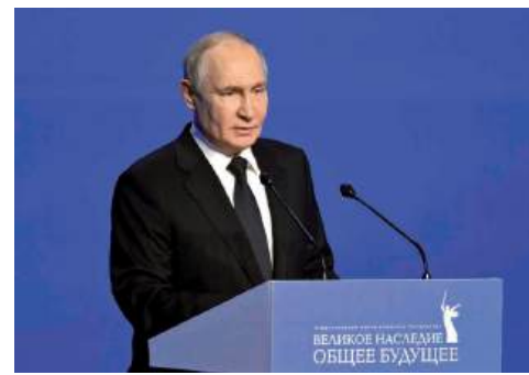
Владимир Путин отметил значимость проведения Международного форума в Волгограде

Отмечу также, что многие участники нынешнего форума активно сотру-