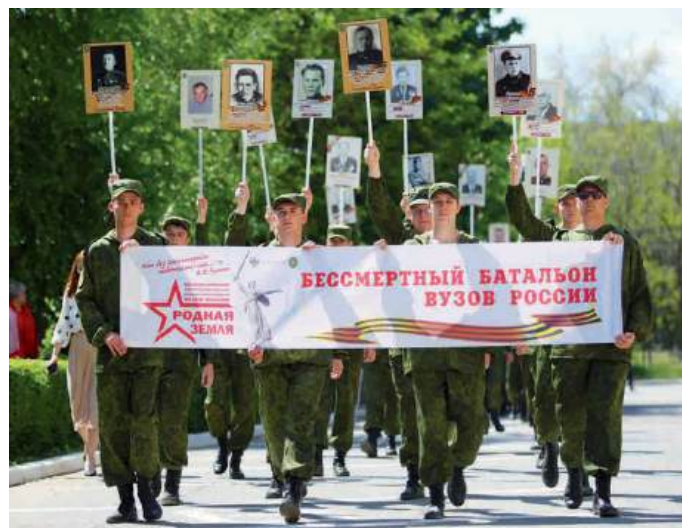
Штендеры с портретами героев пронесли студенты Института непрерывного образования, волонтеры и поисковики ВолГАУ

Преподавал в Сталинградском-Волгоградском сельскохозяйственном институте с 1953 по 2001 год. Является автором более 80 научных работ по животноводству. После выхода на пенсию возглавил Совет ветеранов Волгоградской сельскохозяй-