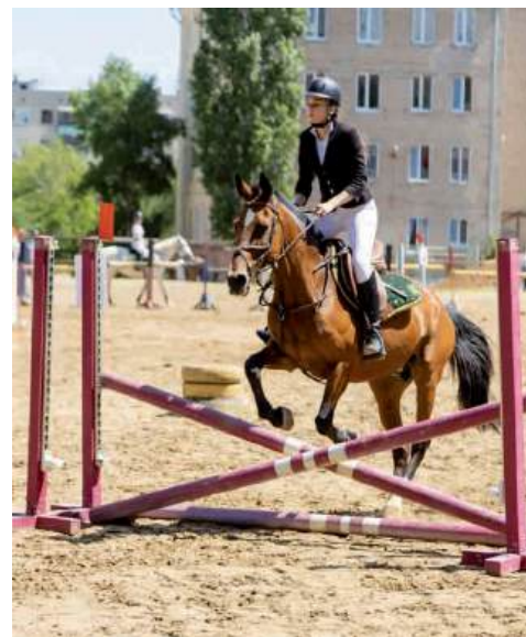
Масштабное мероприятие объединило множество талантливых всадников и лошадей

В маршруте с высотой препятствий 70 см «на стиль всадника» в зачете для