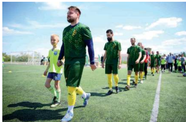
Турнир по мини-футболу среди рабочих коллективов сферы АПК посвятили 80-летию Победы в Великой Отечественной войне

– Турнир по мини-футболу, посвященный Дню Победы в Великой Отечественной