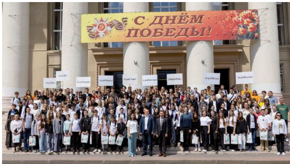
Более 250 школьников из Волгоградской, Астраханской, Тамбовской и Тюменской областей, а также из Краснодарского и Ставропольского краев боролись за звание финалиста

По результатам конкурса три лучших участника по каждому направлению будут признаны победителями и представят область на Всероссийском этапе. Награждение победителей регионального этапа состоится в рамках проведения Волгоградского молодежного фестиваля #ТриЧетыре.