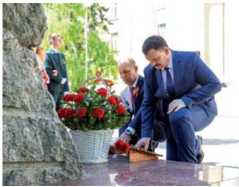
Возложение цветов к памятнику воинам 35-й гвардейской стрелковой дивизии им. В. Глазкова