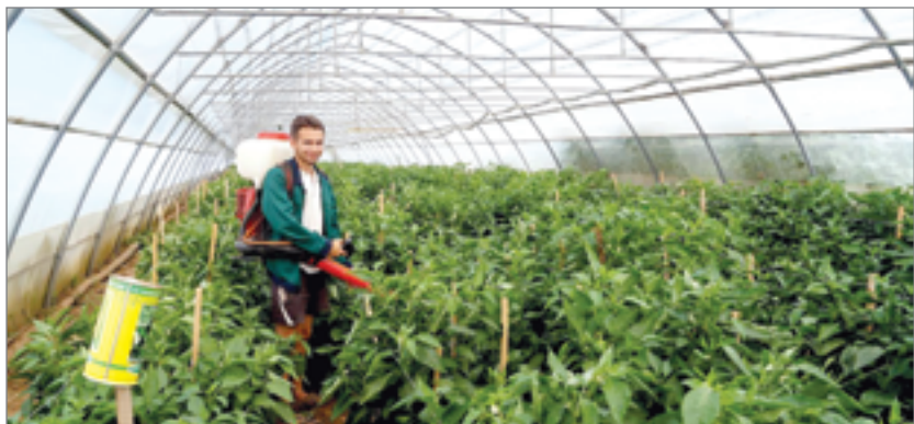
Будущие мелиораторы и экологи успешно прошли практику на производстве

Студенческий стройотряд «Электрон» Волгоградского государственного аграрного университета влился в многотысячный коллектив волгоградских энергетиков. Ребятам предстояло выполнять те же задачи, что стояли и перед работниками Волгоградэнерго. 12 августа состоялось торжественное закрытие трудового семестра.