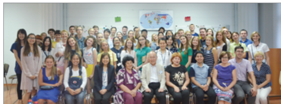
Участники конференции «За мирное будущее» в стенах Волгоградского ГАУ

Германии и других стран приезжают в вуз с целью укрепления международного сотрудничества, обмена опытом, обсуждения новейших технологий, реализации социально значимых проектов и культурных мероприятий. Университет открыт для диалога и всегда готов поддержать инициативы студентов, направленные на сохранение окружающей среды и укрепление мира.