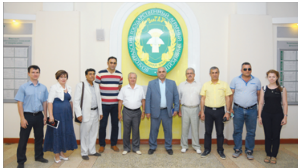
Волгоградский ГАУ – перспективный центр международного сотрудничества

Участники встречи отдали дань памяти воинам 35-й стрелковой гвардейской дивизии, посетили аллею Победы. Гости впечатлила история университета, начавшего свою работу в годы Великой Отечественной войны. Инновационные разработки, академический обмен, организация практики студентов – дальнейшее обсуждение векторов международного сотрудничества – исследователи вуза и гости из Ирана продолжили в стенах Волгоградского ГАУ в формате диалоговой площадки.