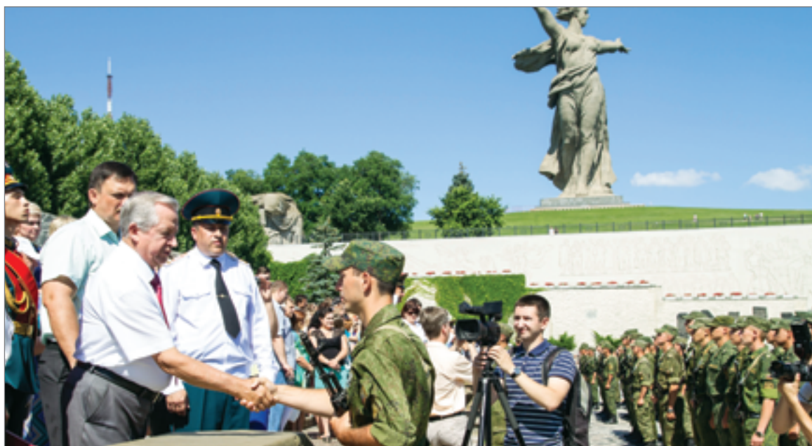
Чтить отечество, защищать сограждан, служить Российской Федерации — эти клятвенные обещания курсанты будут выполнять до конца своей жизни

В июле выпускники единственной в регионе военной кафедры собрались на Мамаевом кургане, чтобы в присутствии преподавателей, родителей и близких друзей принести клятву верности Родине. Эта традиция остается неизменной на протяжении долгого времени. За 48 лет работы военная кафедра подготовила более 14000 офицеров-артиллеристов для ракетных войск и артиллерии Сухопутных войск Вооруженных Сил РФ.