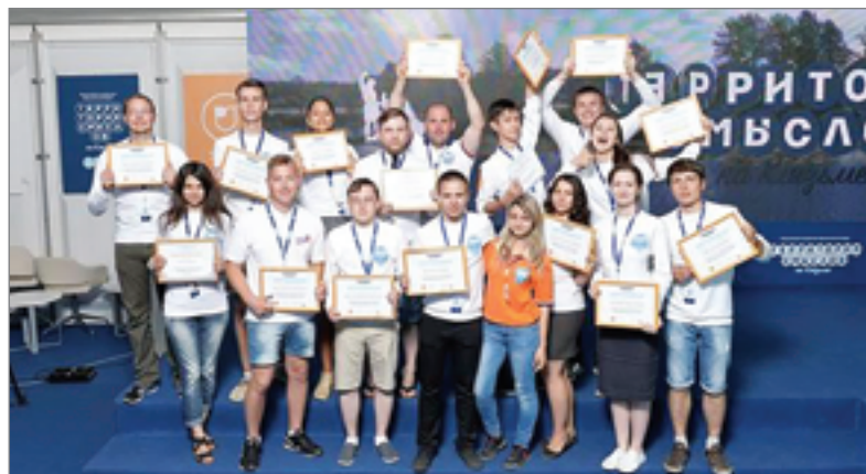
На официальном закрытии смены были представлены авторы лучших идей «Конвейера проектов»

Организаторами форума «Территория смыслов на Клязьме» выступают Федеральное агентство по делам молодежи, Общественная палата Российской Федерации, «Роспатриотцентр» Росмолодежи. Форум проходит при кураторстве Управления Президента РФ по внутренней политике.