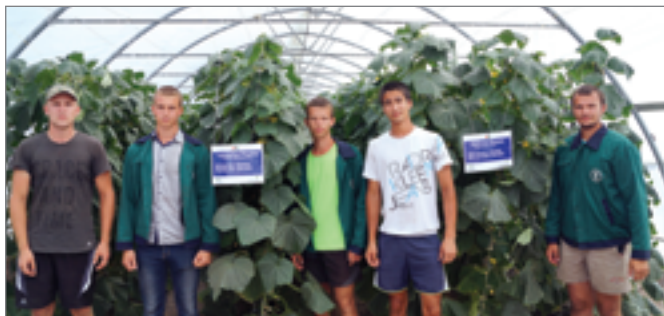
Бойцам студенческих отрядов агротехнологического факультета довелось принять участие в севе яровой пшеницы, нута, сои, кукурузы, подсолнечника, химической обработке сельскохозяйственных культур

По итогам соревнований ребятам вручили грамоты и памятные подарки.