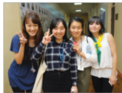
Участников конференции встречали и сопровождали волонтеры Волгоградского ГАУ

Волгоградский государственный аграрный университет регулярно принимает в своих стенах иностранных гостей. Ежегодно делегации из Абхазии, Ирана, Сербии,