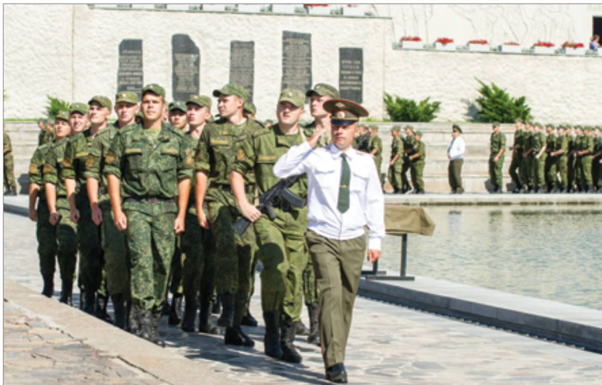
За 48 лет работы военная кафедра подготовила более 14000 офицеров-артиллеристов для ракетных войск и артиллерии Сухопутных войск Вооруженных Сил РФ