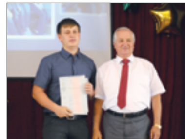
В этом году документы о высшем образовании получили 90 выпускников очного отделения экономического факультета по направлению подготовки «Менеджмент»