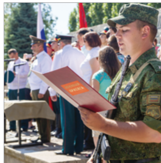
Выпускники единственной в регионе военной кафедры собрались на Мамаевом кургане, чтобы в присутствии преподавателей, родителей и близких друзей принести клятву верности Родине