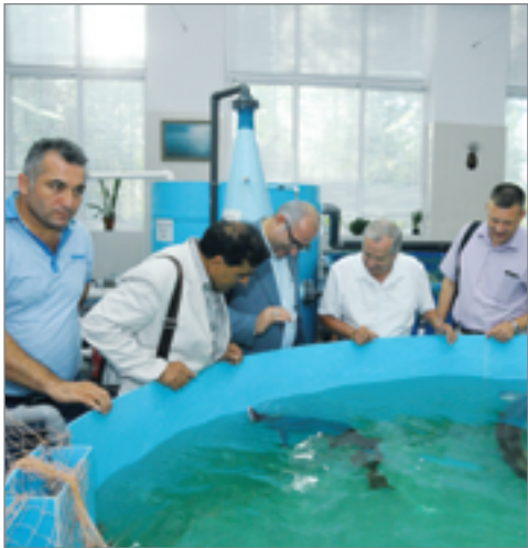
Представители иранской делегации знакомятся с технологией содержания и разведения осетровых

23 августа представители торгово-промышленной палаты провинции Мазендеран посетили университет. Развитие и укрепление международного сотрудничества, знакомство с инвестиционным потенциалом вуза, обсуждение перспектив экономического взаимодействия на территории Волгоградской области – таковы основные цели встречи. Гости высоко оценили последние достижения ученых университета, побывали на опытных полях и в научных лабораториях.