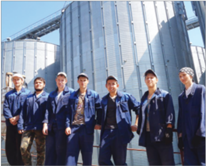
Студенческий отряд «Норд» уже второй год трудится на Панфиловском элеваторе Новоаннинского района

– У нас очень талантливая молодежь, и на какие бы мы их объекты не ставили, везде получаем хорошие результаты. Стройотрядовское движение в Волгоградском ГАУ существует давно. Это не только отряды энергетиков, но и механизированные, строительные, сельскохозяйственные. Всего около 100 базовых хозяйств различного направления – животноводческие, растениеводческие, перерабатывающие, где наши ребята закрепляют теоретические знания на практике. В дальнейшем получают грамотные специалисты.