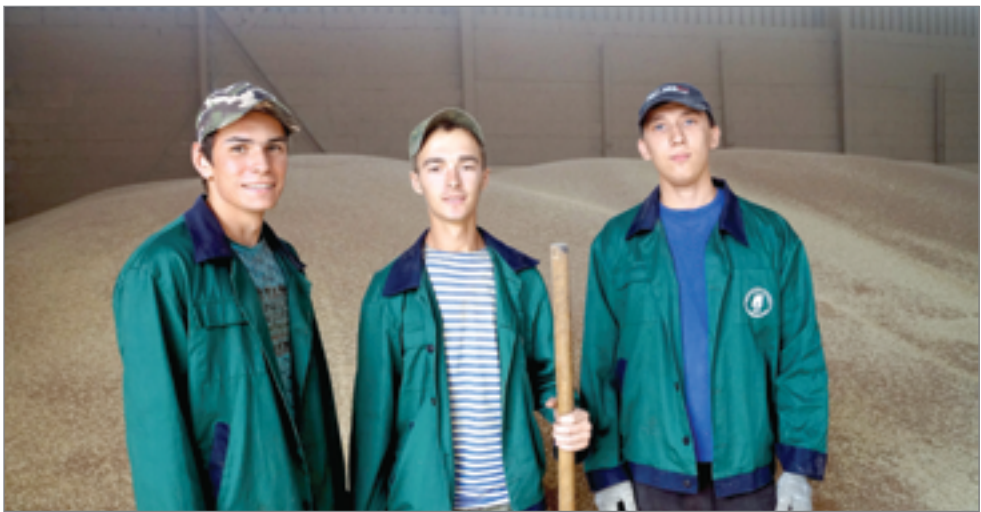
Будущие экономисты, бухгалтеры и менеджеры познакомились с производственным процессом

Будущие экономисты, бухгалтеры и менеджеры провели лето с пользой. Бойцы студенческих отрядов на практике закрепили знания, полученные в стенах университета. Узнать об этапах производственного процесса, понять особенности будущей профессии, познакомиться с опытными экспертами – таковы возможности, которые открылись перед ребятами в летнем трудовом семестре.