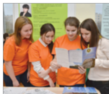
Волгоградский ГАУ – отличный карьерный старт

Волгоградский государственный аграрный университет является базой «кузницей кадров» для агропромышленного комплекса Волгоградской области. Начиная с 1944 года – времени своего основания – вузом подготовлено несколько поколений специалистов и руководителей АПК. Сегодня ФГБОУ ВО «Волгоградский государственный аграрный университет» по праву считается одним из крупнейших научно-образовательных центров Волгоградской области и Южного федерального округа.