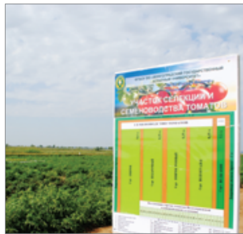
В ближайшие годы к исключительным вкусовым качествам волгоградских томатов добавятся устойчивость к заболеваниям и сохранность при транспортировке, которые позволят успешно конкурировать с импортными аналогами

ны на выездном совещании «Перспективы развития отрасли овощеводства в Волгоградской области». В то время как перед регионом стоит задача восстановления статуса всероссийского лидера по производству томатов, капусты, лука, а также расширение многообразия сельскохозяйственных культур, надежной опорой станут исследования сотрудников университета. Рациональное использование ресурсов, применение новейших технологий, разработок селекционеров – усилиями ученых-аграриев будет создана база, которая позволит сельхозпроизводителям достигнуть высоких показателей.