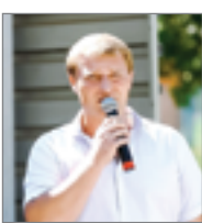
Участники торжественного закрытия летнего трудового семестра на полигоне ПАО «МРСК Юга»

ным соревнованиям по обучению, отработке навыков и проведению практических занятий по тематике электробезопасности. Главными противниками стали команда студенческого отряда «Электрон» Волгоградского ГАУ и сборная Волжского филиала НИУ МЭИ. Ребятам предстояло сразиться не только в спортивных мероприятиях, но также продемонстрировать интеллектуальные способности и умение быстро реагировать в стрессовой ситуации.