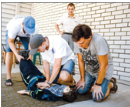
Будущие энергетики должны в совершенстве владеть умением оказания первой медицинской помощи

На территории учебно-производственного полигона ПАО «МРСК Юга» был дан старт производствен-