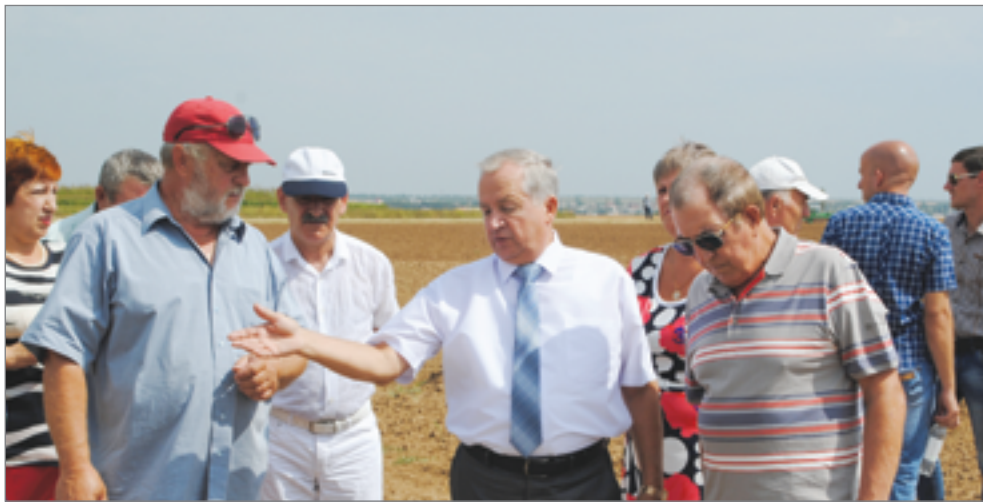
Участники конференции обсуждают перспективы применения технологии фертигации на опытном поле