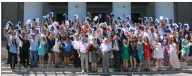
В 2016 году выпускниками старейшего факультета Волгоградского ГАУ стали 194 молодых специалиста

В Волгоградском государственном аграрном университете состоялись торжественные вручения документов о высшем образовании. Первыми заветные «корочки» получили выпускники агротехнологического факультета. По традиции разделить радостные моменты праздника пришли родители и друзья виновников торжества.