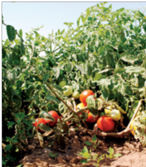
Волгоградские томаты первой селекции

4 августа в УНПЦ «Горная поляна» состоялся научный семинар. Фермеры, агрономы овощеводческих хозяйств и исследователи практики обсудили преимущества перспективной технологии и возможности ее применения в Волгоградской области.