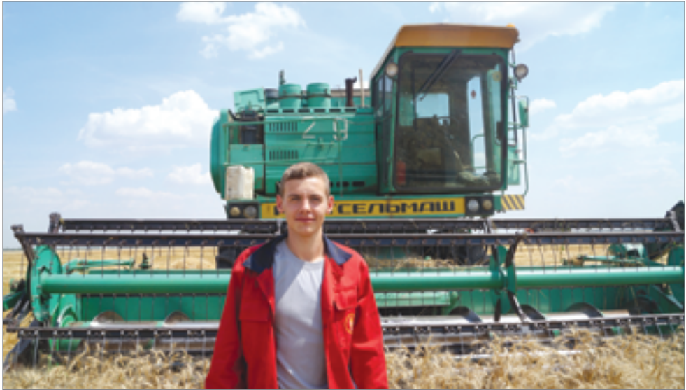
В течение летнего трудового семестра студенты-механики ремонтировали сельскохозяйственные машины, работали в мастерских, а также в поле на комбайнах