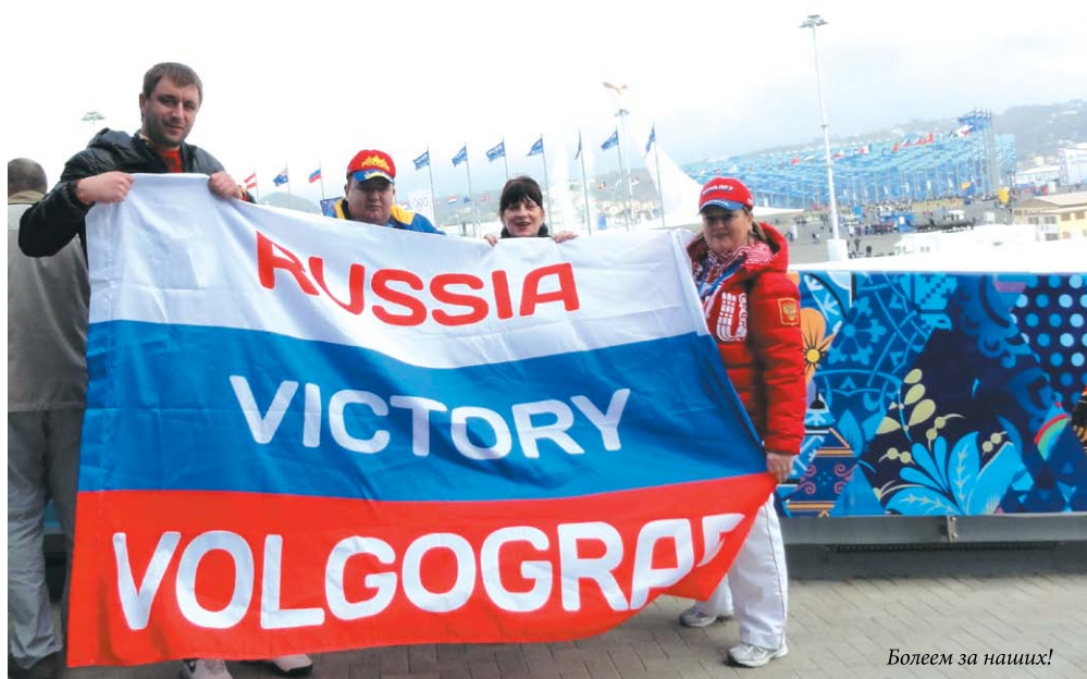
Болеем за наших!

Этого момента я ждала очень долго. Когда объявили, что город Сочи выбран столицей Зимних Олимпийских игр, казалось, что до далекого 2014 года – целая вечность... И вот это время настало.