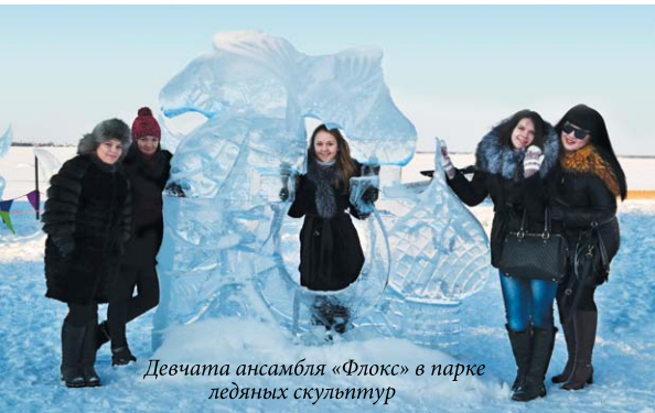
Девчата ансамбля «Флокс» в парке ледяных скульптур

С 19 по 23 февраля Архангельск – бело-снежный город дивных ветров встречал многочисленных участников ежегодного фестиваля творческой молодежи городов воинской славы и городов-героев России «Помним. Гордимся. Верим», в котором приняли участие студенты Волгоградского ГАУ.