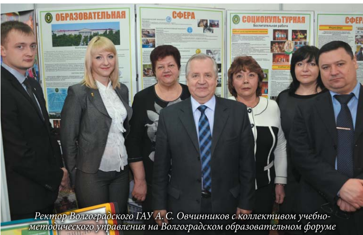
Ректор Волгоградского ГАУ А.С. Овчинников с коллективом учебно-методического управления на Волгоградском образовательном форуме

Волгоградский ГАУ занял второе место на крупнейшем региональном специализированном форуме «Образование-2014». Диплом вручил министр образования и науки Волгоградской области А.М. Коротков.